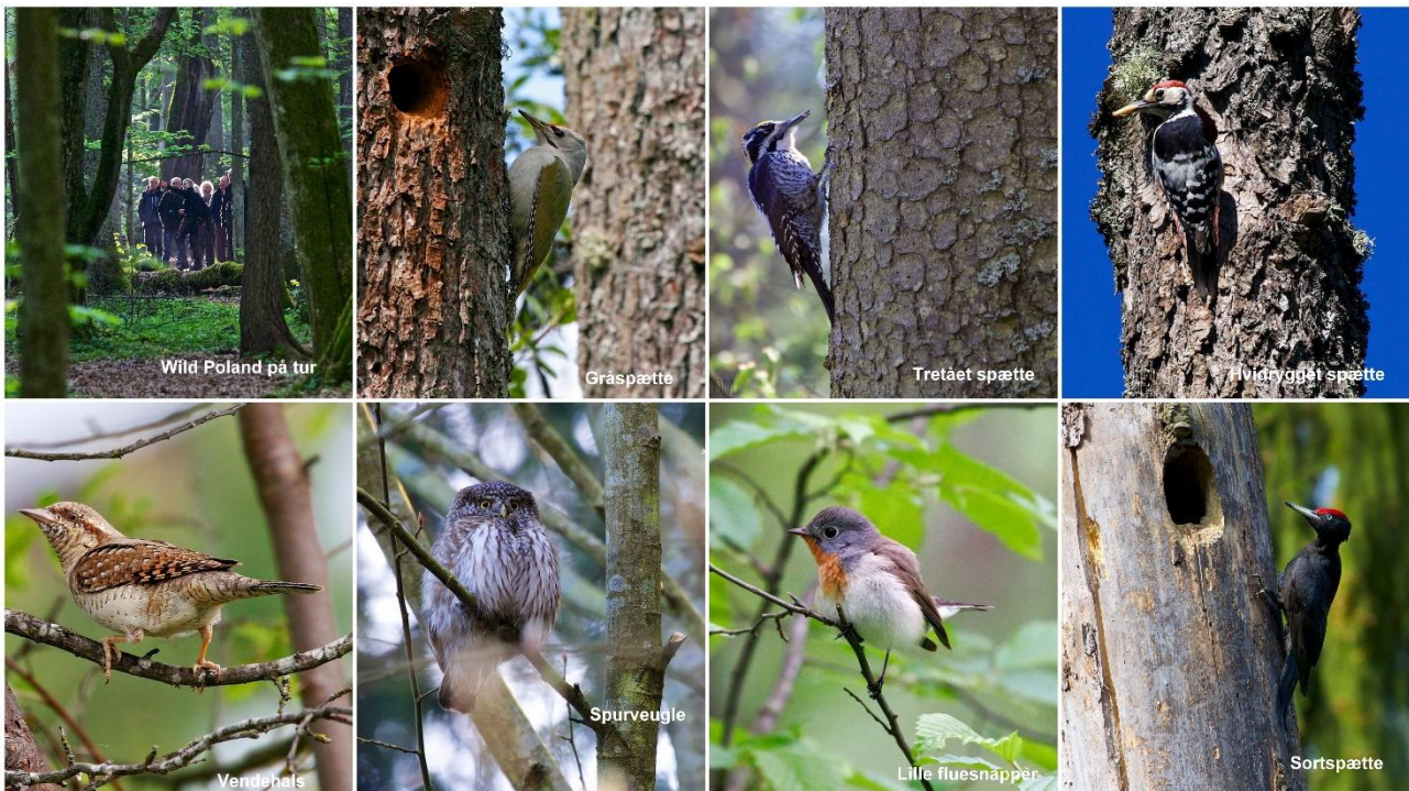
Fugle fra skoven