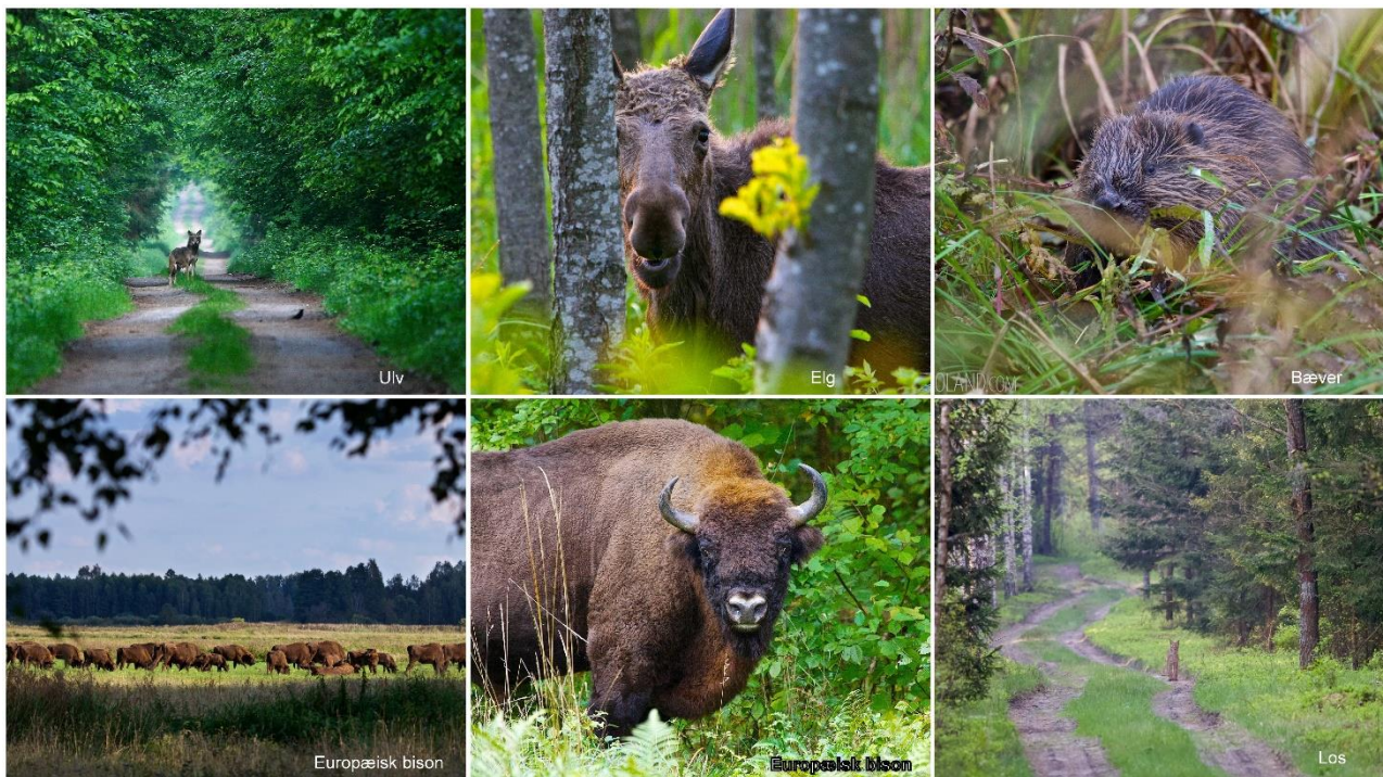
Billeder fra skoven

Vi vil også besøge åbne områder nær skoven, hvor der dels er flere arter sangere, bl.a. Høgesanger, og dels mulighed for at se nogle af de lokale ynglende rovfugle – bl.a. Lille skrigeørn.