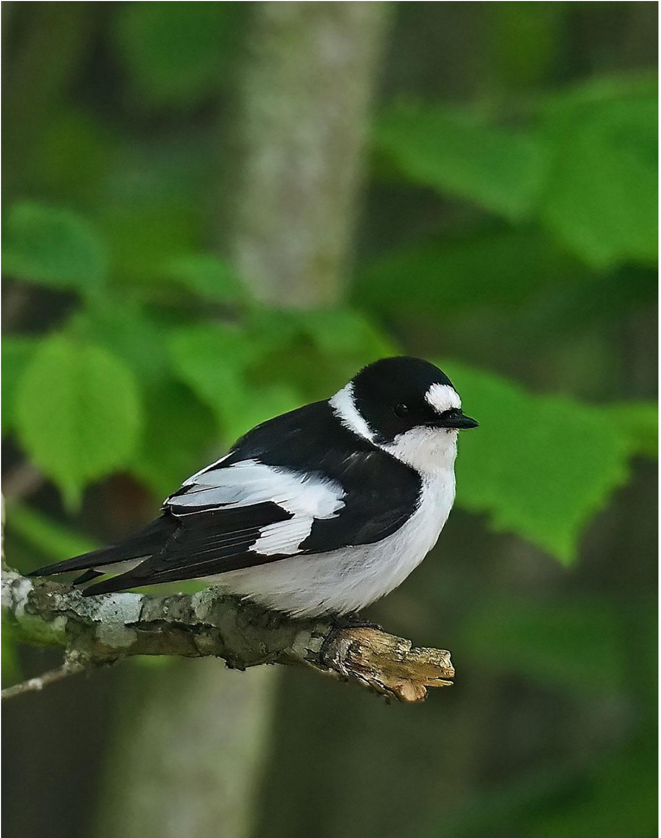
Hvidhalset Fluesnapper er netop ankommet, når vi rejser til det nordøstlige Polen. Skoven vil derfor stadig være nyudsprungen og fuglene derfor nemme at se.