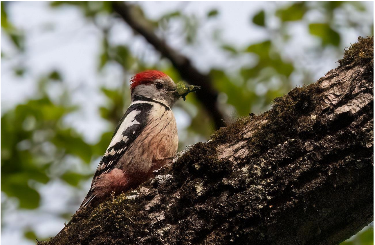
Mellemspætte – en af de mange fine spættearter vi kan se på rejsen.