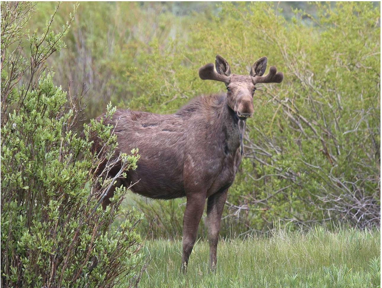
Biebza-sumpene huser en fin bestand af Elg.