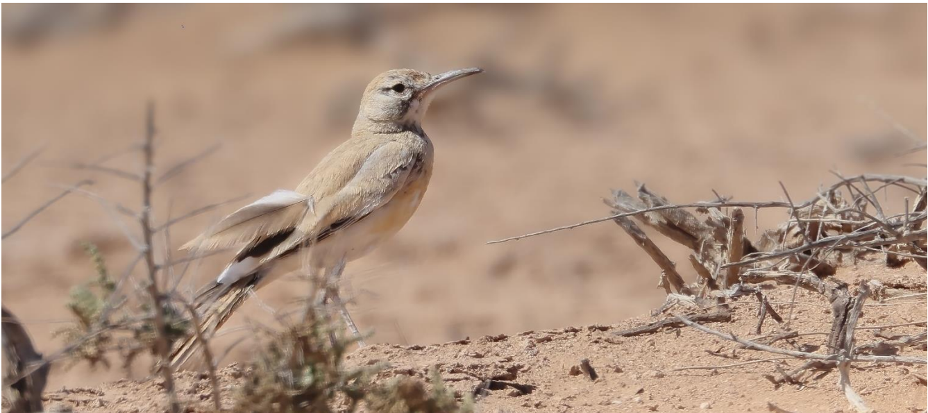
Billede 7: Hærfuglelærke

Vi fortsatte herefter mod Fask ad den lille vej, og endnu engang blev chaufførerne udfordret af GPS'en, der ikke helt stemte overens med virkelighedens vejføring. Netop da situationen så mest besværlig ud, og vi stod uden for busserne for at vurdere ruten, dukkede endnu en Hærfuglelærke op – perfekt timing, og til stor begejstring. Til sidst lykkedes det chaufførerne at finde en brugbar vej ud, og selvom det havde kostet lidt kræfter for både dem og os, kunne vi glæde os over flere flotte Hvidkronet stenpikkere, Ørkenstenpikkere og Berberstenpikkere langs ruten.