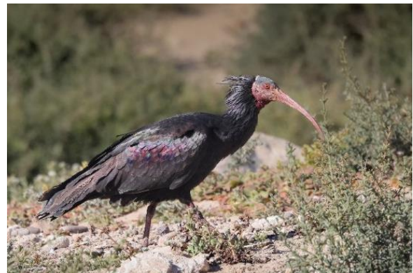
Billede 19: Eremitibis

Uden den helt store konkurrence blev dagens fugl Eremitibis.