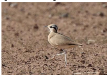
Billede 8: Ørkenløber

Inden aftensmaden blev der tid til en kort tur omkring hotellet, hvor Triel og Rødstjert kom på som nye turarter, sammen med en flot Hvid vipstjert. Desværre kunne ingen af dem bestemmes til den særlige marokkanske race subpersonata . Middagen blev igen indtaget på hotellet, hvor personalet denne aften – trods ramadanen – venligt havde sørget for øl og vin til maden. Dagens fugl blev efter afstemning Ørkenløber.