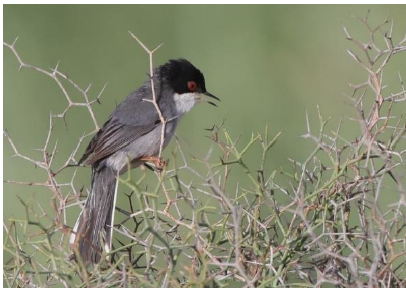
Billede 1: Sorthovedet sanger

Det næste stop inden Guelmim blev holdt ved den lille by Ifentar langs Massafloren – et område vi skulle udforske grundigere senere på ugen. Det korte ophold viste sig at være mere givende end håbet. Der gik ikke længe før den første Diademrødstjert viste sig flot frem i solen lige ved siden af de parkerede busser. Efter en lang dansk vinter blev vi hurtigt overvældet af de mange syngende fugle omkring os. Cistussanger, Cettisanger, Sorthovedet sanger, Gulirisk, Gærdeværpling og Berberbulbul gjorde alle deres for at byde os velkommen og sætte stemningen for de mange oplevelser, der ventede.