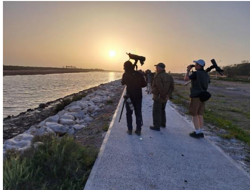
Billede 30: Sous dalen

Denne morgen stod solen anderledes end aftenen før. Det, der dagen inden havde ligget i modlys, lå nu i et varmt medlys, og det gav straks nye forhåbninger. Måske gemte der sig stadig et par nye arter til vores efterhånden lange liste.