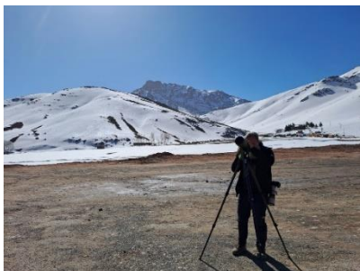
Billede 21: Der spejdes

Vi fortsatte længere ind i området, men sneen satte efterhånden en naturlig grænse for, hvor langt vi kunne komme. Gruppen blev derfor kortvarigt delt; nogle trodsede sneen og fortsatte op over bjergtinden, mens andre begyndte at bevæge sig tilbage. Ved gensamlingen viste det sig, at observationerne stort set havde været de samme – bortset fra en enkelt klippesvale til dem, der havde gået længst frem.