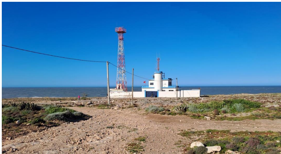
Billede 17: Cap Ghir

Første stop var Cap Ghir, hvor forventningerne til havobs var store. En berberfalk kom hurtigt forbi på jagt, men forsvandt næsten lige så hurtigt igen. Vinden viste sig dog at være en afgørende faktor; en ret kraftig nordvestlig vind betød, at de fleste havfugle holdt sig langt ude, og kun enkelte kjoever kunne skimtes som små prikker i horisonten. Til gengæld kom flere suler tættere på, og især audouinsmågerne gav gode observationer, da de trak forbi i fin afstand. Efter omkring en halv time blev vi dog nødt til at forlade området, da det viste sig at være overtaget af militæret.