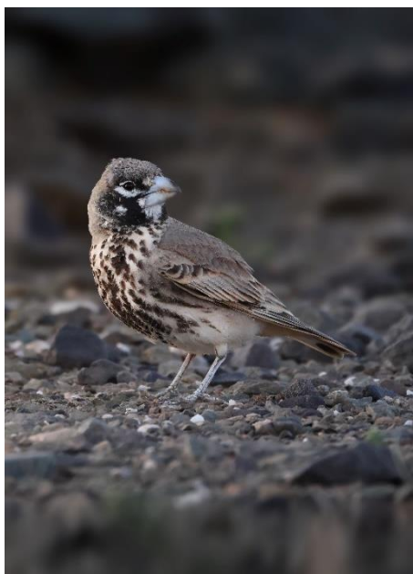
Billede 13+14: Tyknæbbet lærke Venstre: hannen - Højre: hunnen

Ørkenbjerglærke løb fortjent med sejren — men det blev uhyre tæt mellem den og Tyknæbbet lærke.