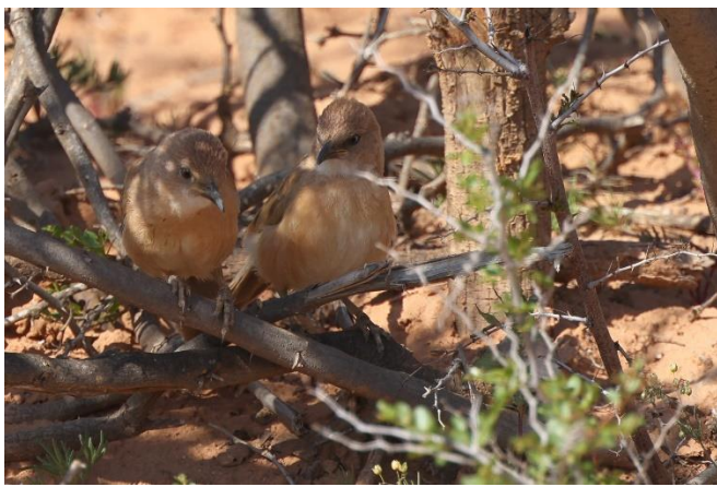
Billede 4: Gulbrun larmdrossel

Derefter fulgte en række nye arter i et jævnt tempo: Stenpikker (den "almindelige"), Brillesanger, Sorthovedet sanger, Iberisk sanger og Diademrødstjert hoppede rundt i krattene, mens en Vagtel sang i baggrunden. Kort efter fandt vi en flok på seks Gulbrun larmdrossel, der holdt til i et af de mange krat. Da de fleste af os var begyndt at vende om for at gå imod busserne igen lød der pludselig et begejstret råb om Berbersanger, og vi for alle tilbage mod den entusiastiske stemme. Berbersangeren viste sig heldigvis fremragende for hele gruppen. Med endnu en targetart i hus kunne vi glade og tilfredse gå tilbage til busserne og fortsætte ad den lille vej mod Fask.