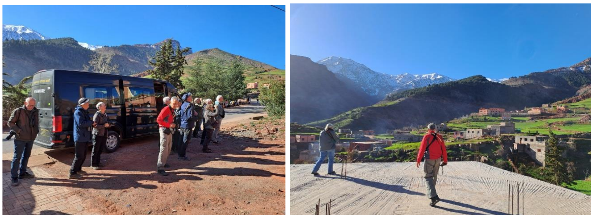
Billede 20+21: Et stop på vejen op til Oukaïmeden, som bl.a. gav Blådressel, stenspurvl mm

Kort efter fortsatte vi videre op gennem bjergene. Undervejs måtte vi flere steder sænke farten, da store maskiner var i gang med at udhugge klippestykker fra de stejle bjergvægge langs vejen. Arbejdet blev udført for at forhindre, at løse sten senere kunne brække af og falde ned på vejen – en tydelig påmindelse om de barske forhold i bjergene.