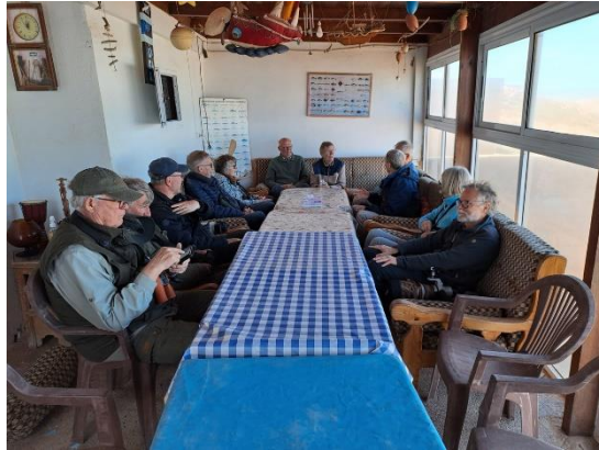
Billede 16: Frokosten i Sidi ifni

I Sidi Ifni parkerede vi ved den industrielle havn, hvor vi – ud over en lille fotovenlig Sørgestenpikker-familie – kunne tælle omkring 400 Sildemåger, 21 Audouinsmåger, flere Middelhavsmåger, Skarver og Splitterner rastende på stranden. Ude over havet trak Suler nordpå, men den hårde vind gjorde havfuglekigning vanskelig. Frokosten var arrangeret på forhånd ca. 30 minutter syd for Sidi Ifni i en lille surferby, hvor vi blev forkælet med den marokkanske specialitet tajine med kylling, efterfulgt af varm grøn myntete – yderst velkomment efter flere dage med brød, tun og ost.