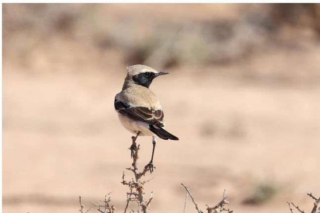
Billede 2: Ørkenstenpikker

Ørkenstenpikkere, Berberstenpikkere, Markpibere og Ørkendompap. Dertil kom også flere af turens gengangere som Theklalærker, Husværlinger og Hærfugle.