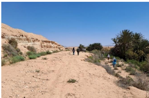
Billede 5+6: Frokosten blev indtaget omkring oasen og derefter gik vi i en tur langs.