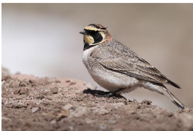
Billede 25: Atlas bjerglære – (Eremophila alpestris atlas)