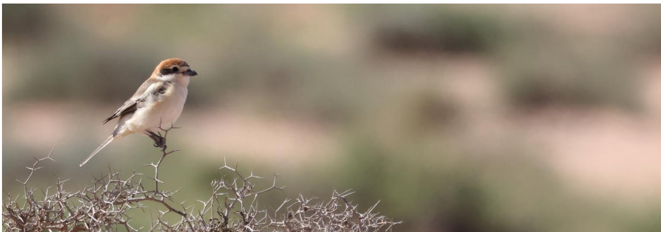
Billede 4: Rødhovedet tornskade

Næste stop kom efter en kort køretur gennem byen Asrir, hvor vi undervejs blandt andet så flere fine Hvidkronede stenpikkere og Hærfugle. Øst for Asrir bevægede vi os ind i et område præget af lave krat og endnu mere plastikaffald — ikke et sted man normalt ville stoppe for fuglekiggeri, hvis ikke tidligere observationer havde anbefalet det. Alligevel gik der ikke længe, før flere flotte Rødhovedet tornskader viste sig som dagens første højdepunkt.