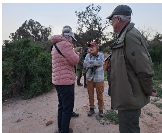
Billede 29: Vi venter på Rødhalsset natravn