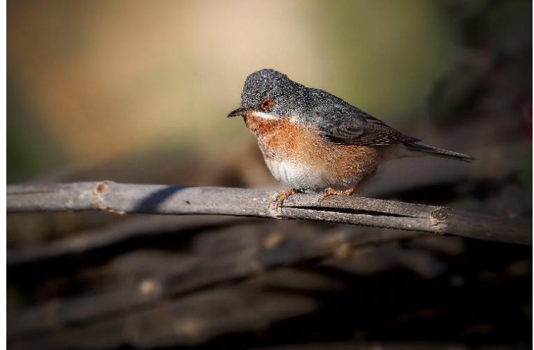
Billede 11: Hvidskægget sanger/ Iberisk sanger

På vej tilbage mod Guelmim holdt vi et stop ved Oued Boukila. Her begyndte vi med at tælle Gulbrun larmdrossel, Lille præstekrave, Svaleklire og fire Rustænder i floden øst for vejen. Derefter fortsatte vi vestpå langs Oued'en for at lede efter fugle i krattene. Terrænet var besværligt at færdes i, og nogle valgte at gå tilbage til bilerne, da der virkede lidt fugletomt. Dem der kom længst ud, blev dog til gengæld belønnet med både en Mestersanger og en Sydlig nattergal, der gemte sig godt i vegetationen. Foruden de nye observationer fik vi også set flere af "the usual suspects": Diademrødstjert, Iberisk sanger, Ørkendompap, Cistussanger, Rødhovedet tornskade og Hærfugl.