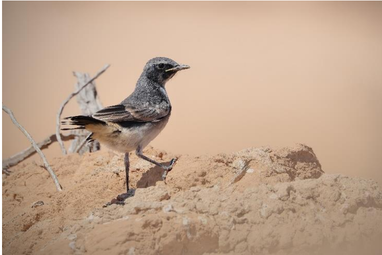
Billede 10: Berberstenpikker

Frokosten blev indtaget lige syd for lærkestedet, og mens vi nød maden i det varme solskin, kunne vi samtidig glæde os over Ørkendompapper, Ørken- og Berberstenpikkere samt Iberisk sanger og Brilllesanger i krattene omkring os.