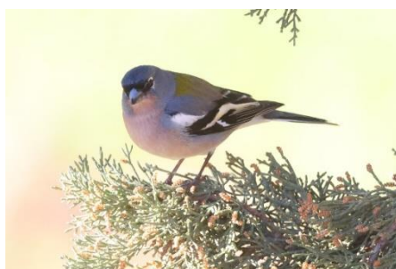
Billede 22: Afrikansk bogfinke