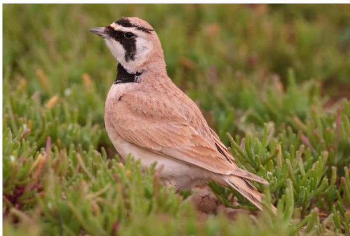
Billede 9: Ørkenbjerglærke

På tidligere ture var flere af områdets særlige lærker blevet set netop her, og forventningerne var derfor høje. Da vi steg ud af busserne, bemærkede vi straks resultatet af den usædvanligt våde vinter i Marokko: der var frodigt, grønt og græsbevokset så langt øjet rakte. Det stod hurtigt klart, at de små fugle ville blive svære at spotte mellem de tætte tuer. Området hedder på fransk Les Grandes Plaines – de store sletter, men vi blev hurtigt gjort opmærksomme på hvorfor stedet kaldes "lærkestedet". Over alt omkring os lød en næsten uendelig sang fra hundredvis af Korttået lærker, der fyldte luften med deres aktivitet. Vi bevægede os ud i området, og der gik ikke længe, før en deltager havde fundet en lærke, der skilte sig ud fra mængden. Med teleskopets hjælp kunne vi lykkeligt konstatere, at Ørkenbjerglærke kunne føjes til turens artsliste — en af turens mest eftertragtede target-arter. I alt fandt vi fem individer, som trippede rundt mellem græstuerne.