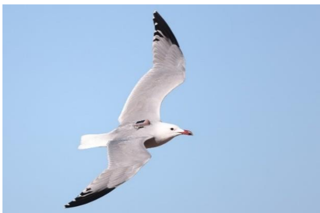
Billede 18: Audouinsmåge - bemærk senderen på ryggen

Kort efter gjorde vi et uventet og meget fint stop, da fem eremitibisser blev opdaget fouragerende langs vejen. De gav sig god tid, og vi fik derfor mulighed for at nyde dem ordentligt. Dagen fortsatte med endnu en mindre logistisk rocade, hvor vi igen måtte skifte køretøj, men også denne gang blev det håndteret med smil og en vis eventyrlyst, indtil vi kort efter blev samlet igen.