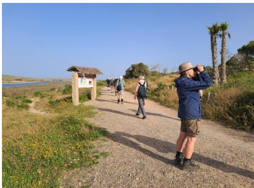
Billede 28: Massa