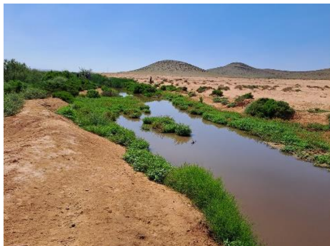
Billede 12: Oued Boukila

På vej tilbage mod Guelmim holdt vi et stop ved Oued Boukila. Her begyndte vi med at tælle Gulbrun larmdrossel, Lille præstekrave, Svaleklire og fire Rustænder i floden øst for vejen. Derefter fortsatte vi vestpå langs Oued'en for at lede efter fugle i krattene. Terrænet var besværligt at færdes i, og nogle valgte at gå tilbage til bilerne, da der virkede lidt fugletomt. Dem der kom længst ud, blev dog til gengæld belønnet med både en Mestersanger og en Sydlig nattergal, der gemte sig godt i vegetationen. Foruden de nye observationer fik vi også set flere af "the usual suspects": Diademrødstjert, Iberisk sanger, Ørkendompap, Cistussanger, Rødhovedet tornskade og Hærfugl.