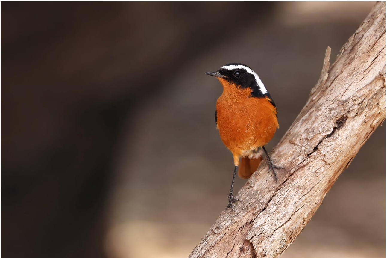
Billede 31: Diademrødstjert

Det er svært ikke at blive draget — og endnu sværere ikke at få lyst til at vende tilbage.