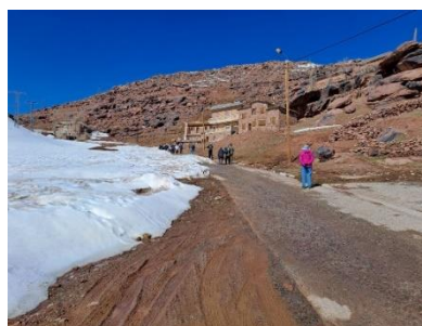
Billede 23: Sneen havde trukket sig lidt fra vejen