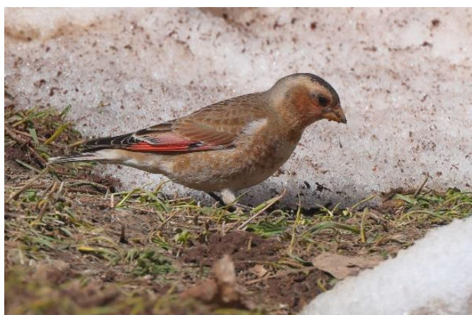
Billede 26: Afrikansk Karmosinfinke