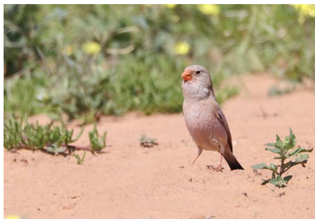
Billede 3: Ørkendompap

Allerede dagen før havde mange bemærket de store mængder affald, der lå spredt i landskabet, men ved dette stop blev det særlig tydeligt, hvor dominerende det var i denne del af landet. Efter et par forargede bemærkninger måtte vi dog konkludere, at der ikke var meget 22 danske fuglekiggere kunne stille op. I stedet begyndte vi at bruge de mange affaldsobjekter som pejlemærker for fuglene. En ensom, forladt skode midt i ingenting blev således udpeget som fikspunkt for et par Lille Ørkenlærker, der viste sig fint frem sammen med en gruppe Markpibere.