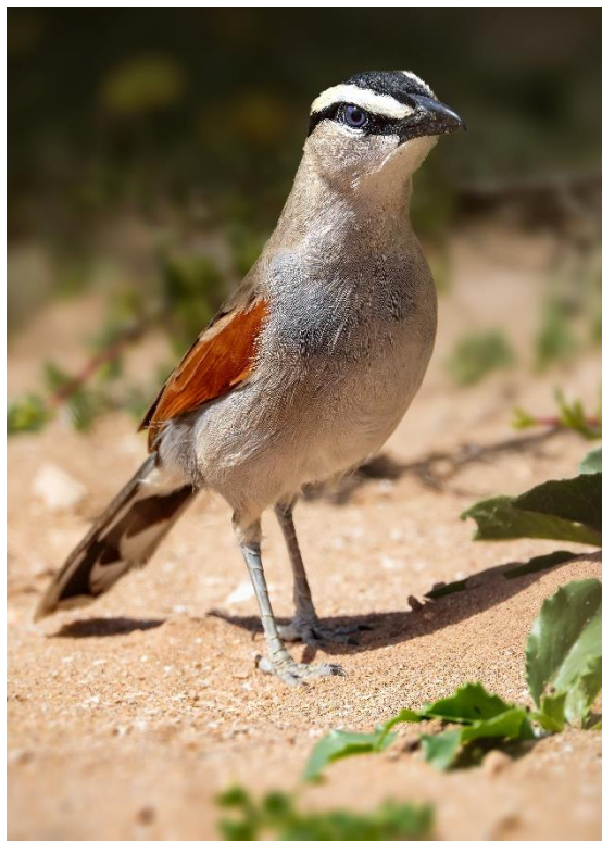
Billede 27: Sortkronet krattornskade

Med den oplevelse i bagagen vendte vi tilbage til hotellet – trætte, tilfredse og klar til hjemrejsen dagen efter. På trods af mange nye arter på vores sidste hele dag, blev dagens fugl meget fortjent kåret til Krattornskade.