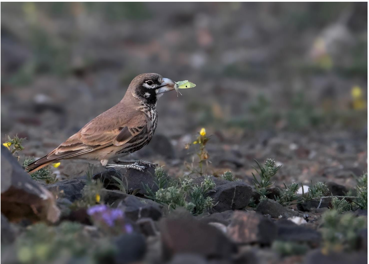
Billede 4: Tyknæbbet lærke med sommerfugle arten: Greenish black-tip

Aéroport International Agadir al-Massira, Sous-Massa-Draa, MA