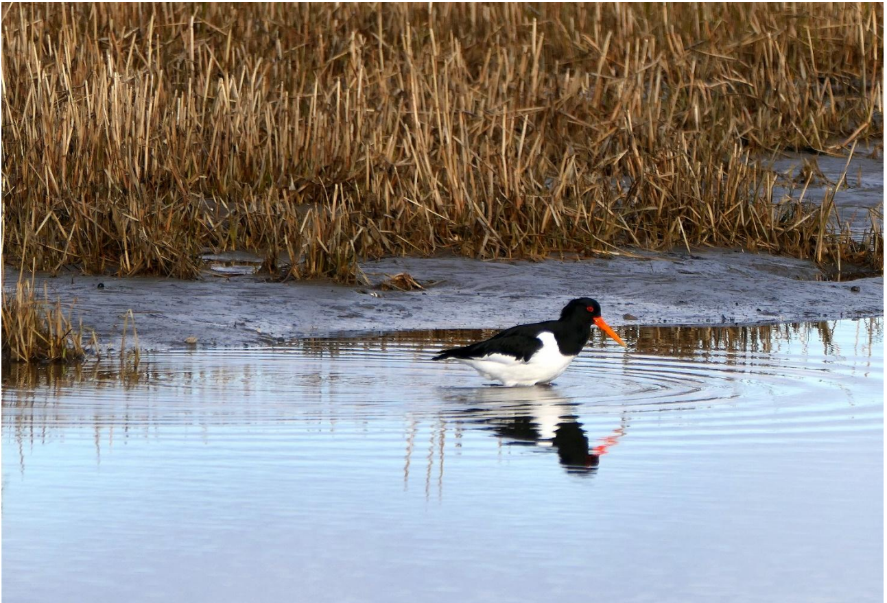
Starndskaden var karakterfugl på Mandø.

Frokost indkøbt i Brugsen, Skærbæk og hurtigt videre da vandstanden tillod en tur til Mandø som flere aldrig havde været på. Vejret grynede til og på Mandø fik vi både regn og blæst. Det blev dog til skestørke og spillende brushøns, men lang næse til sneppekliren, der ellers havde været på plads indtil et par dage før.