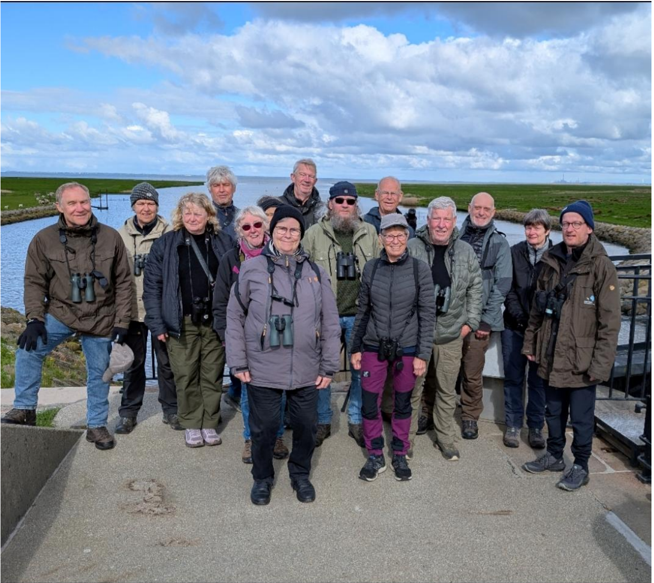
Glade deltagere ved Kammerslusen.