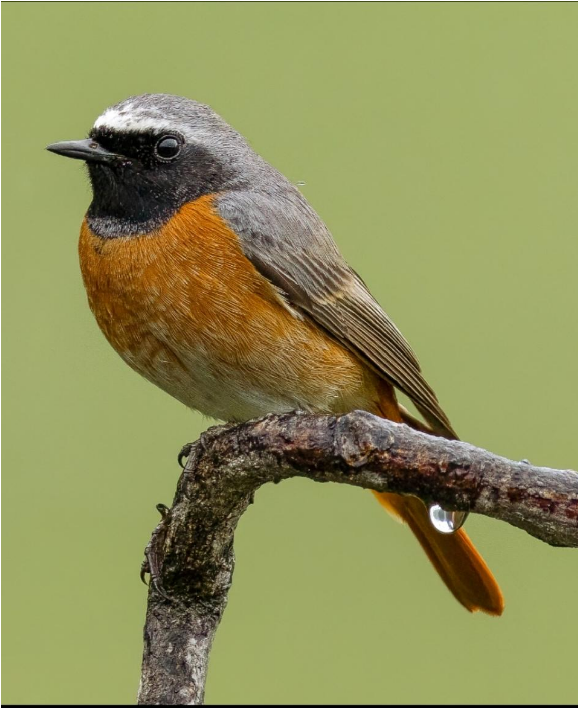
Rødstjert var almindelig i haven ved motel Rovli.

Aftensmåltid indtog vi på Brønskro, hvor schnitzler og øl var ret store, og dernæst til Randerup efter Slørugle. Det lykkedes for nogle at se den flyve ud ret sent, andre havde givet op og missede den under iø hyggelig småsnak. Trætte tilbage til motellet for natten.