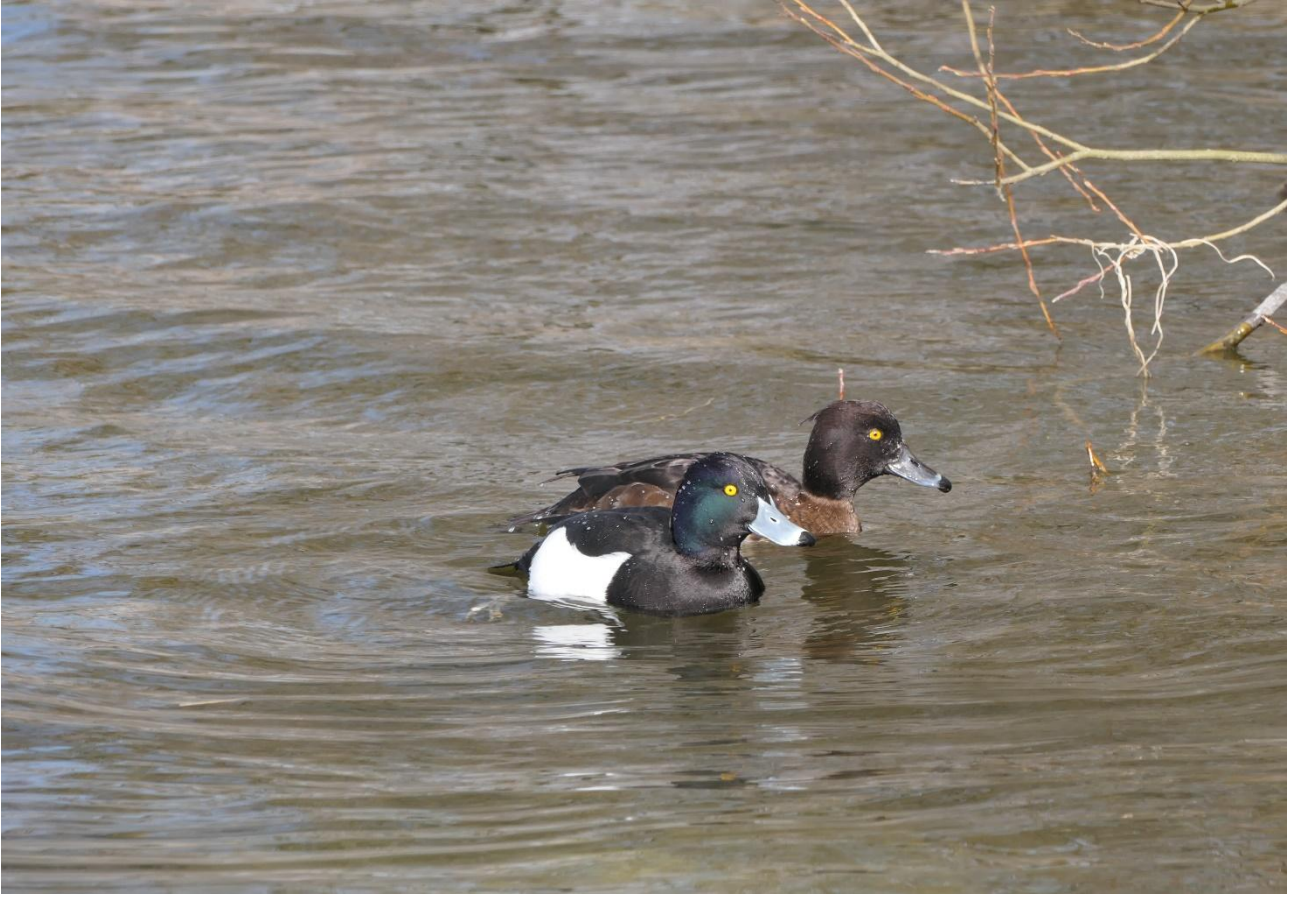
Troldand var en svær art på turen.