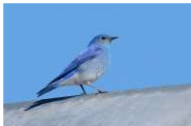
Mountain Bluebird