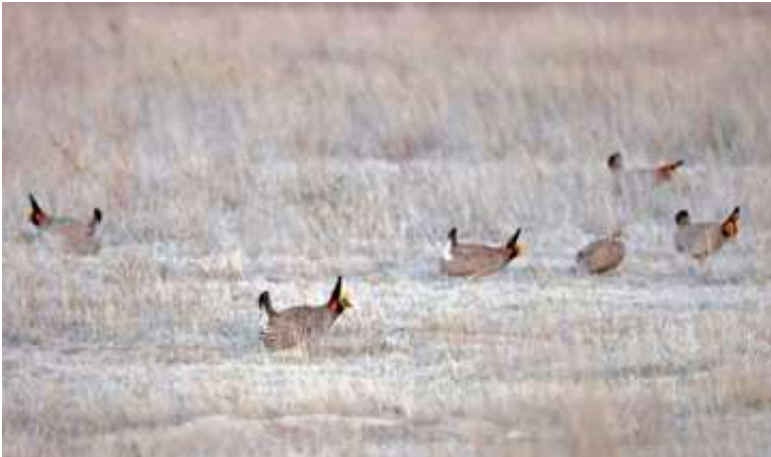
Greater Prairie-Chicken

fik set dem fint. Det var kun os, der var ude at se fuglene, så da solen var stået op, tillod vi os at stige ud af bussen for at kunne se dem i teleskope. Det var en virkelig fin opvisning under den opstigende sol, der også gav noget varme efter en kold morgen, hvor vi sad stille i de slukkede biler. Fuglene tog ingen notits af, at vi stod på vejen og kiggede på dem.