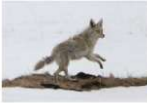
Grey wolf x coyote