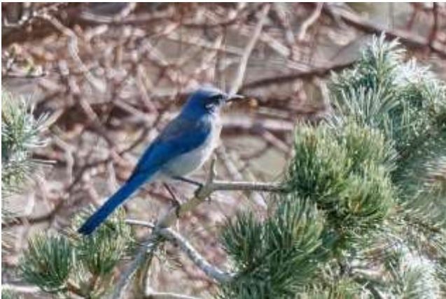
Woodhouse's Scrub-Jay

Første stop var ved Matthews/Winters Park [39.6945, -105.2045] på vej ned i det bak-kende lavland. Der var de første sangere og hummingbirds set i dagene inden vi kom, men dem fandt vi desværre ikke. Vi gik en rundtur på Village Walk her var der bl.a. White-throated Swift, Loggerhead Shirke, turens første Woodhouse's Scrub-Jay, House Wren (turens eneste) og Spotted Towhee.