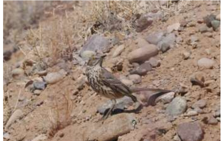
Scaled Quail og Curve-Billed Thrashers

Vi spiste frokost ved Colorado floden ved Spikebuck Recreation Site, hvor turens første Song Sparrow blev set samt Turkey Vulture og Red-tailed Hawk. Vi kørte videre over Monarch Pass og havde et kaffestop ved Monarch Mountain Ski Area [38.5124 - 106.3318], hvor der var både Canada Jay og Clark's Nutcracker på nært hold ved cafeen til stor glæde for alle - ikke mindst for fotografere, der næsten kunne røre og håndfodre fuglene.