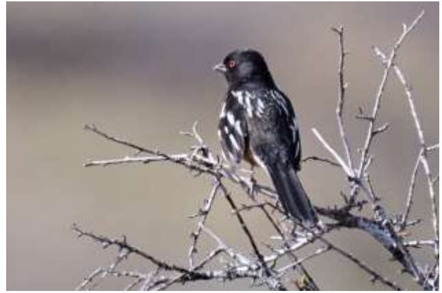
Spotted Towhee

Efter halvanden times tid kørte vi videre til Rocky Mountain Arsenal NWR - Lake Mary