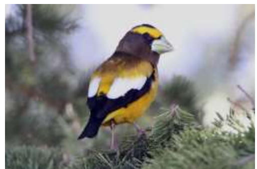
Evening Grosbeak

Området her var også fremragende til Sandhill Cranes, og på County Road 42, Steamboat Springs [40,515 -106,955] så vi en White-faced Ibis, American Snipe, American Harrier, Sharp-shinned Hawk og 3 Bald Eagle. Resten af dagen kørte vi nordpå mod Walden, et øde område i Colorado. I Steamboat Springs på Anglers Drive [40,47 -106,816], som er en klassisk småfugle lokalitet, spiste vi frokost i en hundefold, det kan ikke anbefales! I villaområdet så vi Red-naped Sapsucker,