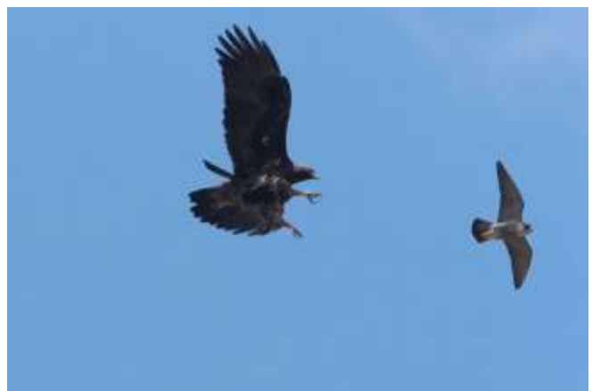
Golden Eagle og Peregrine

Resten af dagen brugte vi på forskellige lokaliteter på vej til Craig bl.a. Wetlands at Hwys 13 & 64 lige uden for Meeker. Her holdt vi en kaffe/is pause (gratis kaffe på tankstationen) og ved den lokale sø på den anden side af hovedvejen, var der Sandhill Crane, 2 Bald Eagle, 35 Ring-Necked Duck