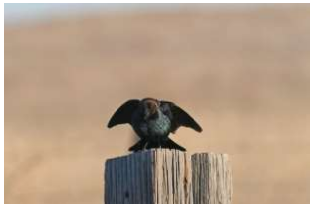
Brown-Headed Cowbird

Efter en rigtig god hjemmelavet morgenmad og udcheckning på hotellet fortsatte vi mod sydøst via Wray til Oakley i Kansas, med stop på forskellige lokaliteter undervejs. Første stop var ved Stalker Lake SWA [40.0840 -102.2734] med masser af forskellige ænder -