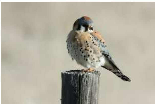
American Kestrel

På vej tilbage til hotellet blev der stoppet et par gange bl.a. for at se på småfugle, det blev til flere Greater Prairie-Chicken, Northern Flicker, American Kestrel, Loggerhead Shrike, Horned Lark, Vesper Sparrow, Western Meadowlark og Brown-Headed Cowbird, Yellow-headed Blackbird, en enkelt Coyote, der dog var langt ude i bakkerne, samt en del præriehunde.