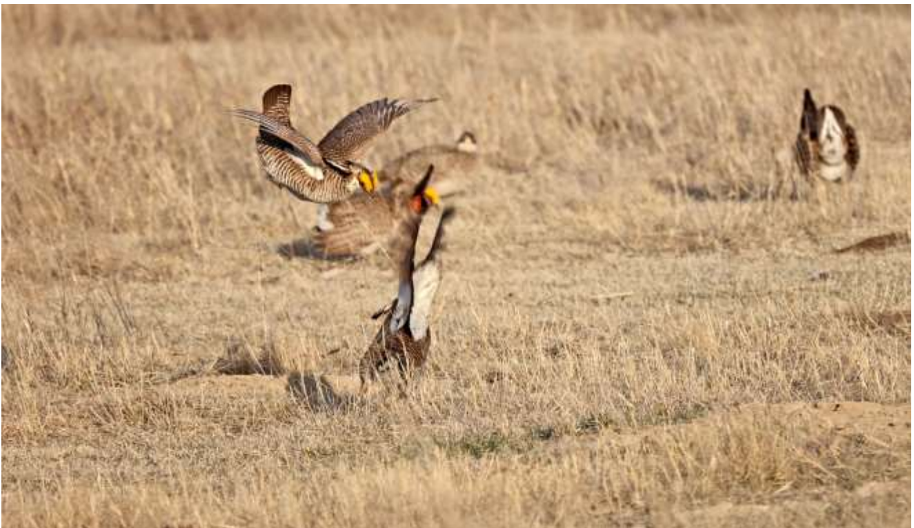
Greater Prairie-Chicken

Tidlig morgentur på prærien, mere præcist afgang kl. 05.15 i mørket for at se efter Greater Prairie-Chicken på Country Rd. 50 [40.3051 -103.4526]. Det er en af de mest vestlige spillepladser for Greater Prairie-Chicken, som vi havde fået anbefalet af Anders Bacher Nielsen, den kan også ses på eBird, og den er nem at findes selv. Mange fuglekiggere vælger at købe sig til adgang på en spilleplads længere mod øst omkring Wray, men det er ikke nødvendigt, for at kunne se og høre Greater Prairie-Chicken flot. Vi var på plads, inden det blev lyst, og allerede ved ankomst kunne vi høre, at de var i fuld gang med deres fantastiske lyde. Efterhånden som det blev lyst kunne vi se op til 12 fugle i spil på spillepladsen på omkring 100 meters afstand, ind mellem var de gemt i græsset, men alle