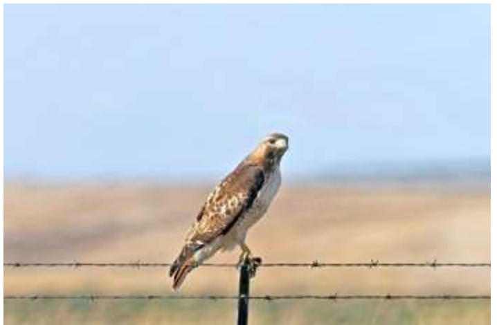
Red-tailed Hawk

Ankomst til Denver. Der var hurtig adgang igennem paskontrollen og kuffertudleveringen. Så var det bare at finde shuttlebussen til udlejningsbilerne og der var der forholdsvis hurtig udlevering. Deltagerne så i mellemtiden på fugle, og fandt blandt andet Golden Eagle, American Kestrel og Red-tailed Hawk.