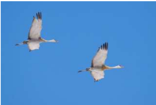
Sanderhill Crane

og en White-breasted Nuthatch i en lille lund. Dette område af Colorado er tyndt befolket og vi brugte ikke meget tid hvert sted, for vi skulle køre rigtigt langt denne dag. Det næstsidste stop blev en storslået opvisning af Golden Eagle i kamp med en