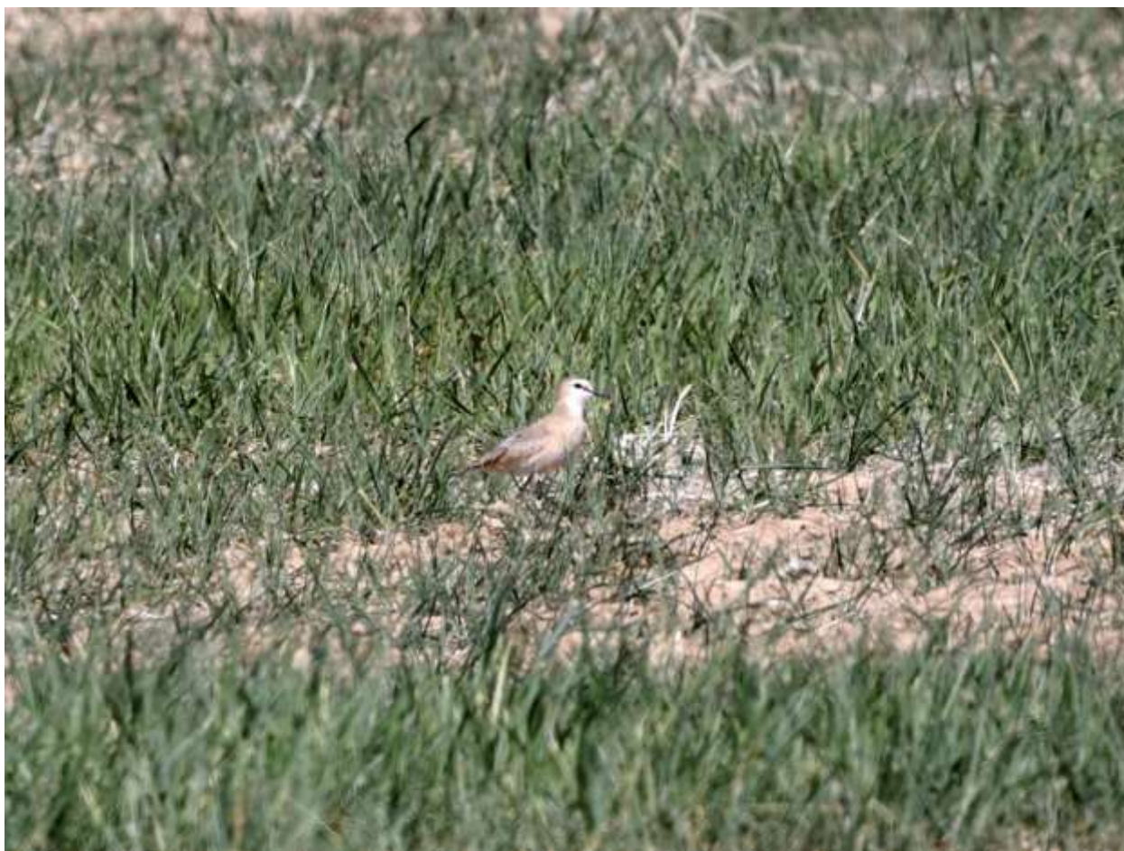
Mountain Plover

hovedvejen havde vi yderligere 2 Burrowing Owls. På markerne lige udenfor Karval på County Road 31, Karval, [38.722 -103.497], lykkedes det efter nogen søgen at finde to Mountain Plover,