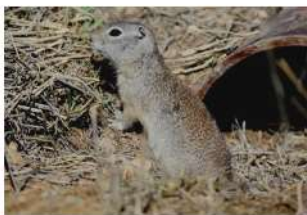
Uinta ground squirrel