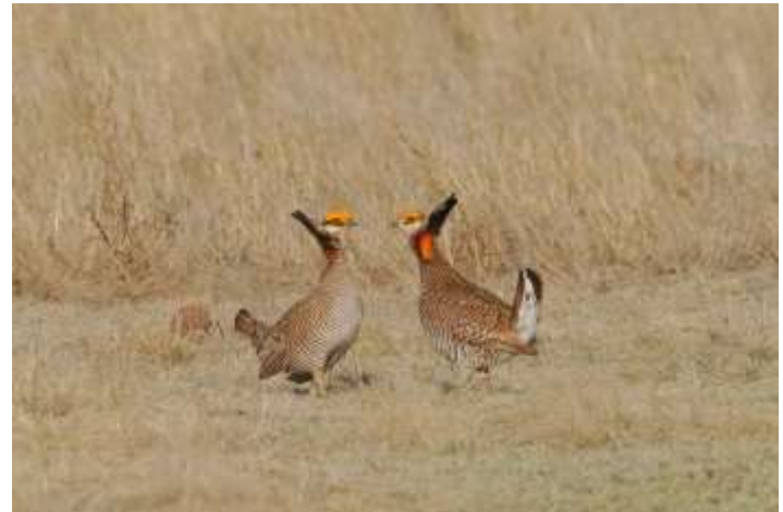
Lesser Prairie-Chicken

Efter en meget amerikansk morgenmad med bla. scones og sausage gravey alt sammen serveret af en meget venlig og imødekommende værtinde, der fik talt med hele selskabet, vendte vi tilbage til Colorado, hvor vi gennemsøgte kortgræsprærien. Der var vejarbejde på den hovedvej, vi havde planlagt at køre af, hvilket desværre ikke var vist på google maps, så vi blev sendt ud på en omkørsel på ikke mindre end 100 km, der er store afstande på prærien.