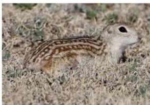
Thirteen-lined ground squirrel