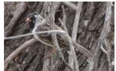
Harris's sparrow

Lige da vi ankom gik jagten ind efter den sjældne Harris's Sparrow, som havde været på lokalitet de sidste par dage og som fint var rapporteret på eBird, hvor vi havde fundet information om den. Det lykkedes, og vi så det fint og hørte den synge.