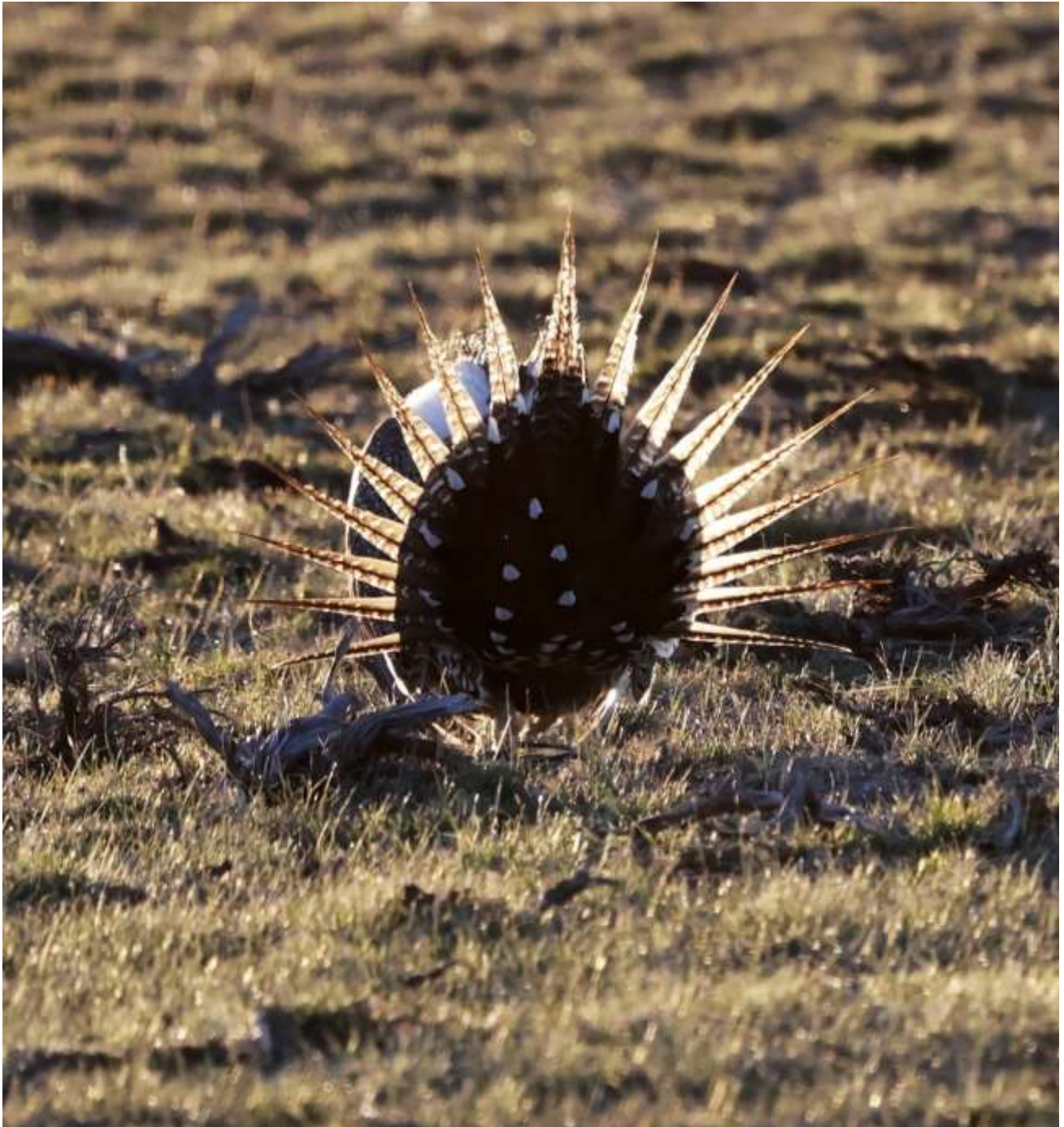
The end, © Morten Rasmussen