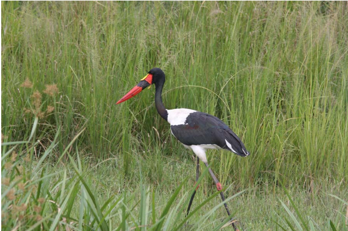
Man bliver aldrig træt af at se Saddle-billed Stork.