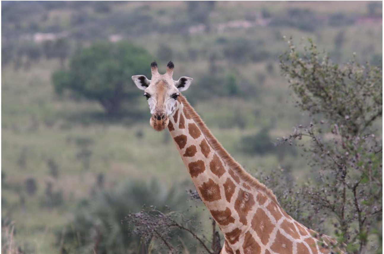
Halløj, du der. Det er mig med det store overblik.