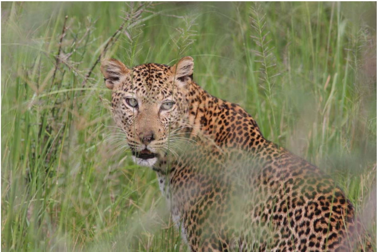
Leopard i Muchinson Falls NP.