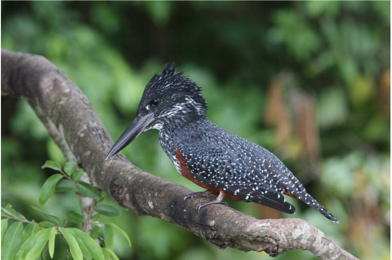
Giant Kingfisher (hun) – Murchison Falls.

Vi så 2 fugle i Murchison Falls henholdsvis den 11/9 og den 12/9, hvor sidstnævnte var en hun, som sås på tæt hold på flodturen.