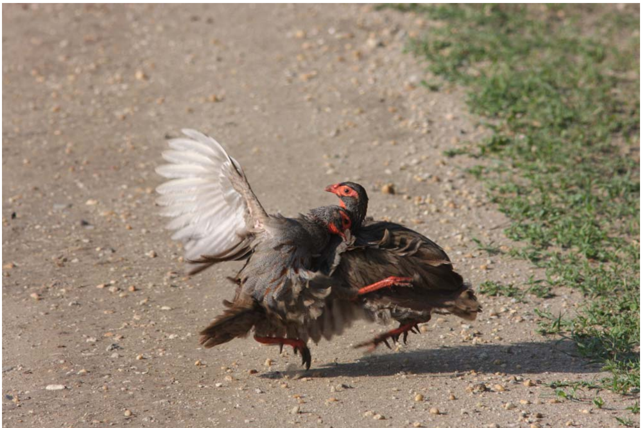
Der kæmpes om territoriet. Red-necked Spurfowl .

Meget almindelig i Queen Elisabeth NP med 105 fugle. Flest – 60 - sås den 28/9, da vi kørte tilbage til Kampala gennem Queen Elisabeth nationalpark, hvor vi skød en god fart på den lige vej til Kasese. Endvidere 2 fugle i Lake Mburo den 22/9.