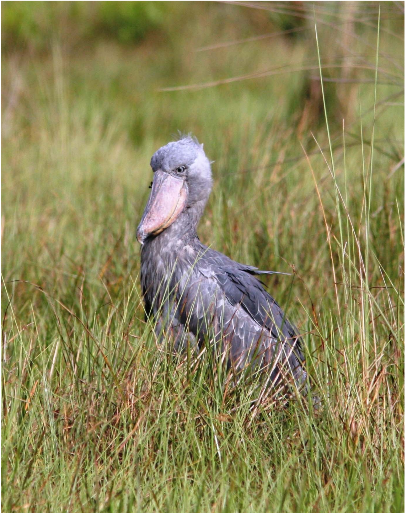
Så er det på med træskenen.