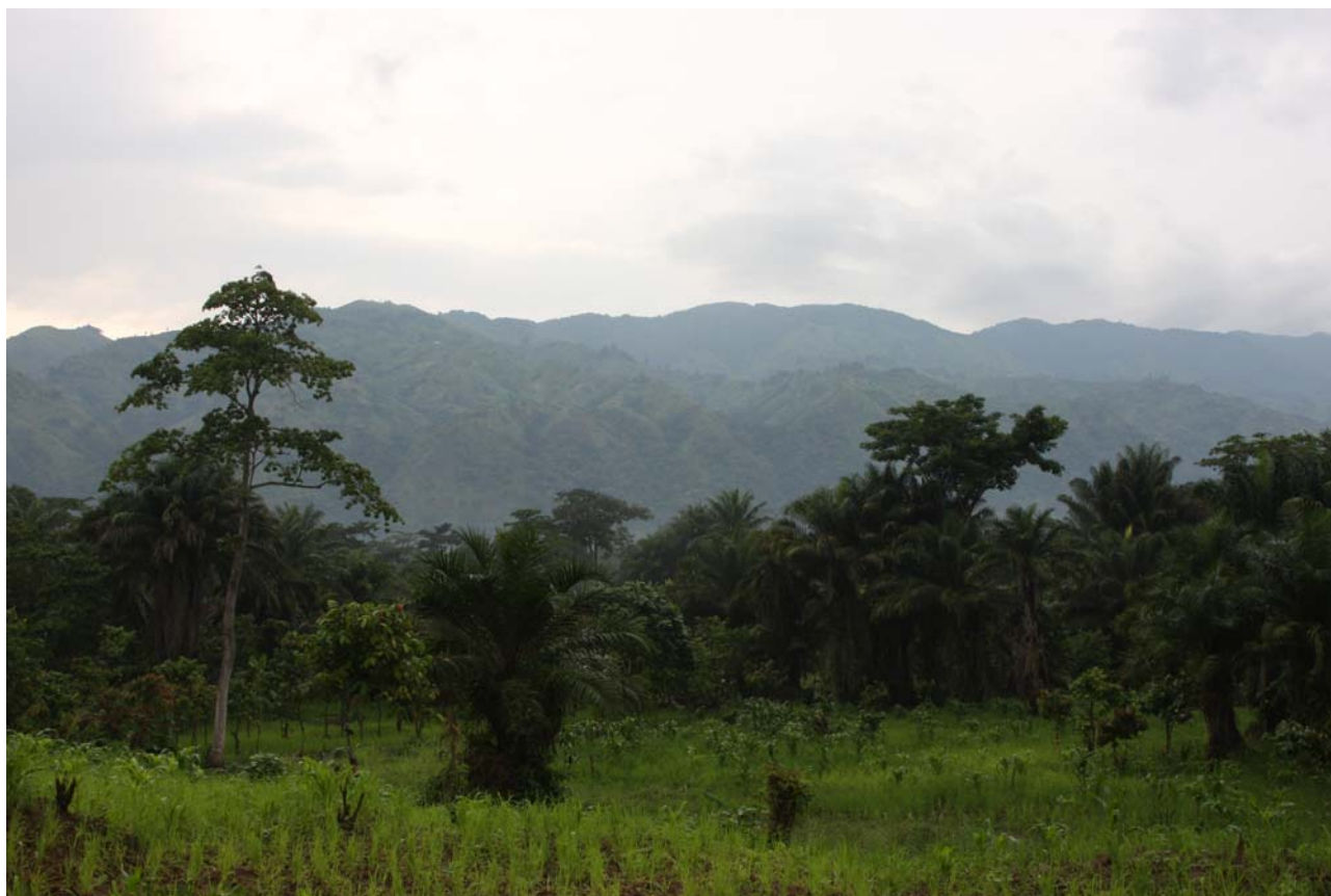
View over Semliki NP.

Langs traillet var der generelt få fugle. Alfred synes at det er den dårligste birding han har oplevet her. Årsagerne kan være mange, men følgende nævnes: 1) for tidlig regntid 2) ingen frugter 3) det har regnet mere i Sudan pga. global opvarmning – og dermed færre træfugle i Uganda. Men fakta er at vi – trods alt – har en alsidig fugleliste efter dagen, men problemet har nok været at vi har været topmotiveret og forventningsfulde i det fantastisk stille og solrige vejr. Hertil skal lægges – som beskrevet i fuglelokalitetsbogen – så kan birding i Semliki være frustrerende, da fuglene mere høres end ses. Dette forhold kan gruppen bekræfte. En skygge, en sangstrofe eller måske kun "røgen". Af flere højdepunkter fra dagen kan nævnes: Skrigende Crown Eagle svævende over skoven. Flere flotte Crested Malimbe, en fed Rufous-sided Broadbill i display, som absolut må være kandidat til en af turens højdepunkter. Vi går ikke hele Kirumia Trail. Pga. den fremskredne tid og flere forceringer af den oversvømmede sti, så vender vi om, da vi når til endnu et oversvømmet område, som ser ret ufremkommeligt ud. På tilbageturen begynder skyerne at trække op og det rumler i det fjerne. Vi slipper dog med lidt drypperier og vi kommer tørskoede tilbage til William og landroveren kl. 16.30.