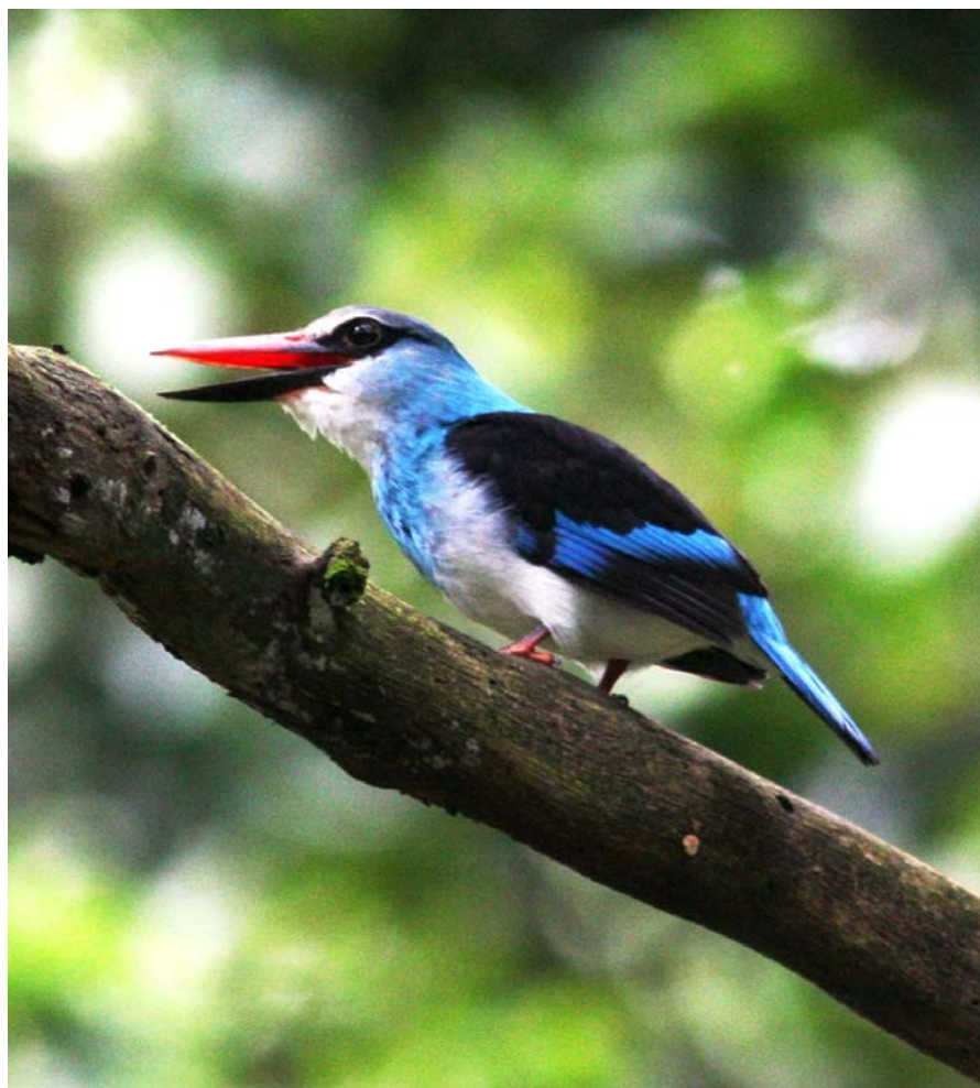
Blue-breasted Kingfisher.

Ses i den tætte skov, og vi noterede 8 fugle på 6 dage. Flest, med 3 eksemplarer, var den 16/9 Kibala NP. Vi så også en i Lake Mbuo NP, noget som Alfred specielt bemærkede, da den ikke tidligere fandtes i området. Men nu da skoven er ved at vokse sig højere, har den indfundet sig.