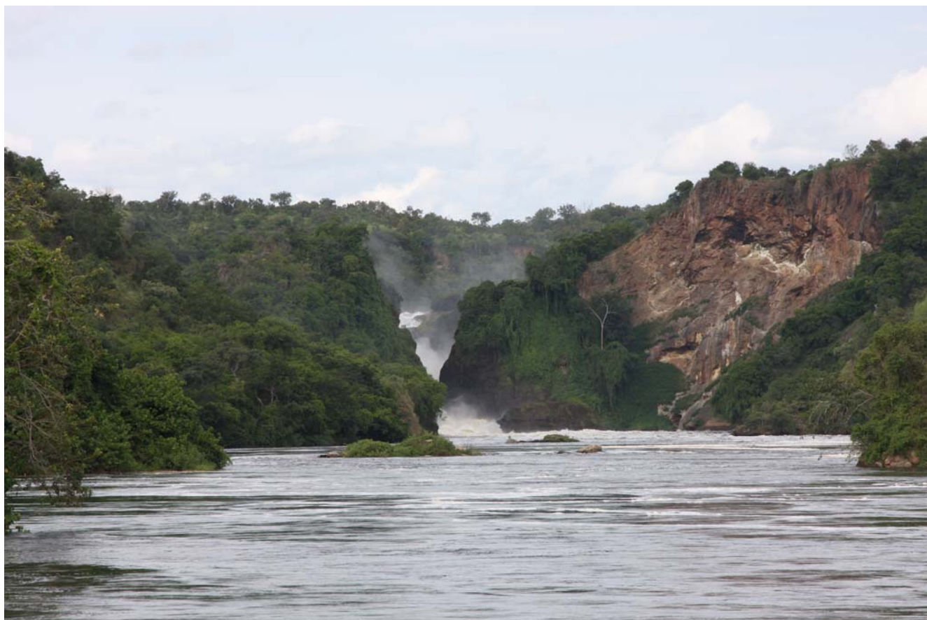
Efter en spændende bådtur ankommer vi til foden af Murchison Falls.