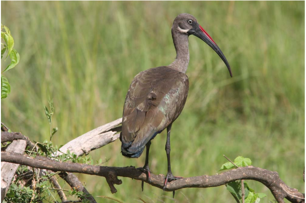
Hadada Ibis blev set og hørt mange steder. Her et billede fra Murchison Falls, hvor det røde overnæb er særligt tydeligt, da den er i yngledragt.