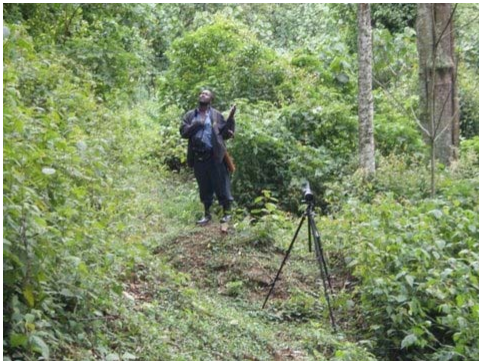
Alfred i aktion.