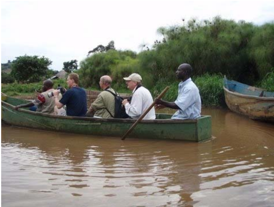
Operation Shoebill. Mabamba Wetlands.

Morgenmad kl. 6 med planlagt afgang kl. 06.30. Vi bliver vækket af immanen, der kalder til bøn, en hund, der gøer og hanen, der galler. Jo, vi er i et nyt lydbillede. Af sted mod Mabamba og træskonæb ad 35 km – hovedsagelig "bad road".