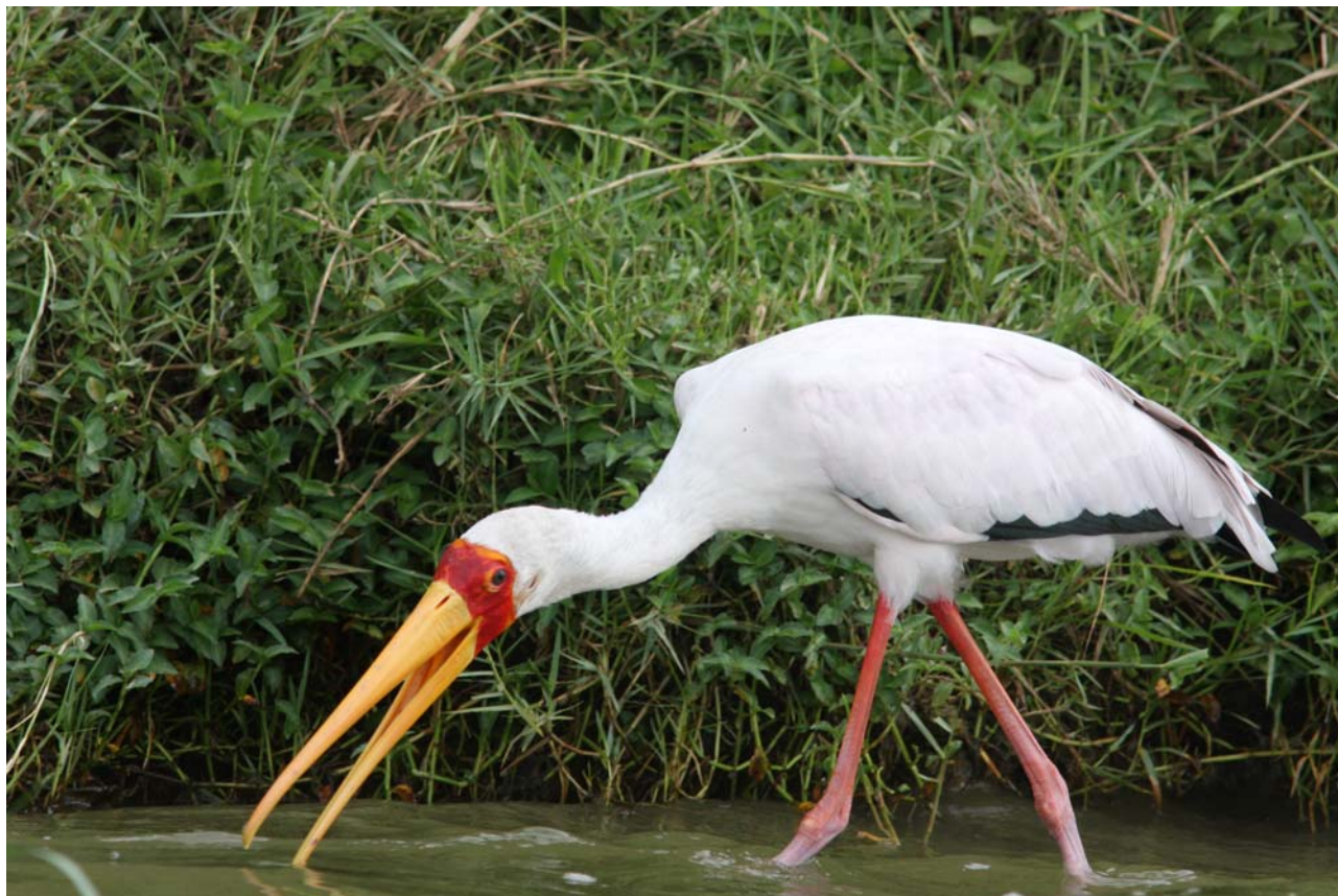
På bådturen ser vi Yellow-billed Stork.