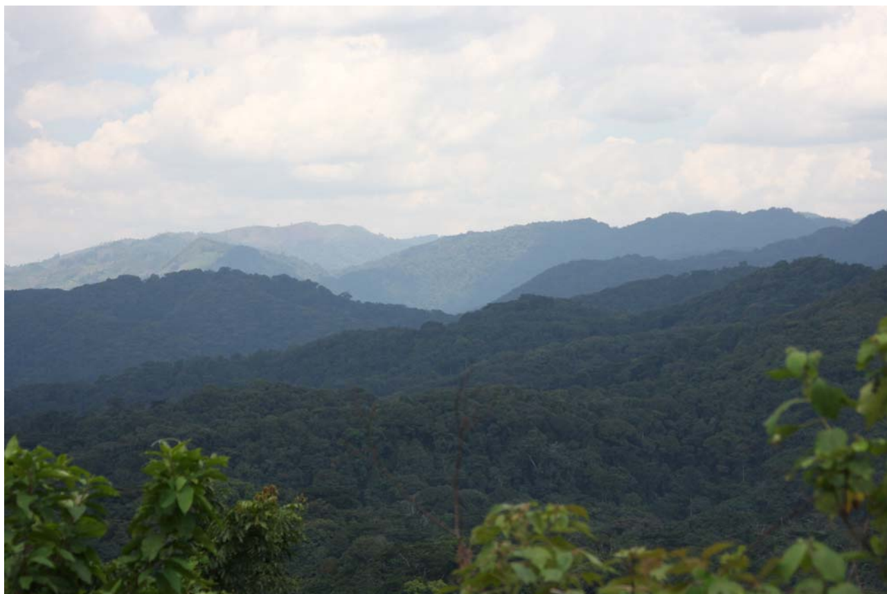
På vej til Mubwindi Swamp og med flot udsigt mod vest.

Vi begiver os på vandretur fra ITFC-Guest House kl. 07.10. Fra 2300 moh skal vi ned til Mubiwindi Swamp i 2100 meter over havet. Efter den første stigning kan vi se Blue Mountain i Congo i horisonten. Her lever også bjerggorillaer, hvis de da ikke er blevet spist! Det var en noget kuperet, men smuk, trekkingtur til og fra sumpen. Vi så mange fuglearter, dog ikke det store antal. Og dyr var nærmest fraværende, selvom vi så en L'Horst's Monkey på tæt hold og nogle forskellige egern arter. Vi kæmpede for Green Broadbill, desværre forgæves. Det var anden gang, at Alfred missede denne art med et hold i år. I maj var det en engelsk gruppe. Alfreds teori var at årsagen havde forbindelse med regntiden, da regnen er kommet tidligere i år. Herved opgiver arten at yngle eller reden bliver så fugtig at bunden falder ud. Den kan gøre yngleforsøg op til 6 x pr år. Vi ser reden, hvor den sidst ynglede. Her blev den plyndret af en Harrier-Hawk.