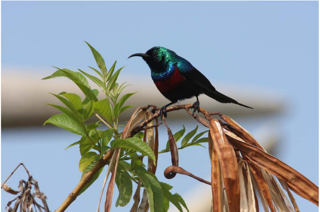
Red-chested Sunbird sås talrigt omkring Mweya Lodge, Queen Elisabeth NP.