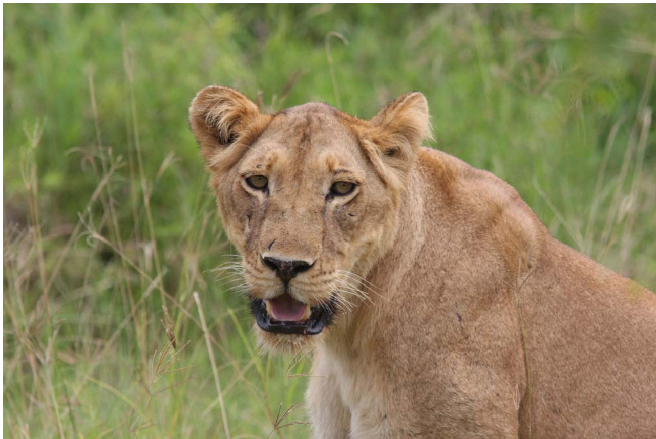
Der var godt med katte i Murchison Falls i dag.

forskrækket at den fløj op af skjuleet under træet, og foretog skinangreb mod den uforsigtige guide, inden den luntede videre igen. Humøret var højt, og vi kørte herefter ned til floden igen, og langs vejen her. Vi stopper for en fugl, og Ken bliver helt ude af kasketten. Han ser nemlig et løvehoved stikke op af græsset blot 30 meter foran os. Vi kører så lidt tættere på, og der ligger to hunløver. De lunter dog inden længe over vejen og ind i buskadset og væk.