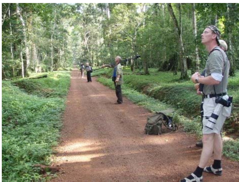
Royal Mile krævede fuld koncentration.

Vejr: vindstille, 0-8/8, 16-26°C. Kortvarig tordenbyge ved 15-tiden.