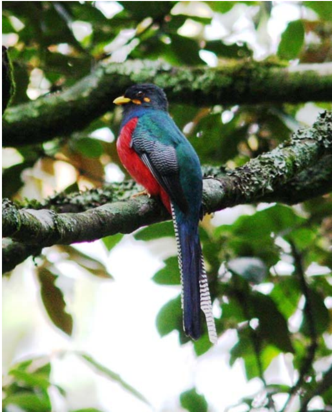
Bar-tailed Trogon. Bwindi.