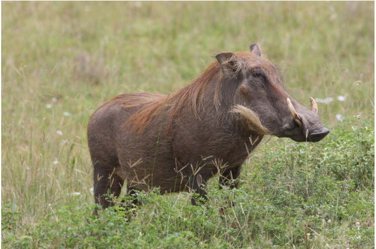
Warthog var meget almindelig i Queen Elisabeth NP.