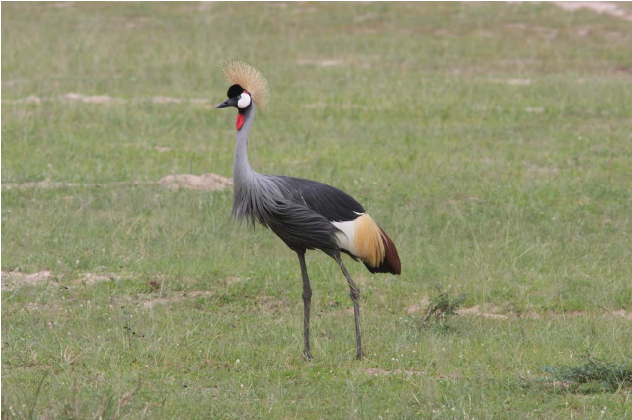
Ugandas nationalfugl, Grey-crowned Crane, Murchison Falls.