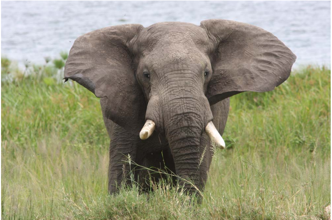
Elefant Murchison Falls.