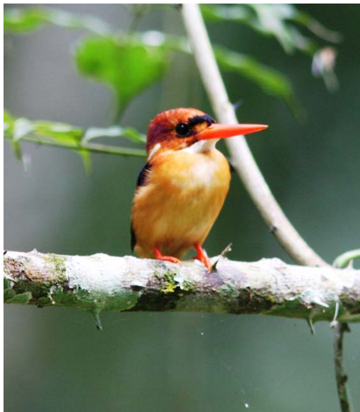
Dwarf Kingfisher var dagens fugl den 14/9.