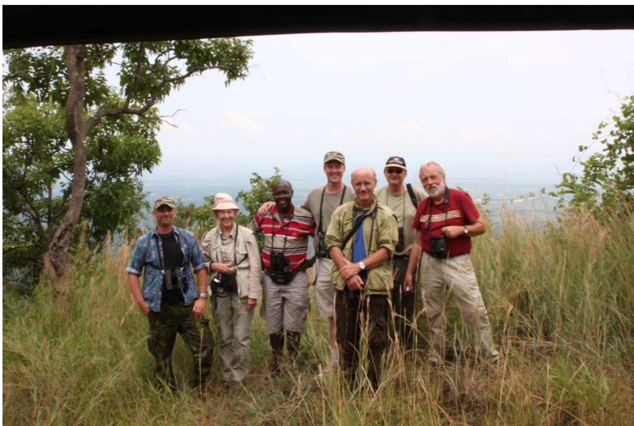
Holdet samlet på vej mod Semliki NP. I baggrunden floden der er grænsen til Congo.