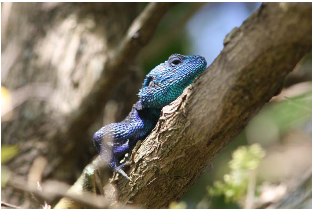
Vi så denne blåhovede agame ved Mweya Lodge, Queen Elisabeth NP.