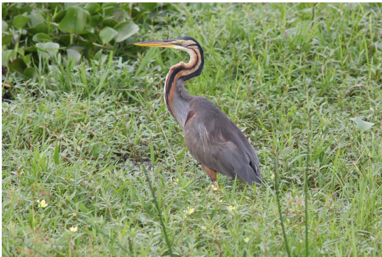
En af tre Purple Heron blev ses på bådturen, Murchison Falls NP.

Kun 3 fugle: 1 den 8/9 Mabamba, 1 henholdsvis den 11. og 12/9 Murchison Falls.