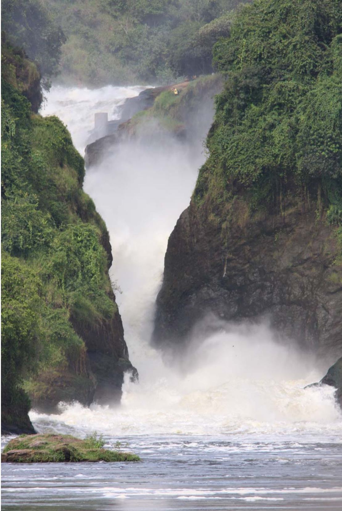
Her til og ikke længere. På nogle skær neden for faldet så fine Rock Pratincoles.