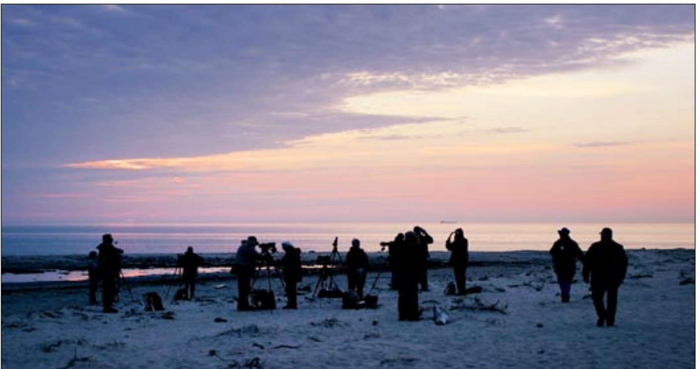
Tidlig morgen på Kolka Odde - klokken 04.40