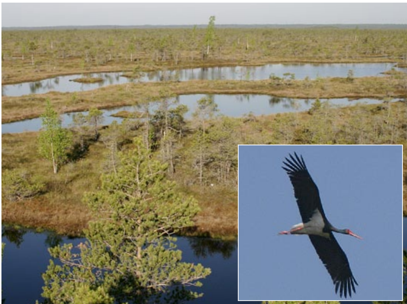
Den smukke højmose i Kemer Nationalpark. Der er bygget en ny board-walk, der fører dybt ind i højmosen. Bemærk den sorte storks hvide hale, langt de fleste sorte storke har sort hale.