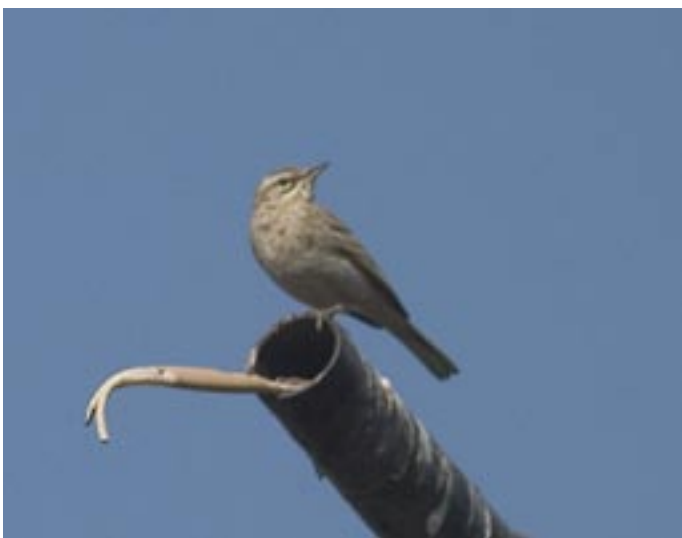
Markpiber sås fantastisk godt - tilgængæld var den smukke Ellekrage ikke nær så tæt på.