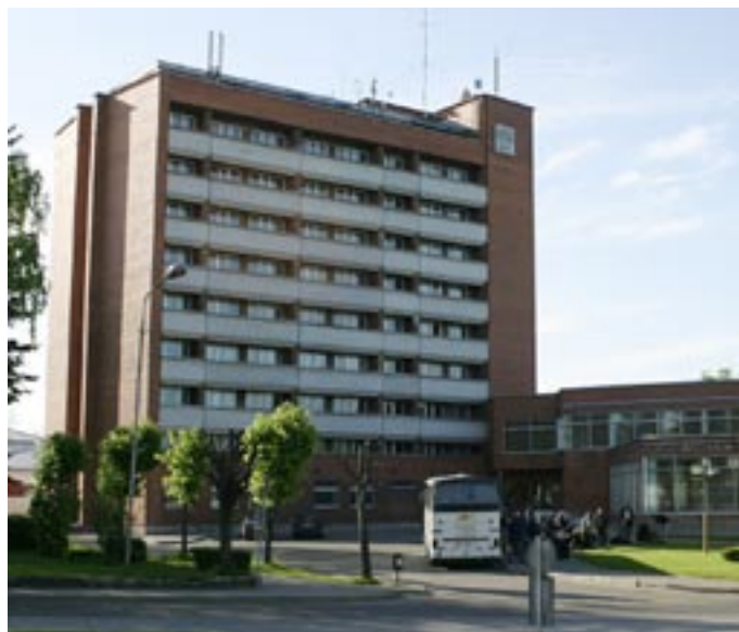
Hotel Latgale I Rezekne - Her fik nogle af de heldige Businessroom!