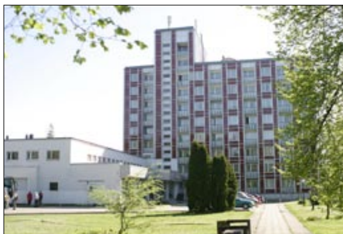
Hotel Lisma, Jurmala