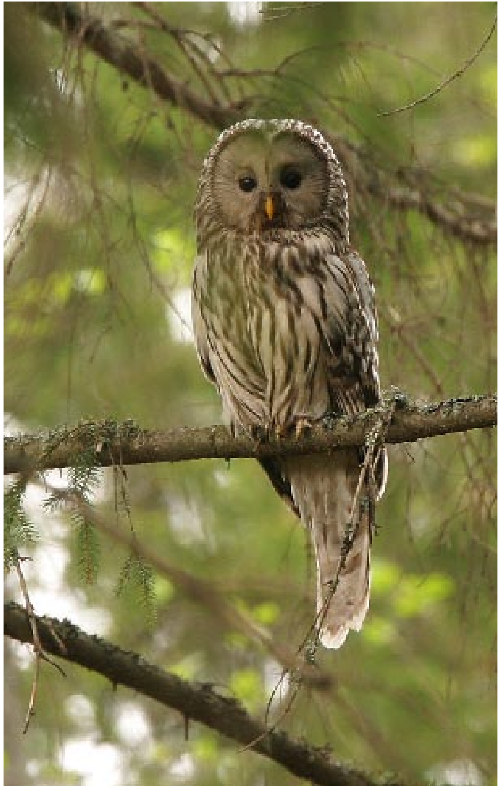
Dagens fugl - Slagugle.

slagugler i området og 6 af disse har rede i de opsatte redekasser. Vi får lov til at deltage i ringmærkningen af 3 reder. I den første rede er der 3 unger, der dog er for små til at mærke. Den anden rede droppes, da der vælges en forkert vej, så først ved 3. rede lykkes det at få mærket en unge. I redet er også 2 gølleæg. Slagugle mor angriber Andris et par gange, ligesom hun knebrer med næbet og hvæser. Slaguglens føde er for halvdelen vedkommende