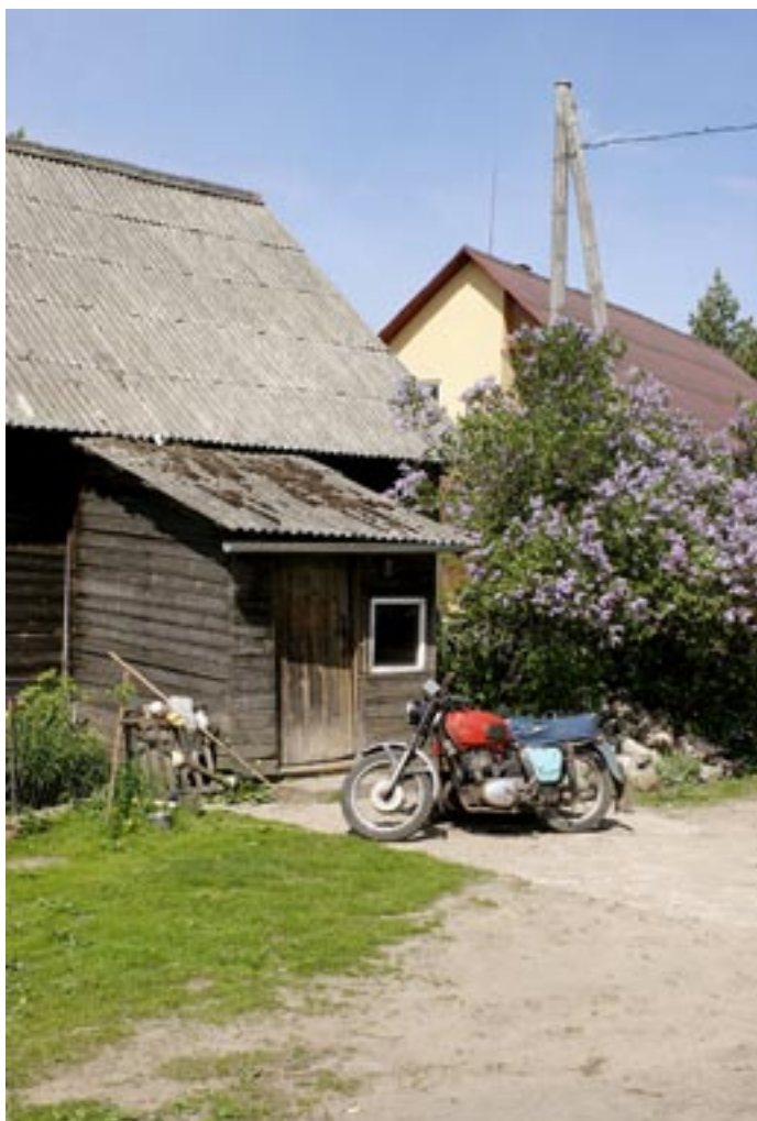
Frokoststedet ved Lake Lubans