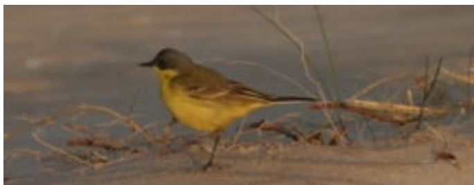
Gul vipstjert af racen thunbergii (Kolka Odde).

Morgenobs ved Kolka odde kl. 04.30-11.00. Tur langs vestkysten til Slitere National Park med besøg på kirkegård. Eftermiddagstur til moseområdet syd for Vidale-vejen samt grusgrav og ås ved Vidale. De ihærdige tager en aftentur til Kolkas odde og ser solen gå ned.