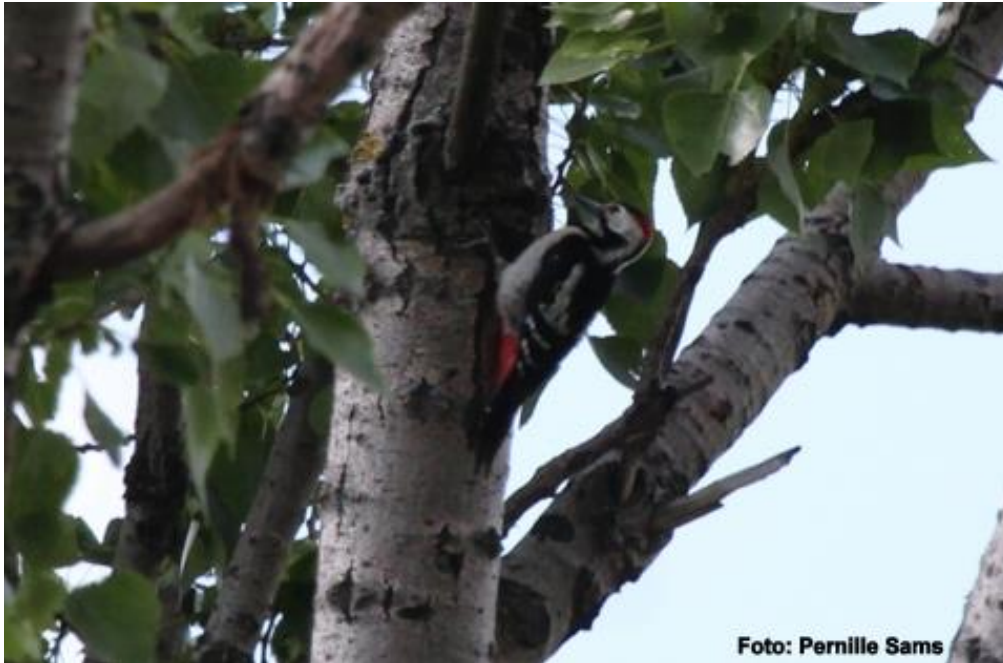
Syrisk flagspætte langs med poppel-alle.

Om eftermiddagen besøgte vi et vådområde lige nord for Tiszabábolna. Et fantastisk område med masser af fugle. De fleste hejrearter ses, derudover syngende drosselrørsanger, sorte storke, hvidskæggede terner, hærfugl m.v.