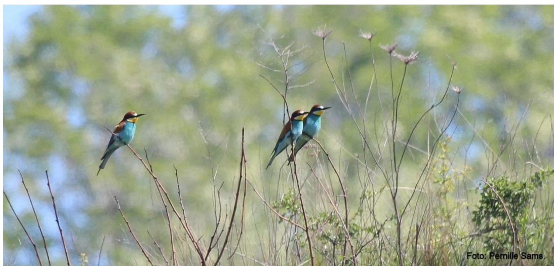
Biædere set i Tard-dalen.

Vi fik senere øje på en flot kejserørn, samt lille skrigeørn højt oppe over Tard Dalen. Undervejs hørtes også bubbende hærfugl, klukkende sydlige nattergale, fløjtende piroler, kikkende vendehalse, rullende turteldue sang, blyppende biædere og den allesteds nærværende og insisterende sang fra utallige markfårkyllinger og mere til. En fantastisk lydkulisse i et malerisk landskab.