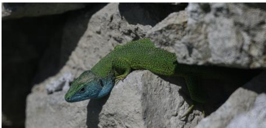
Undervejs opad til plateauet sås et meget flot smaragd-firben.

Her sås og hørtes flere gulirisker, samt en duehøg han, som var oppe at toppes med et par ravne. Undervejs flere syngende piroler, sydlige nattergale, skovsangere, samt en enkelt sortstrubet bynkefugl han.