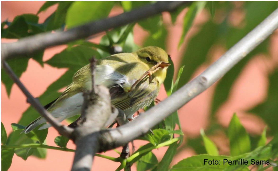
Tillidsfuld skovsanger, Store Hortobagy.

Om eftermiddagen besøgte vi et vådområde lige nord for Tiszabábolna. Et fantastisk område med masser af fugle. De fleste hejrearter ses, derudover syngende drosselrørsanger, sorte storke, hvidskæggede terner, hærfugl m.v.