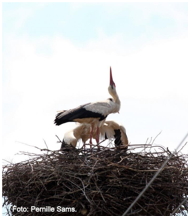
Hvid stork yngler med op til 15 par i flere af byern