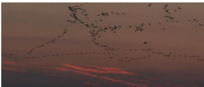
Traner til overnatning

Herefter skiftede biotoptypen igen til lavlandsområder og næste stop var i en landsby m Skovhornugler meget tæt på. Der blev fotograferet og filmet. Inden vi nåede Lake Tisza og frokosten havde vi to små stop for slagfalk og kejsærørn uden resultat. Ved Lake Tisza opholdt vi os et par timer og der var pænt med vandfugle i og over søen samt begge arter af sølvmåge. Det sidste hotel Halaszcsarda (Fisherman's Inn) ligger ved floden Tisza og efter indkvartering tog vi ud i området for at finde et godt sted at se de mange tusinde traner flyve til overnatning i de store fiskedamme i Hortobagy området. Vi placerede os strategisk i forhold til Halasto fiskedammene og var heldige at se ca 15000 traner flyve henover vore hoveder i ca 1 time i lyset af den nedgående røde sol og månen på vej op. Vejret var helt stille så tranernes flugtkald (gamle som unge) gav aftenstemningen et yderligere løft. Aftenshowet sluttede for vores vedkommende kl 18:00 da det blev mørkt. Tranerne kan godt fortsætte med at flyve til overnatning efter det er blevet mørkt.