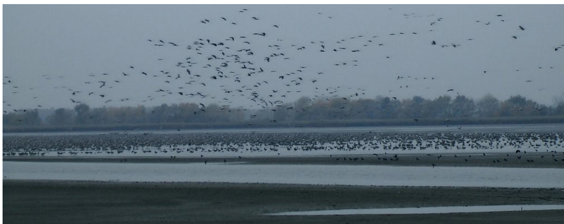
Ca 25000 traner mm til overnatning

Aftenen var afsat til at opleve når tusindevis af traner flyver til overnatning sammen med flere tusinde blisgæs og kragefugle. Vi var på plads ca ½ time før tranerne kom tilflyvende i store og små flokke. Mens vi ventede kom 2 rødhalsede gæs hen over hvor vi stod, et par isfugle i rørskovens bag os. Det blev en fantastisk intens aften på ca 2 timer med ca 6000 blisgæs, 6000 grågæs, ca 25000 tilflyvende traner og ca 14000 kragefugle i luften i mindre og større flokke samtidigt. Et sandt inferno af trumpeterende traner og gæs samt skrigende alliker og råger. Imens fløj ca 5000 gråænder ud til nattesæde på markerne for at fouragere. Se 'Dagens observationer'.