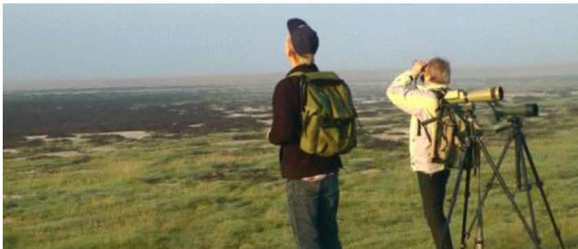
Morgen ved Böddi-szék sodic lakes

Dagen sluttede med et uglestop hvor der yngede slørugle i de gamle bygninger der hører til en gammel slotskro eller restaurant. Her nød vi solnedgangen og mørkningen og var heldige at høre Sløruglerne kalde i mørket – dog uden at se dem. Stedet blev iøvrigt anvendt som base for sidste efterårs birdrace i Ungarn i september.