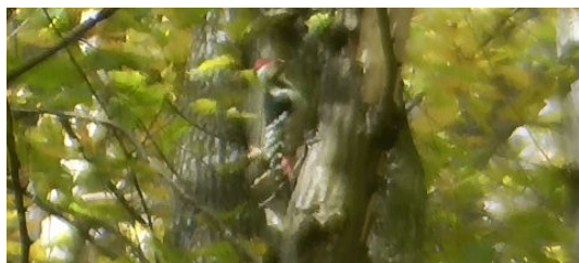
Hvidrygget spætte

Inden vi vandrede ind i dalen brugte vi lidt tid på at søge efter den lokale klippeværbling, der yngler her. Den lod sig desværre ikke se denne gang. Efter denne udbytterige 8 km travetur hold vi frokost et sted i skoven inden vi gik på opdagelse andet steds i skoven langs landevejen for bla at søge efter slagugle (chancen var meget lille) samt spætter og småfugle. Efter godt 4 timers 'vej-kratlusk' endte vi (efter planen) i Nozvai stenbrud ved skumringstide for at give den lokale stor hornugle en chance for at blive set. Vi var heldige at høre og et par stykker af os se en enkelt stor hornugle flyve væk i skumringen.