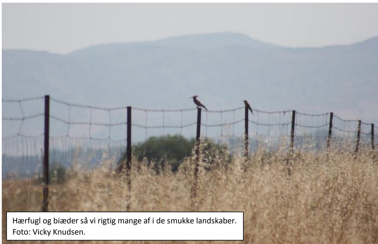
Hærfugl og biæder så vi rigtig mange af i de smukke landskaber.

Derefter fortsatte vi og så masser af hvide storke, biædere og hærfugle på vejen. Da vi nærmere os en flod stod der pludselig to sorte storke og rastede i et lille vådt område. Meget fortørnede over vores uventede besøg fløj de op, men de hang i luften tæt på og ventede kun på, at vi smuttede igen. Og det gjorde vi så. Hele vejen langs floden sås hvide storkere der i træerne, og vi prøvede at parkere, hvor vi ikke ville forstyrre, hvilket også lykkedes. Dog så vi ikke så meget her, men som så mange andre steder med vand, blev vi underholdt af en drosselrørsanger. Derudover fløj en sort glente tæt over hovedet på os, lidt længere oppe en gåsegrib og i horisonten flere slangeørne. En enkelt ravn valgte også at flyve forbi, så alle fik set den.