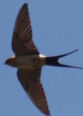
Rødrygget svale over Bullaque River.

rødhovedet tornskade. Inde i selve skoven var vi heldige at se dværgørnerede, blåskaderede og reder fra rødrygget svale. Det var en skønt at gå inde i skyggen, og her så vi flere af "vores" egne arter blandt andet gærdesmutte, munk, kernebider, korttået træløber og bogfinke. Derudover også en flot