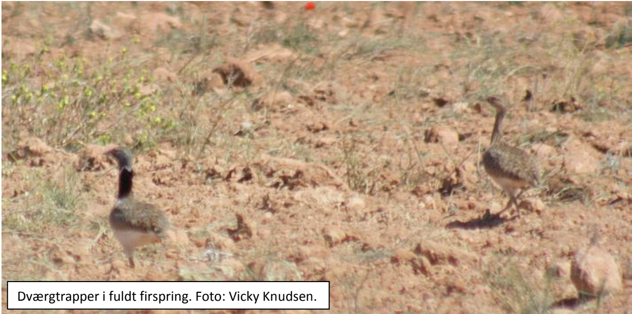
Dværgtrapper i fuldt firspring.

Efter denne korte men vellykkede tur, sluttede vi af ved et meget idyllisk stykke af Rio Guadiana ved Alarcos, imens solen langsomt gik ned. Her startede vi ud med at have hele to unge skadegøge siddende i et højt træ sammen med biæder. Vi fik også hørt pirol og iberisk grønspætte, set sort ibis, isfugl og ellekrage blandt andet. Men noget helt normalt fik stor bevågenhed – en hel halemejsefamilie var i gang med at tage bad langs åen, hvilket ikke var til at stå for. Derudover lykkedes det nogle få at se blå glente, men alle fik set en fin gåsegrib glide over, da vi skulle til at stige ind i bilerne.