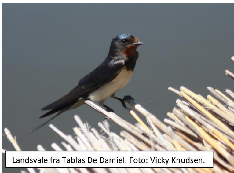
Landsvale fra Tablas De Damiel.

På denne gangrute var der et par fugleskjul vi skulle besøge, for igen at lede efter nogle af de svære arter såsom marmorand, kamblishøne og tamarisksanger. Desværre var alle tre arter fraværende, og generelt var der ikke så meget at se på. Uanset er det dog altid underholdende med de allestedsnærværende bomlærker, cettisangere og cistussangere. Til gengæld fik alle set den rødhalsede natravn, som åbenbart blev forstyrret fra sin lur i starten af ruten. Den fløj nærmest ud i hovedet på et par personer, og alle fik et glimt af den smukke fugl i solskinsvejret. Det var noget af en overraskelse. Herefter spiste vi frokost i skyggen, for vi skulle tanke op med energi, inden vi skulle ud og lede efter den svære theklalærke.