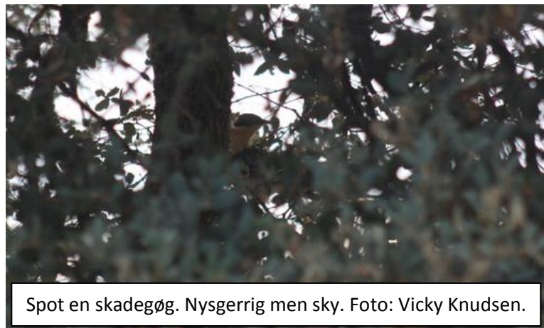
Spot en skadegøg. Nysgerrig men sky.

Herefter blev kursen sat mod endnu en smuk dal, Hos de la Virgin de Valverde. Allerede ved parkeringspladsen væltede det med blåskader, og en forholdsvis kort gåtur i eftermiddagsbrisen bød på både kurrende turtelduer, piroler, gærdeværlinger, klippeværlinger, rødhovedet tornskade, overflyvende ådselsgrib og spanske spurve for alle pengene. På vej tilbage vinkede vi til blåskaderne hele vejen tilbage, alt i mens man skulle prøve ikke at køre de enormt mange kaniner ned på vejen. Pludselig fløj en skadegøg langs bilen og landede i et træ helt ud til vejen, hvor den længe sad og kiggede på os før den fløj videre.