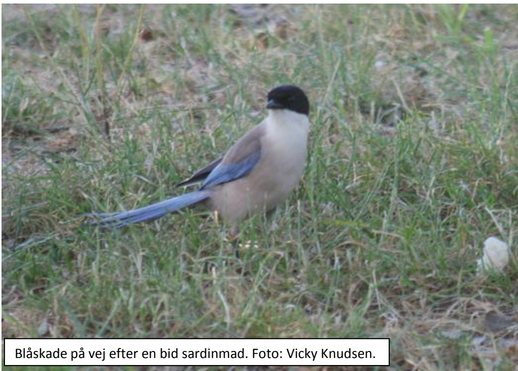
Blåskade på vej efter en bid sardinmad.

Så var det blevet tid til frokost, og vi fandt en lille lund, hvor vi slog os ned i skyggen. På en silo ved siden af ynglede der hvid stork, og i selve lunden var der masser af blåskader, som tilmed kom og fik en bid frokost med. Fantastisk endelig at se dem i en mindre sky udgave. Rastepladsen gav