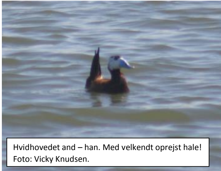
Hvidhovedet and – han. Med velkendt oprejst hale!

Da vi var færdige med at nyde den side af søen, skulle vi lige over og se søen fra den anden side. Vi nåede dog ikke så langt, for pludselig fløj en skadegøg op lige foran os og satte sig til skue i et træ, så alle kunne nyde den. Det var ikke en art der normalt hørte til i området, og stemningen kunne faktisk ikke være bedre.