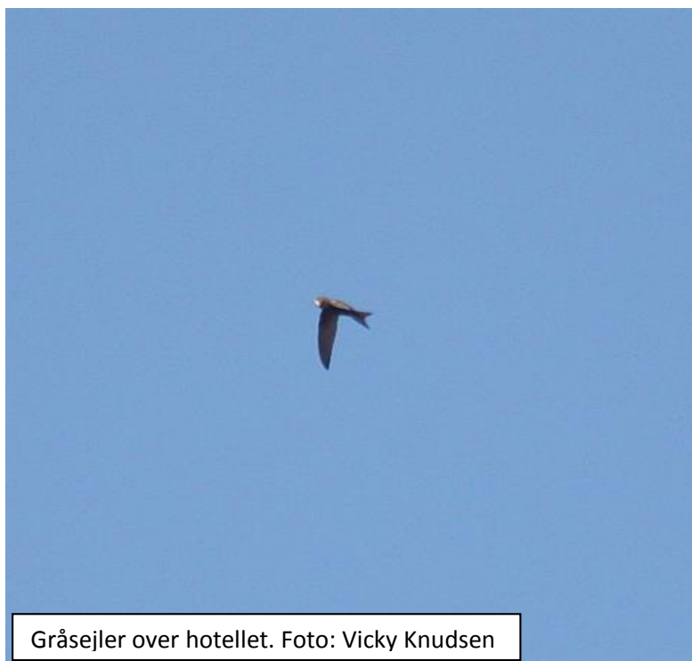
Gråsejler over hotellet.

27. maj. Onsdag morgen startede med morgenmad på hotellet, som også havde sørget for madpakker. Solen skinnede fra en skyfri himmel og fra altanerne kunne høres syngende gulirisk, alt i mens mursejlerne vimsede forbi samt et par enkelte gråsejlere. Lige ved siden af hotellet lå byens kirke som både husede enorme mængder af mursejlere, lille tårnfalk og senere på aftenen en rastende hvid stork. Efter morgenmaden blev bilerne kørt op fra en meget snæver p-kælder, som krævede en del tilvænning. Derfor blev vi en smule forsinkede i at komme afsted, men kørte herefter ud og mødtes med vores guide Vincente. Vincente var alle dage eminent til at finde ud af, hvor vi skulle køre hen afhængigt af vejr og vind, så meget få af de på forhånd aftalte planer blev overholdt, men det var som om, at det ikke gjorde noget med de oplevelser vi fik.