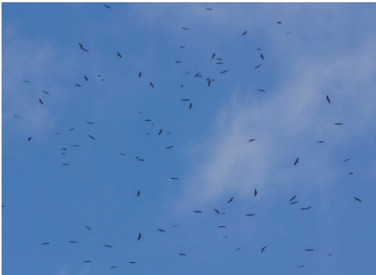
Lille Skrigeørn på træk

En anden rovfugleart hvor næsten hele den Europæiske bestand passerer er Aftenfalk. Derudover kan vi opleve hundredevis af Hvepsevåger, Sort og Hvid stork, Rørhøge, Hedehøge og Steppenhøge, Slangeørne, Dværgørne og flokke af Balkanhøge, med flere.