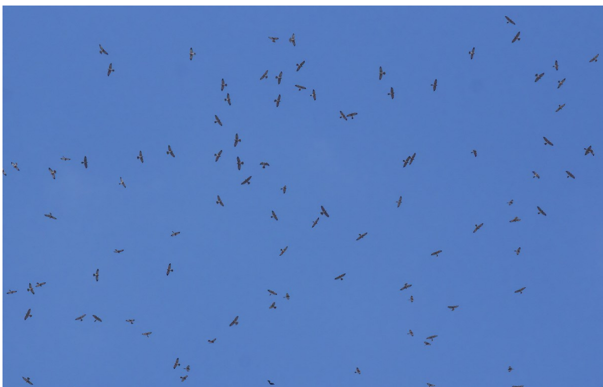
Flok af Balkanhøge

En anden rovfugleart hvor næsten hele den Europæiske bestand passerer er Aftenfalk. Derudover kan vi opleve hundredevis af Hvepsevåger, Sort og Hvid stork, Rørhøge, Hedehøge og Steppenhøge, Slangeørne, Dværgørne og flokke af Balkanhøge, med flere.