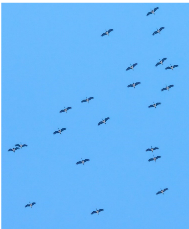
Sort stork på træk

Dag 15 – Atanasovsko Lake om morgenen og derefter hjemrejse.