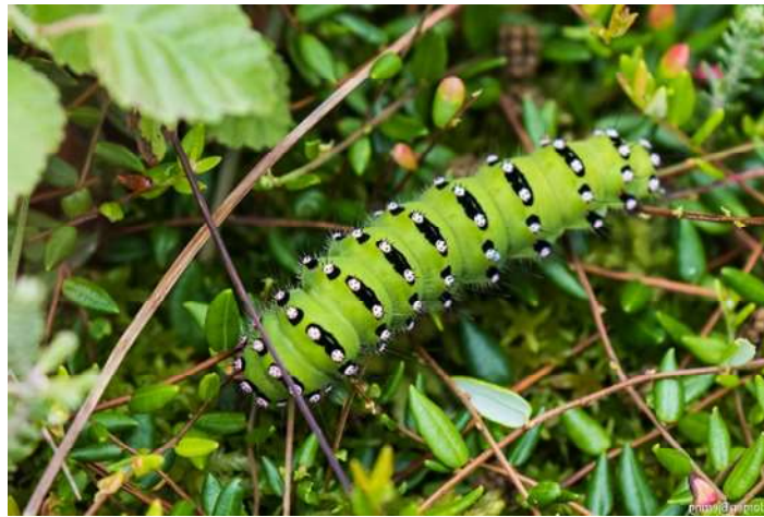
Aftenpåfugleøje - Portlandsmosen

Langs gangbroen fandt vi mange hedemoseplanter, bl.a. Soldug, Tranebær, Rosmarinlyng, Muldebær, Klokkelyng. En fin, fed larve af Aftenpåfugleøje lå i lyngen.