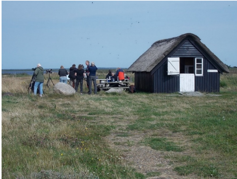
Jagthytten v Vest Stadil Fjord

Efter frokosten hurtigt sydover forbi Hvide Sande, Varde, Ribe og et lille toiletstop syd for Ribe. Ved Skærbæk drejede vi vestpå mod Ballum.