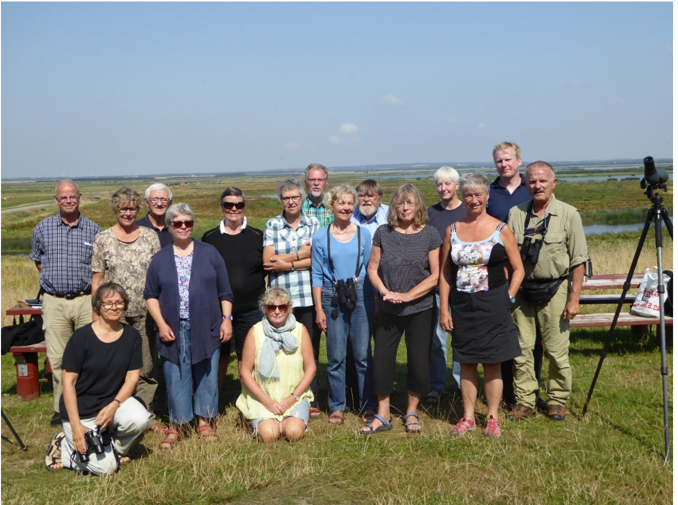
På Lønborg Borgbanke ved Skjern Enge