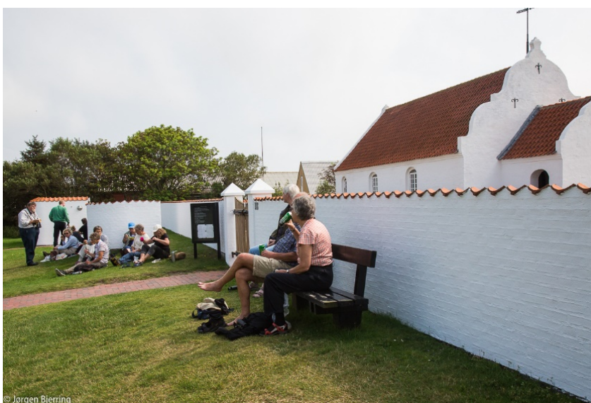
Frokost ved kirkediget på Mandø

Frokostindkøb i Løgumkloster Brugs. Solen skinnede, så flot vejr på turen til Mandø, hvor man skal respektere tidevandet ved kørsel på Låningsvejen. Vi kørte over ved lavvande. Der var ikke mange vadefugle at se, da disse ved lavvande trækker længere ud på fladerne. Men strandengen blomstrede: Strandasters, Hindebæger (Mandø-lyng), Strandrehage, Kveller. Der var en del turister på øen – som bliver kørt derover i store vogne med en traktor foran. Vi fandt et fredeligt sted ved kirkemuren, hvor vi spiste frokost.