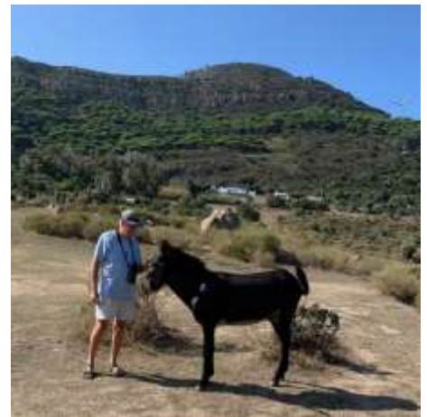
En alvors snak... – på andalusisk eller jysk?

Elleve morgenduelige var på tur fra kl. 6 til 7. Vi kørte til Hotel La Peña og gik op af vejen mod La Peña Watch point. Heste og muldyr var på plads og holdt øje med os i mørket, alt mens vinden tog til fra øst og mørke skyer hang over bjergkammen. Der var ikke meget gang i fuglene, så vi slentrede tilbage. Men lige som vi var kommet tilbage til bilerne tudede en stor hornugle fire gange – YES! turens mål var nået. Opmuntrede kørte vi tilbage til hotellet, og nød deres dejlige morgenmad, sammen med de som ikke var med på tur.