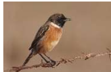
Sortstrubet bynkefugl - kaldet SSB