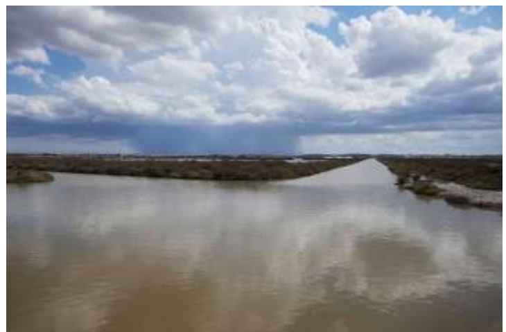
Regn i det fjerne