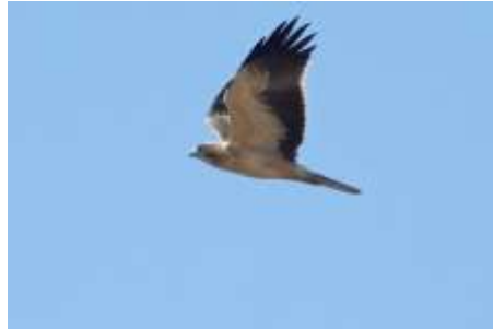
Dagens fugl: Dvärgörn