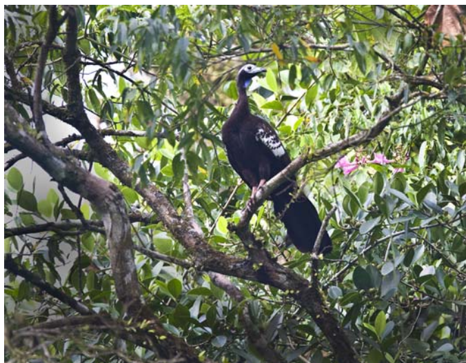
Den eneste endem på T&T. Trinidad Piping Guan.