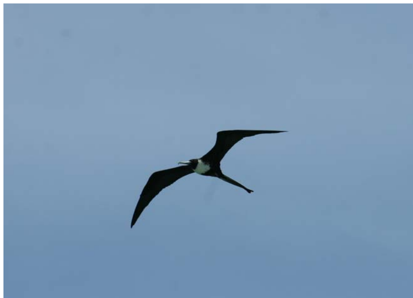
En ud af flere tusinde Magnificent Frigatebirds.

Rufous-vented Chachalaca 8, Red-billed Tropicbird 20, Magnificent Frigatebird 1650 (morgentræk), Brown Booby 3, Yellow-crowned Nighth Heron 2 ad. 2 imm., Green Heron 6, Cattle Egret 3, Little Blue Heron 3 (2 hvide), Osprey 2, Great Black Hawk 2, Merlin 1, Southern Lapwing 3, Ruddy Turnstone 3, Spotted Sandpiper 2, Laughing Gull 145, Pale-vented Pigeon 10, White-tipped Dove 10, Orange-winged Amazon 20, Green-rumped Parrotlet 1, Smooth-billed Ani 4, Short-tailed Swift 20, Rufous-breasted Hermit 2, Ruby Topaz 1, Black-throated Mango 5, White-necked Jacobin 1, Copper-rumped Hummingbird 4, Blue-crowned Motmot 2, Green Kingfisher 1, Red-crowned Woodpecker 2, Olivaceous Woodcreeper 1 hørt, Cocoa Woodcreeper 2, Barred Antshrike 4, White-fringed Antwren 8, Yellow-bellied Elaenia 4, Fuscous Flycatcher 1, Grey Kingbird 5, Tropical Kingbird 4, Venezuelan Flycatcher 1, Red-eyed Vireo 4, Scrub Greenlet 6, White-winged Swallow 2, Caribbean Martin 10, Southern House Wren 4, Tropical Mockingbird 12, Bare-eyed Thrush 3, Blue-grey Tanager 8, Palm Tanager 2, Bananaquit 75, Black-faced Grassquit 10, Blue-black Grassquit 1 F, Northern Waterthrush 2, Crested Oropendola 3, Shiny Cowbird 5, Carib Grackle 40, Red-tailed Squirrel 2, Boa Constrictor (ca. 3 m).