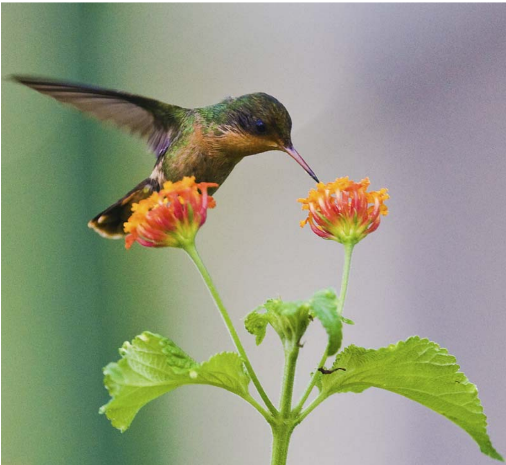
Tufted Coquette – hun.

Asa Wright Nature Center 18/3 2 F, 19/3 2 F, 20/3 2 F, 21/3 2 F 1 M, 22/3 1 F.