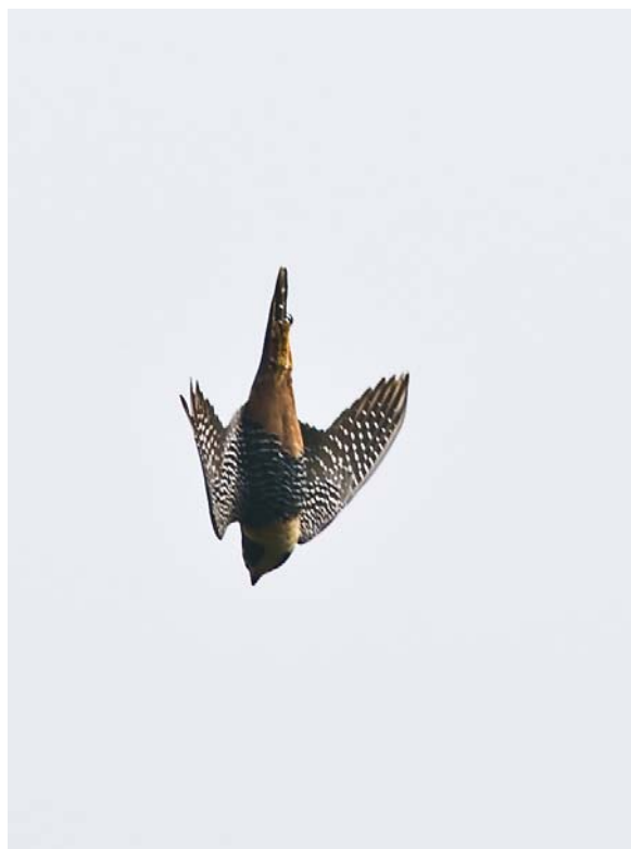
Billedet vender skam rigtigt. Bat Falcon dykker mod en Lined Woodpecker, som nærmer sig redehullet.

Trinidad Piping Guan 8, Brown Pelican 5, Magnificent Frigatebird 34, Little Blue Heron 1, Black Vulture 75, Turkey Vulture 5, Grey-headed Kite 1 ad., Swallow-tailed Kite 10, Double-toothed Kite 1, Plumbeous Kite 2, White Hawk 2, Common Black Hawk 1, Bat Falcon 2, Spotted Sandpiper 2, Pale-vented Pigeon 25/3 1, Ruddy Ground Dove 2, White-tipped/Grey-fronted Dove 2 hørt, Orange-winged Amazon 14, Squirrel Cuckoo 3, Band-rumped Swift 3, Short-tailed Swift 1, Lesser Swallow-tailed Swift 8, Rufous-breasted Hermit 1, Ruby Topaz 1, Amazonian Violaceous Trogon 1, Channel-billed Toucan 2, Green Kingfisher 1, Lineated Woodpecker 2, Crimson-crested Woodpecker 4, Pale-breasted Spinetail 4, Barred Antshrike 4, Plain Antvireo 1 set/hørt, White-bellied Antbird 2 hørt, Silvered Antbird 1 set/hørt, Forest Elaenia 1, Tropical Pewee 1, Great Kiskadee 3, Streaked Flycatcher 2, Black-tailed Tityra 3, Rufous-browed Peppershrike 2, Red-eyed Vireo 1, Golden-fronted Greenlet 2, White-winged Swallow 2, Grey-breasted Martin 10, Rufous-breasted Wren 2, Bare-eyed Thrush 1, White-lined Tanager 4, Silver-beaked Tanager 6, Blue-grey Tanager 2, Palm Tanager 11, Green Honeycreeper 2, Bananaquit 5, Blue-black Grassquit 15, Crested Oropendola 30, Yellow-rumped Cacique 2, Yellow Oriole 3, Shiny Cowbird 8, Giant Cowbird 1, Violaceous Euphonia 1, bat sp. 2, Leatherback Turtle 5+.