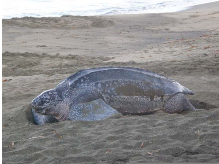
Læderskildpadde Tobago.

Tobago Plantations/Bamboowalk Hotel 26/3 1 (1 m, tynd).