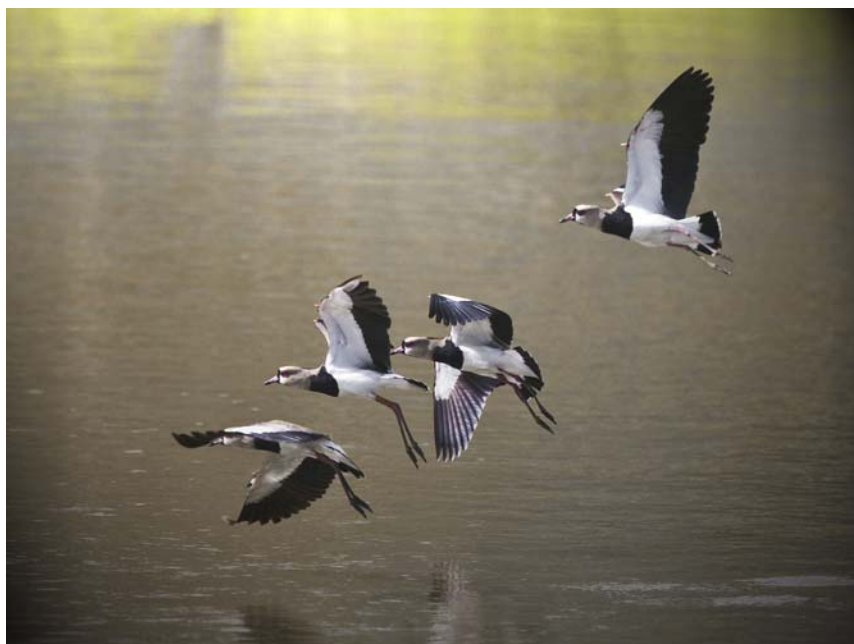
Southern Lapwings.

Take off BA Airbus A319 kl. 14:35. Flyvetid 1 time 30 minutter og landing kl. 17.00 lokal tid i CPH. Sjællænderne spredes fra Kastrup og jyderne har endnu nogle timer hjem. Men sneen er væk og foråret er kommet til Danmark.