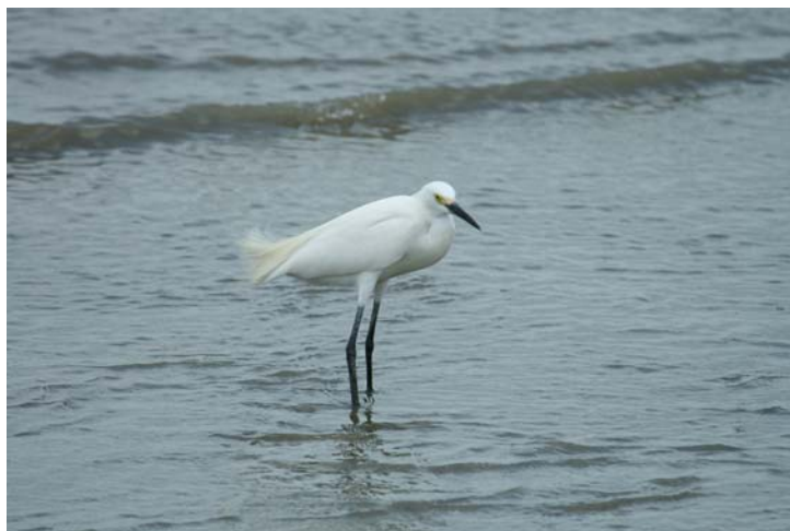
Snowy Egret.

Bon Accord Sewage Ponds 28/3 1. Turtle Beach 29/3 1.