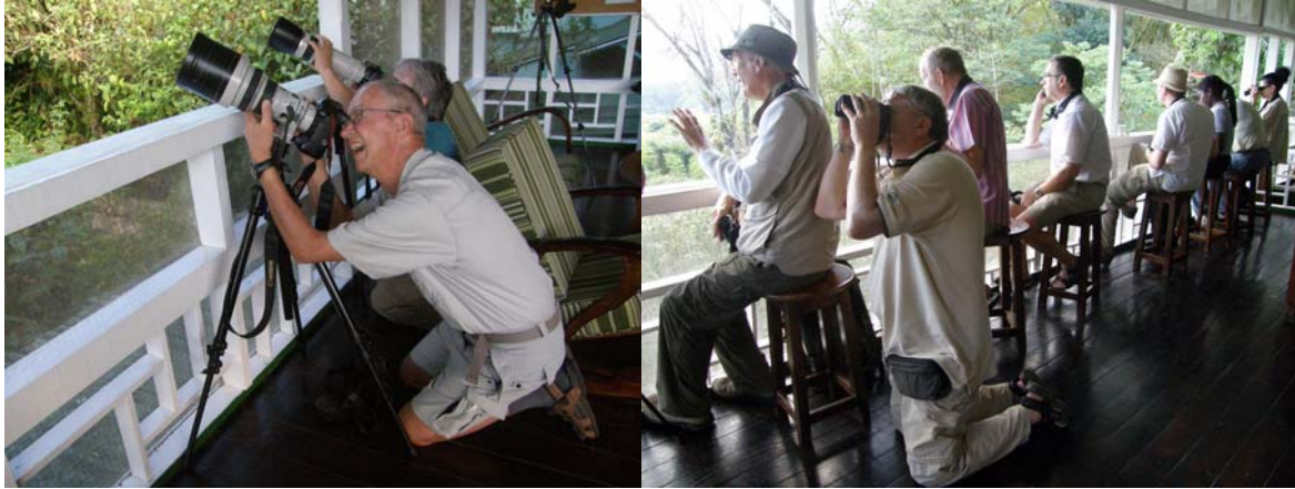
På knæ for svalehaleglenten. ASA Wright.