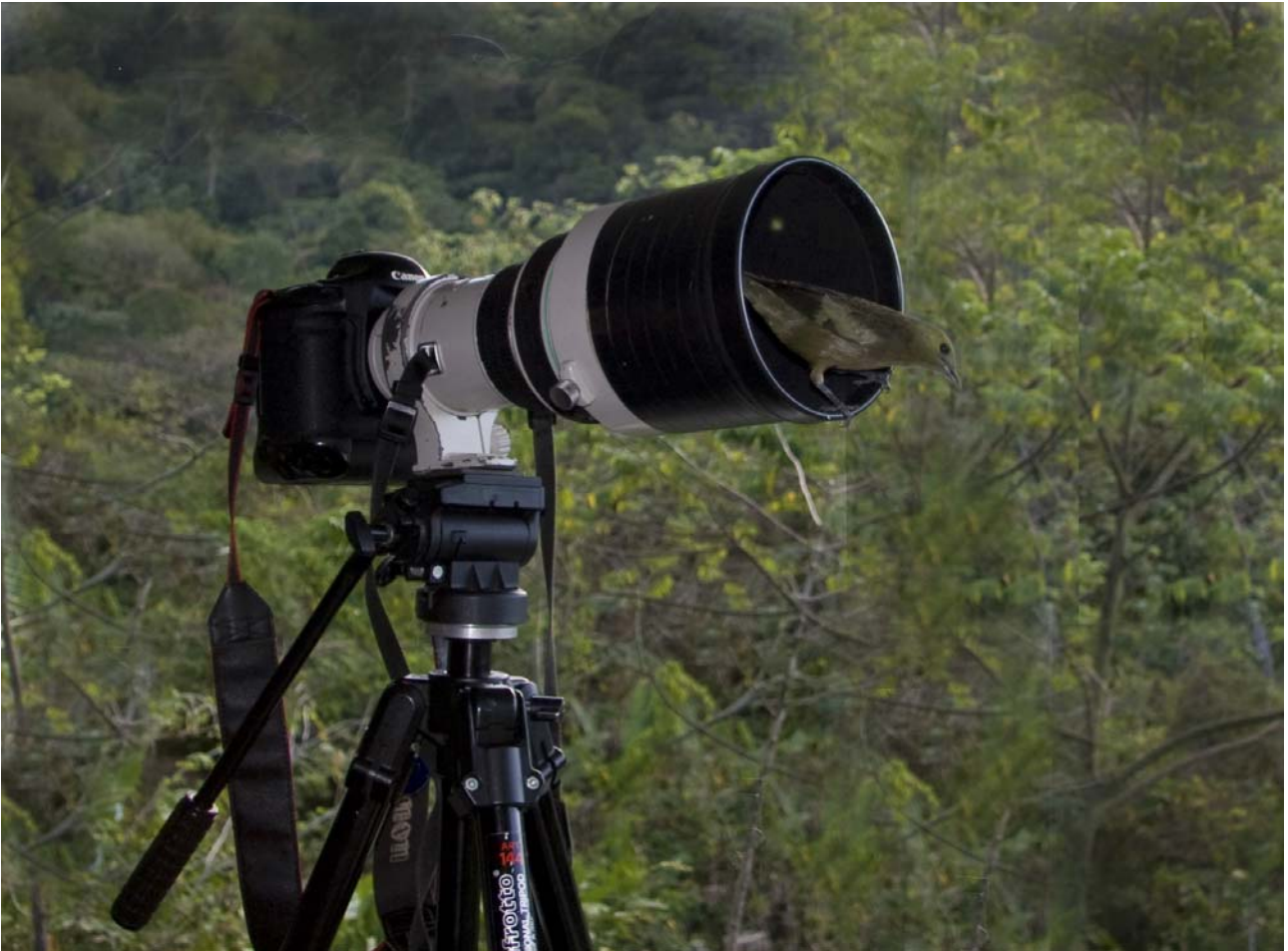
Fotograferne havde gode betingelser på T&T turen. Palm Tanager i skudlinjen.