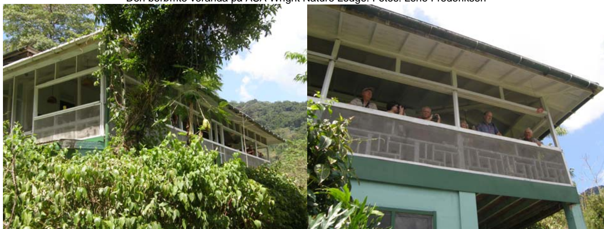
Den berømte veranda på ASA Wright Nature Lodge.