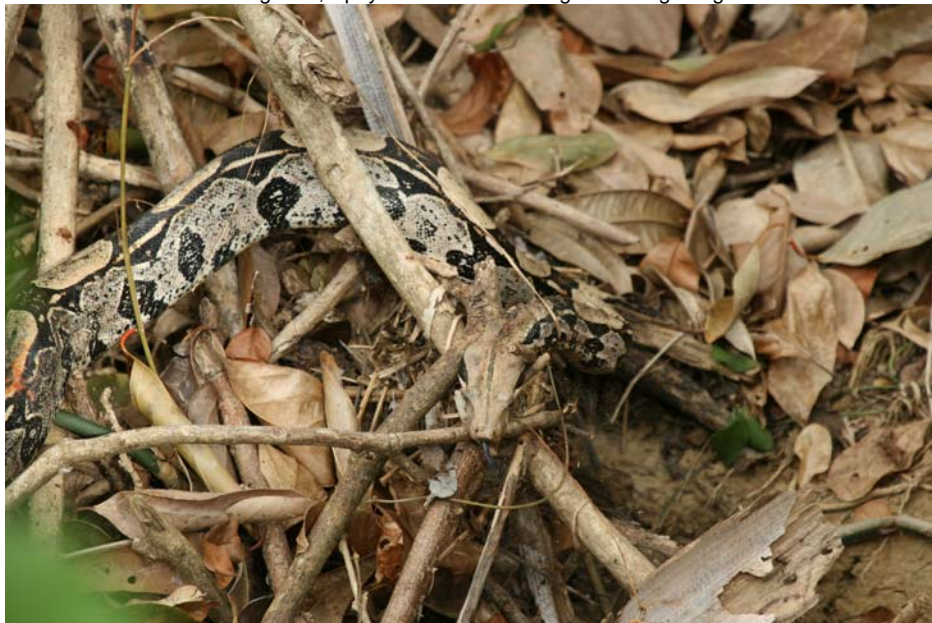
Kongeboa, Speyside.