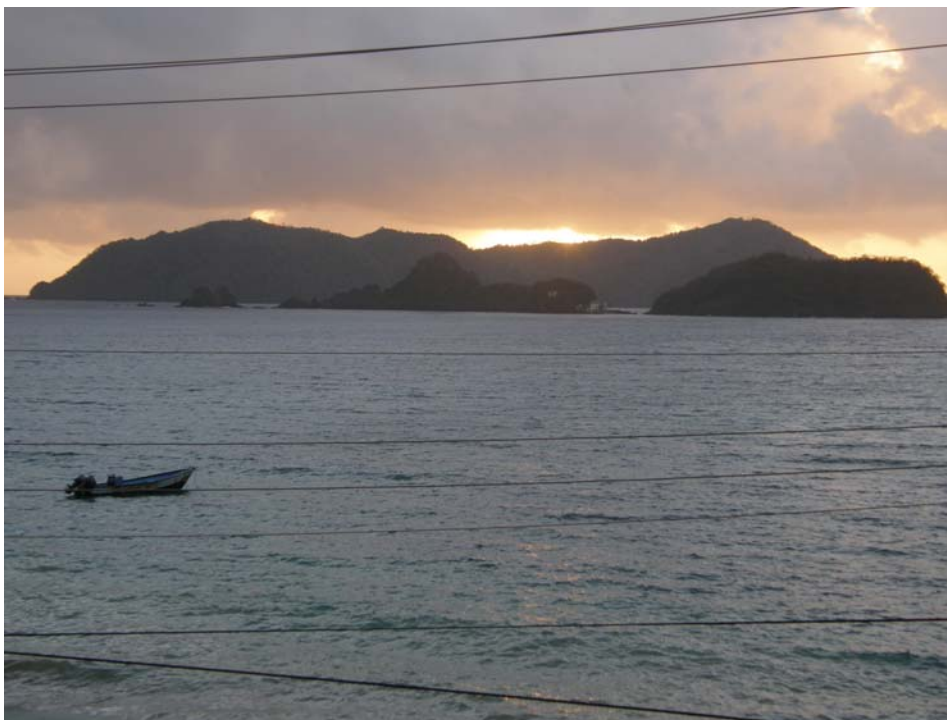
Mogenstemning over Speyside bugten med Little Tobago i baggrunden.

Speyside, til kl. 9.15. Observationer fra kl. 6.00 til busafgang. Morgenmad Speyside Inn.