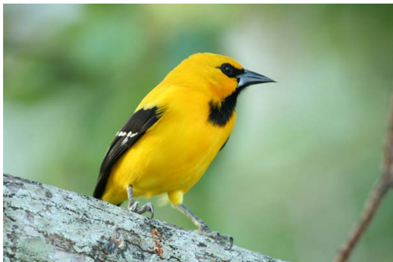
Yellow Oriole.

Aripo Savanna 24/3 2. Grande Riviere 25/3 3.