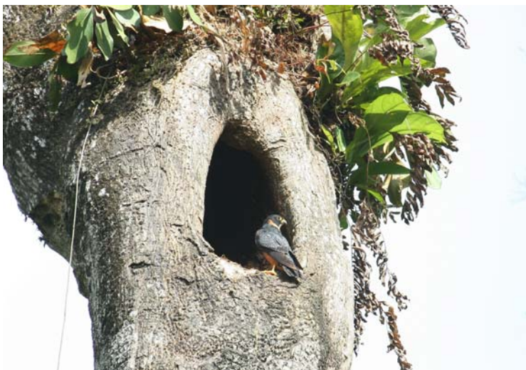
Bat Falcon.