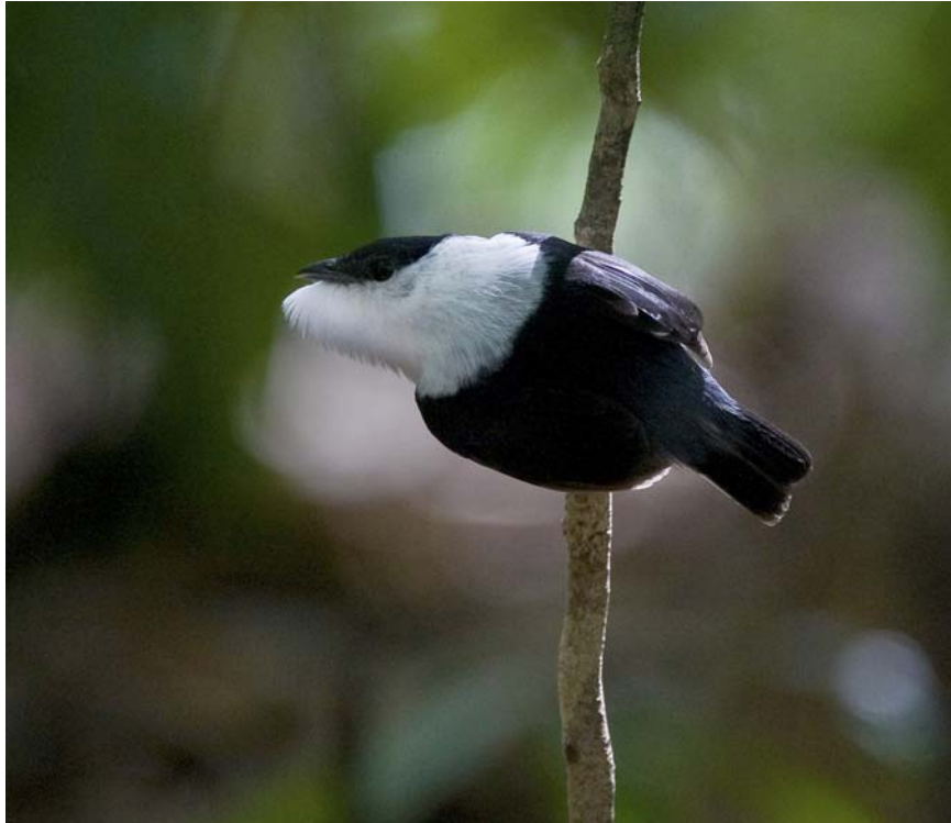
White-bearded Manakin. En af de mere spektakulære fugle.