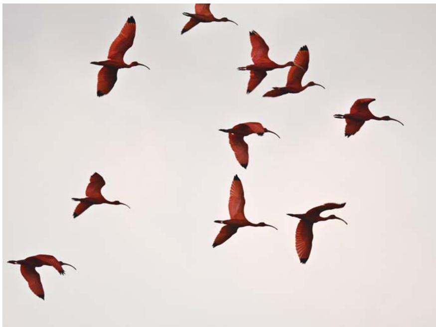
En af turens højdepunkter – Den røde Ibis til overnatning i Caroni Swamp.

Waterloo 23/3 30. Caroni Swamp 23/3 1150.