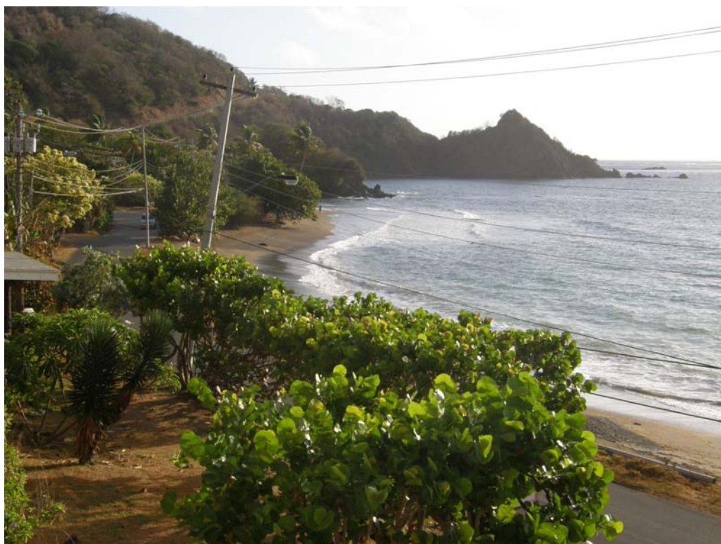
Stranden ved Speyside Inn og stedet hvor fregatfuglenes morgentræk passerede.

Bl.a.: Great Blue Heron 1, White-tipped Dove 1, Ruby Topaz 1.