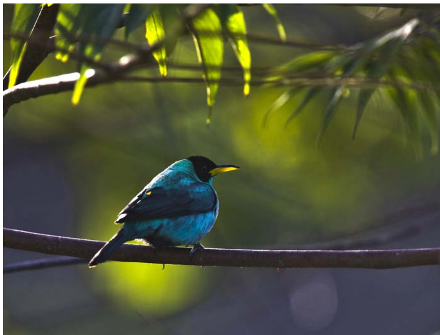
Green Honeycreeper var meget almindelig på ASA Wright.

Asa Wright Nature Center 18/3 15, 19/3 15, 20/3 20, 21/3 20, 22/3 15. Grande Riviere 25/3 2.