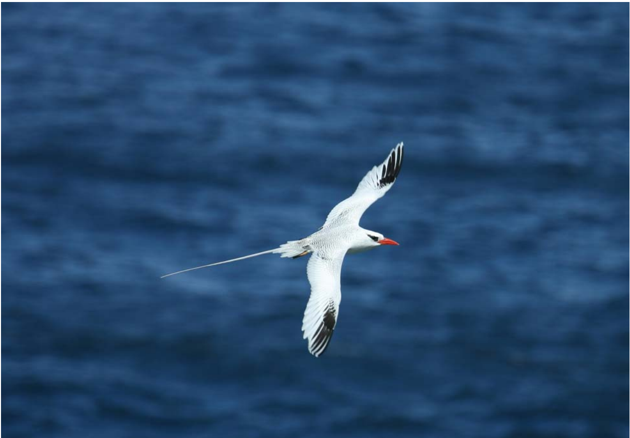
Red-billed Tropicbird. Little Tobago Island.