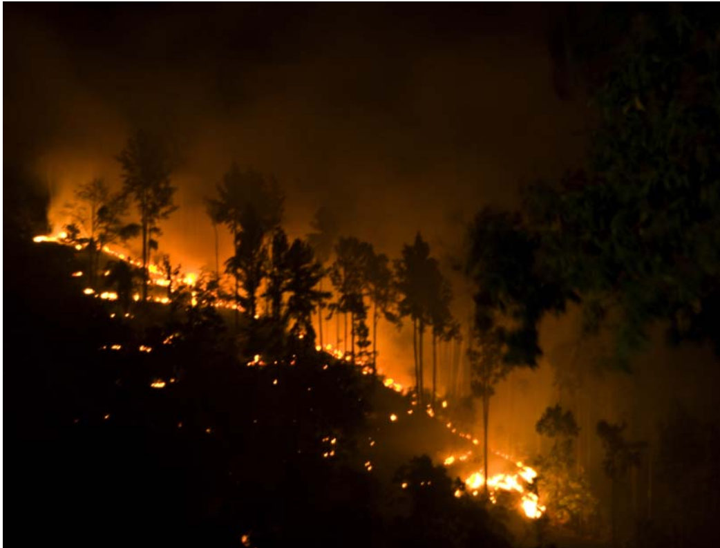
Udsigten fra balkonen på Pax Guesthouse. Flot så det ud, men det var ikke spændende at sove ved siden af.