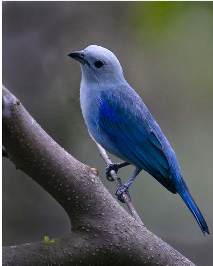
En ud af mange flotte Tanagers. Blue-grey Tanager.