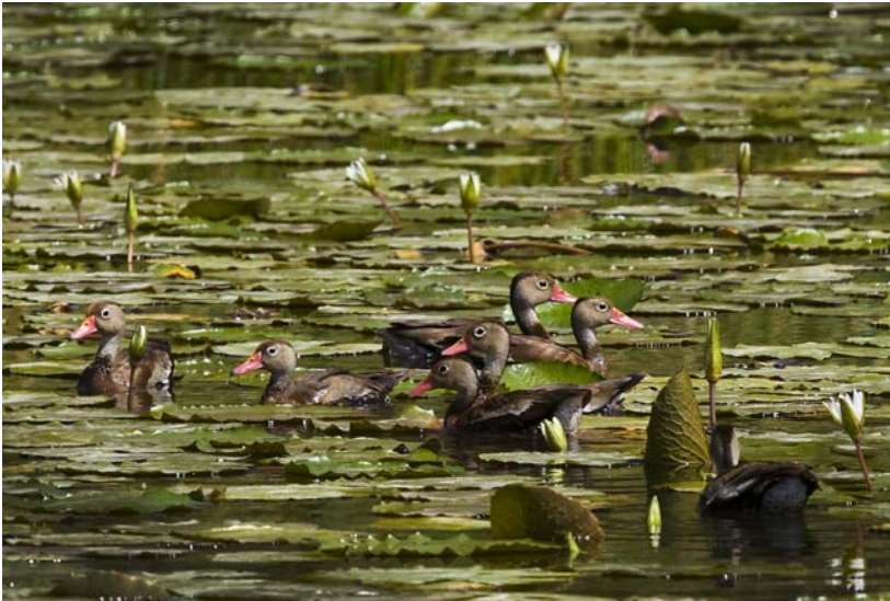
Black-bellied Whistling Duck i stemningsfyldt farvand.