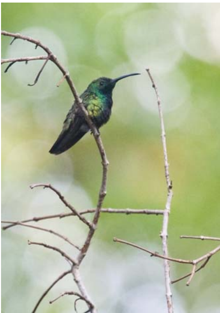
Green-throated Mango, han, Caroni Swamp.