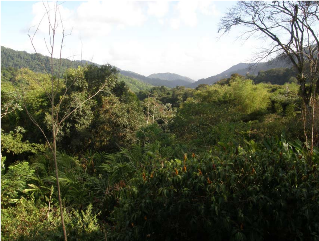
Udsigten fra ASA Wright's veranda.