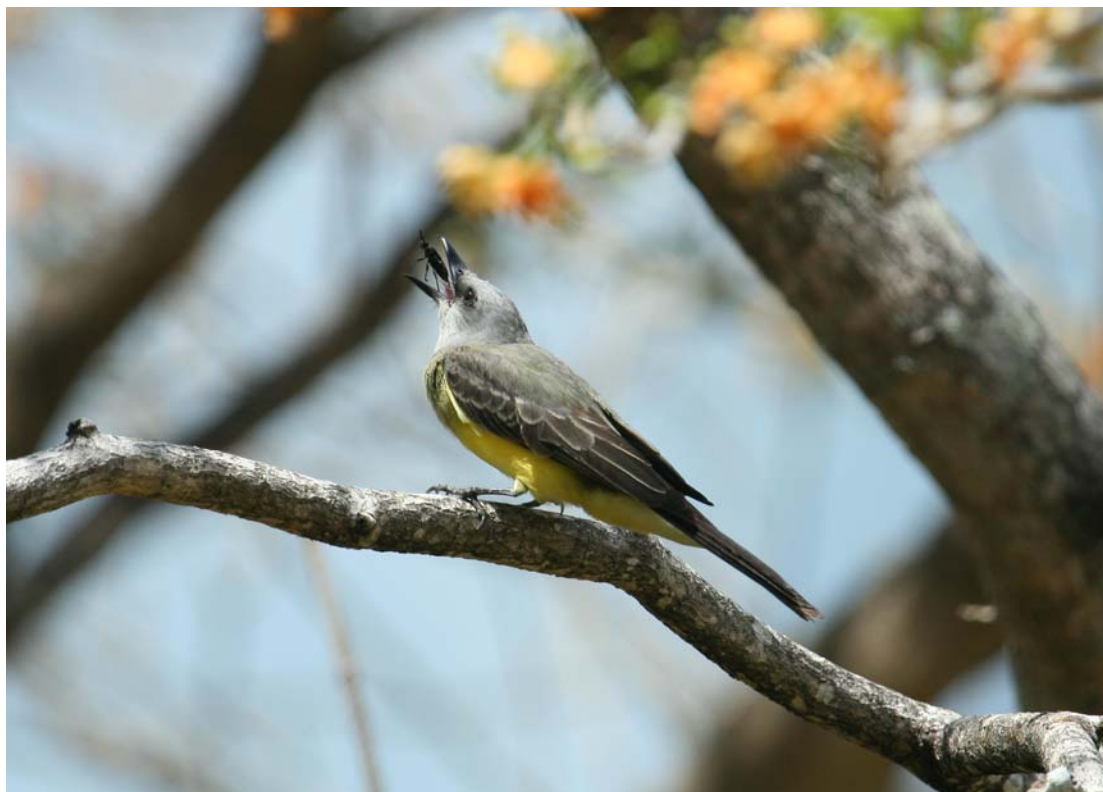
Tropical Kingbird napper lige desserten.