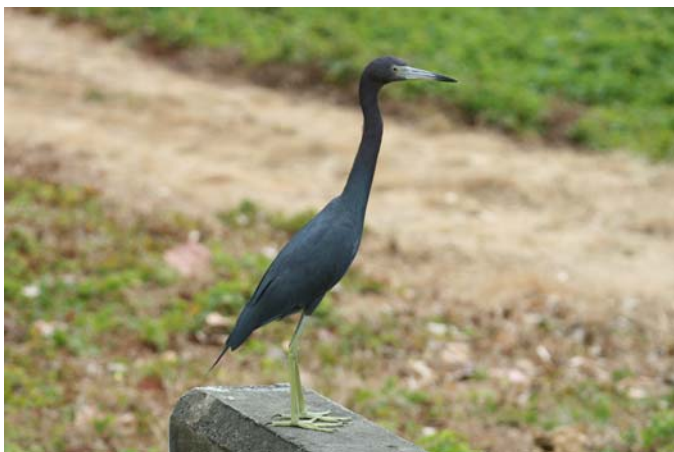
Little Blue Heron.

Dagens fugl: Little Blue Heron. (og så var afstemningen endelig med Kirsten!).