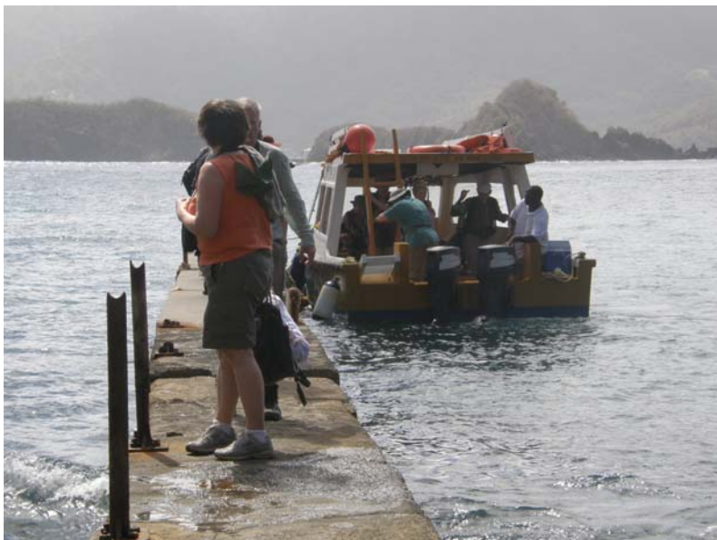
Landing på Little Tabago.

Vi dropper Sepyside Inn til aftensmaden. Peter Cox bestilte bord til os hos Miss Jemma's Tree house. Fremragende mad, men der serveres ikke alkohol. Så på med softdrinks og vand. Vegetarretten har samme tilbehør som kød-/fiskespiserne. Dagens fugl blev hverken banana-split eller speed-eater, men Magnificent Frigatebird pga. det imponerende morgentræk ved Speyside.