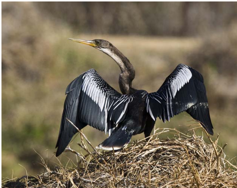
Anhinga – Slangehalsfugl. Tobago Plantations.