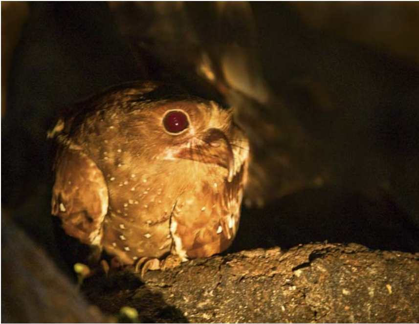
En ud af 33 Oilbirds i Dunstan Cave.