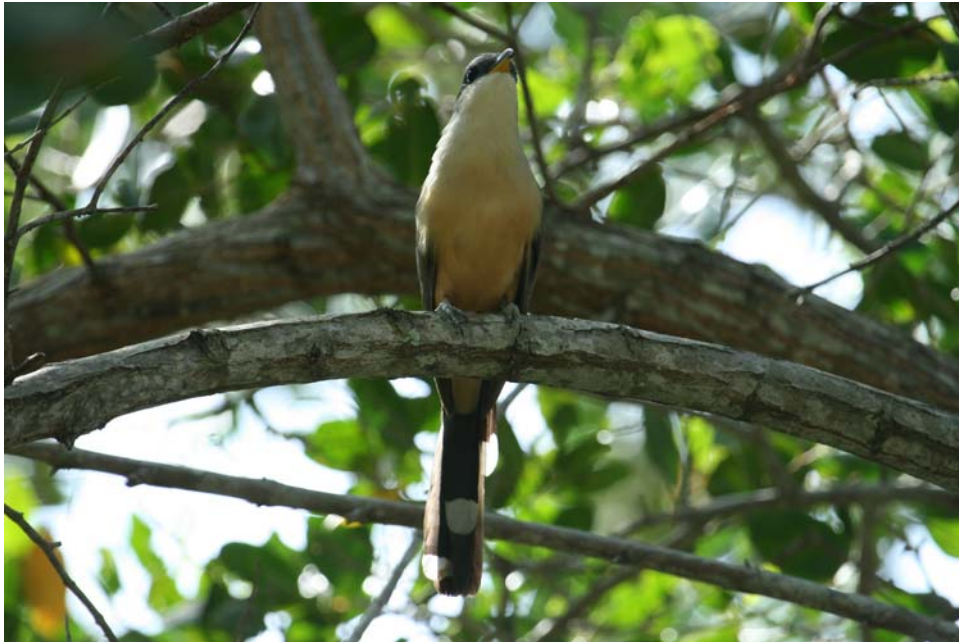
Mangrove Cuckoo. Tobago Plantations.

Tobago Plantations/Bamboowalk Hotel 27/3 1. Bon Accord Sewage Ponds 28/3 2.