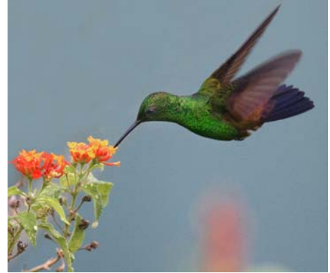
Copper-rumped Hummingbird.