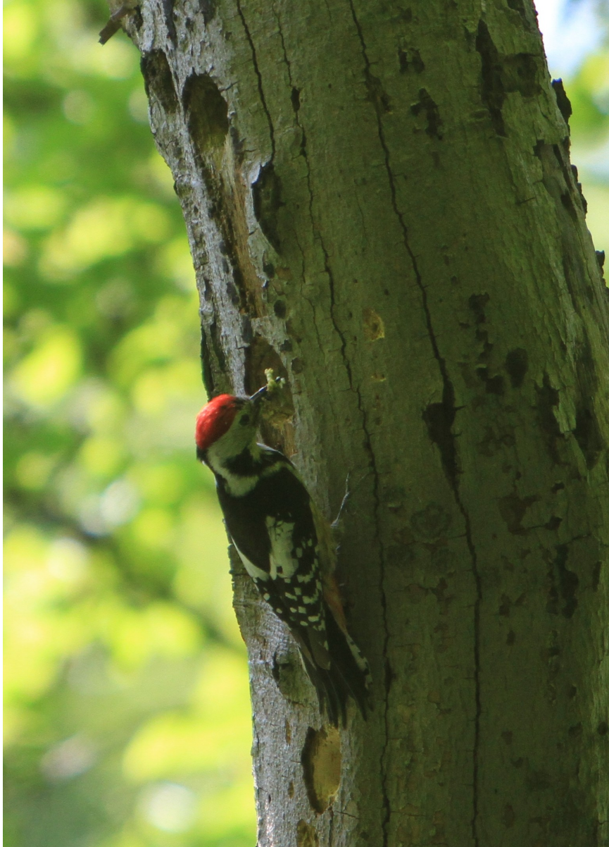
Mellemspætte Foto Jens

DOF Travel Dansk Ornitologisk Forening Birdlife Denmark John Speich