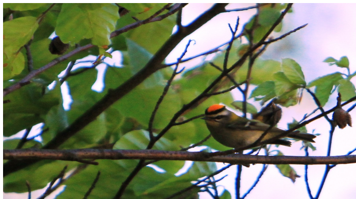
Rødtoppet fuglekonge

BRUN BJØRN ( Ursus arctos ) Friske spor ved Okres Gelnica