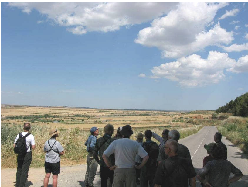
Figur 2. Stepperne syd for Lleida.

Vi startede i landsbyen Alfés og kørte rundt i nogle områder, der var beskrevet som en blanding af landbrug og stepper. Egentlig steppe så vi dog ikke meget af, og det var også begrænset, hvad vi så af steppefugle. Vi så bl.a. Lille Tårnfalk, Hedehøg, Rødhøne, Turteldue, Biæder, Hærfugl, Ellekrage, Blådrossel, Theklalærke og Rosenbrystet Tornskade.