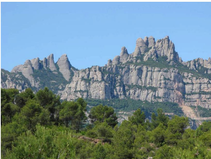
Figur 19. Frokostudsigten mod Montserrat.

Vi tog et langt stræk ned mod Barcelona ad store veje. Der var mange tunneler, hvoraf den ene var hele 5 km lang.