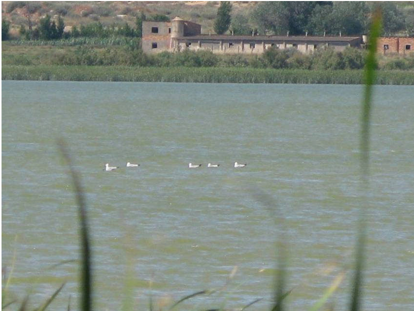
Figur 6. Audouinsmåger ved Laguna de Sariñena.

Så gik det via Huesca og Jaca nordpå til den lille by Siresa i Valle de Hecho (Ekkodalen), hvor vi ankom til hotel Castillo d'Archer kl. 20 og dér blev budt velkommen af overflyvende Ådselgribbe.