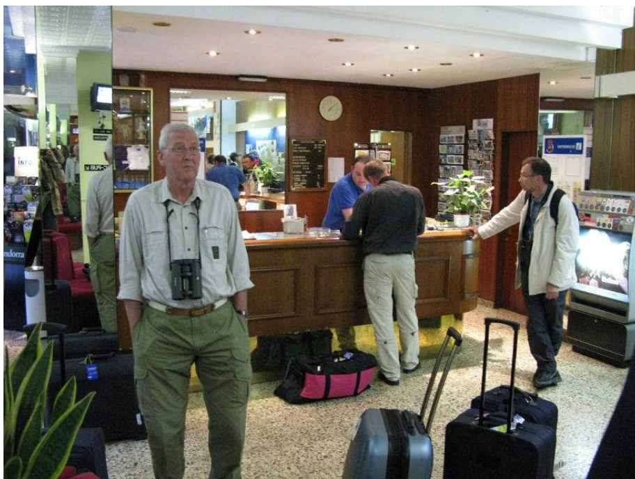
Figur 15. Vi var godt trætte, da vi ankom til hotel Solana.

Andorra er ret anderledes end de omkringliggende områder af Spanien og Frankrig. Det skyldes især, at lilleputlandet på størrelse med Bornholm er meget tæt befolket, og alt virker småt og sammenpresset. Der er dog også nogle flotte naturområder i bjergene.