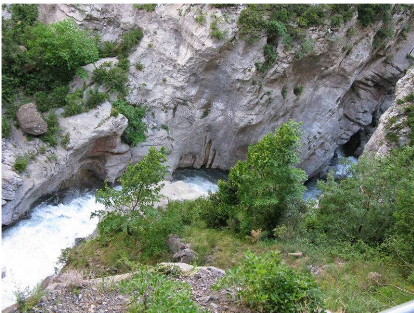
Figur 8. Rio Aragón ved "Helvedes gab".

Bagefter kørte vi ned til landevejen igen og helt ind til bunden af Ekkodalen. Vi kom bl.a. igennem det landskabeligt meget flotte sted, Boca del Infierno (Helvedes Gab), hvor dalen er meget smal og vandet i Rio Aragón derfor fosser meget hurtigt.