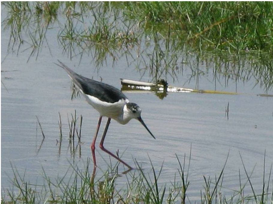
Figur 20. Stytløber ved Llobregat.

Vi fjumsede derfor rundt i en times tid inden det endelig lykkedes os at finde naturreservatet. Men så var det til gengæld også det hele værd!