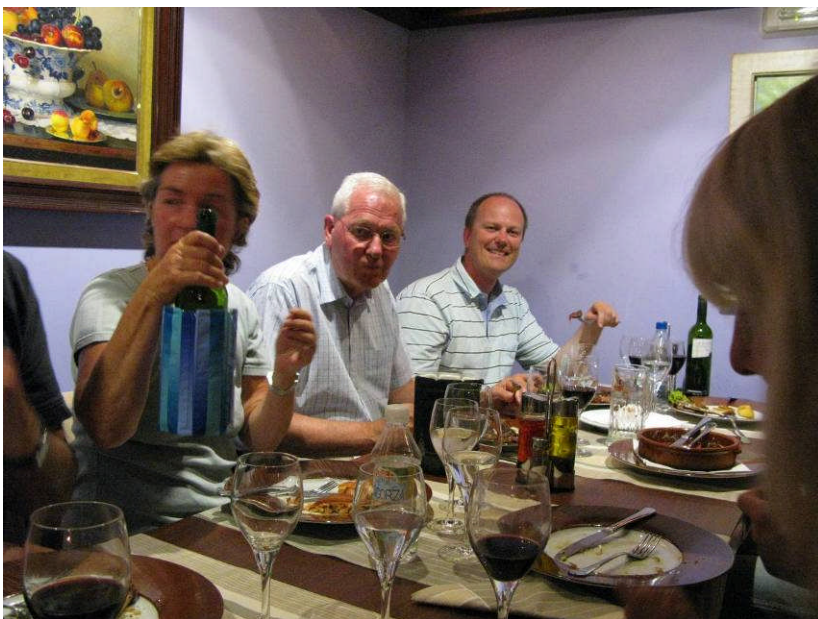
Figur 18. Afskedsmiddag i Arinsal.