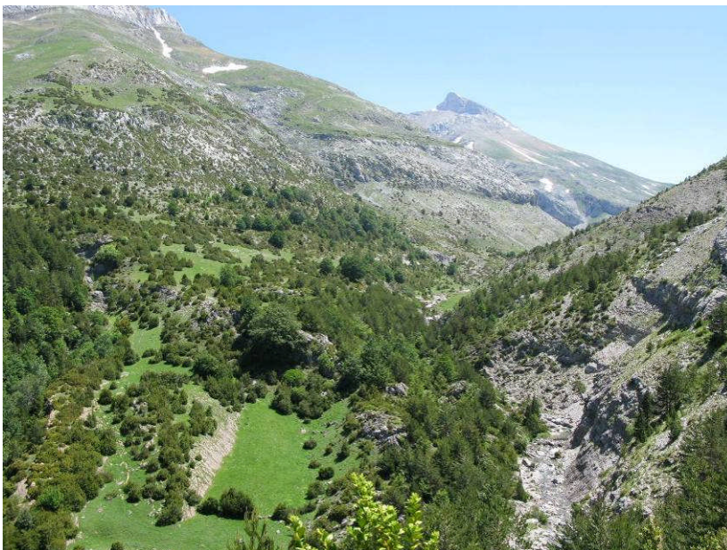
Figur 7. Op gennem dalen i Gabardito.

Hele denne dag brugte vi i Valle de Hecho. Der var afgang fra det hyggelige hotel kl. 8.20. Derfra kørte vi op til Gabardito, hvor vi var kl. 9-16. Vi parkerede ved huset for enden af vejen i ca. 1.400 meters højde og gik op igennem en dal til over trægrænsen i 1.600 meters højre. Det var et meget spændende område med mange fugle og planter. Det største hit, som desværre kun få var så heldige at se, var 2 Murløbere på stor afstand. Vi så desuden bl.a. Lammegrib 5, Ådselgrib 5, Gåsegrib 30, Slangeørn 1, Alpesejler 5, Vendehals 1, Stendrossel 4, Mestersanger 1, Bjergløvsanger 3, Rødtoppet Fuglekonge 6, Klippesvale 30, Alpejernspurv 2, Alpeallike 30, Alpekrage 30 og Citronsisken 4. Af de ret mange Gransangere, vi hørte på turen, lød ingen i øvrigt som den iberiske race/art, men helt "som almindelige danske".