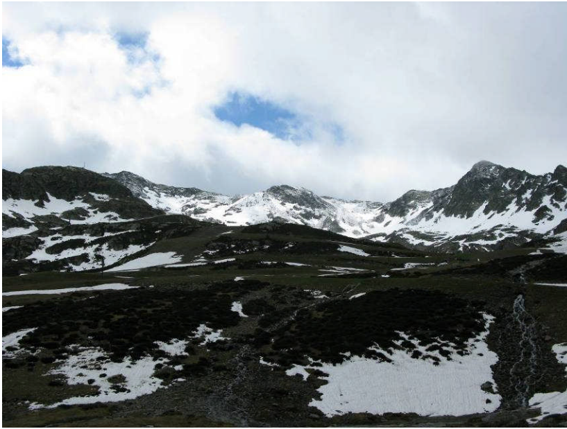
Figur 16. Der var koldt på toppen ved Port de Rat.

Frokosten indtog vi på en hyggelig lille kro Font Blanca nord for La Massana.