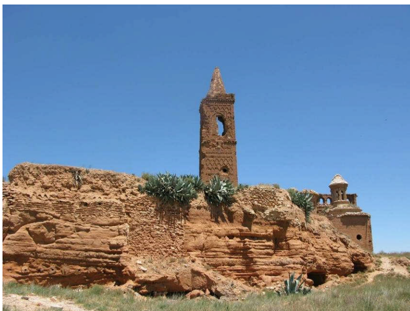
Figur 4. Ruinbyen Belchite med den udbombede katedral.