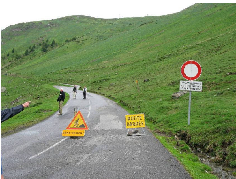
Figur 14. Vejen op mod Col de Tourmalet var afspærret.

Endnu en af turens bjergetaper. Vi skulle i løbet af dagen komme til slutmålet: Andorra. I bedste Tour de France stil ville vi køre fra Gavarnie op over passet Col du Tourmalet, men vi måtte desværre opgive, da vejen var afspærret på grund af jordskred og snerydningsarbejde.