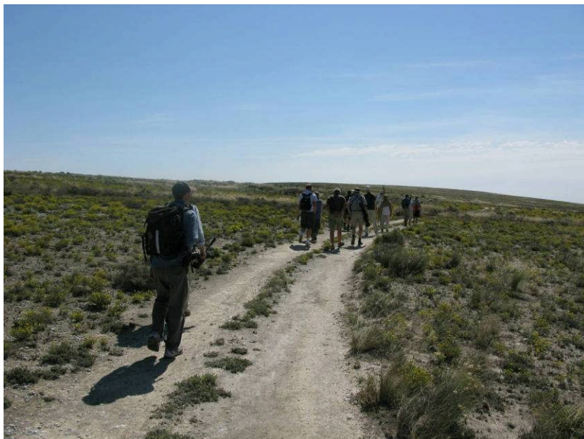
Figur 3. Stepperne nordvest for Belchite.

I første omgang så vi på lidt mere steppe nordvest for Belchite ved La Lomanza. Vi gik en fin tur over steppen og ind til et grusgravsområde kl. 10.45-12.30, hvor bl.a. Lille Tårnfalk og Stenspurv lod sig beskue. Der er tale om en ravine lidt nord for Codo, og vi startede ved en rastepads ud til landevejen med tavle og fugleinfo. Stedet er markeret med et skilt "Refugio de Fauna Silvestre de la Lomaza de Belchite". Ved rastepadsen havde vi fornøjelsen af 3 Slangeørne i opvisning.