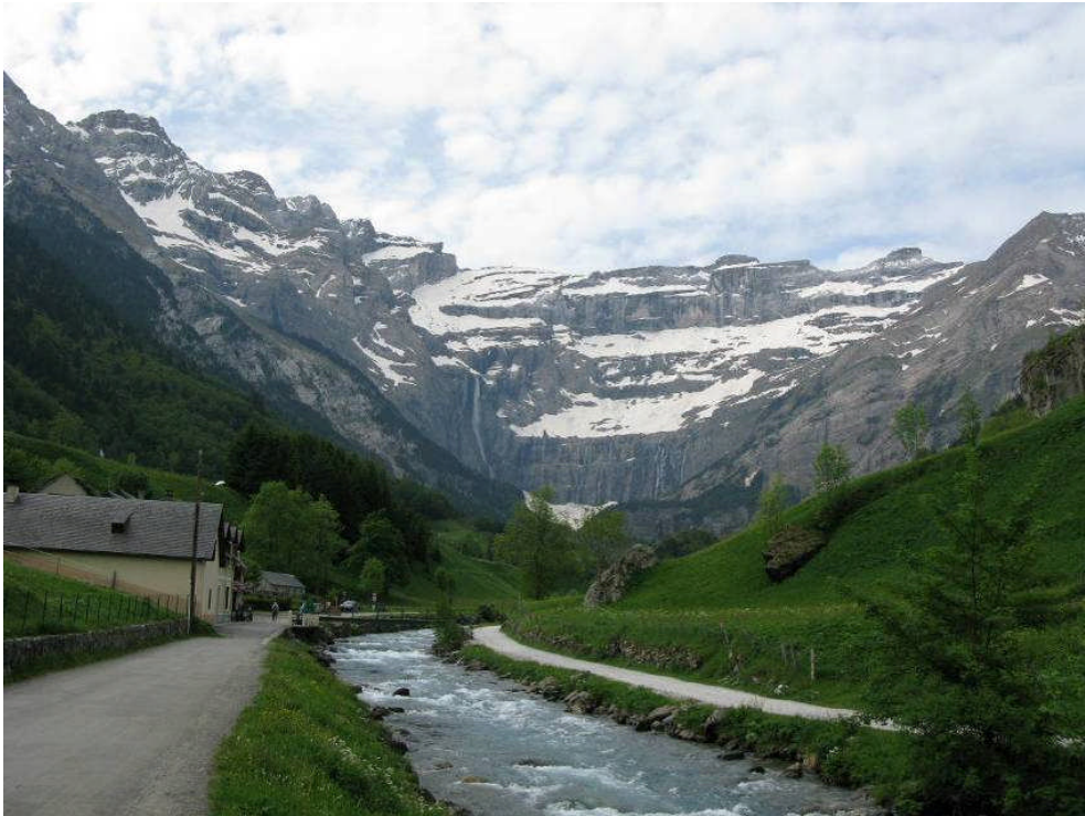
Figur 11. Den meget flotte halvcirkeldal Cirque de Gavarnie.