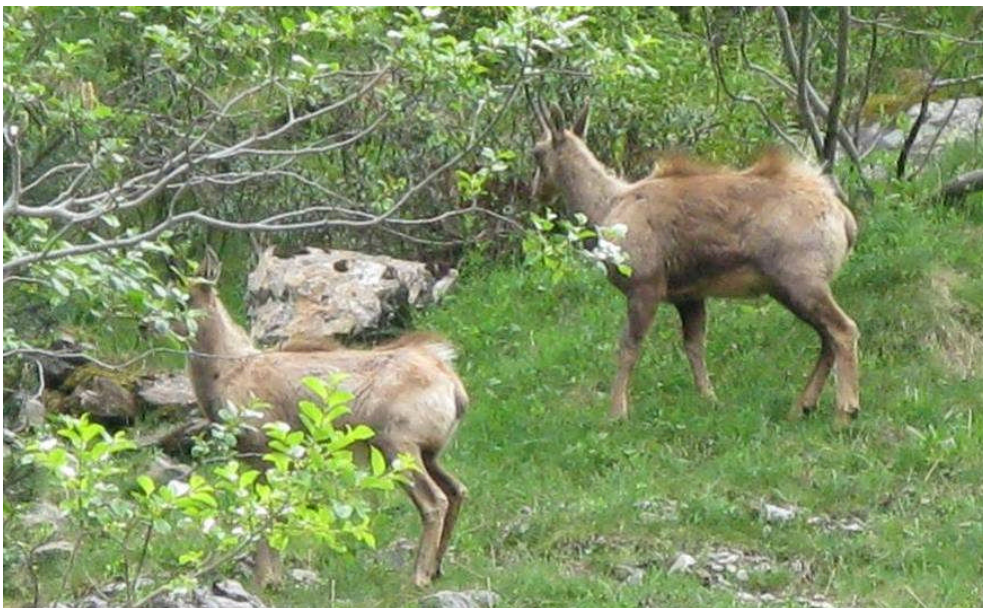
Figur 12. Gemser ved Gavarnie.

Oppe ved skistationen så vi bl.a. Lammegrib 3, Kongeørn 2, Bjergpiber 10, Bjergvipstjert og masser af Stenpikkere, og så konstaterede vi, at almindelig Jernspurv faktisk går ret højt op og kan ses og høres i områder, hvor man "kun forventer" Alpejernspurv.