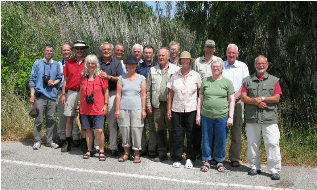
Figur 1. Deltagerne på turen.