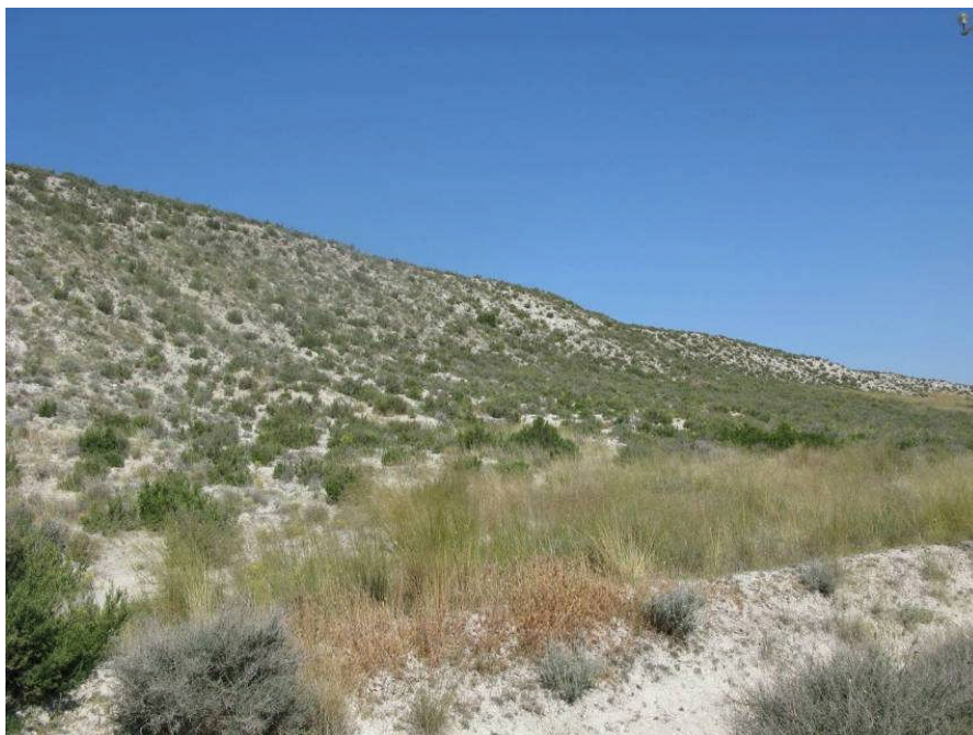
Figur 5. Maki nord for Osera og en fremragende lokalitet for Brillesanger.

Vi var i området fra kl. 10-12 og så bl.a. Kongeørn 2, Dværgørn 3, Hedehøg, Biæder, Turteldue, 11 Middelhavsstenpikkere, Brillesanger 10 og Rødhovedet Tornskade 5.