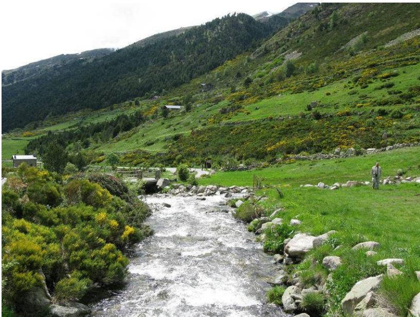
Figur 17. Den smukke, lune dal NØ for Soldeu.

Så gik turen videre til en blidere natur i en blomsterrig dal Val d'Incles, som ligger i det nordøstlige Andorra nordøst for Soldeu. Vi var ved at være mætte af oplevelser efter en uge i felten, og flere af os sad mest og nød udsigten og blomsterduften. Der var blandt andet fyldt med blomstrende gyveler. Vi var i området kl. 16-17.