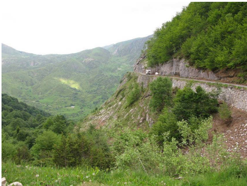
Figur 10. Passagererne talte om, hvor langt der var ned. Chaufførerne koncentrerede sig om at være længst muligt væk fra afgrunden.

Fantastisk at nyde frokosten i et Pyrenæer-landskab som dette!