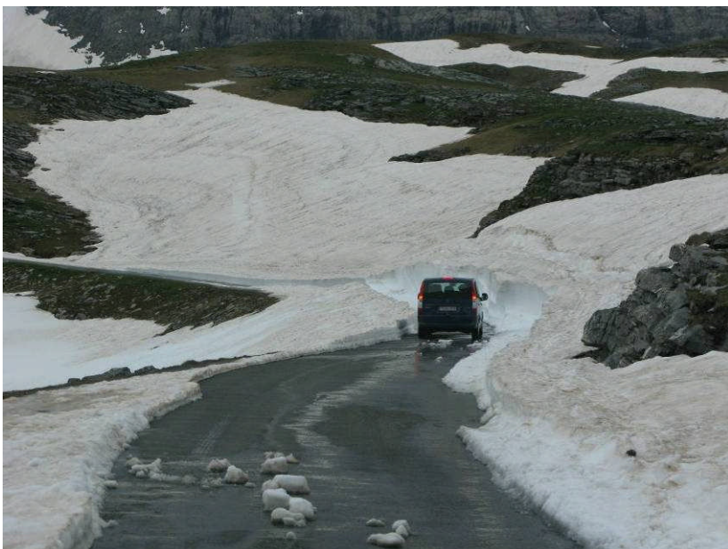
Figur 13. Ved Station de ski Gavarnie-Gèdre måtte vi opgive at køre videre på grund af sne.

Var retur ved hotellet kl. 19. Sidst på dagen kom der lidt skyer på himlen og om natten både tordnede og regnede det.