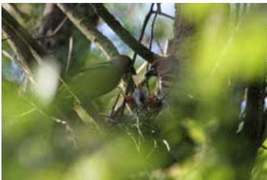
Kærnebider på rede med unger