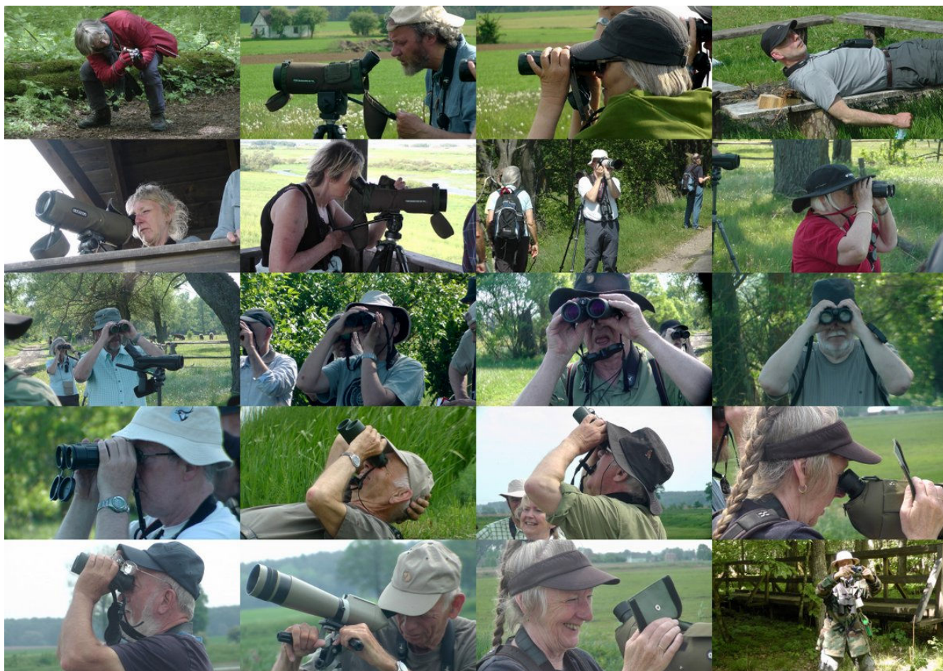
Nogle af de altid aktive deltagere