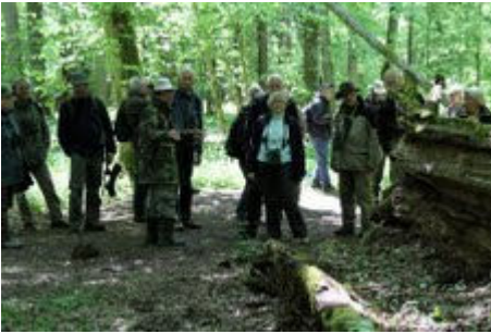
Besøg i Strict Reserve