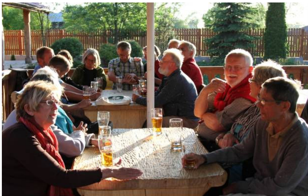
Hyggeligt var det !