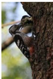
Hvidrygget spætte m unger