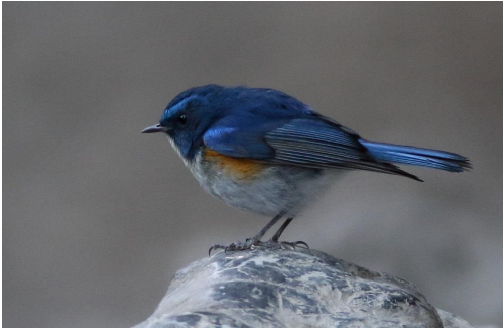
Himalayan Bluetail

Inden morgenmaden var der tur ved Nainital, for dem der havde lyst, og det havde næsten alle. Vi gik en tur af et lille spor langs kanten af vejen, til et mindre udsigtspunkt. Her var der relativt stille, men et par fugleflokke blev det til, en del Kalij fasaner og flere Himalaya blåstjerter blev set langs sporet. Der var dog flest fugle da vi kom ud igen lige bag de små boder. Her fouragerede flere Red-headed og Streaked Laughingtrushes sammen med Kalij fasanerne på madaffaldet fra boderne.