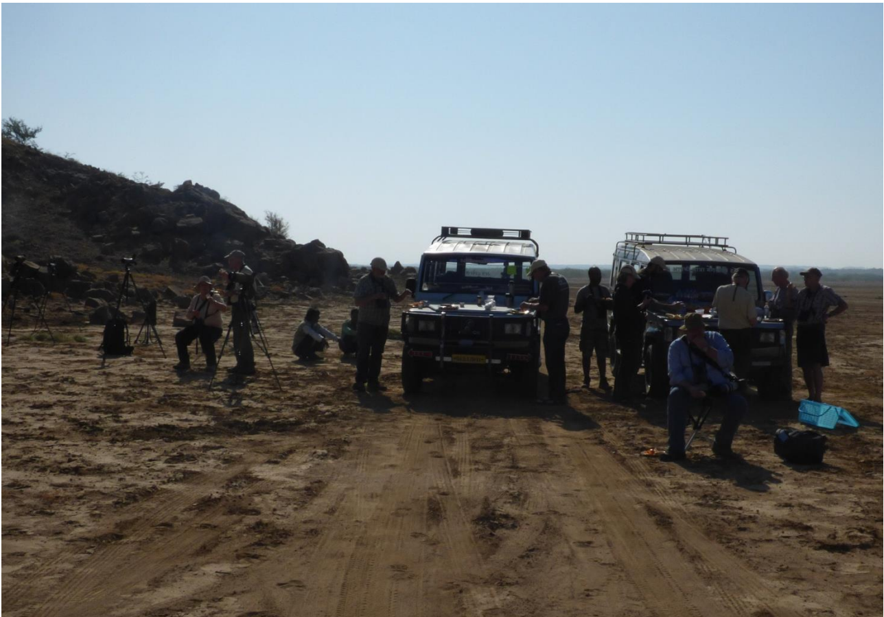
Morgenmad Greater Rann of Kutch