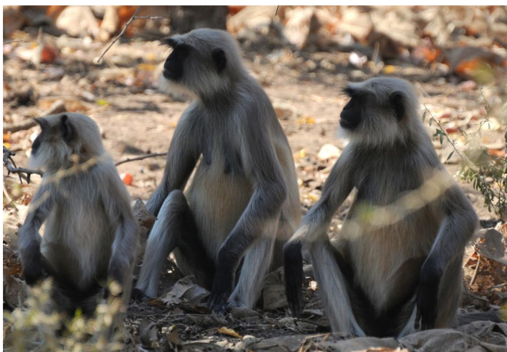
Northern Plains Langur Gir N.P.