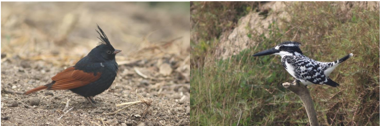
Crested Bunting/Gråfisker

Dagen startede med tæt tåge. Vi udskød afgang en lidt af denne grund og imellemtiden blev der tid til morgenmad og til at finde den Brown Hawk Owl, de fleste af kun havde fået glimt af aftenen før. Efter et stk. tids venten, blev vi dog enige om at prøve lykken ud i tågen, og vi kørte afsted mod Chambal River. Vi stoppede flere steder på vej mod Chambal River. Første stop var langs vejsiden, hvor der i buskskadset, var flere Baya Weavers, Brahaminy Starlings, men bedst var 3 Crested Buntings, som gav opvisning, så alle fik set denne spøjseværling rigtig godt, i denne omgang.