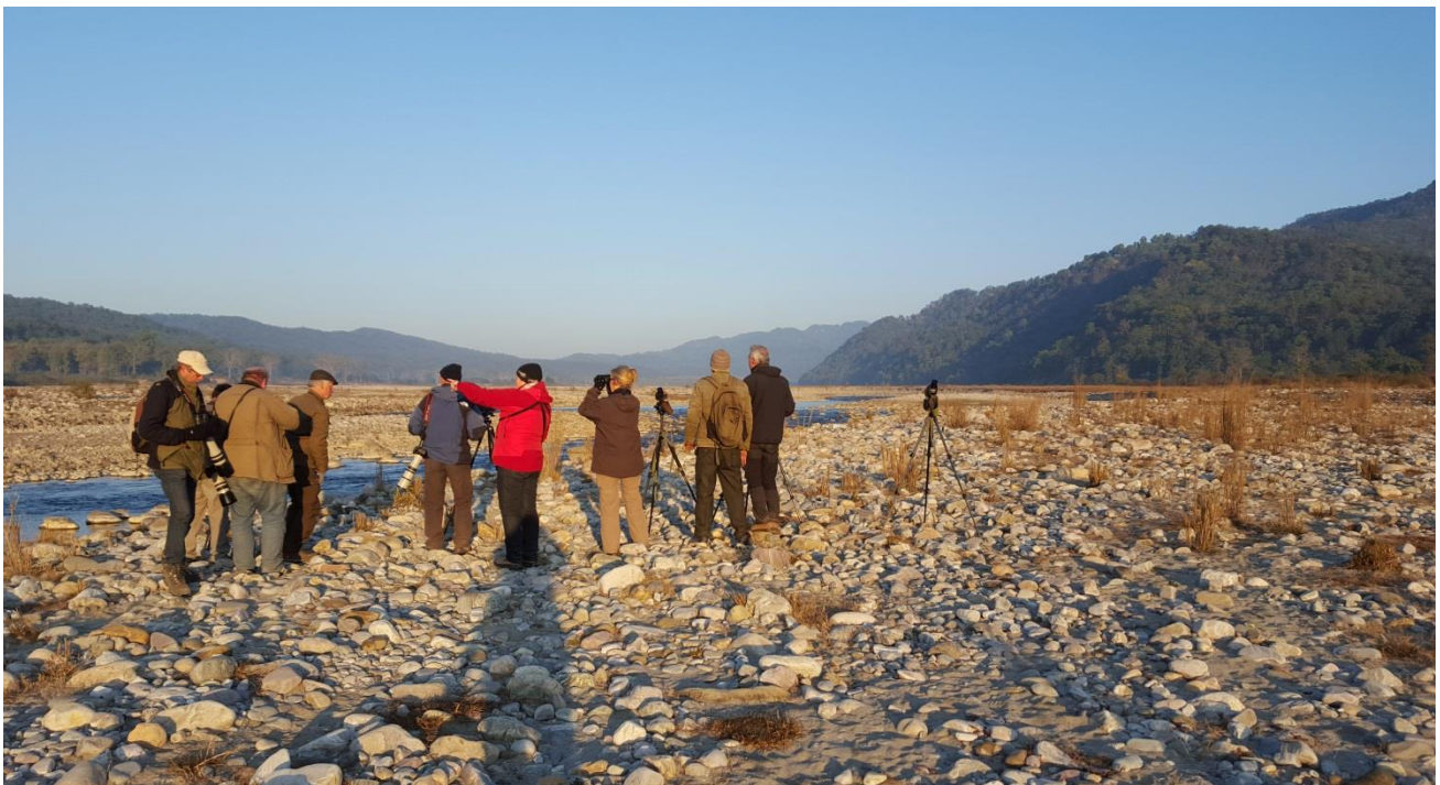
Eftersøgning af Ibisbill Kosi River

27/12 Afgang fra Kastrup via Wien til Delhi 28/12 Ankomst til Delhi 01.00 til hotel til ca. 07.00 afrejse med indenrigsfly til Ahmedabad. Ankomst Ahmedabad middag og Kørsel til Velavadar. Obs Velavadar eftermiddag og aften. 29/12 Velavadar morgen, kørsel til Gir, Ankomst til Gir Aften 30/12 3 Gamedrives i Gir National Park 31/12 Morgen gamedrive I Gir, Lang kørsel til Bhuj ankomst midt på aftenen. 1/12 Bhuj, Greater Rann of Kutch morgen og formiddag, Palmefugl buske, Steppe + Halvørken 2/12 Bhuj kørsel til Kysten aften besøg ved Reservoir 3/12 Kørsel fra Bhuj til Wild Ass Sanctuary, eftermiddag /aften Wild ass Sanctuary 4/12 Wild Ass Sanctuary hele dagen 5/12 Kørsel Ahmedabad fly til Delhi og sent aften tog fra Delhi til Nainital 6/12 Ankomst Nainital og tur til Sat Tal 7/12 Nainital tur til Pangot området 8/12 Nainital kørsel via Mongoli valley til Corbet 9/12 Dikhala for nogen og andre på tur langs Kosi River 10/12 Dikhala for alle ind- eller udtur 11/12 Kosi River eller Dikhala 12/12 Bijrani og tur ved gamle Camp Forktail, Aftentog mod Delhi 13/12 Taj Mahal og kørsel til Chambal river lodge 14/12 Heldagstur Chambal River 15/12 Tur til sump sydøst for river lodge og kørsel til Baratpur 16/12 Baratpur tur i Kaledo N.P. hele dagen 17/12 Specialtur til Chambalriver for Indian skimmer og kørsel Delhi for hjemrejse. På hotel inden afgang ca. midnat. 18/12 Hjemrejse via Munchen