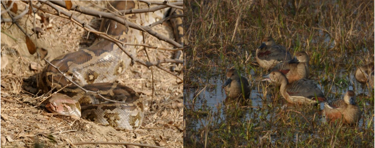
Indian Rock Python/Lesser Tree Duck

Vi trækker den stort set til solnedgang og vores ”rikshawksfører” må nærmest sprinte og trampe godt i pedalerne, for at nå det inde lukketid.