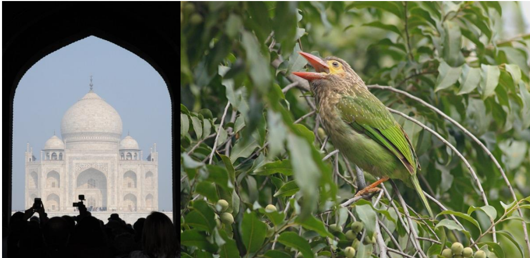
Taj Mahal/Brown-headed Barbet

Vi ankom lidt over middag og Conan havde sørget for at og at vi kunne starte opholdet med at sætte os til bords og indtage frokosten i hotelhaven.