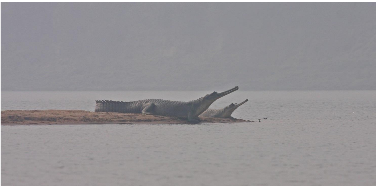
Gavialer Chambal River

Tilbage ved udgangspunktet, bliver vi på bredden til solen er gået næsten ned, inden vi returnere mod Chambal Safari Lodge.