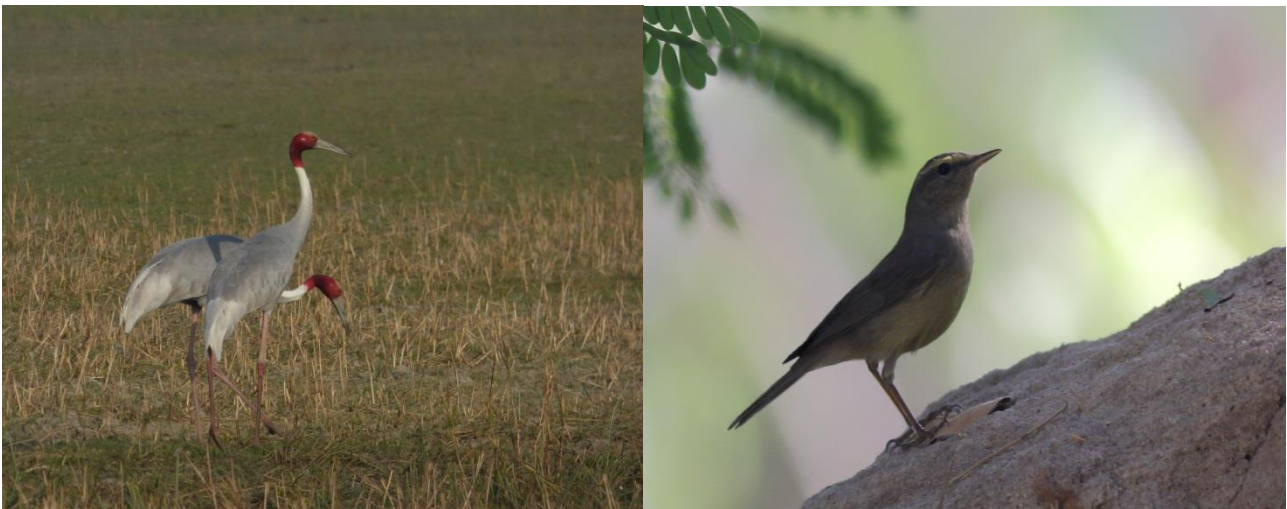
Sarus Traner/Sulphur-bellied Warbler

Vel tilbage var der sent aftensmad og den sidste fugleliste i Gujarat.