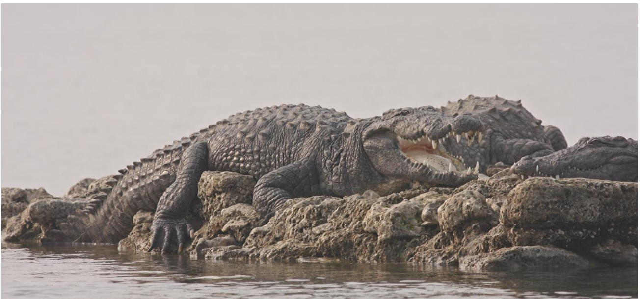
Mugger (Indisk Krokodille)

2/1 3-4 Kysten syd for Nakatrana (Bhuj),