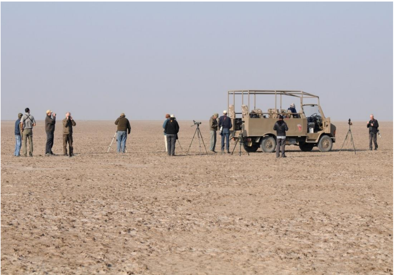
Little Rann of Kutch