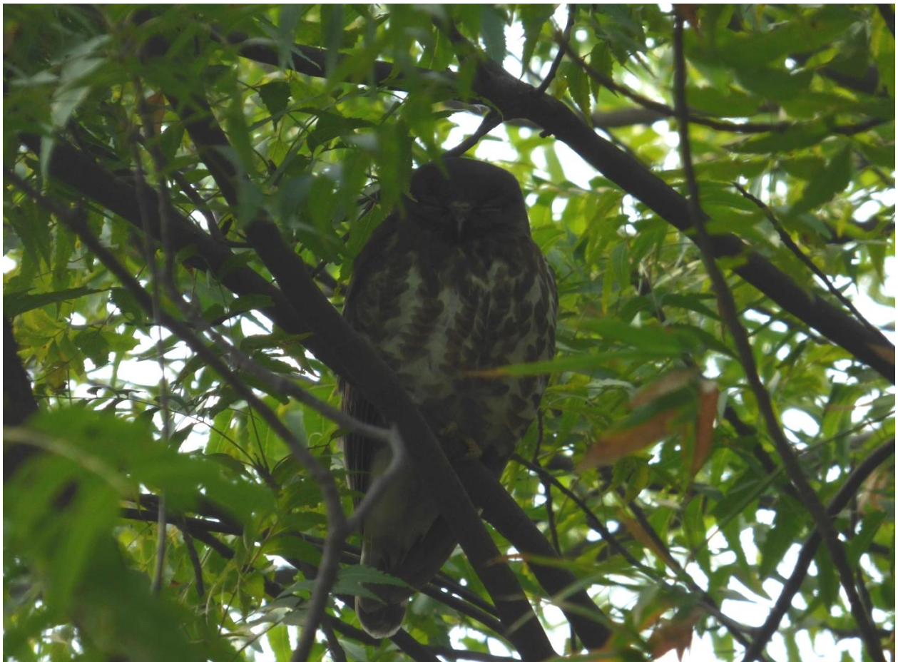
Brown Hawk Owl

Vi returnerer tilbage til Chambal Safari Lodge, med et enkelt stop undervejs, hvor vi lige scanner et flodløb for Skimmers, men igen er det nærmeste vi kommer nogle River Terns. Tilbage ved Lodgen er det tid til at pakke også engang frokost inden turen går mod Baratpur. Der bliver også lidt tid til at fotografere Brown Hawk Owl, der nu sidder i rigtig fint lys, næsten lige ved siden af vores udendørsbuffet.