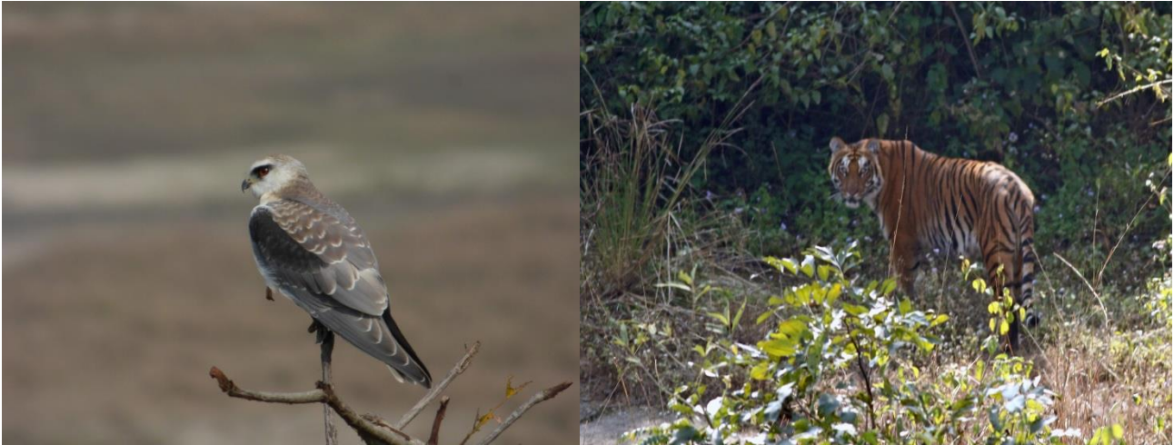
Blå Glente/Tiger

Succesen var i hus, nu var der glæde og turen tilbage mod gaten og Riverview Retreat, kunne forgå noget mere afslappet, og det skulle vise sig ikke, at blive den sidste tiger for dagen ☺