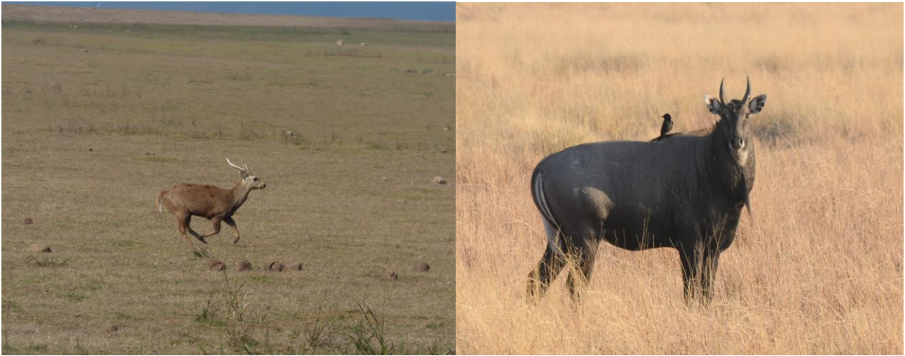
Hog Deer/Nilgai

Sanctuary, 13/1 1 Taj Mahal-Chambal River lodge, 14/1 4 Chambal River Reserve, 15/1 15 Sumpområde NØ for Chambal River Reserve, 16/1 40+ Khaledeo Nature Reserve (Barhatpur),