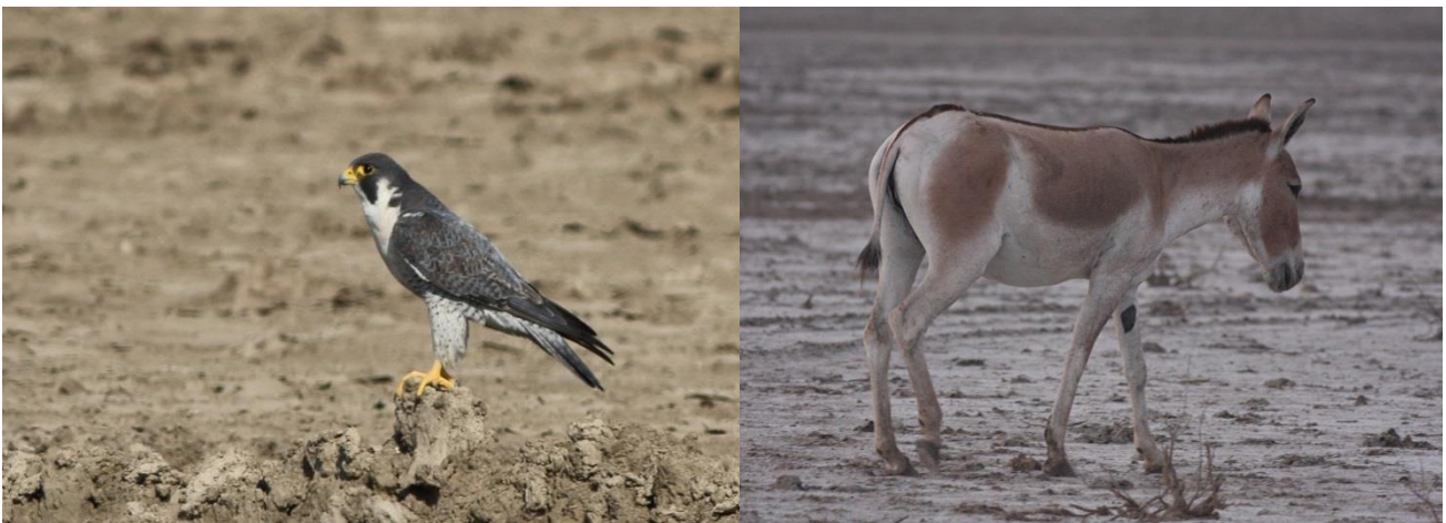
Vandrefalk/Indian Wild Ass

Vi vendte snuden tilbage på tværs af steppen mod campen og mest mindeværdige obs. var en næsten gammel Kejserørn, der sad ved en lille pæl, som måske var en lille ”vandpost” ? Men igen en meget tillidsfuld fugl, der gav fine obs.