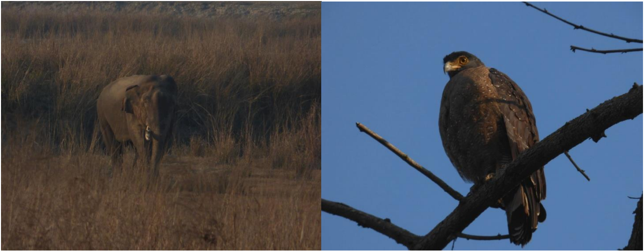
Elefant Han/Crested Serpent Eagle

Efter vi havde fået vores værelser, var det tid til en tur på Elefantryg ud over steppen for at lede efter Tiger. Vi havde dog ikke det store held med tiger. Til gengæld var der en gammel vild han elefant der var meget interesseret i de hun elefanter vi red på. På et tidspunkt synes vores elefantfører også at den blev lidt for nærgående og vi fortrak planmæssigt tilbage over floden og tilbage mod campen ved Dikhala.