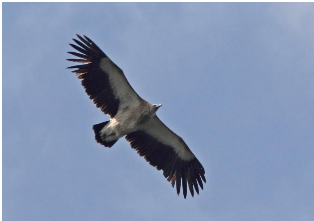
Himalaya Grib