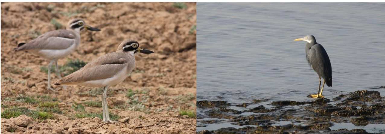
Great Thick-knee og Revhejre Bhuj

Vi ankom til kysten lidt efter solopgang og startede med at gå mod øst der var godt med Store Sorthovedet, Brunhovedet og Tyndnæbbet Måger, Rov-, Bengalske og Sandterner og en del vadere. En fin flok Great Stone Curlew stod også og krøb sammen på stenrevne, men der var ingen Krabbeædere at se, og til sidst havde vi det meste af kysten i sigte fra en høj klit. Men det virkede desværre ikke til, at der var Krabbeædere på stranden denne dag. Vi gik tilbage mod bilerne og prøvede længere mod vest langs kysten, stadig ingen krabbeædere, men til sidst havde vi held med at finde en lille flok Kæmperyler (Store Islandske), der fouragerede i vandkanten, men altså ingen Krabbeædere til os idag. Men vi havde dog alle en fin morgen med mange, Hejre, måger, terner vadere og udover de allerede nævnte, også Ørken og Mongolske Præstekraver, Tereklire m.m.