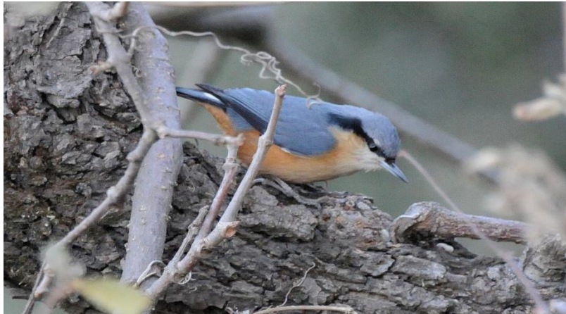
White-tailed Nuthatch

Herfra skal lyde endnu et tak, for en fantastisk tur, med et fantastisk hold af glade DOF-travel deltagere ☺