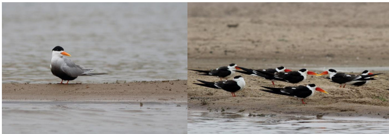
Black-bellied Tern /Indian Skimmer

På tilbage turen tog vi endnu et kik på flokken af skimmers og det blev knipset endnu flere billeder og vi kunne med sindsro sætte kursen mod Delhi.