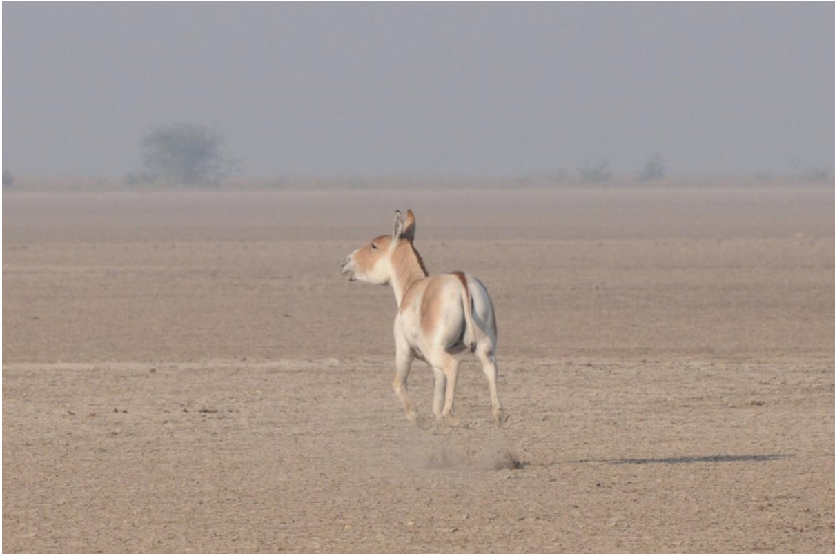
Asiatic Wild Ass