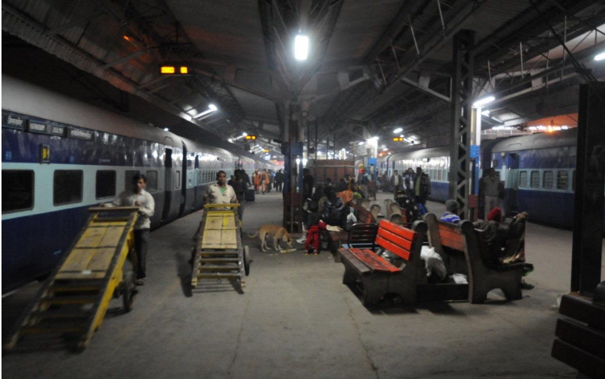
Delhi Railwaystation

Inden længe trillede vores tog til perronen. Vi fik vores liggepladser og afsted gik det i nattemørket mod Nainital.