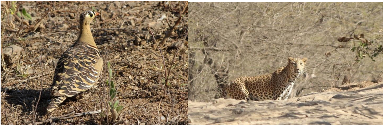
Painted Sandgrouse/Leopard

Anden tur før Frokost gik på lignende vis, den heldige Jeep fik en Leopard på vejen, vi andre måtte nøjes med advarsels kaldende fra langurerne og Axis hjortene, men diverse fugle var fin plaster på såret. Sene morgen madpakker blev indtaget ved det store vand reservoir her var desværre ingen løver eller leopard at se, til gengæld de første Slangehalsfugle, Great Thick-knee, White-bellied Dronge, Oriental Honey buzzard og da vi kørte derfra, fik vide mest fantastiske obs. af et par skulkende Painted Sandgrouse, som vist ikke er set bedre nogensinde ☺