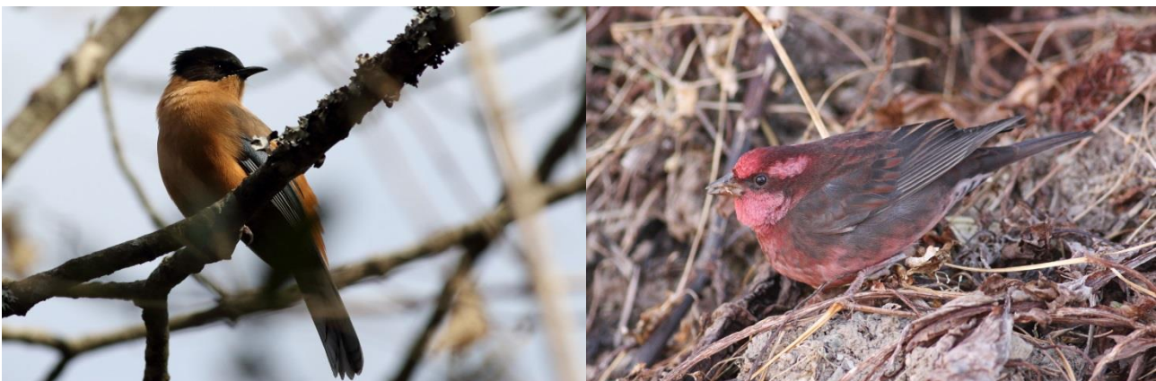
Rufous Sibia/Dark-breasted Rosefinch

Nu var der mere ro på til at nyde morgenmaden og de opstigende Himalayagribbe, dertog den langs bjergkammen. Herefter fortsatte vi til fods langs vejen og bjergkanten, ind i de mere skovklædte områder og det blev til flere Koklass og Kalij Fasaner, der dog hurtigt tog flugten ved synet af os. Småfugleflokke med mejser og sangere. Ikke mindst White-tailed Nuthatch og den lille flotte Black-faced warbler tog kegler. Men også Brown-fronted Woodpecker, flere Rufous Sibia og det lykkedes os at finde et par drosler, desværre var det Mistel og ikke en af dem med mere gylden karakter.