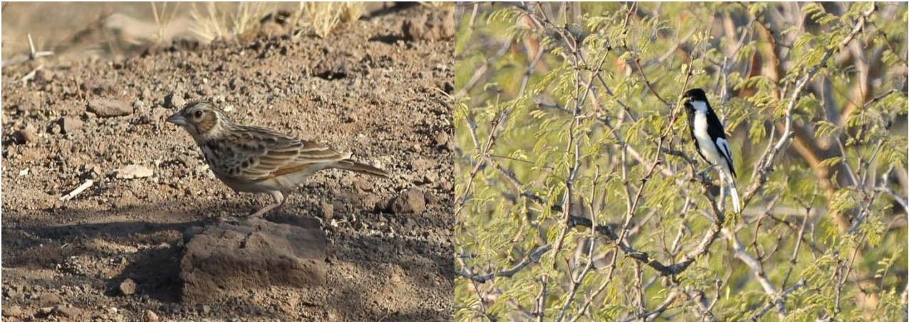
Indian Bushlark/White-napedTit

Tilbage til hotellet til en lidt mindre prangende aftenbuffet end dagen før, men den søde dessert og kaffe faldt på et tørt sted. Fuglelisten klarede vi også og det afsluttede endnu en dag, med mange fine specialiteter og rigtige fine obs. af de fleste.