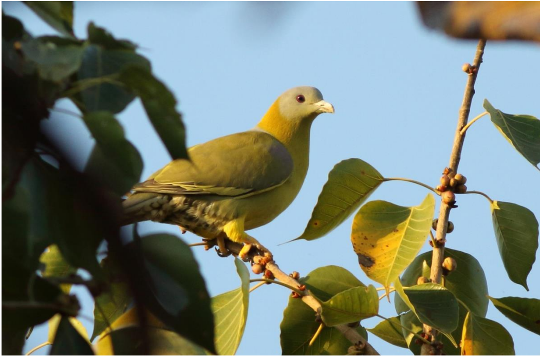
Yellow-footed Green Pigeon

Anden tur før Frokost gik på lignende vis, den heldige Jeep fik en Leopard på vejen, vi andre måtte nøjes med advarsels kaldende fra langurerne og Axis hjortene, men diverse fugle var fin plaster på såret. Sene morgen madpakker blev indtaget ved det store vand reservoir her var desværre ingen løver eller leopard at se, til gengæld de første Slangehalsfugle, Great Thick-knee, White-bellied Dronge, Oriental Honey buzzard og da vi kørte derfra, fik vide mest fantastiske obs. af et par skulkende Painted Sandgrouse, som vist ikke er set bedre nogensinde ☺