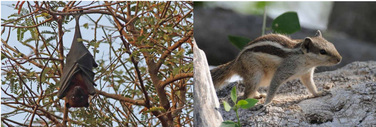
Indian Flying Fox/Five Striped Palm Squirrel

28/12 5 Velavadar, 29/12 5 Velavadar, 30/12 5+ Gir N.P., 31/12 10+ Gir N.P., 1/1 1 Vest for Nakatrana (Bhuj), 2/1 1 Steppen sydvest Nakatrana (aftentur) (Bhuj), 4/1 30+ Wild ass Sanctuary, 12/1 5+ Bijrani, Corbet, 13/1 5+ Taj Mahal-Chambal River lodge, 14/1 4 Chambal River Reserve, 16/1 20+ Khaledeo Nature Reserve (Barhatpur),