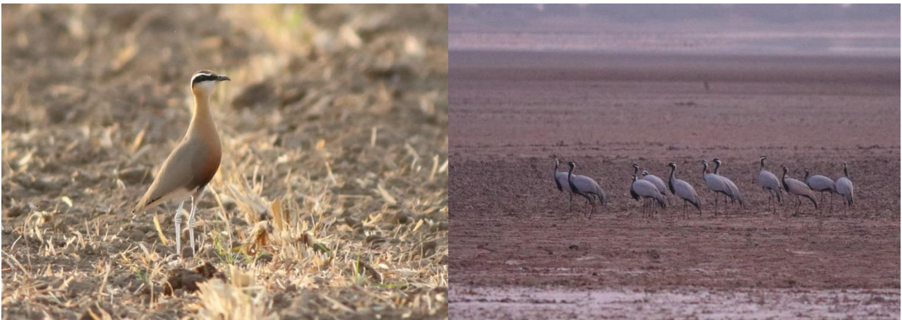
Indian Courser/Jomfrutraner, Wild ass Sanctuary

Vel fremme ved Wild Ass Sanctuary, blev vi hurtigt fordelt i vores små hytter, inden det var tid til en sen frokost.