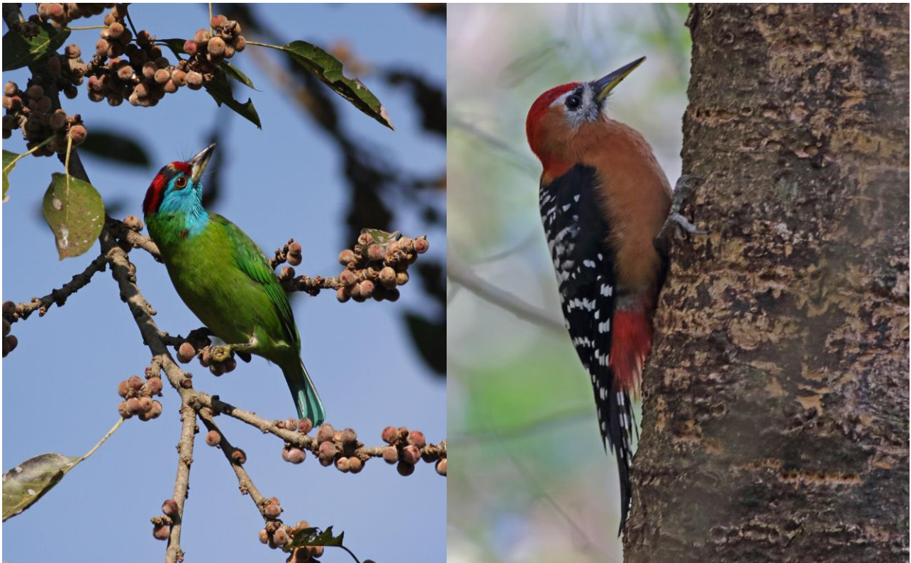
Blue-throated Barbet/Rufous-bellied Woodpecker