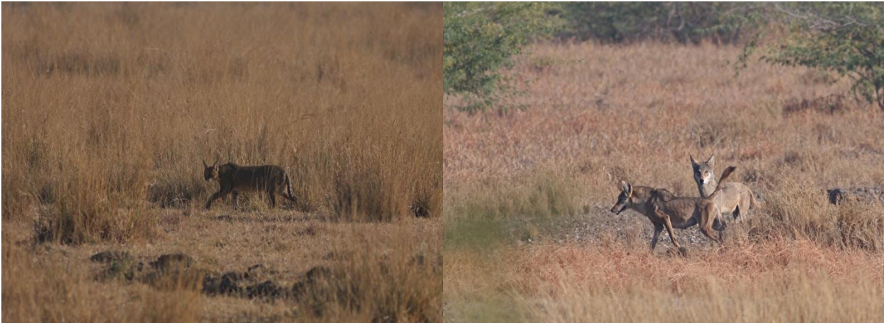
Jungle Cat/Indian Wolf

Vi startede tidligt med Morgenmad, som vist ikke var helt kommunikeret med personalet, men det gik, og efter et stykke tid var alle velforsynet til en morgentur på Steppen. Vi kørte i andet område end aftenen før. Her var flere rovfugle med bl.a. Hedehøge, Steppeørn, Stor Skrigeørn og ved et lille vandhul kom lærker med mere, til for at drikke og mellem de mange Kortåede Lærkerfandt vi et par Sykes lark ☺ Efter et stykke tids videre kørsel, dukkede en fin Junglecat op som blev set rigtig fint og yderligere et lille længere stykke fremme, kom der så 3 langbennede ”steppeulve” frem fra deres skjul. Vi fik en kanon obs. af de prægtige dyr, som så ud til at have umådelig god tid ☺