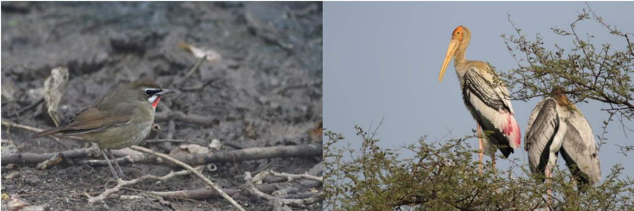
Sibirian Rubythroat/Painted Stork

Der var god tid til morgenmad på hotellet, vi skulle alligevel vente på, at dels at reservatet åbnede og tildels at den efterhånden obligatoriske morgentåge lettede. Den var dog knap så massiv, som de foregående 2 dage. Vi blev afhentet i ventende "cykelrikshawks" og blev transporteret de få hundrede meter til gaten. Conan klarede bureaukratiet ved gaten, mens vi andre slappede af i "rikshawksene". Papirarbejdet var relativt hurtigt klarer og vi kunne forsætte til første stop, som varen nærmest ventende Sibirian Rubythroat, ved et lille vandhul ca. 1 km fra gaten. Ikke et øje var tørt efter vi havde nydt den lille juvel. Vi forsatte med at lede efter drosler ved opsynsmændenes boliger, dog uden det helt store held. Længere inde i parken havde vi mere held med os og det bugnede med hejre, storke, ænder, vadefugle, vandhøns, skaver, m.m. og det lige langs med vejende i reservatet.