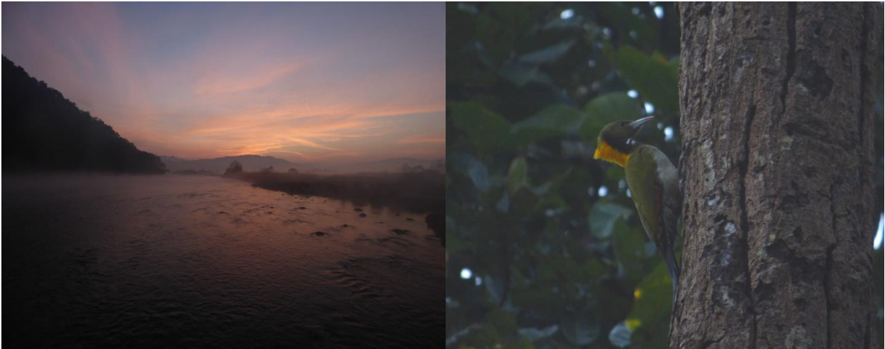
Solopgang Dikhala/Greater Yellonape

Ved middagstid satte vi så kursen mod den ventende vegtariske buffet ved Dikhala, som man efter et par dage kender til bunds og det bliver nok aldrig den der gør, at man ønsker at vende tilbage 😊