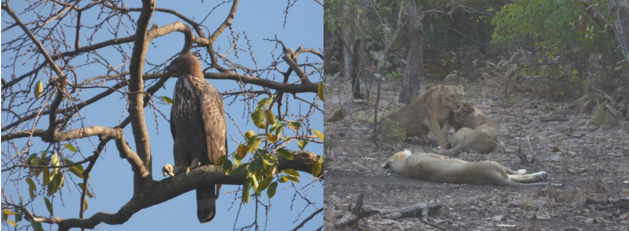
Crested Hawk Eagle/Asiatisk Løve

Men en fin dag fik sin ende, med aftensmad og fugleliste i Campen. Igen var der mange højdepunkter og se tilbage på, med Løver, Leopard (for nogen) og Painted Sandgrouse, Ugler m.m.