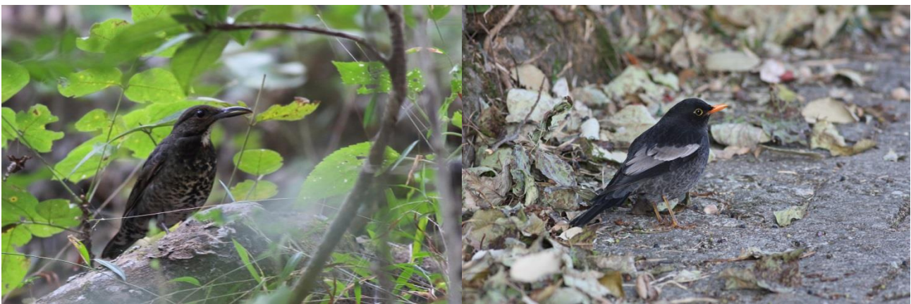
Longbilled Thrush/Grey-winged Blackbird

Eftermiddagens tur gik op langs floden og en tur op til den gamle Camp Forktail Creek. Der fik igen obs. af Chestnut-headed Tesia, Grey-winged Blackbird, Long-billed Thrush, Snowy-browed Flycatcher, Small Niltava og enkelte fik også et glimt af den superskulkende Scaly-breasted Wren Babbler. Vi sluttede obsen i Ritish have, men der var desværre ingen Himalayan Rubythroat at finde.