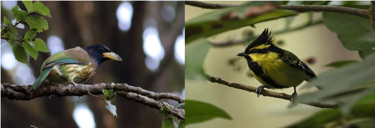
Great Barbet/Black -lored Tit