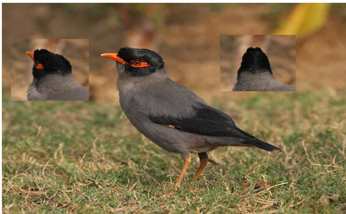
Bank Myna

Vi ankom til det sidste hotel lidt for det blev mørkt. Det lå i udkanten af Delhi og ikke langt fra lufthavnen. Her havde vi god tid til at pakke og evt. pakke om og gøre os klar til flyveturen hjem. Inden aftenmaden mødtes vi i baren skålede afsked med Conan og kunne se tilbage på 3 fantastiske uger i NV-indien med mange gode oplevelser både på pattedyrs og fuglefronten og takkefor en vel tilrettelagt tur, der stort set klappede på alle fronter. Afskedsmiddagen blev indtaget i restauranten også var vi klar til en sen afgang til lufthavnen.