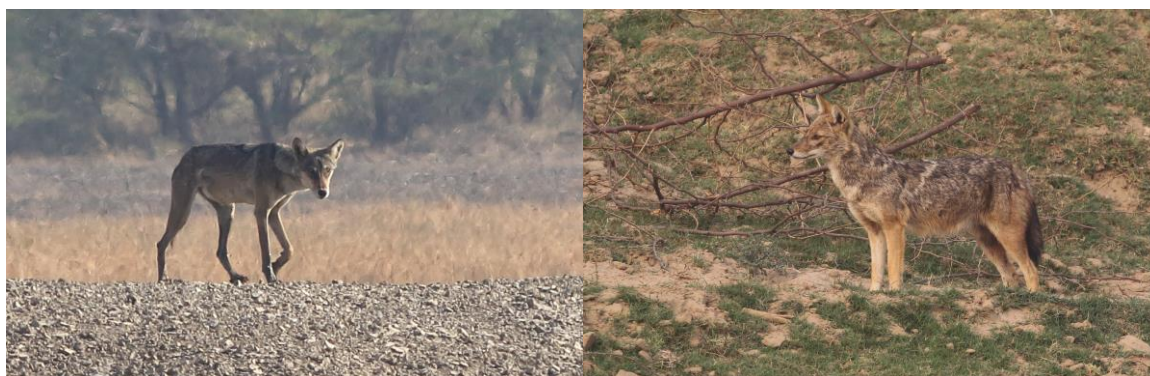
Indian Grey Wolf/Golden Jackal

29/12 1 Velavadar, 29/12 1 Velavadar-Gir, 31/12 2 Gir N.P., 2/1 8-9 steppen sydvest Nakatrana (Bhuj), 4/1 1 Wild ass Sanctuary, 10/1 2-3 Dikhala, Corbet, 12/1 2 Bijrani, Corbet, 14/1 4 Chambal River Reserve, 16/1 5+ Khaledeo Nature Reserve (Barhatpur).