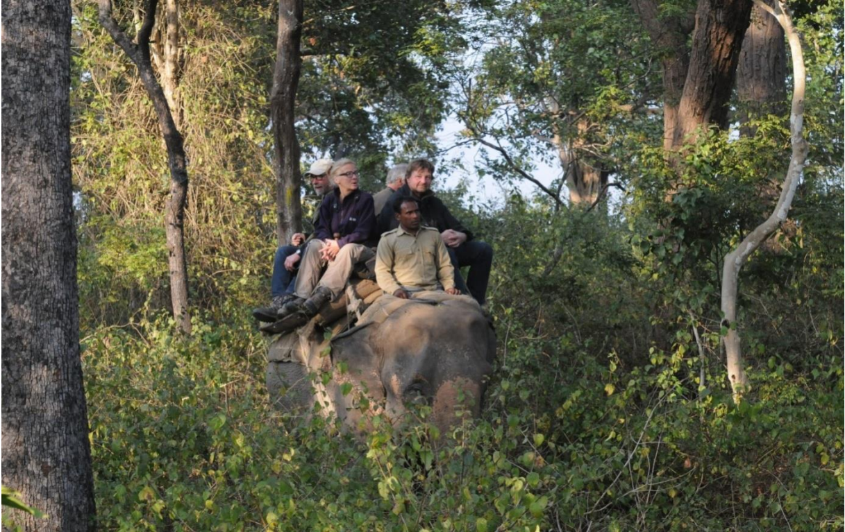
Elefantridt med Tawny Fish owl og knurrende Tiger

Der var endnu engang vegetarisk buffet på det lille cafeteria til aftensmad og fugleliste med lommelygte i det sparsomme lys.