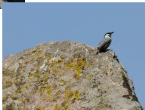
Billede 6: Klippespætmejse

Bussen hentede os kl. otte, og første stop var ved Kavaki, der igen gav pote med Blådressel som ny turart. Videre mod den lille by Stipsi, hvor bussen satte os af i den forkerte ende af byen, hvilket lige gav en ekstra km. til vores fem km's gåtur. Turen var varm, og der var nogle gode stigninger på den stenede "vej" men det var alle anstrengelserne værd. Fantastisk natur og gode nye arter, som Hvidskægget sanger, Sørgemejse, Klippespæt-