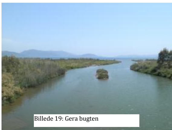
Billede 19: Gera bugten