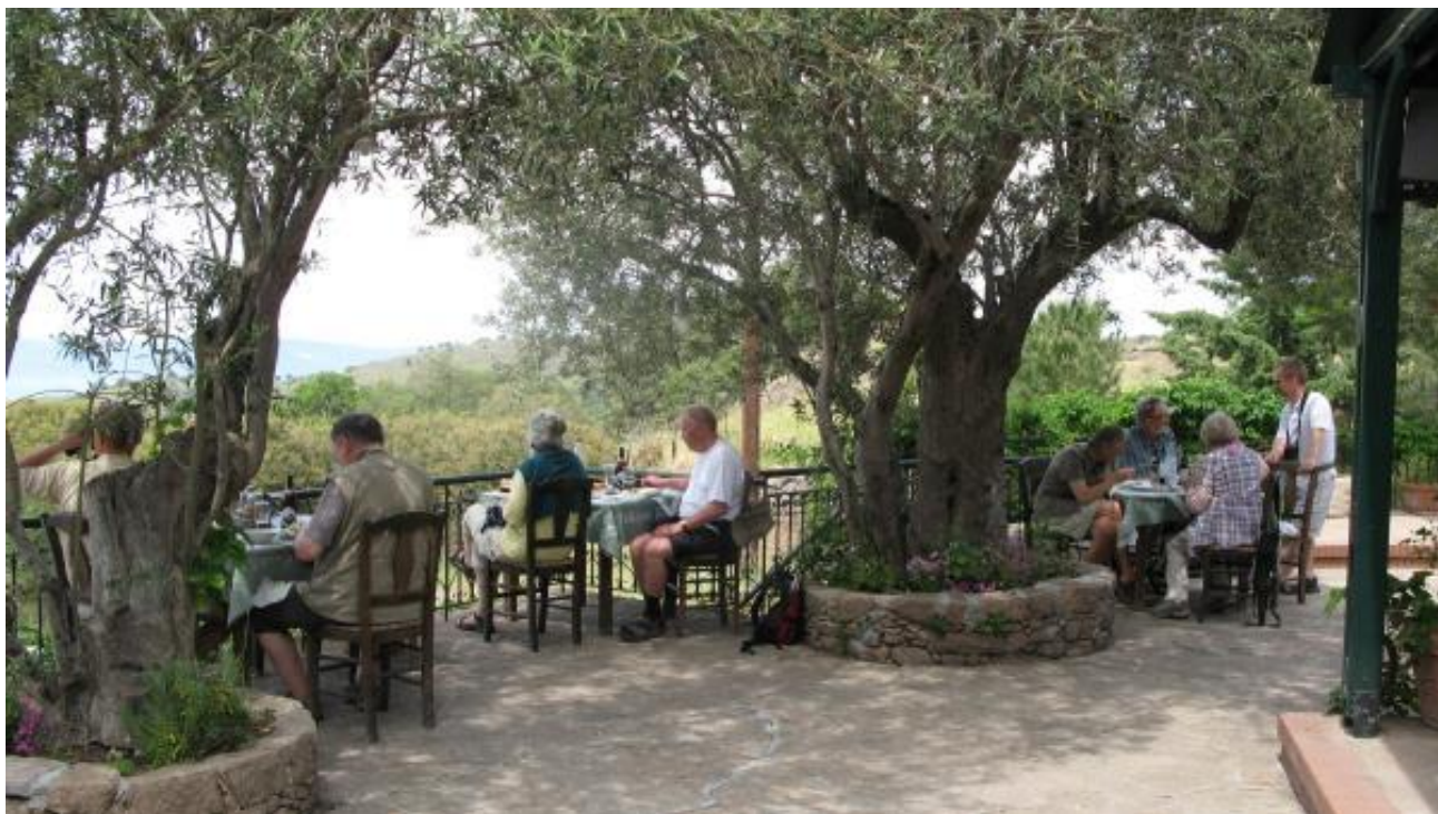
Billede 7: Den hyggelige taverna i Vafios

Videre i bus til Skala Sikamineas, hvor et kort besøg i den hyggelige havn gav både Kuhls- og Ægæerskråpe. Da vi havde fået samling på isspisende og kaffedrikkende deltagere, kørte vi mod vandreservoiret ved Rahona ikke langt fra hotellet. Et stop bogstaveligt talt midt på vejen, gav den første Eleonorafalk. Rahona viste sig at være en fin lille lokalitet med et frodigt lille vandløb, der gav nye arter som Cettisanger, Sortstrubet Bynkefugl og tre vadefuglearter.