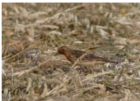
Billede 16: Rødstrubet Piber

kunne nyde tre eksemplarer af denne prægtige fugl i fuldt sommerornat.