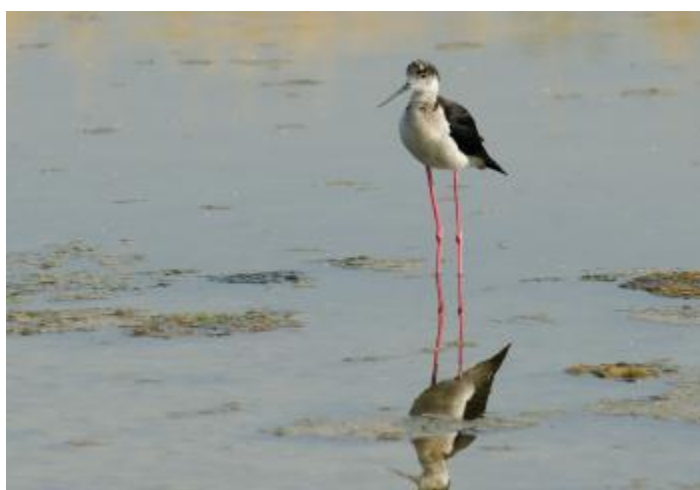
Billede 15: Stylteløber

Ingen vind fra morgenstunden, men de sædvanlige 17°, og overskyet med småbyger frem til kl. 13. Derefter gik vinden i syd, det blev lidt varmere og efterhånden helt skyfrit.