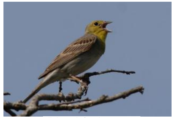
Billede 8: Gulgrå Værling