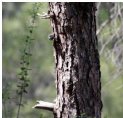
Billede 3: Krüpers Spætmejse

Gåturen endte i Vafios, hvor en velfortjent frokost blev indtaget på tavernaen, med underholdning af Hvidskægget sanger og Rødrygget Svale.