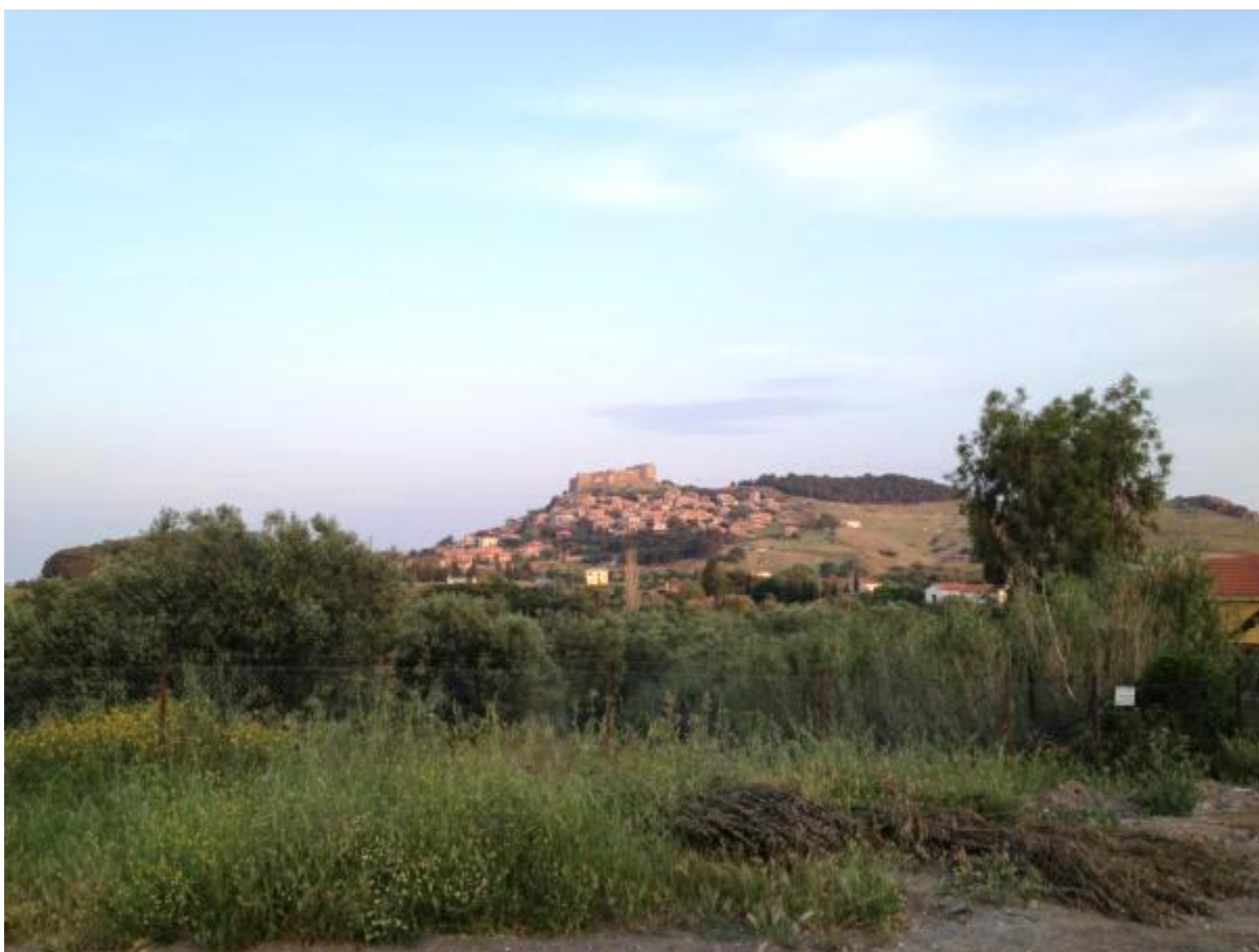
Billede 1: Molivos i morgenlys