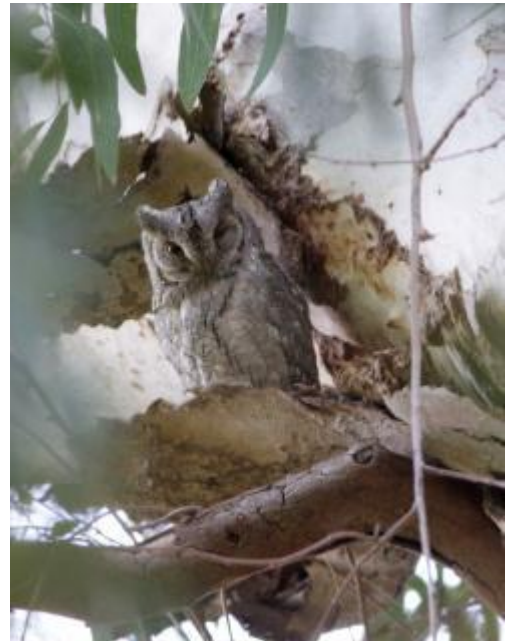
Billede 12: Dværghornugle