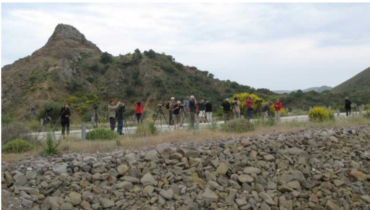
Billede 14: Dæmningen Pithariou nord for Skala Eresou

Vores fantastiske chauffør overraskede ved, af egen drift, at køre ad en lidt dårlig grusvej helt op på dæmningen. Her var pænt med rovfugle. En "Høgeørn" der blev til en Slangeørn og en "Aftenfalk" der blev til en Eleonorafalk, Ørnevåge, Lille Tårnfalk og Spurvehøg. Herefter kørte