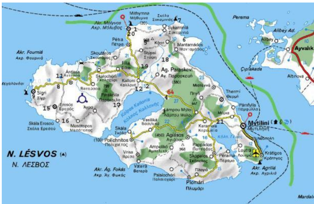
Kort 1: Nr. henviser til de hovedlokaliteter vi har besøgt