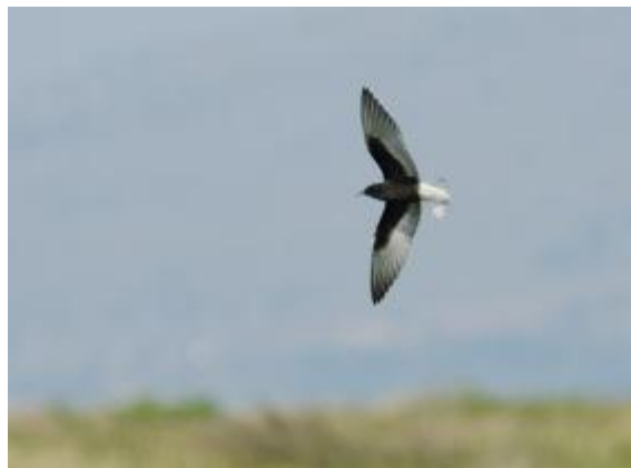
Billede 11: Hvidvinget Tern

Slentreturen i havnen efter spisning bød på Pelikan, den halv tamme fugl der har stået i havnen i adskillige år.