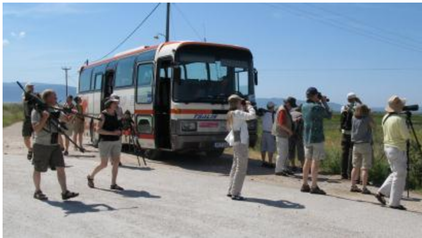
Billede 10: Stop i Kalloni salt pans...

Efter morgenmad var der igen afgang kl. 8. Af forskellige årsager måtte to desværre stå over i