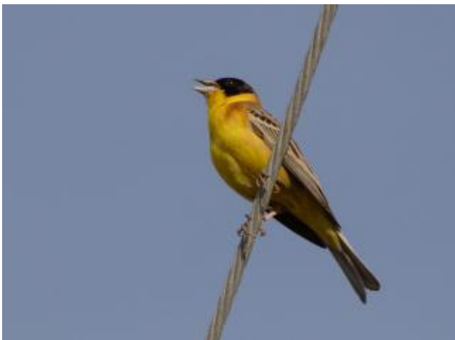
Billede 13: Hætteværlering

Klokken 8 sharp kørte bussen med første stop Kavaki, hvor vi blev i en times tid for at give