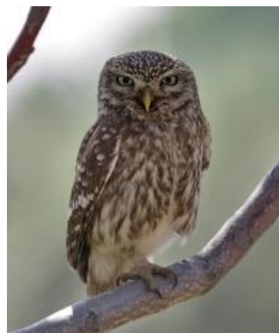
Billede 18: Kirkeugle

På hotellet stod den på morgenmad og kuffertpakning, inden bussen kl. 10 kom for at gelejde os rundt på denne sidste dag i en begivenhedsrig uge. Mens vi ventede på bussen, underholdt en Kirkeugle på få meters afstand lige over for indgangen til hotellet. Et fælt gruppepres bevirkede at vi gjorde stop ved Kavaki, med en fin Chukarhøne og de velkendte sangere på plads. Next stop Raptors Watch Point gav ikke det store, så vi kørte videre til den nordlige del af Gera bugten.