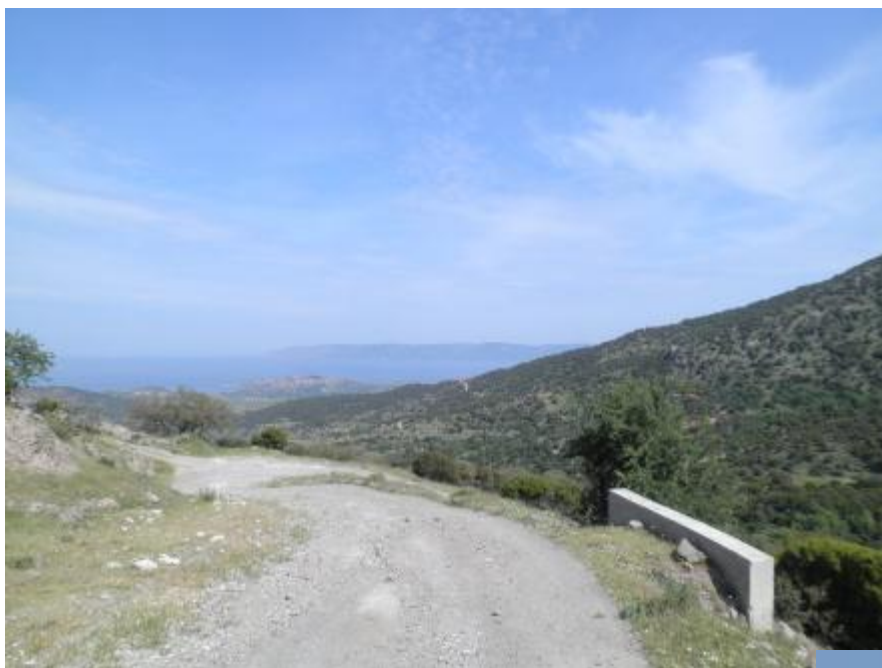
Billede 5: Udsigt over Molivos med Tyrkiret i baggrunden

Orla var igen morgenduelig og havde en mulig olivensanger.