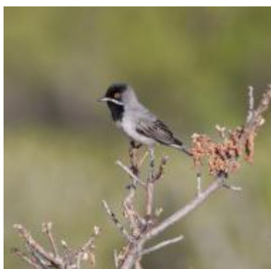
Billede 2: Sortstrubbet Sanger