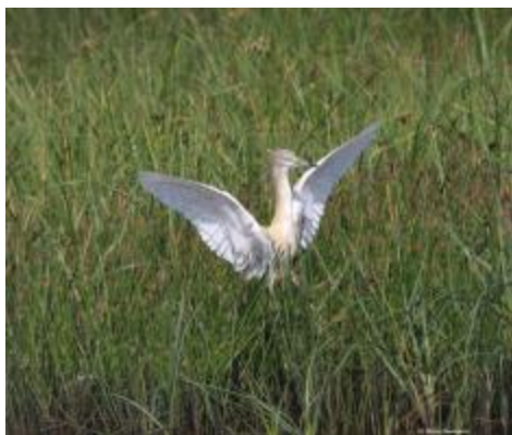
Billede 17: Tophejre