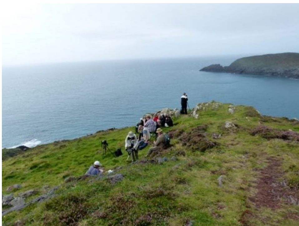
Havobs på Cape Clear Island.

Transfer med bus til Dublin hvor der var et par timers tid til sightseeing. Flyafgang fra Dublin 19:15 med landing i CPH 22:00.