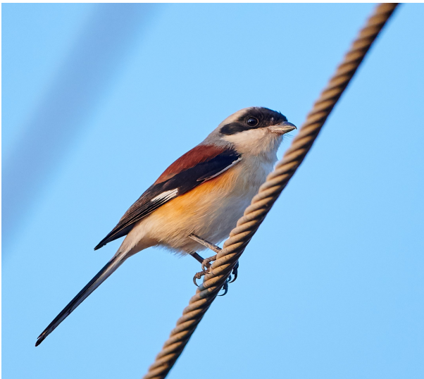
Bay-backed Shrike.