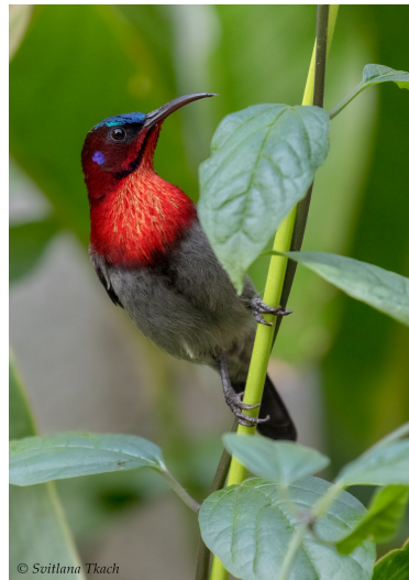
Vigors's Sunbird.