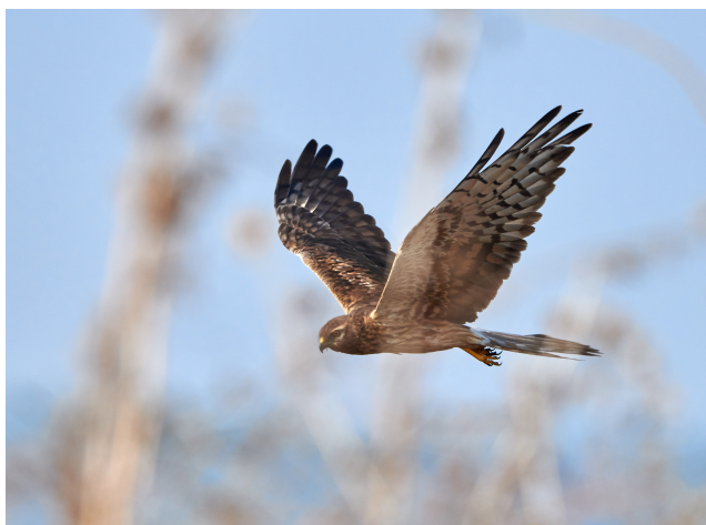
Hedehøg ung hun.