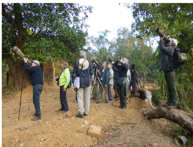
Little Spiderhunter som bliver foreviget!