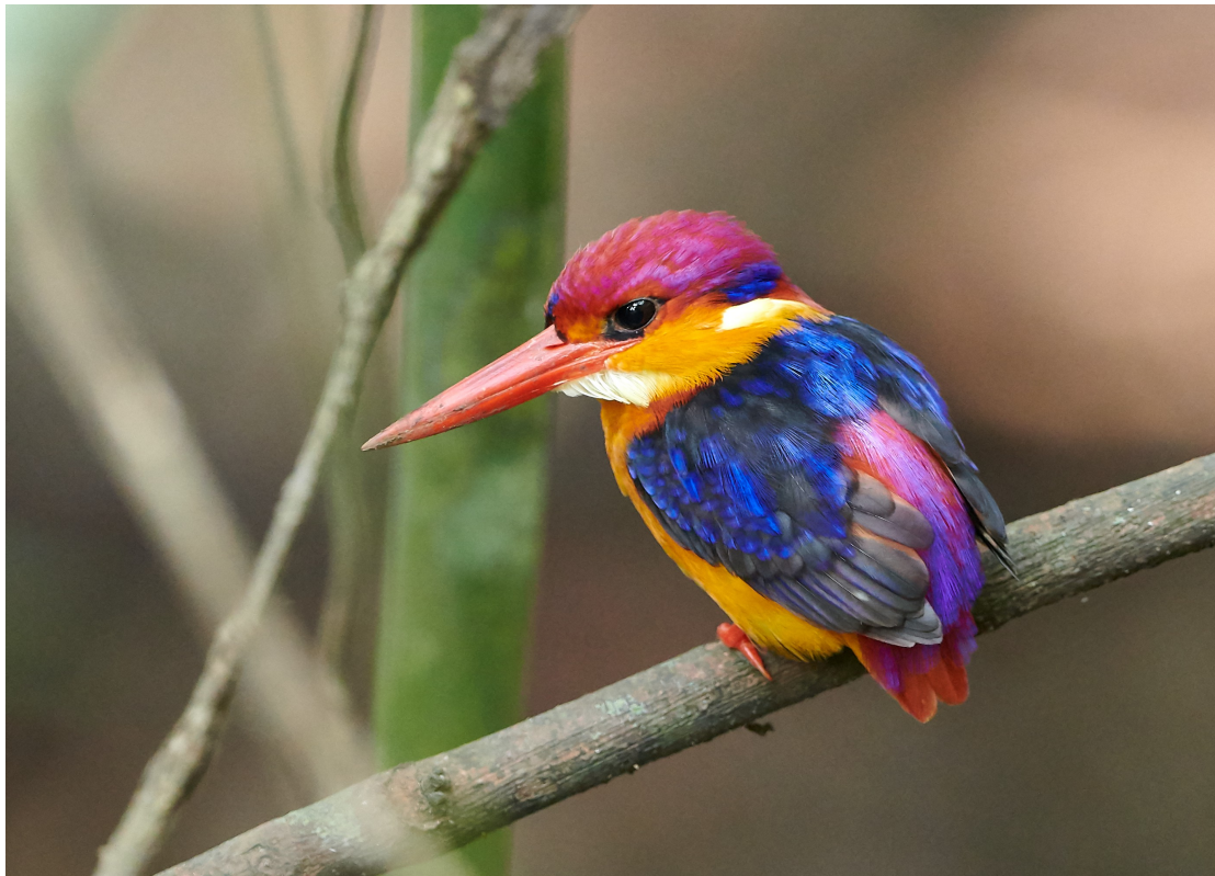
Oriental Dwarf Kingfisher.