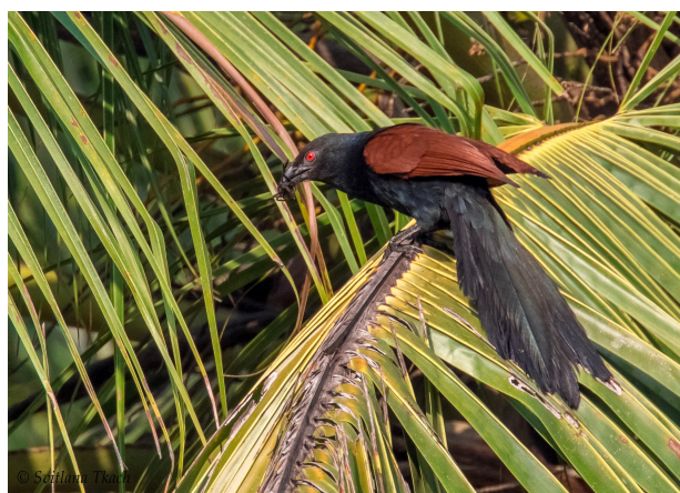
Southern Coucal.