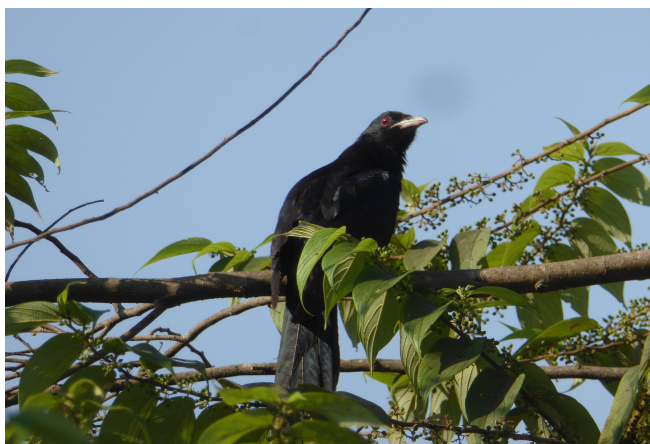
Asian Koel.