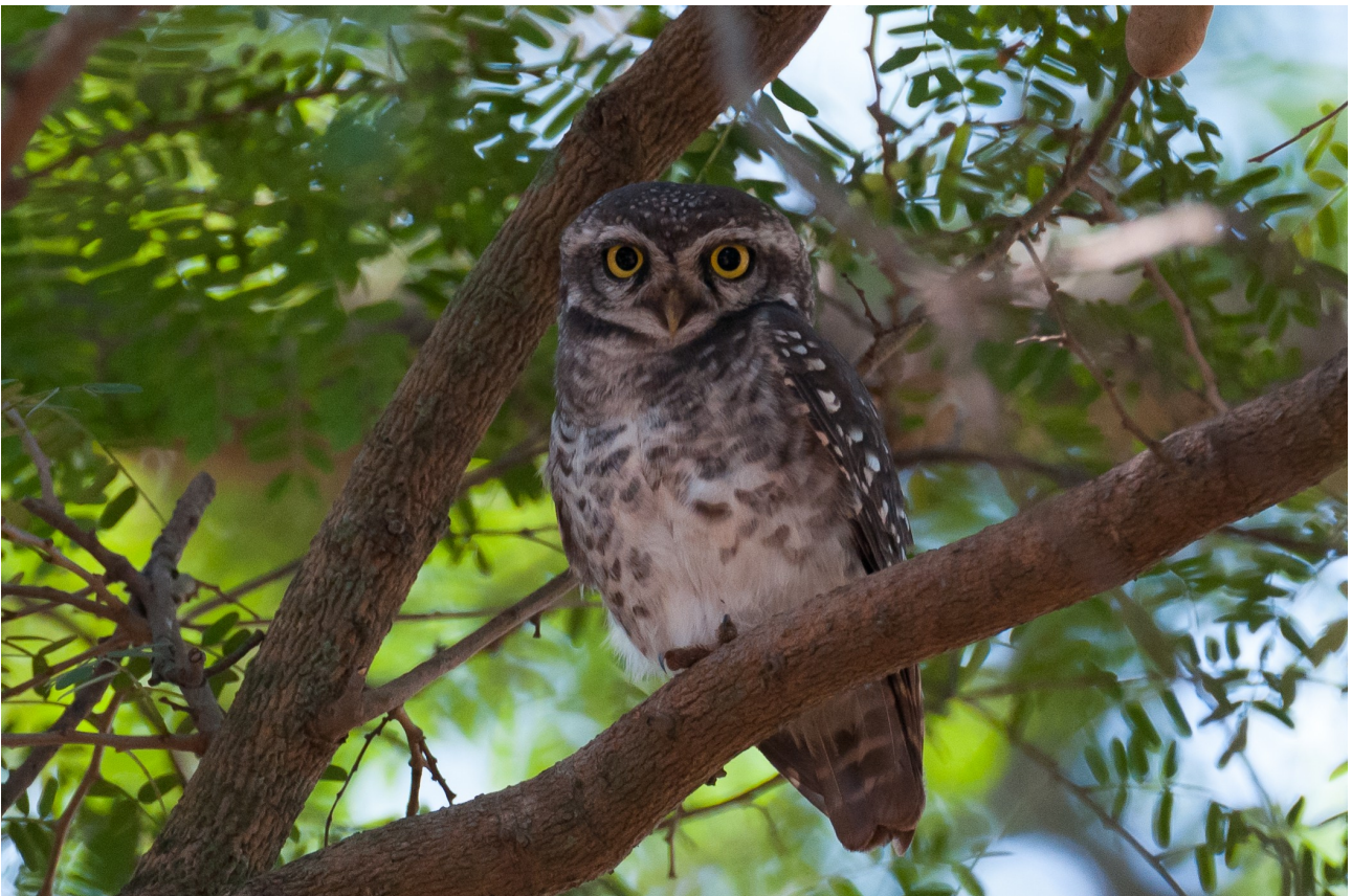
Spotted Owlet (Hans Peter)