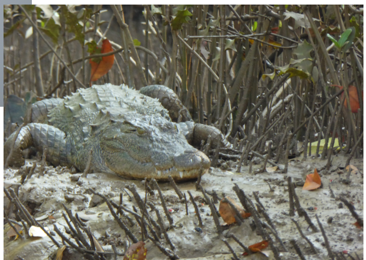
Greater Crested Tern (Arne), Marsh Muger/krokodille (John)