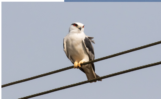
Øverst: Coppersmith Barbet (Ingelise), Blue-tailed Bee-eater (Ingelise), Blå Glente (Carl)