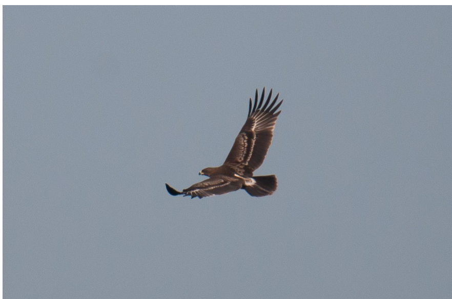
Indian Spotted Eagle ung (Hans Peter)