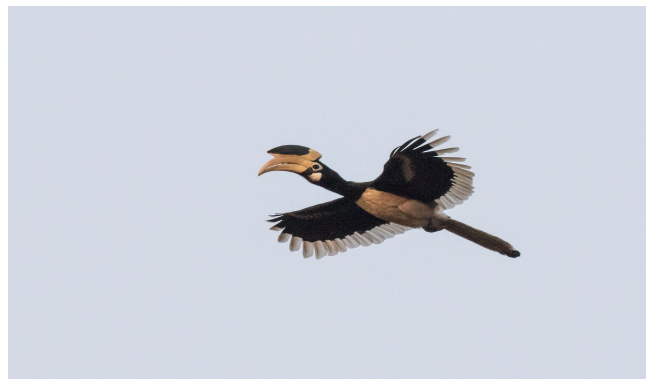
Malabar Pied Hornbill (Carl)