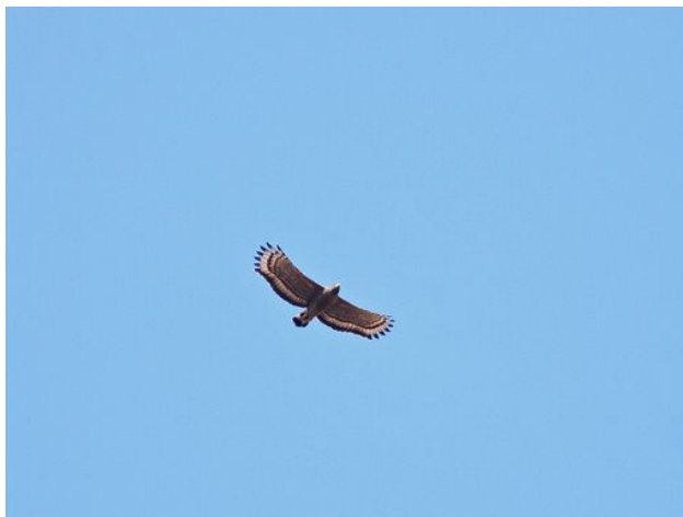
Crested Serpent-eagle

Tre sovende Indian Jungle Nightjars blev fremvist af Lloyd under vores vandring mod enden af søen langs kanten. I luften over os svævede et par kaldende Crested Serpent Eagle i noget der lignede parringsflugt. På tilbagevejen larmede en flok Jungle Babblers på mindst 3x7 fugle (7 sisters) tæt ved.