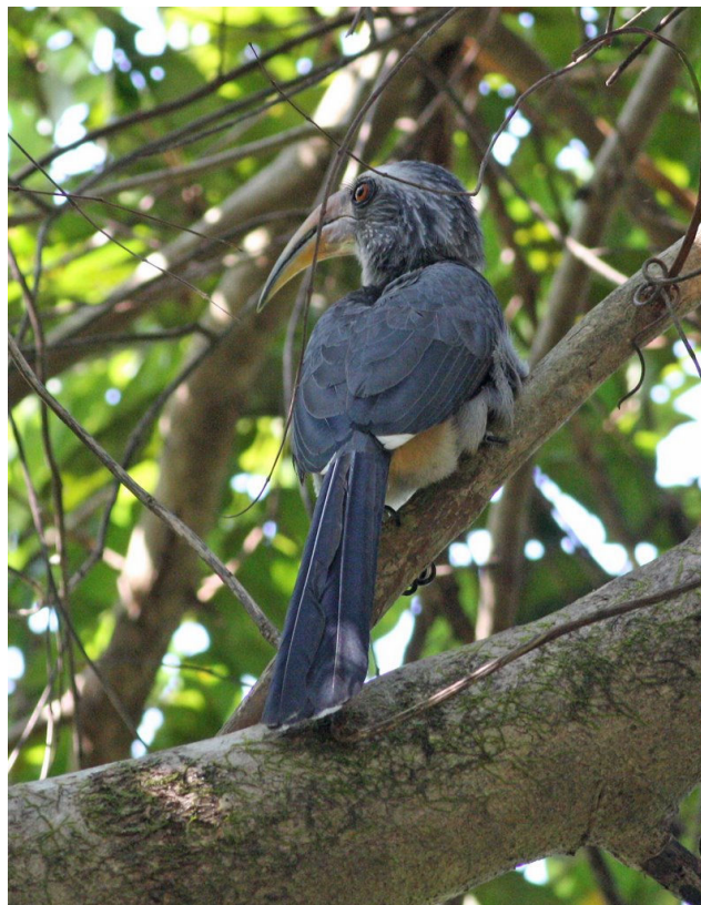
Malabar Grey Hornbill.