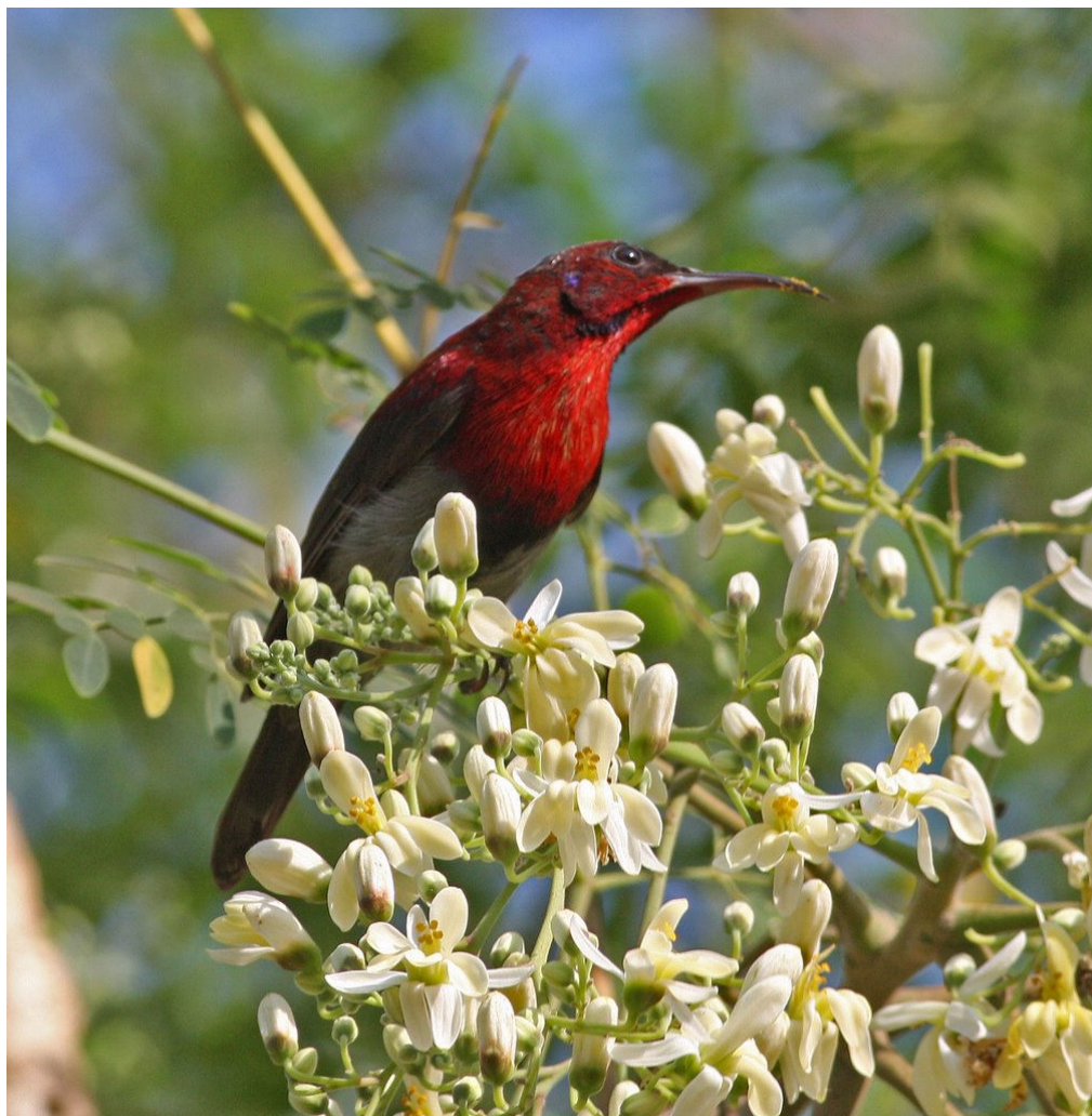
Crimson Sunbird.

Dagen sluttede i Saligao Zor en lille landsby der ligger lidt oppe i højderne omgivet af tæt skov hvor Brown Wood Owl har ynglet i mange år. Desværre lykkedes det os ikke at finde den på trods af ihærdig eftersøgning af Lloyd og hans lydafspiller. På vej op gennem landsbyen havde vi til gengæld fornøjelsen af 4 arter sunbirds (Purple-rumped Sunbird, Vigors's Sunbird, Small Sunbird samt Purple Sunbird i samme nyudsprungne blomsterende nektar træ/buske. I bunden af skoven så vi Asian Paradise Flycatcher, Common Iora, Indian Blackbird, samt Verditer Flycatcher).