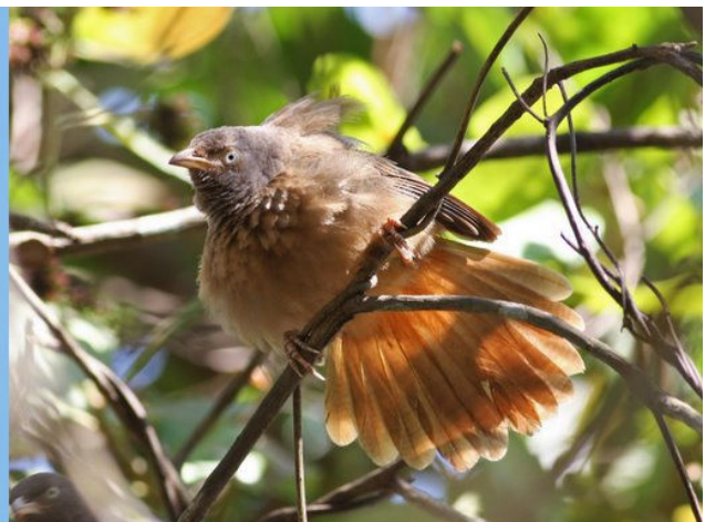
Jungle Babbler

Der var her udover mange fugle omkring søen bla Rufous Woodpecker, Black-rumped Flameback, Brown-headed Barbet, White-cheeked Barbet, Isfugl, Little Green Bee-eater, Blue-tailed Bee-eater, Chestnut-headed Bee-eater, Common Hawk Cuckoo, Asian Koel, Blue-faced Malkoha, Plum-headed Parakeet, Crested Treeswift, Rock Pigeon, Spotted Dove, Grey-fronted Green-pigeon, White-breasted Waterhen, Crested Hawk Eagle, Golden-fronted Leafbird, Ashy Woodswallow, Indian Golden Oriole, Black-hooded Oriole, Small Minivet, Black-headed Cuckooshrike, Black Drongo, Ashy Drongo, White-bellied Drongo, Bronzed Drongo, Asian Paradise Flycatcher, Common Iora, Malabar Whistling Thrush, Orange-headed Thrush Tickell's Blue Flycatcher, Malabar White-headed Starling, Lille rørsanger, Buskrørsanger, Lundsanger, Jungle Babbler, Brown-cheeked Fulvetta, Purple-rumped Sunbird, Purple Sunbird.