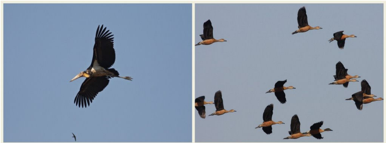
Lesser Adjutant and Lesser Whistling Duck.

Luftrummet over Carambolim lake og især Carambolim fields er altid god for et par større vingefang såvel storke som rovfugle og det blev til ikke mindre en 12 rovfuglearter i alt (Black Kite, Black-eared Kite, Brahminy Kite, White-bellied Sea Eagle, Marsh Harrier (Rørhøg), Pallid Harrier (Steppehøg), Crested Goshawk, Shikra, Oriental Honey-buzzard, Indian Spotted Eagle, Greater Spotted Eagle (Stor skrigeørn), Booted Eagle (Dværgørn) samt ibis- og storkefugle som Glossy Ibis (sort ibis), Black-headed Ibis, Asian Openbill, Woolly-necked Stork og Lesser Adjutant.