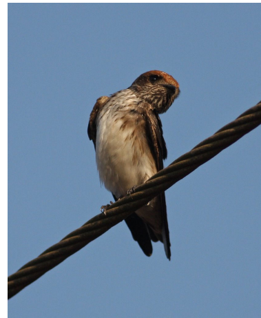
Streak-throated Swallow.

Ud på eftermiddagen kørte vi ud til templet Tambdi Surla og gik ad en sti langs floden til et åbent område, med god udsigt til bjergene. Her lod vi fuglene komme til os, hvilket gjorde, at vi kunne stå i skyggen af et par store træer, da temperaturen stadig var høj.