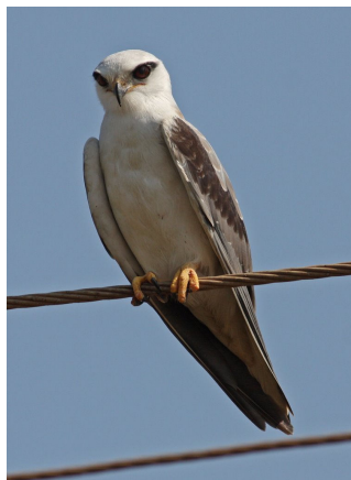
Blå Glente.