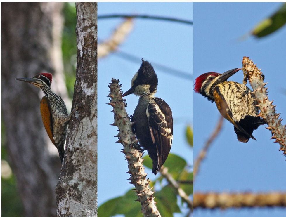
Greater Flameback , Heart-spotted Woodpecker and Black-rumped Flameback.

En enkelt natravne tur gik op til et sted i bjergene for at finde Indian Grey Nightjar. Turen gav desværre ingen natravne men derimod Indian Scops Owl hørt samt obs af 2 styk Russel Vipers. Loven havde sørget for at alle var iført støvler, lange bukser og kraftige projektører da der var en reel risiko for at se slanger i området i bunden af området.