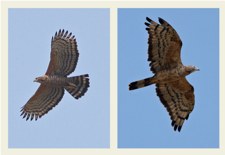
Mountain Hawk Eagle