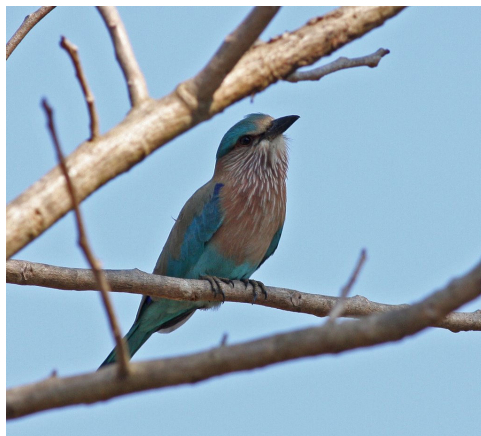
Indisk Ellekrage.

Efter frokost besøgte vi Lloyd og hans familie, der bor tæt på hotellet hvorefter vi blev fulgt hjem til fods af den yngste af Lloyds sønner.