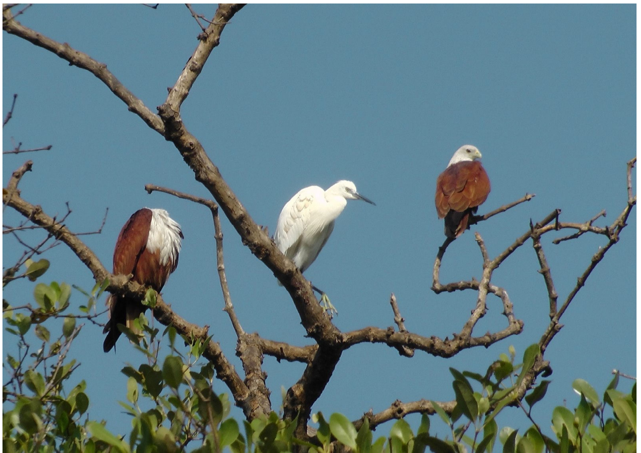
Braminglenter og Silkehejre.