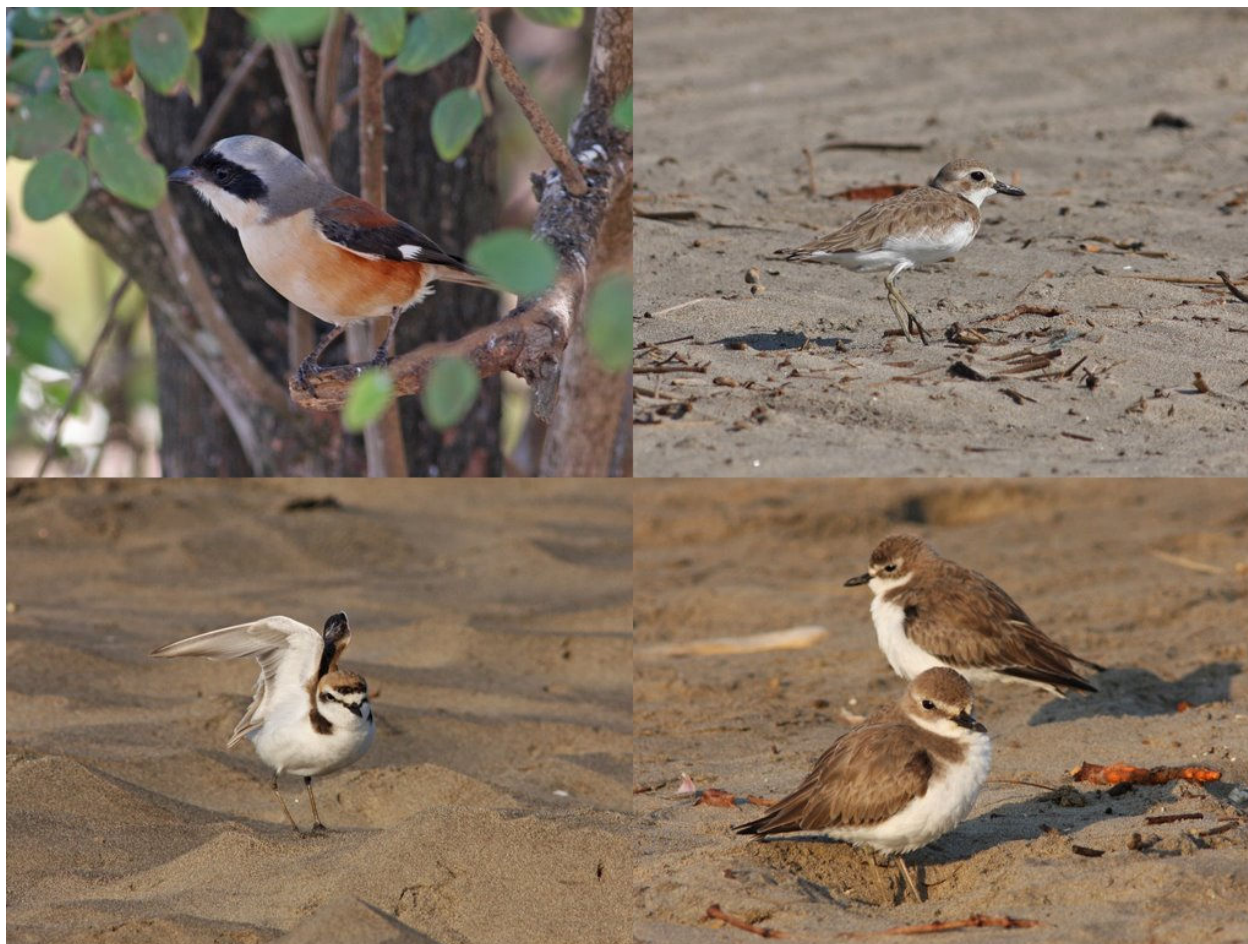
Bay-backed Shrike, Ørkenpræstekrave, Hvidbrystet Præstekrave, Mongolsk Præstekrave

Antallet af måger og tern der samles her i strandkanten og på de små til tider frilagte sandbanker (ved lavvande) varierer meget i antal. Sommetider er nogle måger og tern fløjet længere op ad floden. I dag var vi heldige at se de fleste af de arter man normalt ser her i januar måned, bla Stor Sorthovedet Måge, Brunhovedet Måge, Hættemåge, og Kaspisk Måge. Vi fandt dog ikke Sibirisk Måge (Heuglins Gull). Ellers 4 ternarter: Gull-billed Tern (Sandterne), Lesser Crested Tern (Bengalsk terne), Sandwich Tern (Splitterne), Little Tern (Dværgrterne). Sandterne ses oftest og tit i større flokke over 20 individer. Efter endnu en gang at have studeret de mange præstekraver og Small Pratincoles der løber rundt på stranden og til tider ret tæt på én, begav vi os op på land for at lede efter den 'kendte' Bay-backed Shrike der har holdt til her de sidste 6-7 år. Vi fandt fuglen og den blev set af alle på holdet og fotograferet på nær hold