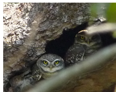
Indian Spotted Owl.

Søren Sørensen / marie.soren@mail.tele.dk / 4042 3126