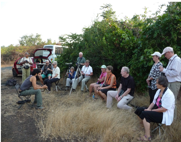
Lektion på Socorro Plateau.