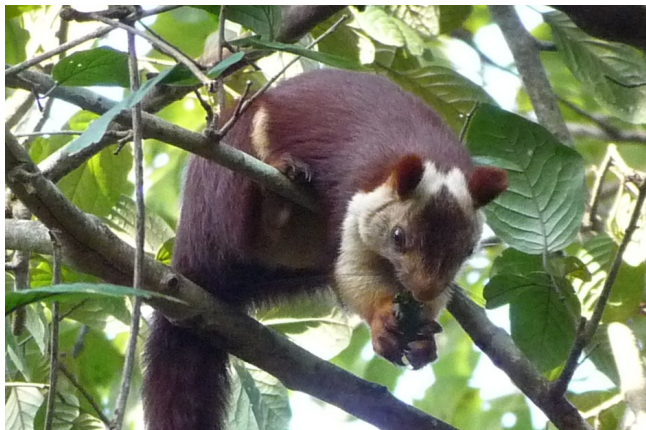
Giant Squirrel.

Delfiner - sandsynligvis Humpback Dolphin, 20-30 ved Fort Arquada og også set ved Morjim Beach.