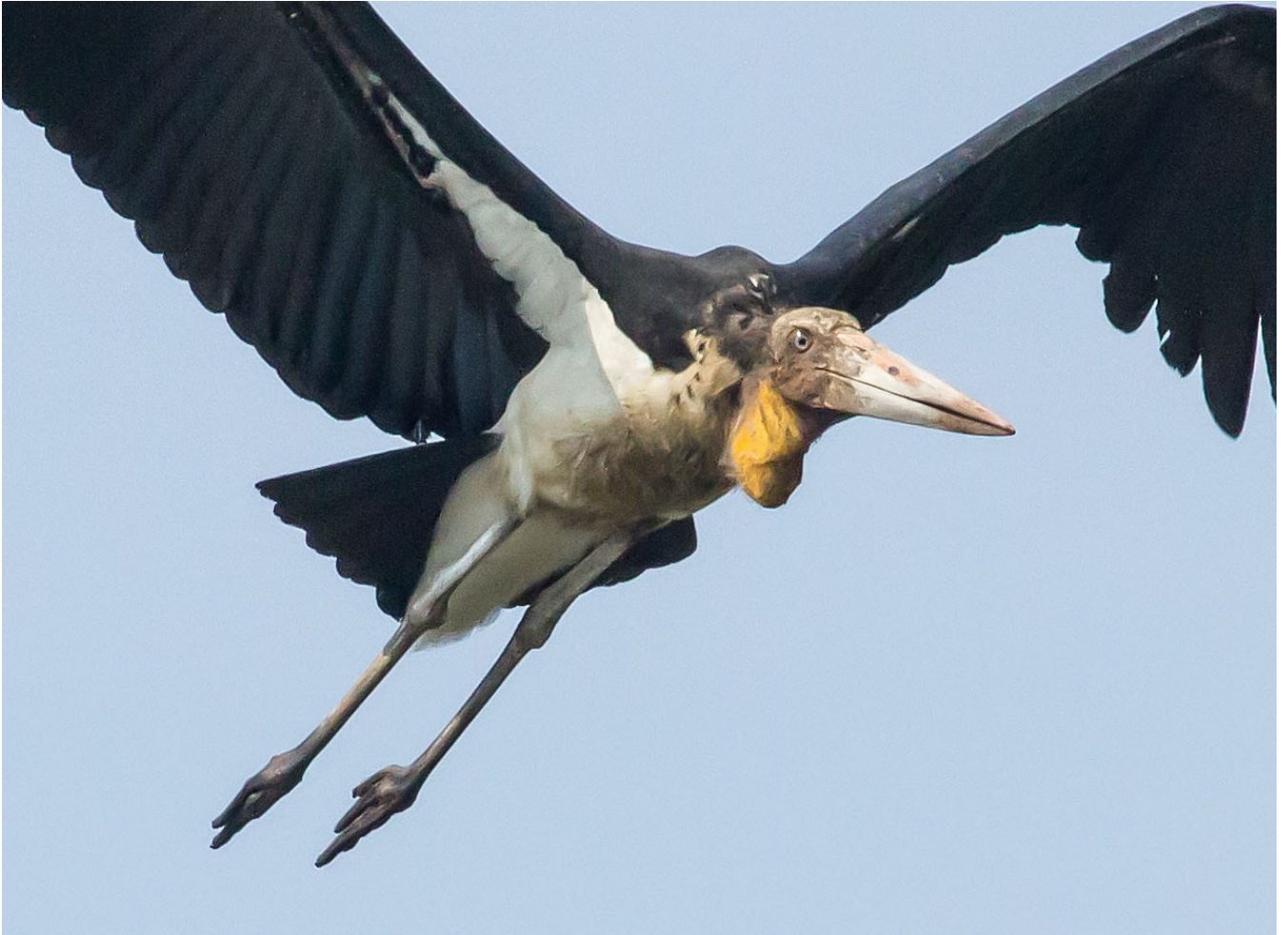
Lesser Adjutant.

Det gælde generelt for hejrer, ibisser og storke, at antallene var højere end tidligere, hvad det så kan skyldes.