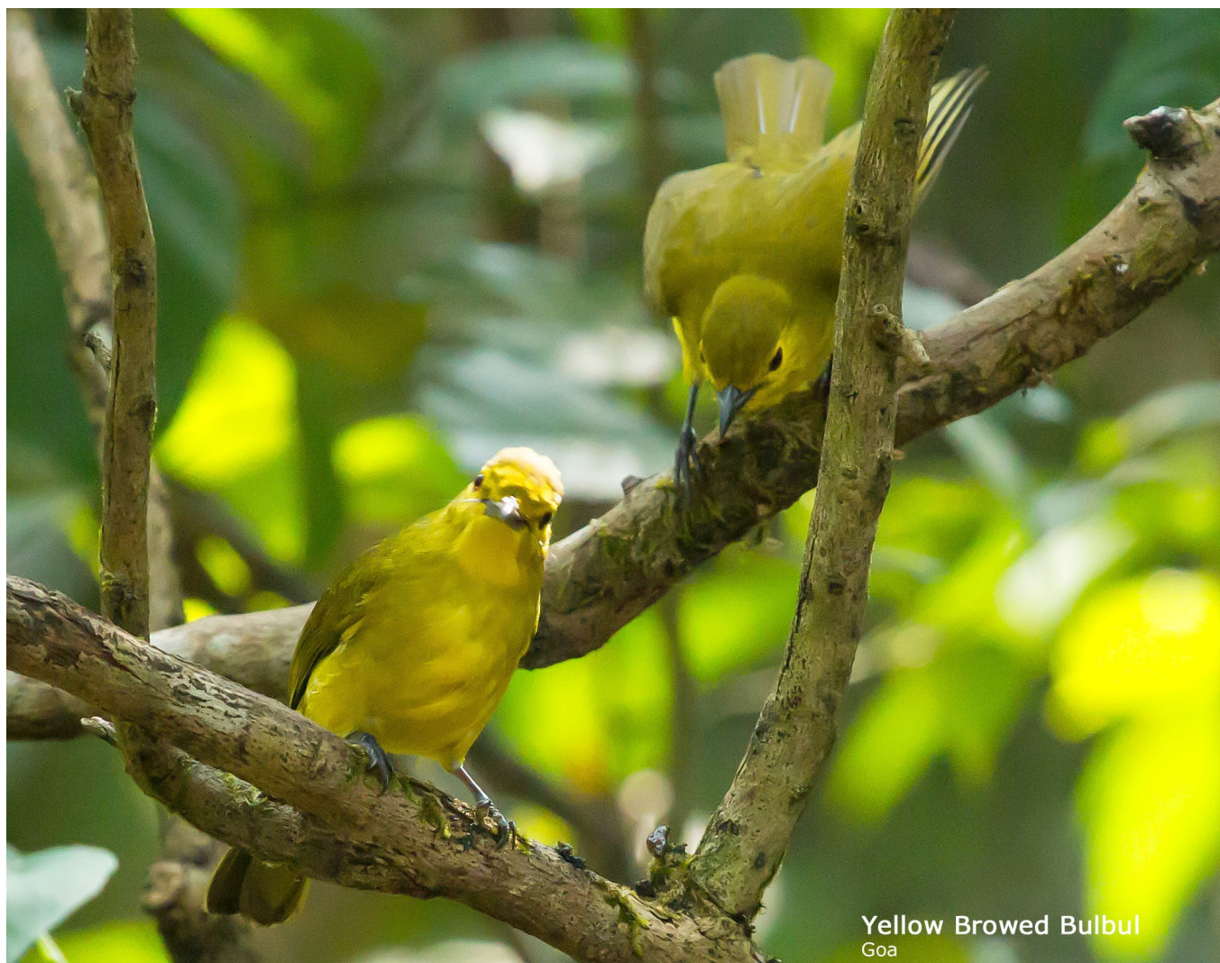
Yellow-browed Bulbul.