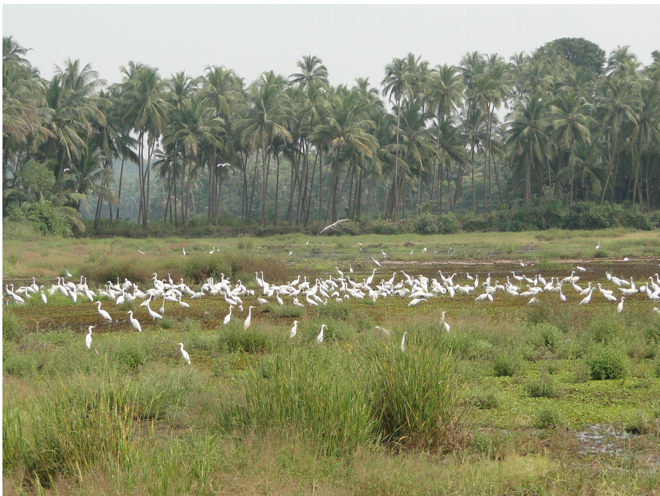
Siolim Paddy-fields.