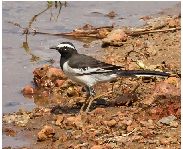
White-browed Wagtail.