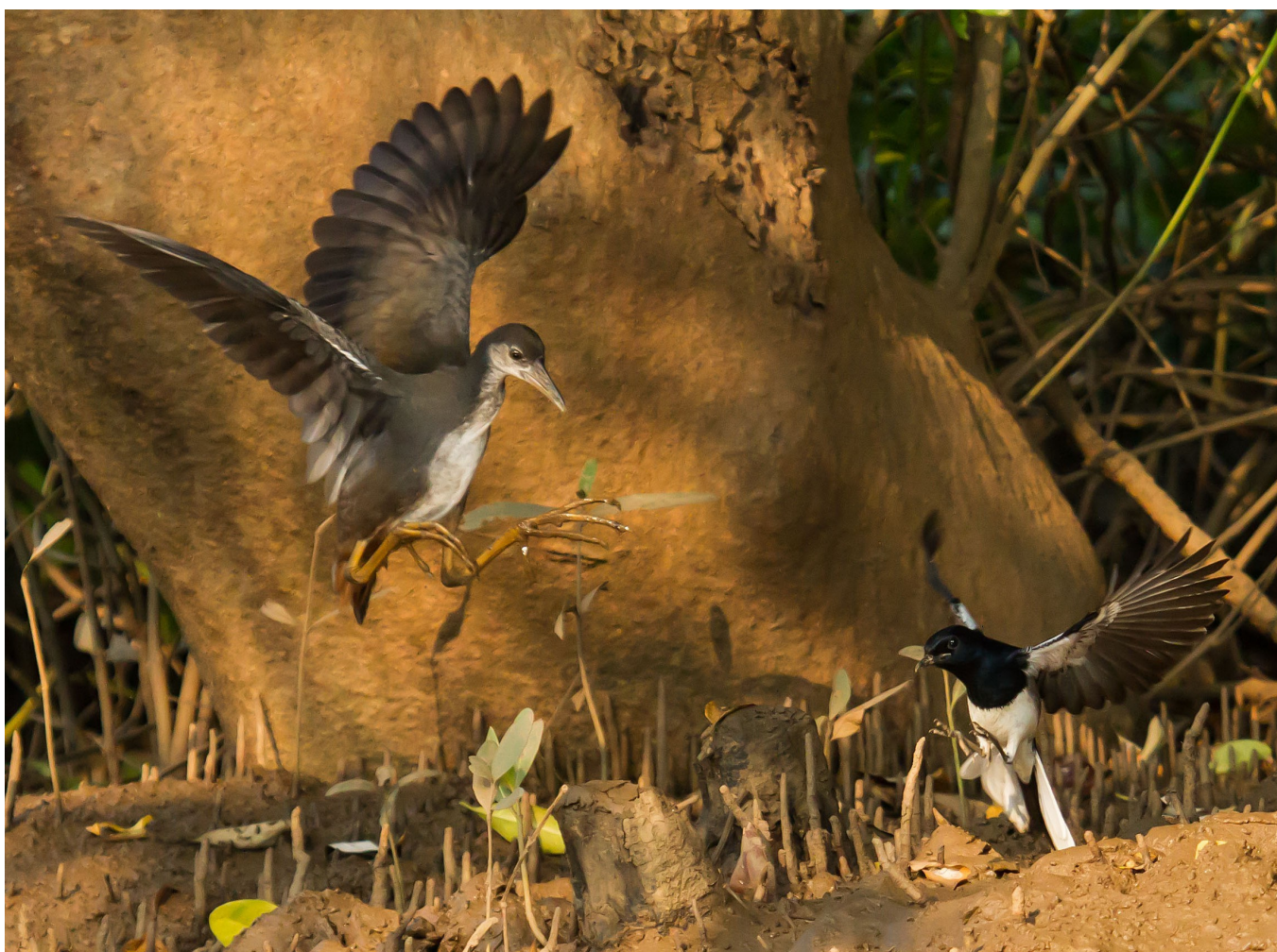
White-breasted Waterhen og Magpie Robin.