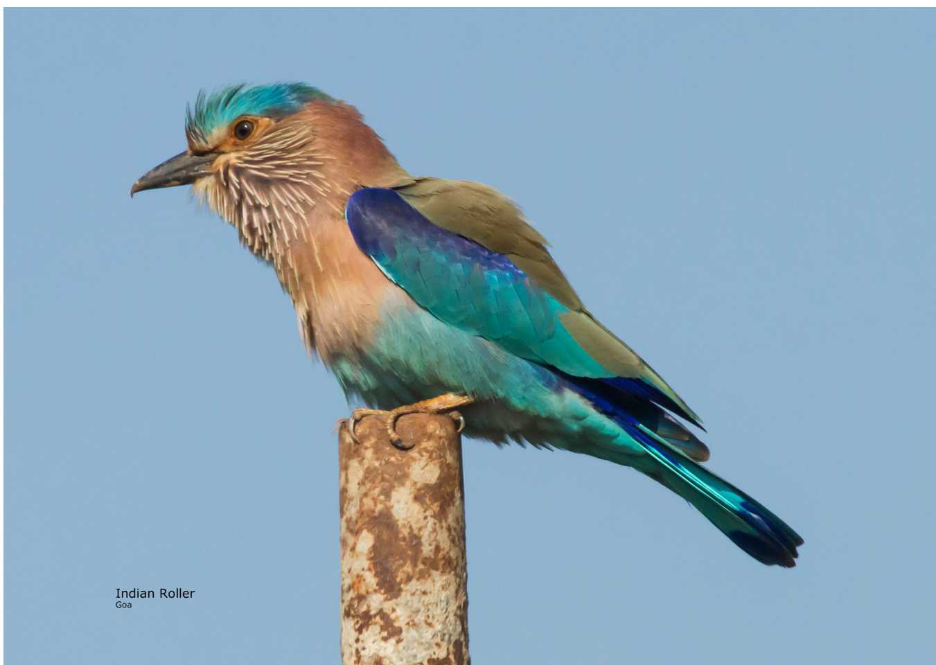
Indian Roller Goa