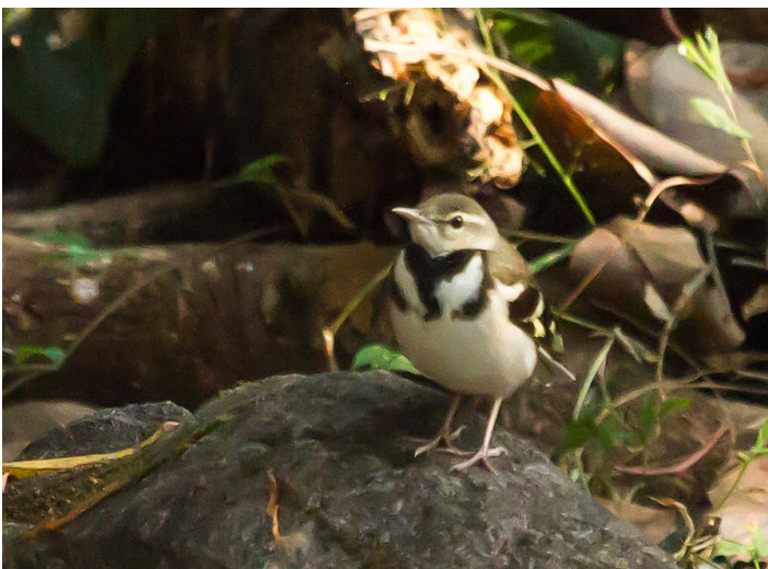
Forest Wagtail.