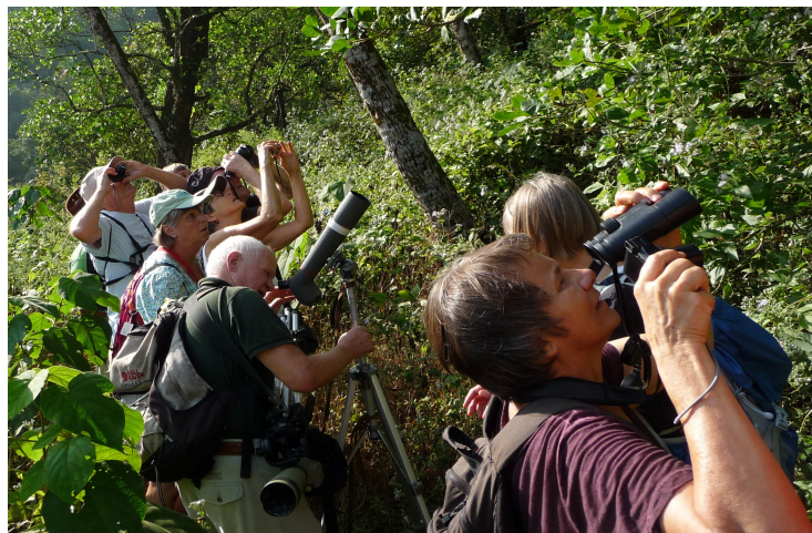
Brown Fish Owl i sigte.