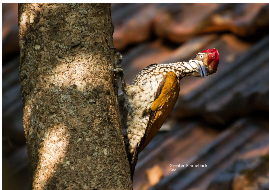
Greater Flameback.