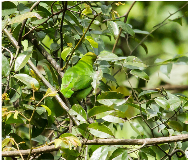
Grøn-gul camouflaged. Golden-fronted Leafbird.