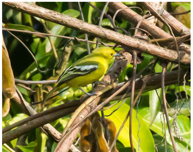
Common lora.