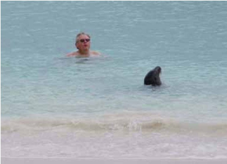
2 vandhundearter: den gråhårede og den gråskæggede.