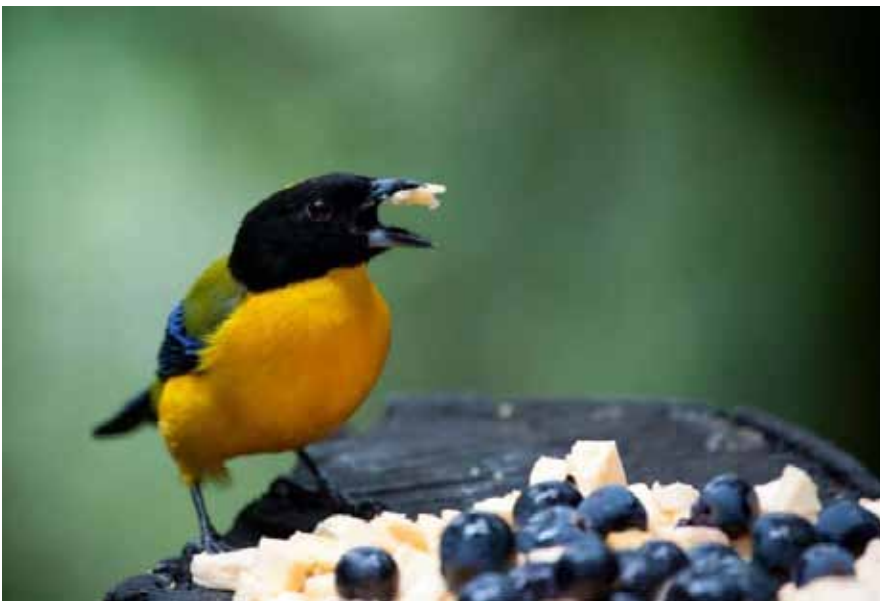
Black-chinned Mountain-tanager.

Black-chinned Mountain-tanager – Anisognathus notabilis Chocó endemic. 3 den 15/9 til frugtfodring i Refugio Paz de las Antpittas.