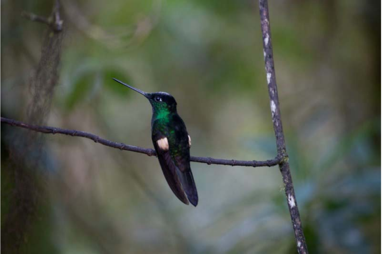
Buff-winged Starfrontlet.