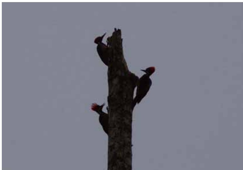
Guayaquil Woodpecker i morgentågen.

Chocó endemic. Hele 3 samtidigt på tæt hold i et udgået træ sås Rio Palenque 17/9. Oplevelsen var så god, at arten blev dagens fugl.