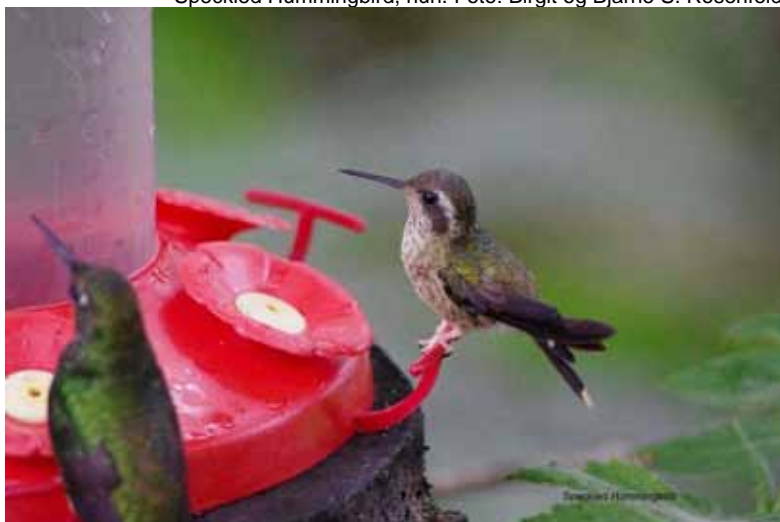
Speckled Hummingbird, hun.