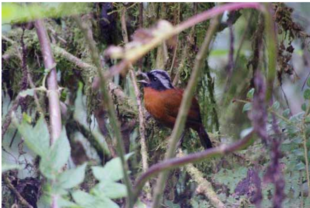
Tanager Finch i sang.

Conservation status: Vulnerable . Tumbesian endemic. Vi så 2 fugle den 13/9 Bellavista Cloud Forest, den eneste lokalitet for arten i Ecuador. Det blev også til sang og ok billeder.