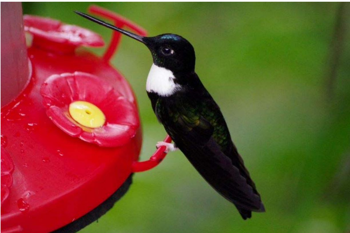
Collared Inca.

21 fugle fordelt på 3 dage: Bellavista lodge, Tony Nunnery's House og Mindo Loma.