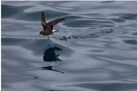
Wedge-rumped Storm-petrel.

Talrig på ynglepladsen på Genovesa, hvor vi vurderede et antal på 5000 fugle. Herudover spredte iagttagelser på 45 individer. Ynglebestanden på Genovesa er tidligere opgjort til 200.000 par.