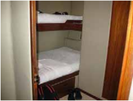
Man kom hinanden ved i kahytterne.

Da solen står op er vi tæt inden under kysten til Genovesa, og vi ankrer op i Bahía Darwin, et vulkankrater, som er kollapsede som nu er fyldt med havvand.