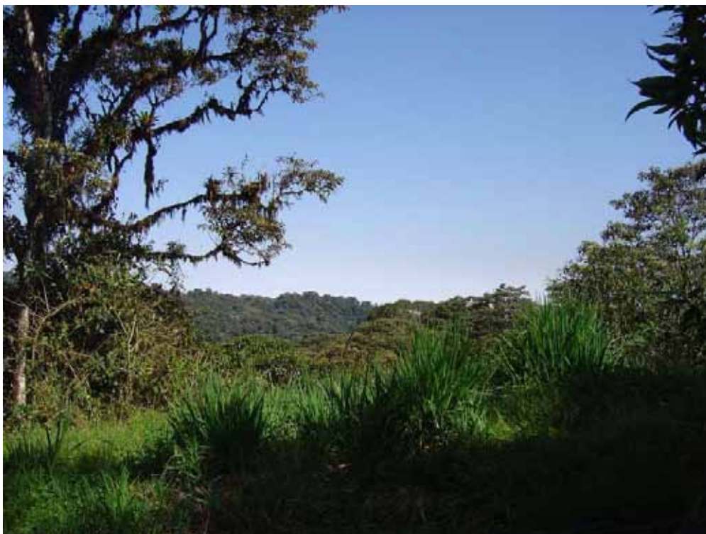
Parti fra Bellavista Cloud Forest.