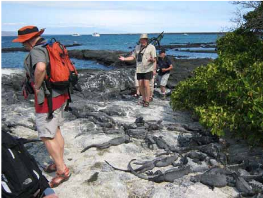
Selv en dyrlæge kan få nok at dyr!

Eftermiddagen tilbringes med en landing på Punta Espinosa på Fernandina (Narborough). Undervejs hertil ser vi fiskestimer i overfladen, til stor glæde for Skråper, Noddyer, Suler og formentlig de rovfisk m.v., der har skræmt stimen op i overfladen.