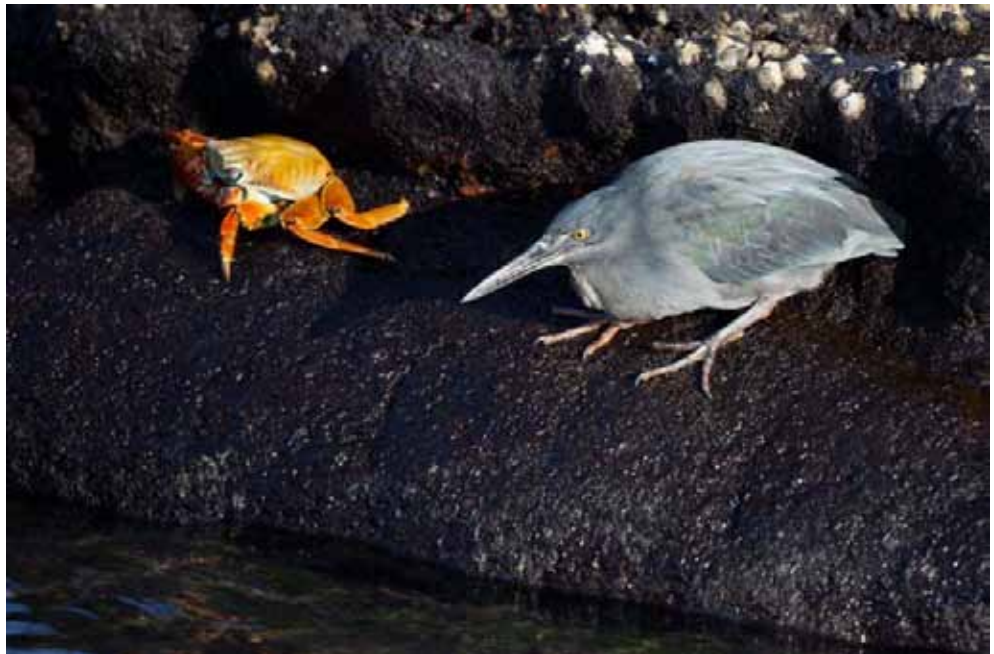
Du er vist for stor til mig. Lava Heron.

Endemisk (underart) for Galapágos. Clements har tidligere regnet denne som en selvstændig art, men nu er hele Mangrovehejre problematikken igen-igen blevet reklassificeret, og Clements konklusion er nu, at Lavahejre er en underart af Striated Heron - Butorides striatus sundevali . Andre fuglebogsforfattere, regner den fortsat som selvstændig art.