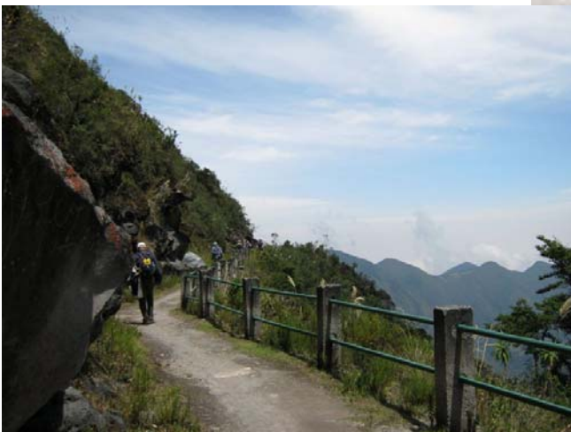
Og vi kommer højere op mod Kolibri-feederne. Yanacocha.

Vi forlader Yanacocha og begiver os mod Bellavista Lodge ad Old Nono Mindo road. Bjergene er her græsklædte og forberedt til kvægdrift. Den oprindelige skov er fældet, med flere jordskred til følge. Indkvartering på Bellavista Lodge – en rigtig charmerende øko-lodge, dog en smule nedslidt. Og der er meget lyd, så man skal passe på med at genere turledelsen alt for højlydt! Toilettepapir skal i særskilt spand, og må ikke smides i kummen. Det skal vi lige vende os til. Der må dog godt bruges dybbblåt "velduftende" Wc-rens i kummen!