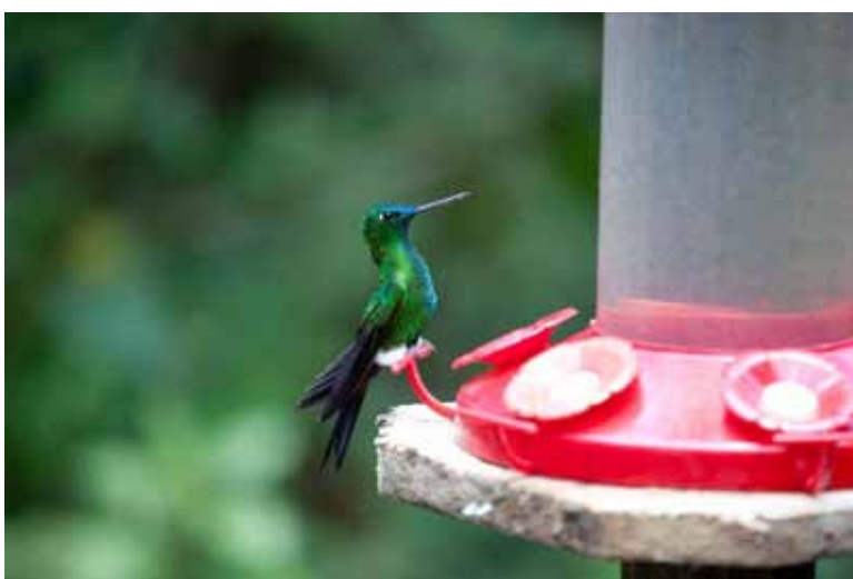
Sapphire-vented Puffleg.

10 eksemplarer den 11/9 Yanacocha Reserve.