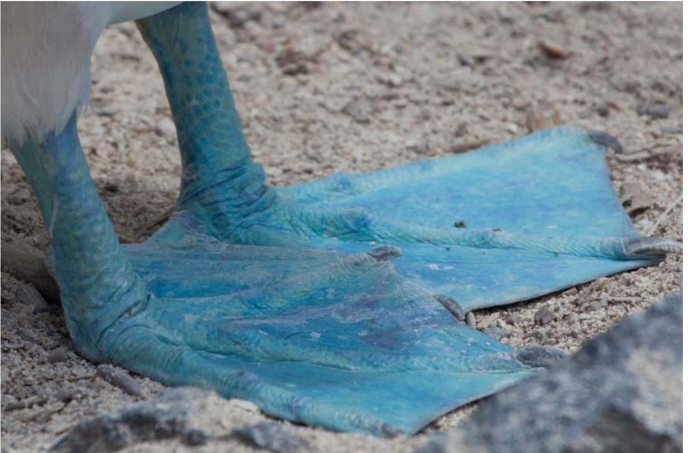
Blue-footed Booby.