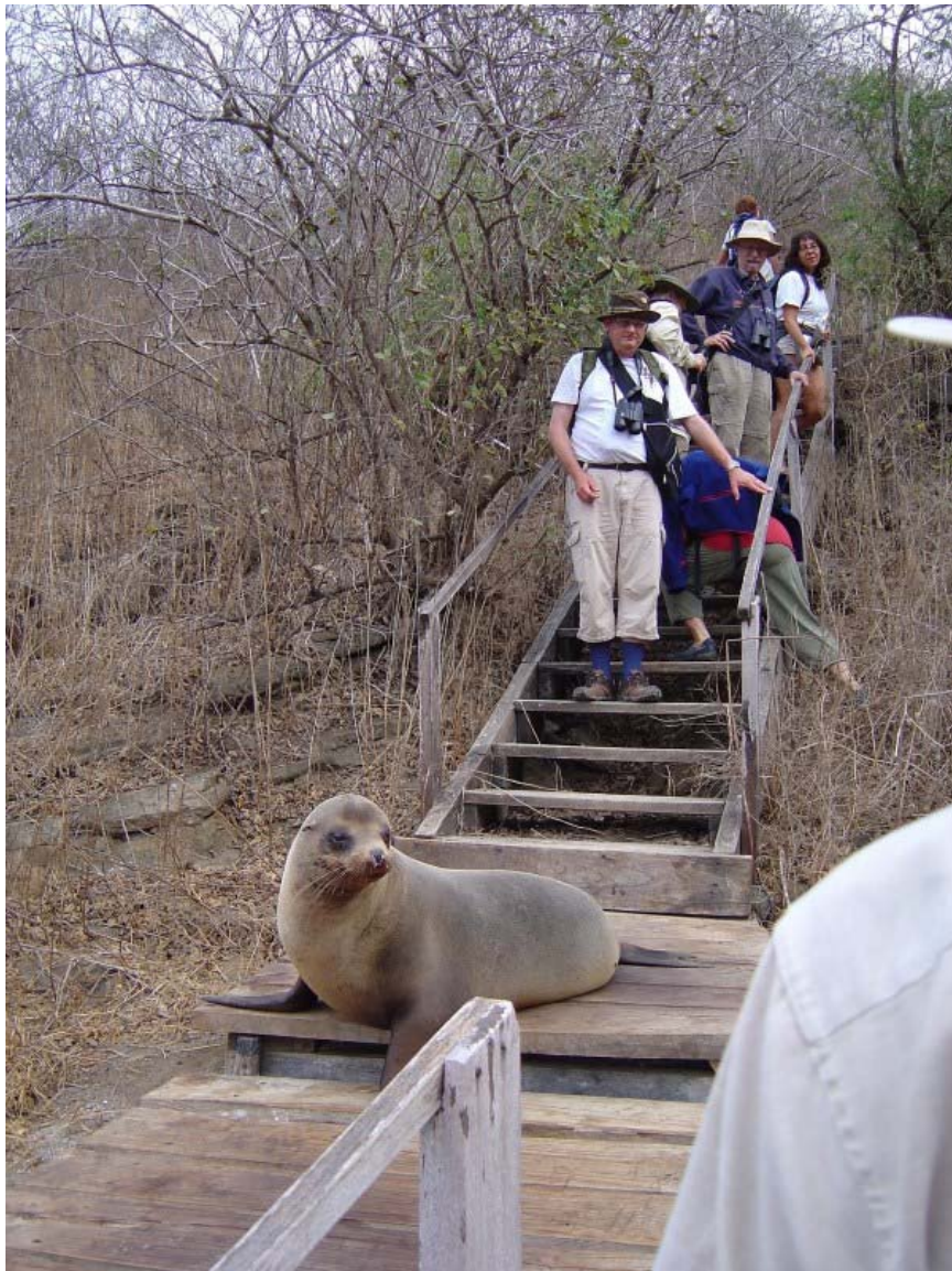
Her bestemmer jeg, og I må gå uden om. Tagus Cove.