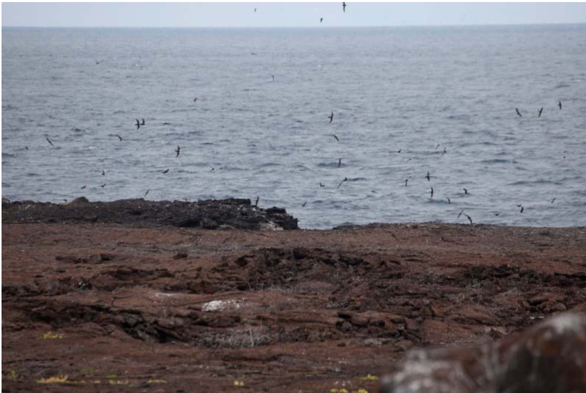
Kolonien med Wedge-rumped Storm-petrel på Genovesa.