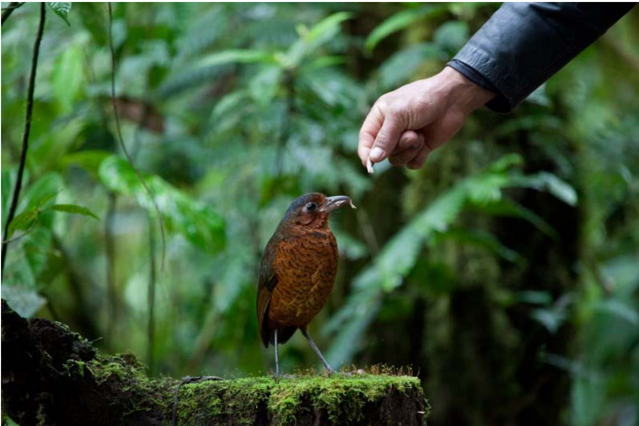
Maria – brødrene Paz tamme Giant Antpitta.

Conservation status: Vulnerable . Var på et tidspunkt så presset på egnede habitater, og var kun kendt for ophold meget få steder, at arten blev opgraderet til Endangered . I 2004 fandt man dog flere områder, hvor fuglen holdt til, at arten blev nedklassificeret til Vulnerable . Et af turens højdepunkter. I Refugio Paz de las Antpittas så vi den 15/9 1 fugl, der var så tam, at den lod sig håndfodre af brødrene Paz med ormeæg og larver, selvom vi stod hele flokken 5 meter derfra.