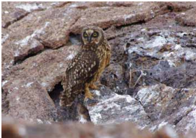
Den lokale Mosehornugle på Genovesa.

Endemisk underart. 1 fugl ses ved Wedge-tailed Storm-petrel kolonien på Genovesa den 19/9. Uglen har specialiseret sig i at fange disse Stormsvaler. Når Stormsvalen er fløjet ind i redehullet, så flyver den hen til hullet og venter ..... og haps.