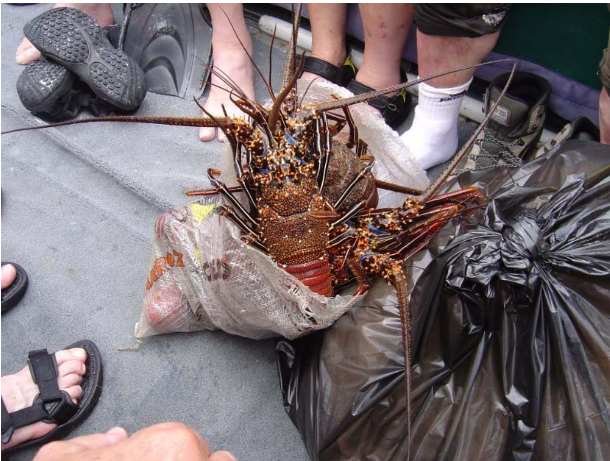
Langusta-menuen er reddet, så det blev til både suppe til frokost og hovedret til aftensmaden.