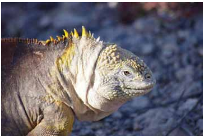
Land Iguana.

Conservation status: Vulnerable . Vi så kun denne iguana på South Plaza den 18/9, hvor 25 kom i bogen. Det var både såvel store som små eksemplarer.