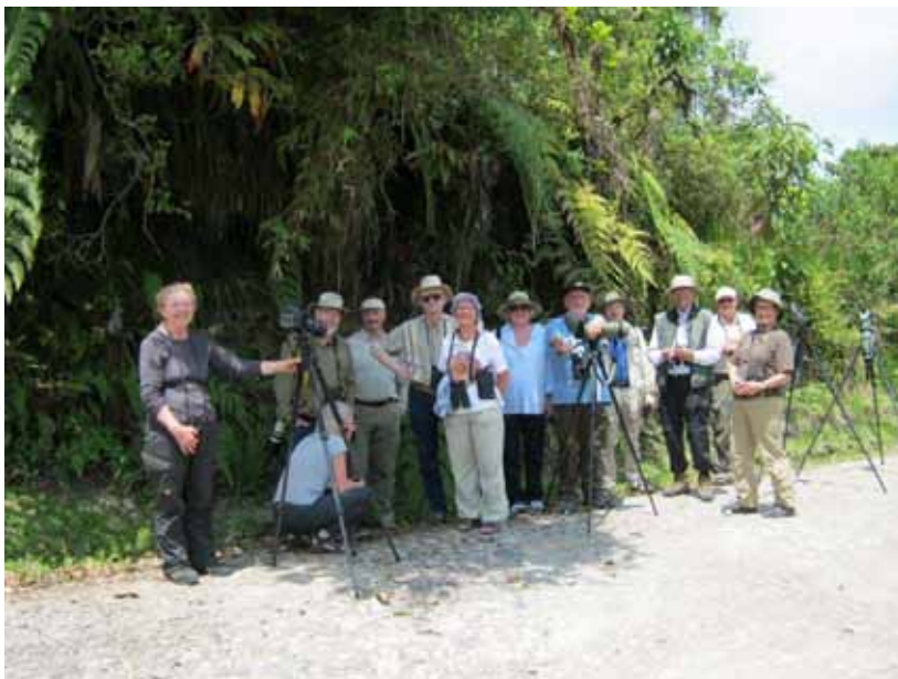
Holdet samlet minus fotografen.

Efter morgenmaden kørte vi 10 minutter fra Bellavista lodge, hvor bussen satte os af. Vi gik så 2 km ud ad vejen og tilbage igen. Vi mødte et større bird-wave, da vi kom tilbage til bussen, og påbegyndte gåturen tilbage til lodgen. Bl.a. sås Montane Woodcreeper og Streaked Tuftedcheek. Yderligere en Crimson-mantled Woodpecker blev nydt.