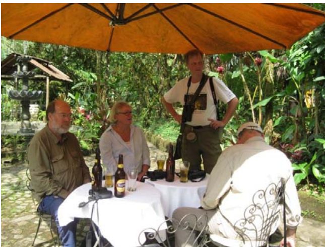
Endelig tid til en PP (Pause og Pils).

Vi var tilbage til Séptimo kl. 11.30, så tiden indtil frokost kl. 13 blev brugt til afslapning, Kolibrifotografering og kratlusk. Kratluskeriet medførte flere sjove arter + enkelte nye turarter. Vi havnede ude ved P-pladsen, og pludselig kom der gang i rovfuglene efter en opklaring. På mindre end et kvarter sås Hooked-billed Kite, en ung Black-and-chestnut Eagle og Barred Hawk.