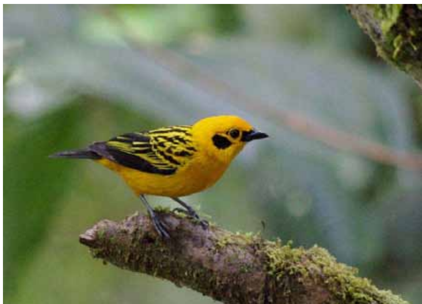
Golden Tanager.

I alt noteret 15 fugle fordelt på 4 dage.