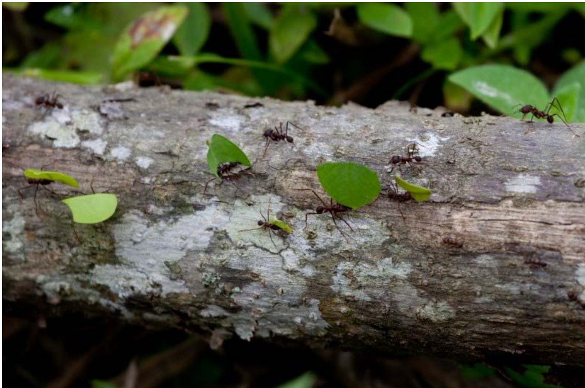
Baldskærermyrer på arbejde i Ecuadors højland.