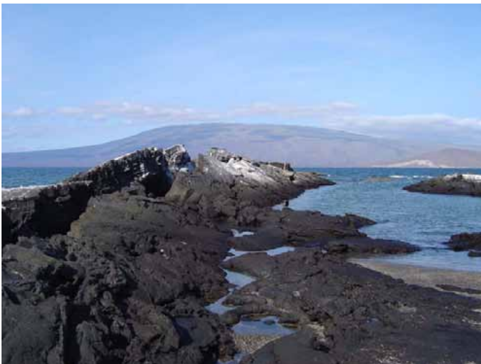
Punta Espinosa, Fernandina, med Isabela i baggrunden.

En Galapágos Flycatcher ses på vej tilbage fra vores vandretur halvvejs rundt omkring søen, hvor der også var White-cheeked Pintail og Moorhen. Tilbage på båden tager Silvia vandhundene med på snorkeltur. Turlledelsen overvåger svømmeriet med fødderne i vand. Vandet var temmelig koldt, så 15-20 minutter uden våddragt var max for ophold i vandet. Der var fantastiske oplevelser med adskillige syn af Green Sea Turtle og farverige fisk. Fra båden ser vi Kuglefisk, da køkkenvasken "løb over". Kuglefisk eller Pindsvinefisk kan være ekstremt giftige, fordi de indeholder giftstoffet tetradoxin. Denne nervegift dannes af bakterier i tarmkanalen og den overføres til bl.a. lever og hud. Det er derfor ikke uden risiko at spise en Pindsvinefisk.