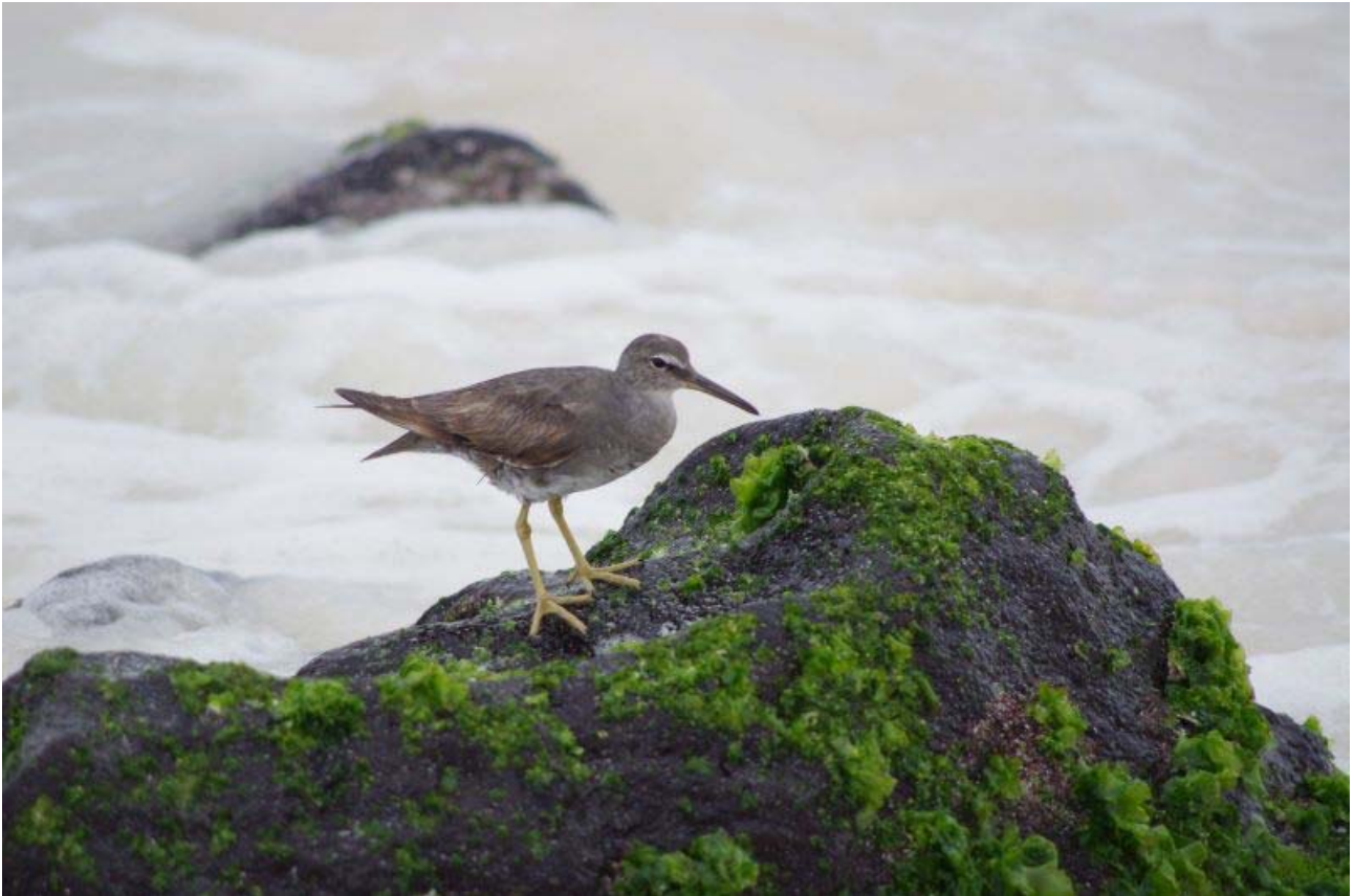
Wandering Tattler – talrig på klippeskærerne.