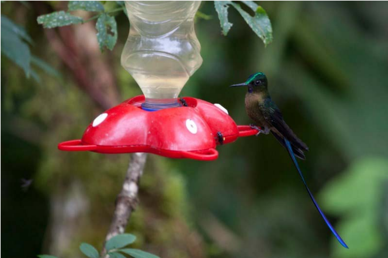
Violet-tailed Sylph.