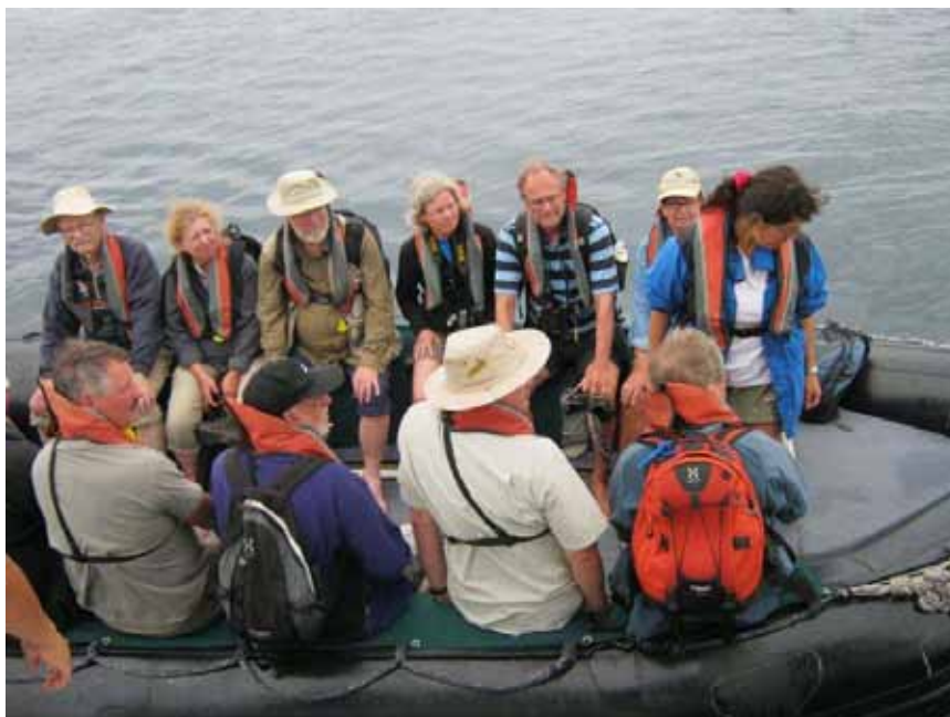
Vikingerne klar til en ny erobring via wet landing.

Ankeret blev kastet kl. 4 på Santiago (James). Kl. 06.15 var vi i Zodiacen med wet landing i James Bay. To andre skibe har også smidt anker her, så vi må finde os at dele stranden og traillet med andre. Men guiderne sørger for at koordinere vandringerne, så vi undgår for megen sammenrend.