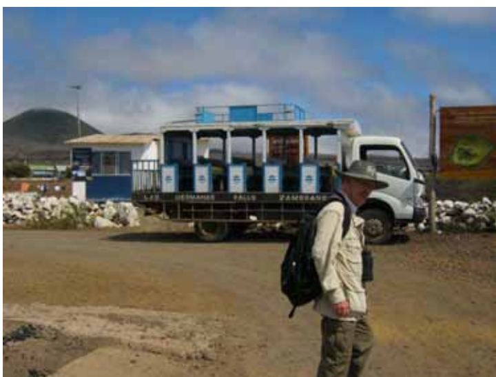
Max leder efter chaufføren til bussen, som skal køre os til højlandet.

Om eftermiddagen bliver vi sat i land i byen Valasco Ibarre på Floreana ikke langt fra Post Office Bay. Her bor der 100 sjæle, som har en flot kirke med blå lys, der tændes, når det bliver mørkt. Vores "bus", en halvåben vogn med træsæder og høje trin, står klar. Vi sætter os alle op, men der er ingen chauffør. Vi dytter i hornet, og der kommer en mand springende ude fra molen. Det er dog ikke hans tur til at køre op, for den chauffør, der var tiltænkt vores tur, kom susende netop, som vi har sat i gang. Det kommer til en større meningsudveksling mellem chaufførerne og vores guide. Vi kommer dog af sted i raslebusen efter 10 minutters parlamentering.