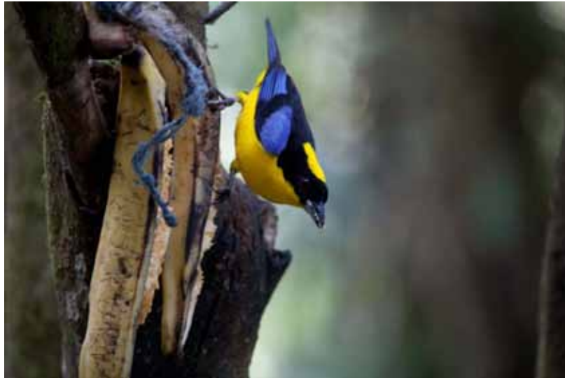
Blue-winged Mountain-tanager.

Black-chinned Mountain-tanager – Anisognathus notabilis Chocó endemic. 3 den 15/9 til frugtfodring i Refugio Paz de las Antpittas.