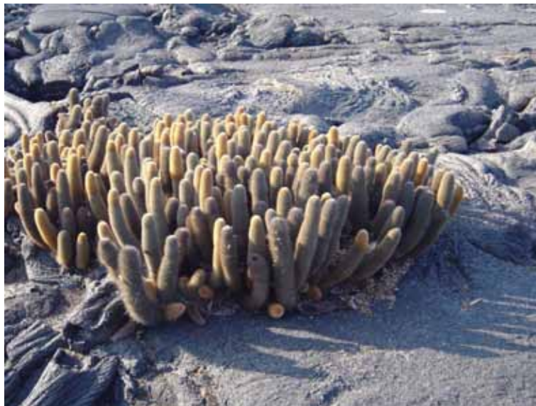
Lavakaktus. Noget af det første liv på lavaklipperne.