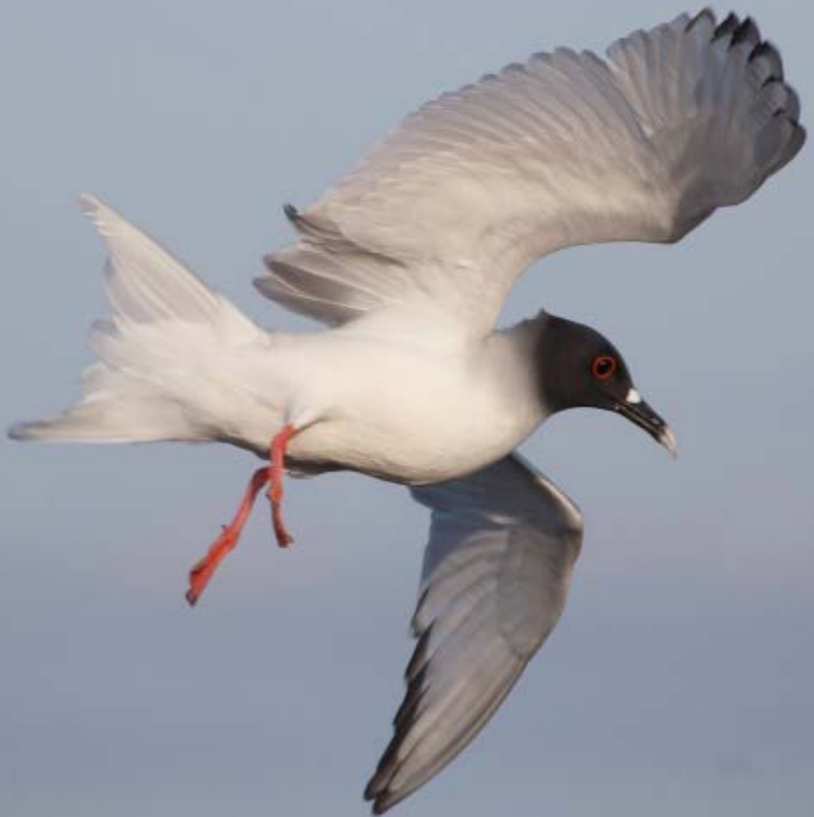
Farvel og kom snart igen! Swallow-tailed Gull.