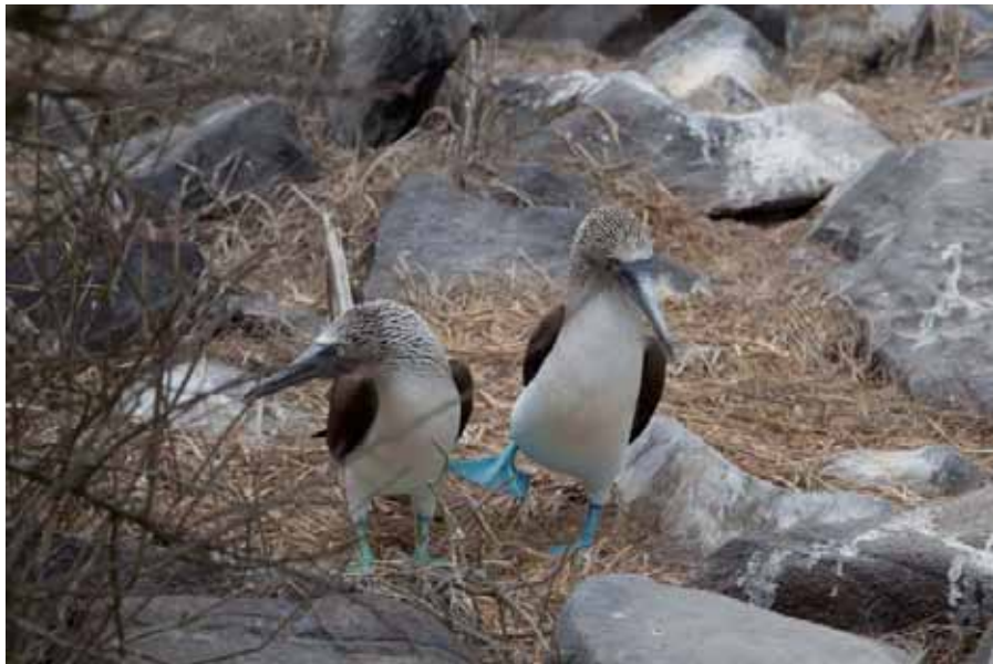
Blue-footed Booby. Hannen er i fuld gang med parringsdansen.

Endemisk underart for Galapágos. Vi havde fine og intense observationer af ynglende fugle på Española, hvor vi så deres vidunderlige parringsdans". Flest fugle sås den 20/9 ved Isabela og Fernandina. Totalt opgjort til 240 iagttagelser.