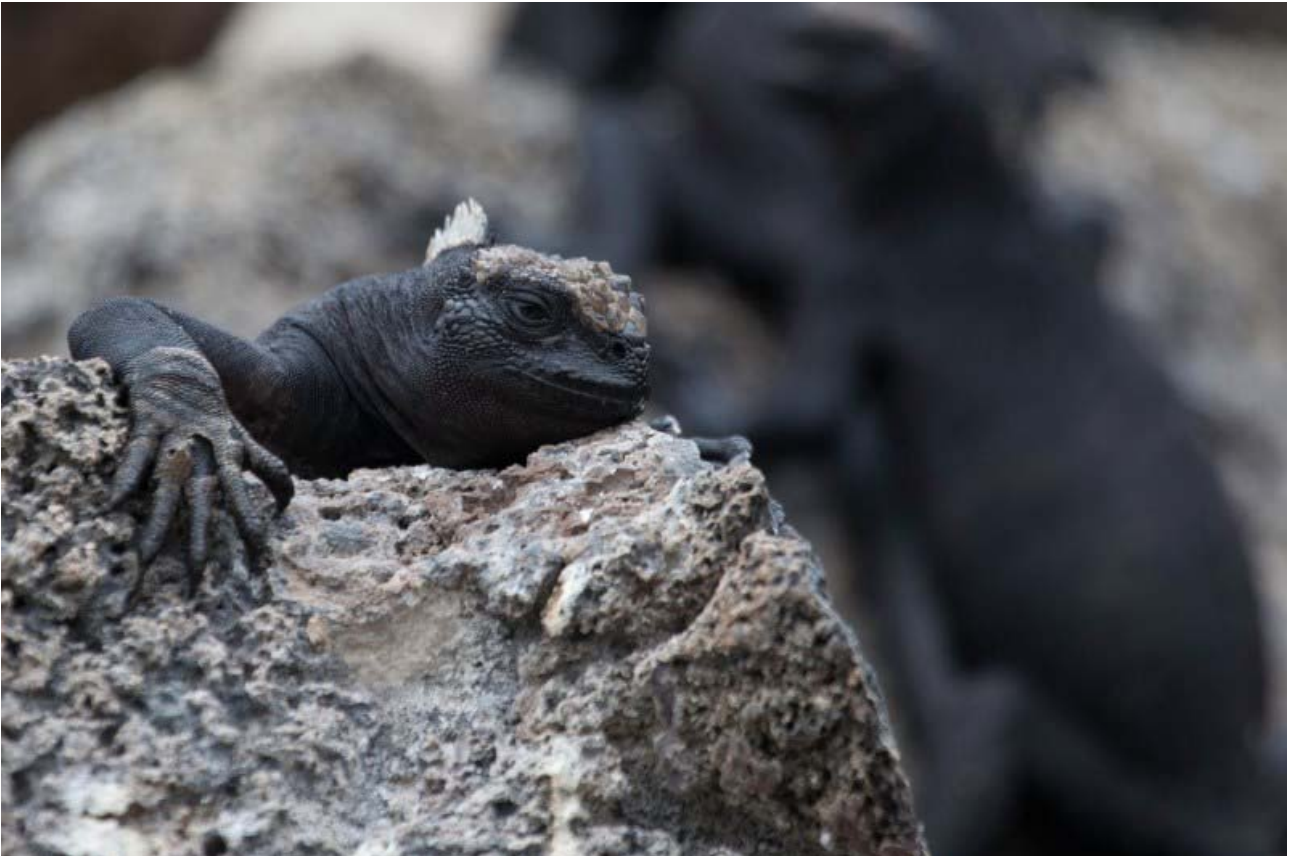
Marine Iguana får varmen på klipperne før næste neddykning i det kølige vand.