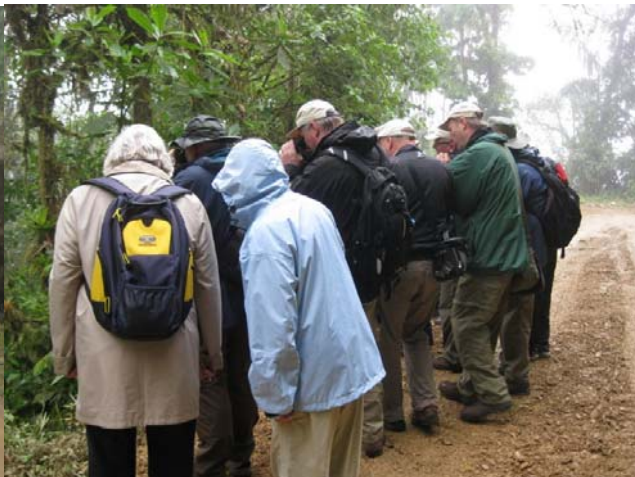
Endnu en lille skulker gemmer sig i skovbunden.

Frokosten indtages i byen Pacto undervejs til Oilbirds-lokaliteten. Vi får kaffe og te på en lille restaurant og spiser frokosten i "byparken". Hyggelig lille by. Fra Pacto tager vi til Rio Guallabamba over et bjerg. På vej ned til floden kører vi på en skråning med flot udsigt – og langt ned. Så det er bare med at holde sig på vejen. Guiden, som skal lukke os ind til Fedtfuglene afhentes på en ranch 5 km. før. Det koster 10 USD pro pers. at komme indtil de forjættede Fedtfugle. De yngler i en ravine, og ikke i en grotte, som først antaget. Derfor var lyset perfekt for fotograferne. Af de 14 Fedtfugle var en lille unge – grå og helt afhængig af moderen, der lå ved siden af. De virkede ikke skræmte ved vores besøg.