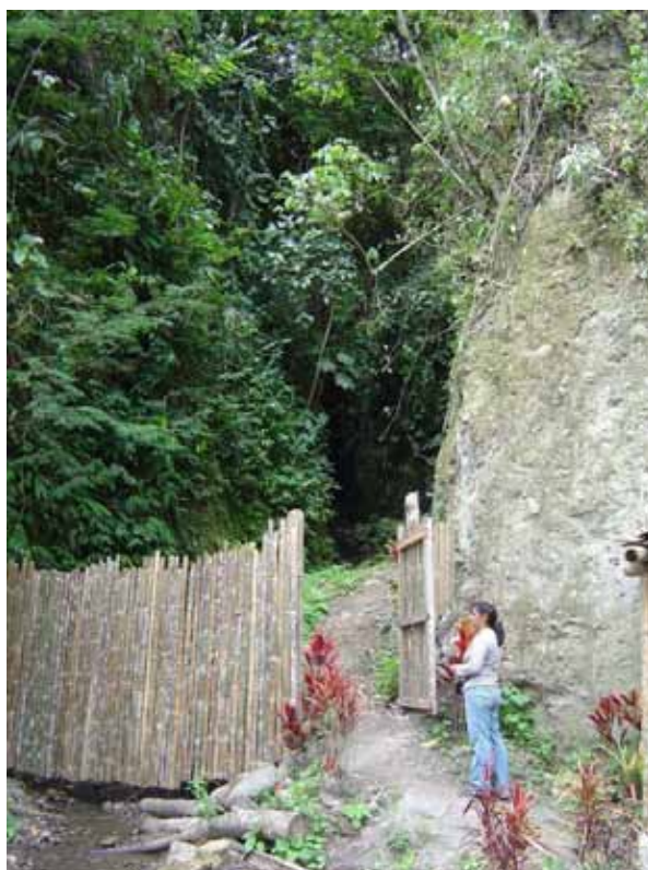
Så er der åbnet op til de forjættede Oilbirds.

Frokosten indtages i byen Pacto undervejs til Oilbirds-lokaliteten. Vi får kaffe og te på en lille restaurant og spiser frokosten i "byparken". Hyggelig lille by. Fra Pacto tager vi til Rio Guallabamba over et bjerg. På vej ned til floden kører vi på en skråning med flot udsigt – og langt ned. Så det er bare med at holde sig på vejen. Guiden, som skal lukke os ind til Fedtfuglene afhentes på en ranch 5 km. før. Det koster 10 USD pro pers. at komme indtil de forjættede Fedtfugle. De yngler i en ravine, og ikke i en grotte, som først antaget. Derfor var lyset perfekt for fotograferne. Af de 14 Fedtfugle var en lille unge – grå og helt afhængig af moderen, der lå ved siden af. De virkede ikke skræmte ved vores besøg.