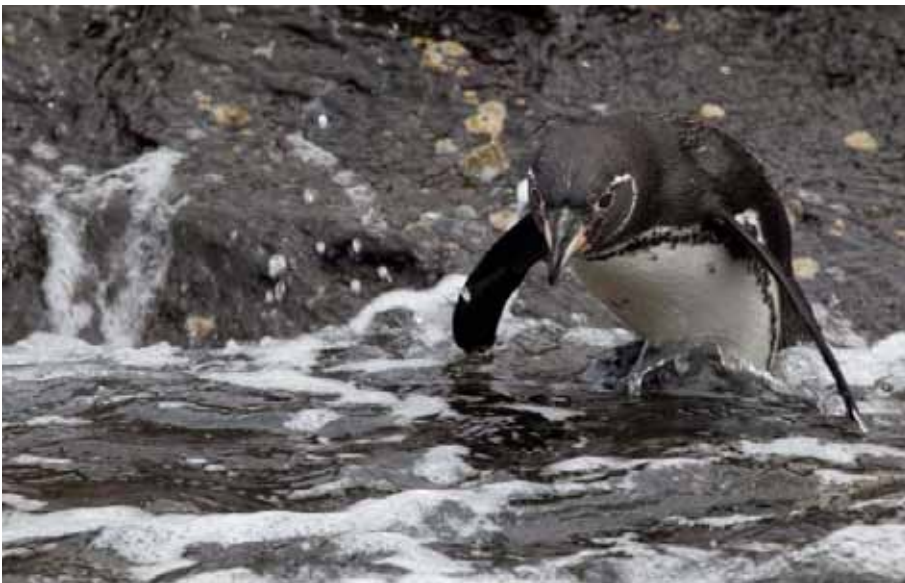
Galapagos Pinguin på spring.

Endemisk. Conservation status: endangered . Verdens sjældneste Pingvin med ca. 1500 individer opgjort i 2004. Vi så i alt 11 fugle: 8 Tagus Cove på Isabela og 3 ved Post Office Bay, Floreana. Under zodiac-turen og landing i Post Office Bay kaldte vores zodiac-fører en Pingvin hen til os. Den "talende" Pingvin blev derfor udnævnt til dagens fugl. Arten er den eneste Pingvin, der yngler på den nordlige halvkugle tæt på Ækvator. Den kan overleve her som følge af den kolde vand, som er et resultat af mødet med de kolde Humboldt og Cromwell strømme.