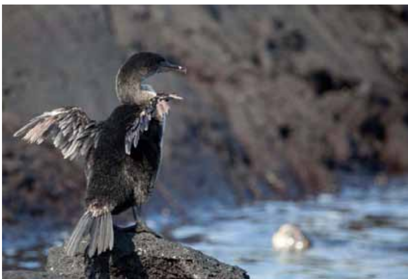
Flightless Cormorant.

Endemisk. Conservation status: endangered . Unægtelig et særsyn at en fugl, der ikke kan flyve, og som har overlevet til nutiden. Med en bestand på 900-1500 individer, er det en af de sjældneste fugle i verden. Den yngler kun på øerne Fernandina og Isabela. Der har været gjort store anstrengelser for at sikre arten. Bl.a. er hunde, katte og svin blevet fjernet fra øerne. Største farer er rotter, drukning i fiskenet og menneskelig forstyrrelse. Vi noterede 20 fugle, hvilket er 2,2% af verdensbestanden (såfremt populationen er det laveste estimat på 900 individer). Vi så ynglende fugle både ved Tagus Cove på Isabela (9 fugle) og Punta Espinosa, Fernandina (11 fugle).