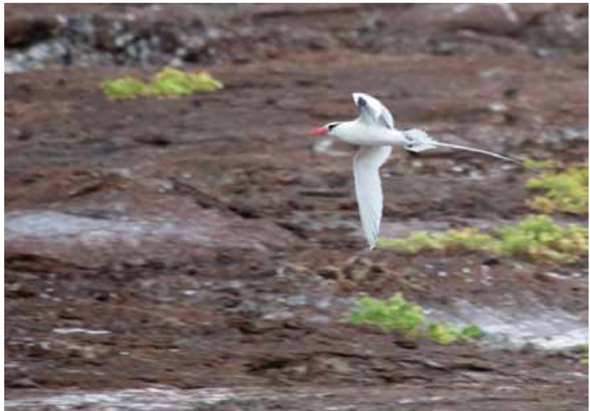
Red-billed Tropicbird.

I alt 303 fugle noteret. Flest Genovesa med 200 fugle den 19/9. Herudover 2 dage med 50 fugle (18/9 South Plaza og 24/9 Española.