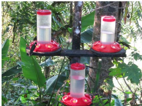
Man kunne bruge mange timer ved feeder'ne.