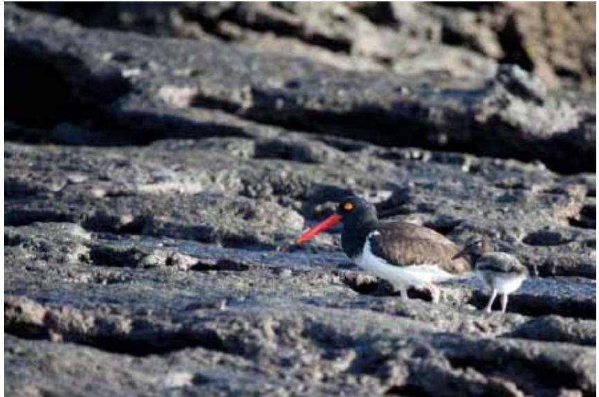
American Oystercatcher med nyudklægget unge. Bartolomé.