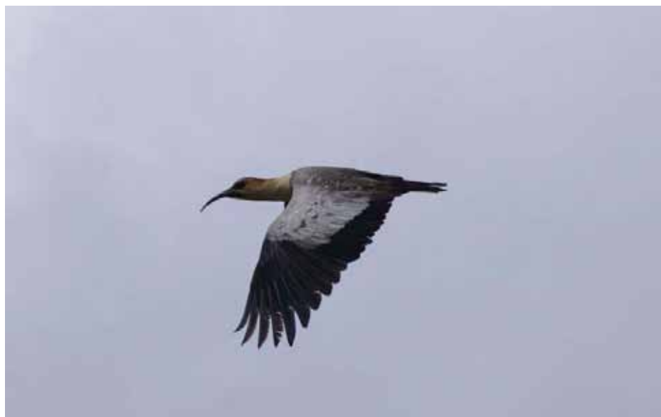
Black-faced Ibis.

7 fugle den 26/9 Vulcano Antisana. De sås rigtigt godt - fødesøgende i græsset og forbiglyvende med lyd – så godt at de blev udnævnt til dagens fugl. Arten befinder sig i dets nordlige udbredelsesområde, så vi har her med en lokal sjældenhed at gøre. Underarten branickii 's udbredelse er begrænset til en højde af 3000-5000 moh i Ecuador, Peru og Bolivia.