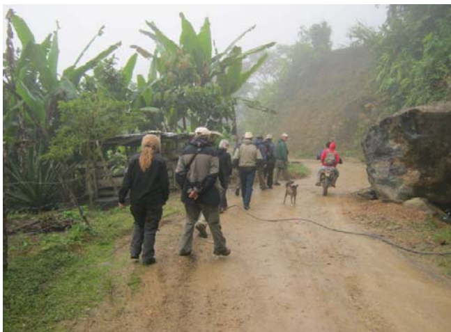
Der var ikke den bedste sigt her i Masphi.

skal returnere til udgangen, når vi kommer til lågen ved den nye lodge, der er under opførelse, for enden af vejen.