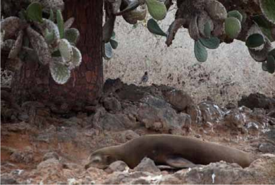
Charles Mockingbird var ikke så tillidsfuld, men den var der.