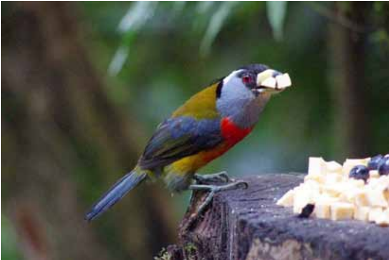
Toucan Barbet.

Chocó endemic. Set/hørt på 4 dage med i alt 12 noteringer. Flest 14/9 med 5 Masphi Reserve.