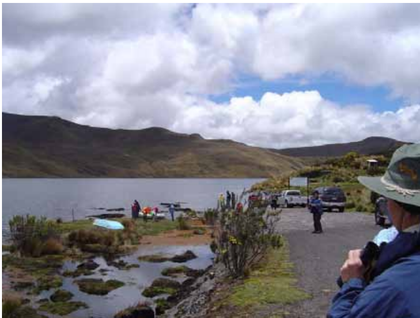
Lake Mica, Antisana.

Vi ser først endnu en Kondor rigtig fint, og senere får Lars øje på to sammen omkring den snedækkede vulkantop. Umiddelbart herefter ses 7 flotte Black-faced Ibis, som har deres nordligste udbredelse her. Ved lake Mica holder vi frokost. Der er en del lokale besøgende, og der sejles i gummibåde og der fiskes. Men der holder også Silvery Grebe til i søen, ligesom vi ser en masse Andean Coots, og nogle ænder. Så der er masser at se på under vores frokost. Som nævnt er der flere søndagsturister. Af bilerne at dømme (4-hjulstrækkere), så det kunne være de rige folks børn fra Quito, der er på tur. De er nysgerrige, og de forsøger at få kontakt til os på engelsk. De for lov at se i et teleskop. Det har de ikke prøvet før, for stor var deres overraskelse over, at man pludselig kunne se ting rigtig tæt på.