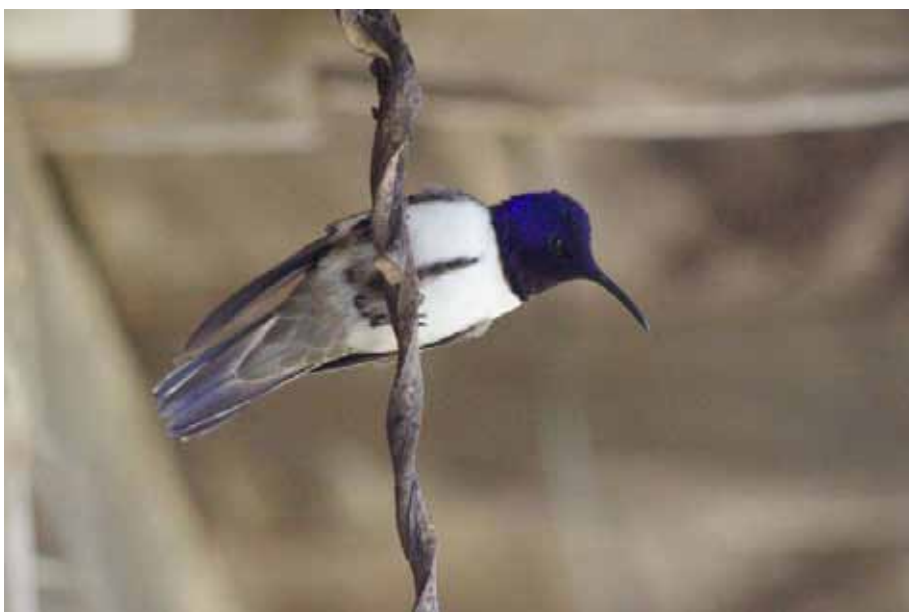
Ecuadorian Hillstar.

Kolibrien, der lever i højdene: 10 fugle Vulcano Antisana. De havde feeders ved en hacienda, så vi fik her set dem rigtigt fint. Øvrige iagttagelser bar præg af lynhurtige fugle, hvor vi oftest kun nåede at høre deres summen.