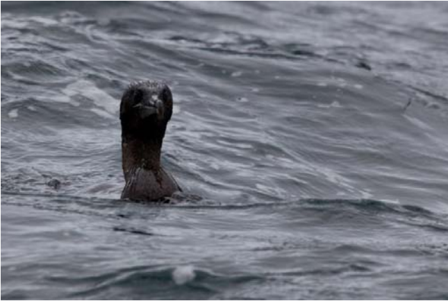
Flightless Cormorant i sit rette element.