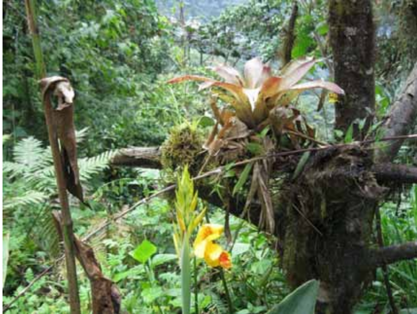
Øverst udsnit fra Bellavista Cloud Forest. Nederst en af mange overdimensionerede blomster.