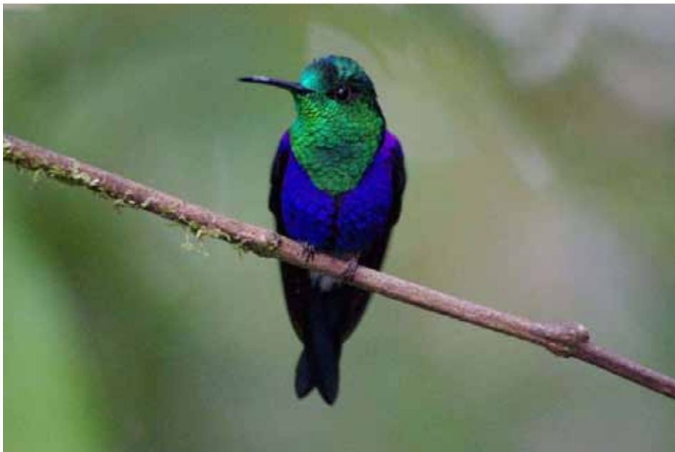
Green-crowned Woodnymph, han.

I alt 30 noteringer fordelt på 4 dage. Flest Séptimo Paraiso Lodge (flere gengangere noteret), men også Los Bancos Mindo og Mindo Cloud Forest.