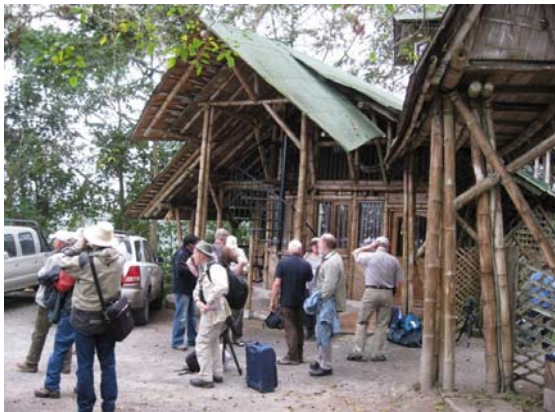
Indkvartering Bellavista Lodge