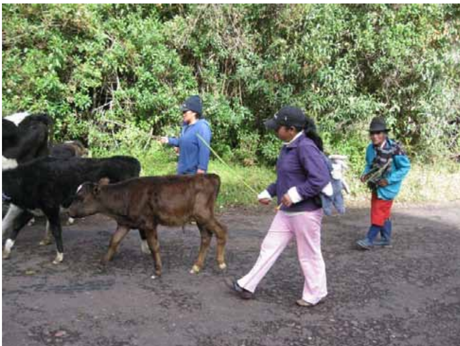
Tre generationer passer kvæg. Og den gamle kunne skam løbe rigtigt hurtigt.

Vi kører videre og Roger opdager en Kondor højt oppe, og den forsvinder langsomt i det fjerne. Når vejret er godt, så flyver Kondoren højt, og vi har rigtigt godt vejr! Det har ellers regnet noget den sidste uge, siger Roger, men typisk med klare morgener og så byger om eftermiddagen. Roger oplyser, at der kun er 70 Kondorer tilbage i hele Ecuador, så den er hårdt presset. Fonde omkring Birdlife International havde ellers planlagt at opkøbe en stor del af området på toppen af vulkanen til en pris på 1 mio. USD. Men så kom finanskrisen og det blev sat i bero. Kvæg- og landbrugsområder breder sig, ligesom vi ser plantagetilplantninger med nåletræer. Herudover jages der også i området, så Kondoren er ikke sikret her på dens bedste lokalitet i landet.