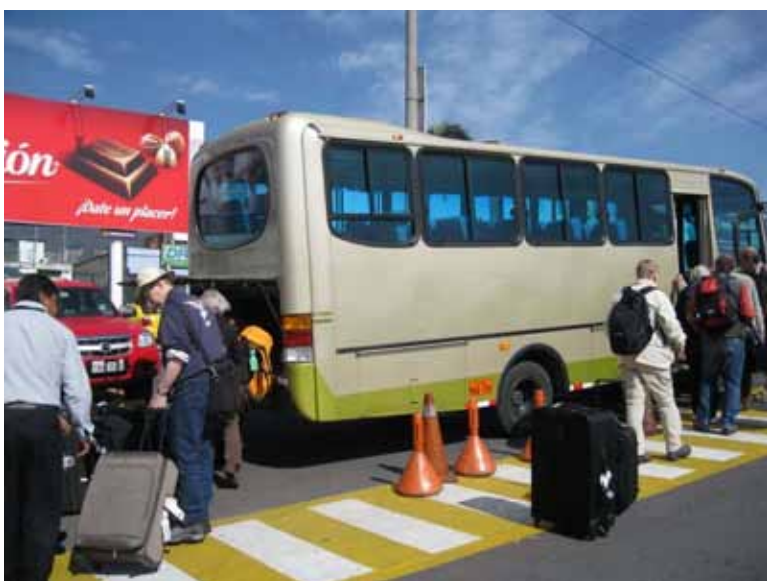
Ankomst til Quito og bussen holder klar.

Vejr: sol, senere tåge og regnbyge med et tordenskrald. 15 grader.