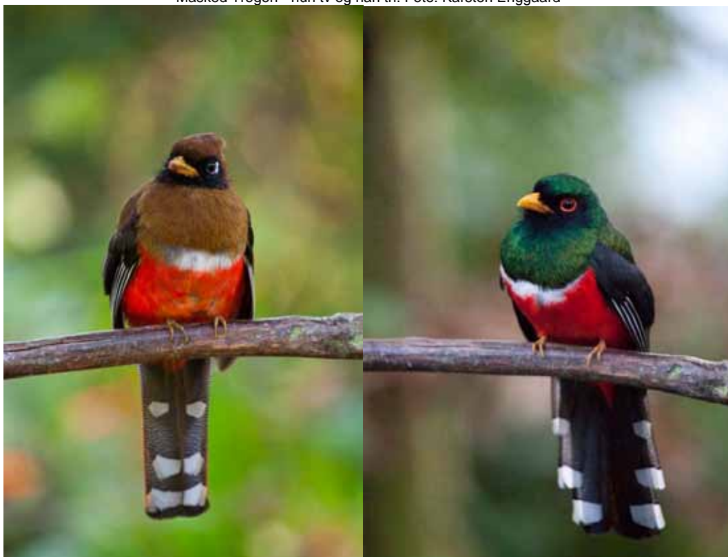
Masked Trogon - hun tv og han th.