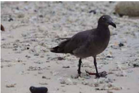
Lava Gull.

Vi noterede 22 fugle: 9 den 18/9 Baltra, 10 den 19/9 Genovesa og 3 den 22/9 Santa Cruz, fiskemarkedet i Pto. Ayora.