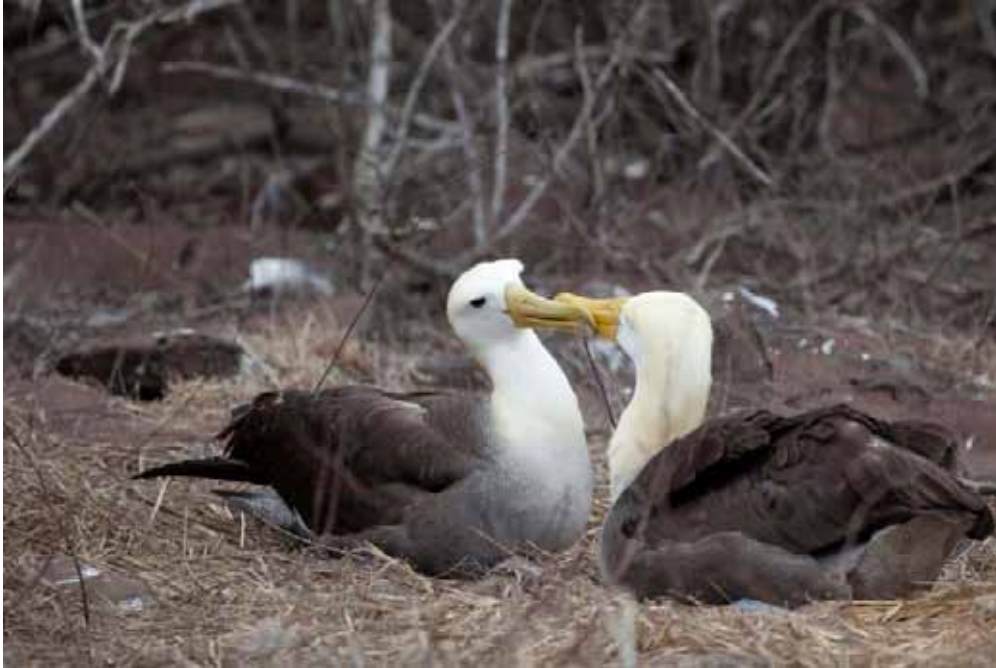
Waved Albatross.

Endemisk. Conservation status: endangered . Bestanden var i 2001 opgjort til ca. 34.000 individer. Ifølge Silvia er bestanden nu ca. 12.000 par. Der har været frygt for artens kollaps pga. langline fiskeri, illegalt fiskeri i nærområdet samt turisme. Yngler kun på øen Española/Hood på Galapágos udover nogle få par på fastlandet. Vi noterede i alt 80 fugle primært på Hood Island den 24/9, samt 3 under sejladsen nord for Santiago den 21/9 samt 2 fra vores zodiac-cruise omkring Isla Champion den 23/9.