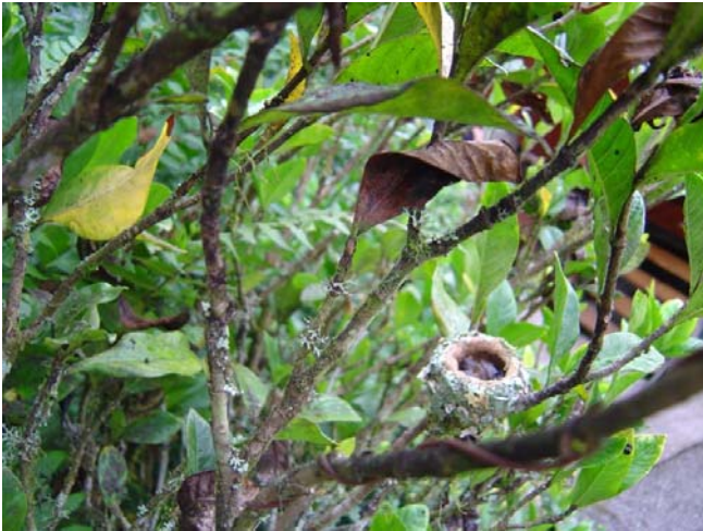
Rede med to unger af Rufous-tailed Hummingbird.