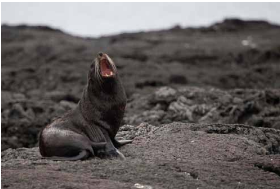
Går i ikke snart? Pelssæl på yngleplads. James Bay, Santiago.

Også Pelssælen var i god bestandsudvikling. Vi noterede 10 dyr: 1 tyr den 19/9 Genovesa, 2 den 20/9 Fernandina (Punta Espinosa) smat 7 den 21/9 Santiago (James Bay).