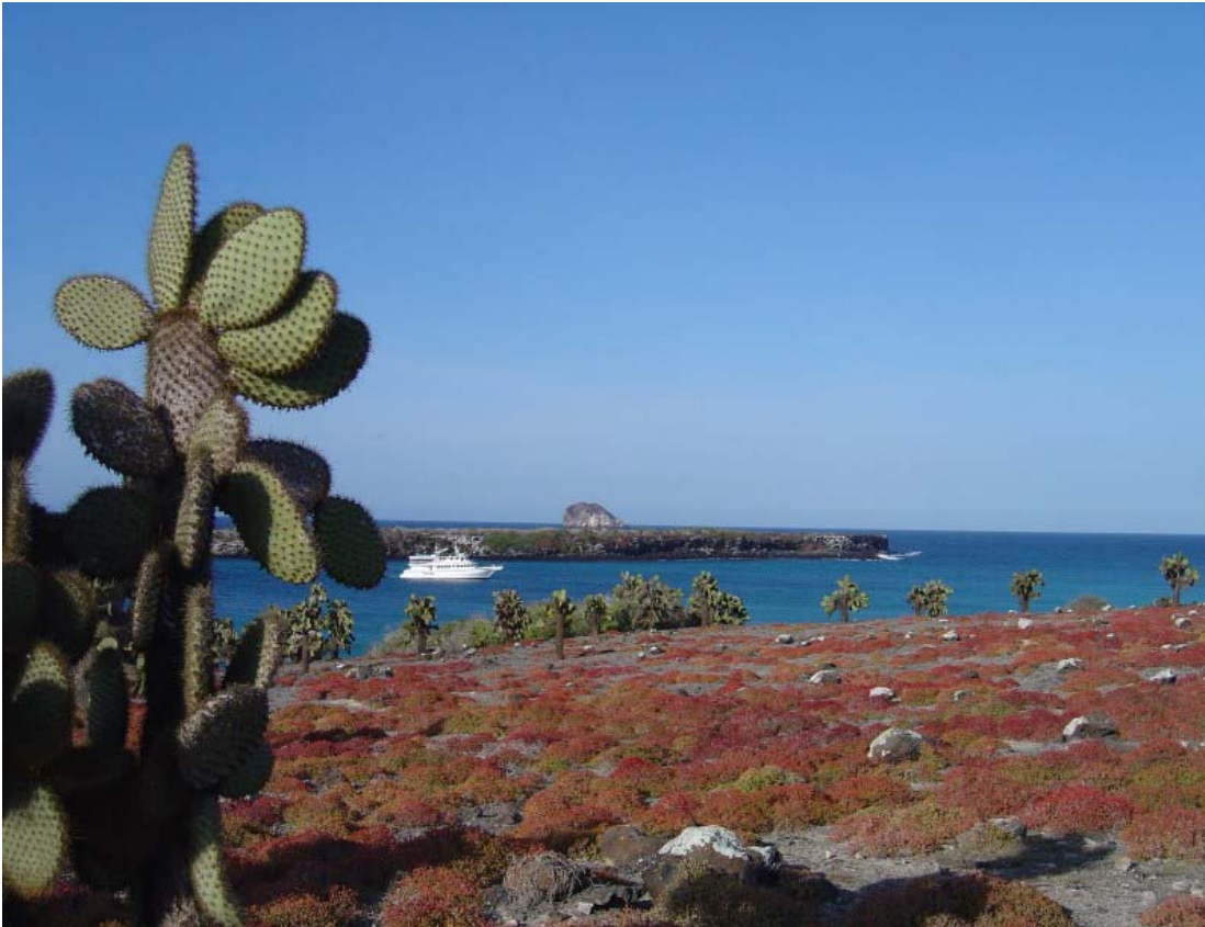
Reina Silvia opankret i bugten South Plaza.

Vi ligger for anker indtil kl. 23, hvor vi begiver os nordpå på vej mod Genovesa eller Tower (hvis man er til det engelske). Alle øerne har mindst et spansk og et engelske navn.