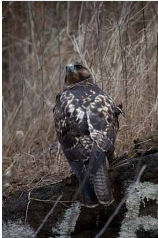
Galapagos Hawk.