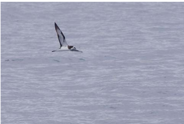
Galapagos Petrel.

Endemisk. Conservation status: critically endangered . Største trussel er tilstedeværelsen af rotter på ynglørerne. Tidligere regnet som en race af Dark-rumped Petrel. I alt 49 noteringer fordelt på 5 dage under sejladsen på Galapágos. Flest den 18/9 under sejladsen fra Baltra til South Plaza.