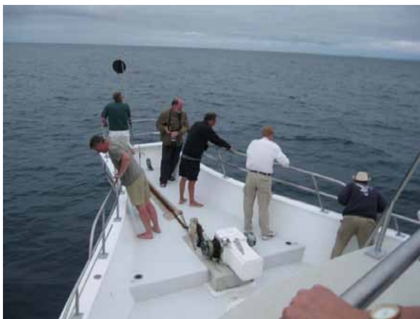
Delfinerne siger farvel og god rejse.

Finalen inden lyset forsvinder var en flok på ca. 50 Bottlenosed Dolphins, som følger skibet og flere eksemplarer leger foran boven. Silvia fløjter. Det skulle tiltrække Delfinerne. En værdig afslutning på vores Galapagos-eventyr.