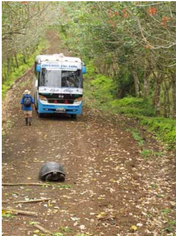
Der er dyr på vejen.