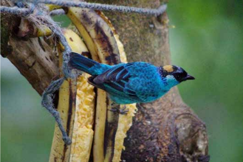
Golden-naped Tanager.

Metallic-green Tanager – Tangara labradorides labradorides Chocó endemic. 2 fugle den 12/9 Tony Nunnery's House.