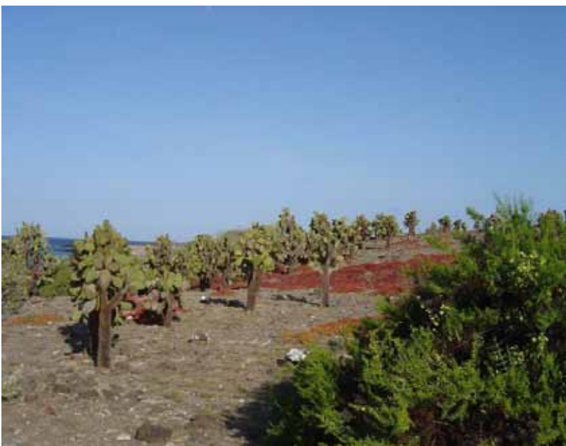
Parti fra South Plaza.

I Baltra mødes vi af de første Black Noddier, Brown Pelican, og Fregatfugle. Kl. 13 begiver vi os af sted til South Plaza, en sejltur som tager 2 timer. Undervejs ser vi de første Skråper og Tropikfugle. Efter at der var smidt anker i bugten ved South Plaza, bliver vi sejlet ind til øen i en Zodiac med henblik på en dry landing. Det vrirler med Galapágos Shearwaters og Swallow-tailed gulls. Endvidere Landleguaner i alle størrelser, og vi ser Cactus Finch sammen med Ground Finches. Vi ser solen på vej ned, og vi kan beundre dette tørre landskab med de spredte kaktustræer. Som solen går ned bliver den friske vind kølig, men vi kan varme os lidt ved at tænke på at har været på vores første landing på Galapágos.