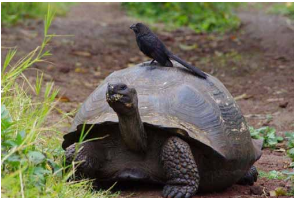
Smooth-billed Ani på plads. Santa Cruz.

13 fugle på fastlandet, med 10 den 14/9 og 3 den 18/9. På Galapágos i alt 28 fugle på øerne Isabela, Santiago og Floreana.