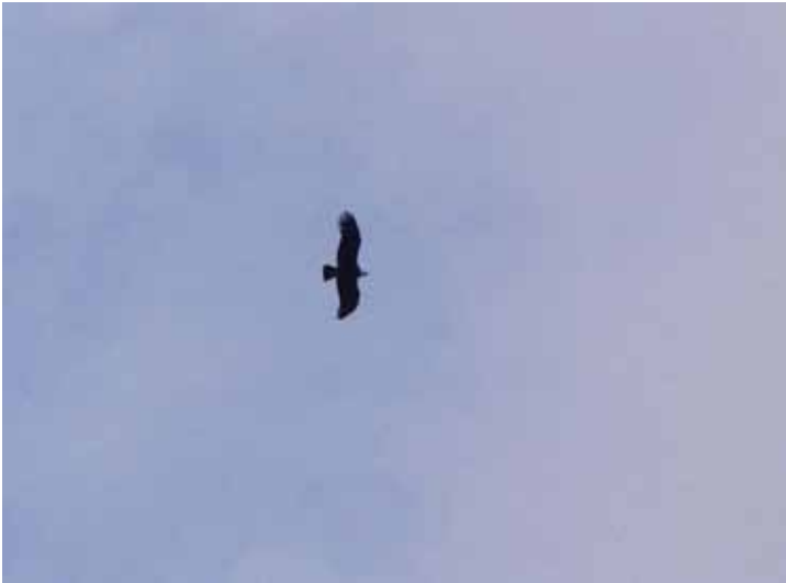
Andean Condor nær Yanacocha.