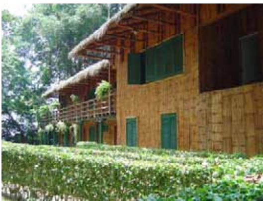
Rio Palenque Research Station.