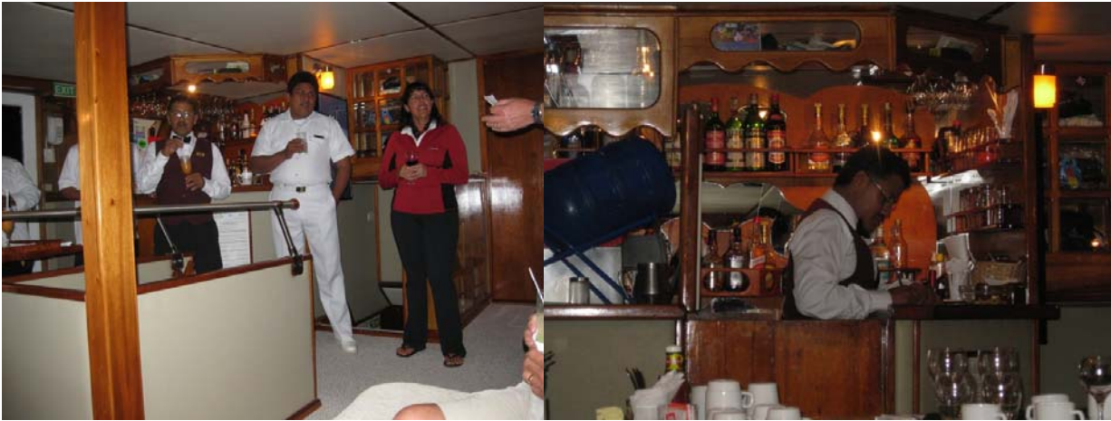
Takketale for guide, kaptajn og besætning.