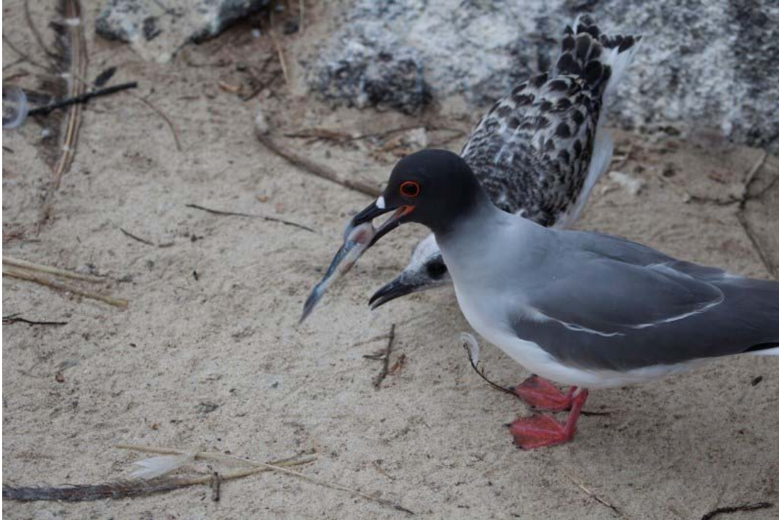
Så er der uddeling fra nattens fourageringstogt. Genovesa.

Endemisk. Fouragerer om natten, og er derfor ikke så udsat for prædation fra Fregatfugle. Er den eneste måge/havfugl, der er helt nataktiv. Vi noterede 433 fugle fordelt på 5 dage under Galapágos-turen. Flest den 19/9 med 250 Genovesa.