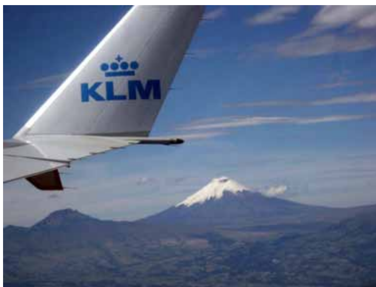
Nu er vi her snart. Indflyvning til Quito med Cotopaxi-vulkanen i baggrunden.