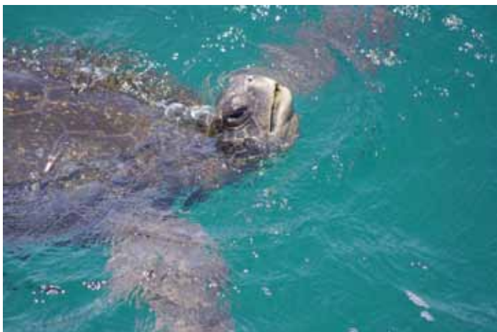
Green SeaTurtle.

Conservation status: Vulnerable . Det er utroligt fascinerende at bade/dykke med Havskildpadder. Vi så mange komme ind til stranden for at yngle. I alt 120 blev noteret på 4 af dagene. Flest den 20/9 Targus Cove, Isabela og Punta Espinosa, Fernandina med 75 eksemplarer. Den grønne havskildpadde kan blive op til 1 meter lang og veje 180 kg. Normalt klækker deres nedgravede æg om natten, da overlevelsesraten af de små skildpaddeunger er væsentlig højere, end hvis det sker om dagen. Her sørger Fregatfluglene for at plukke hver og en, der måtte vove sig udover stranden.