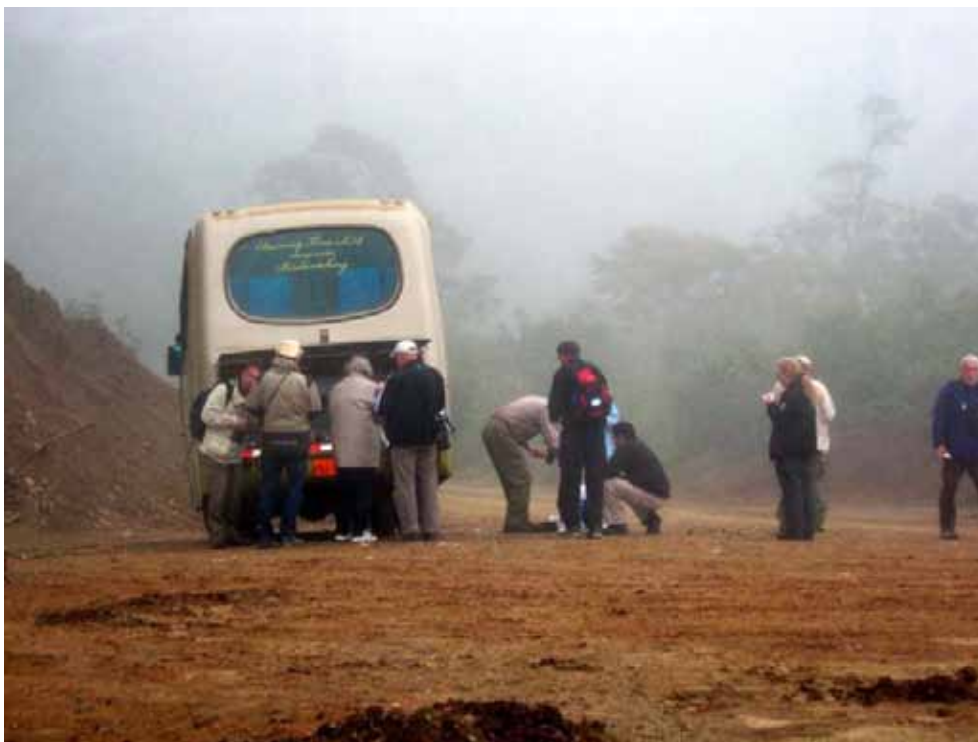
Tågen lå tæt da vi ankom til Masphi Reserve – og morgenmaden blev stående.

Vi er tidligt på færde med afgang kl. 5. Vi skal til et nyt godt reservat: Mashpi, som ligger 1½ times buskørsel fra Séptimo Paraiso i nordvestlig retning. Vi er her i 1600 meters højde.