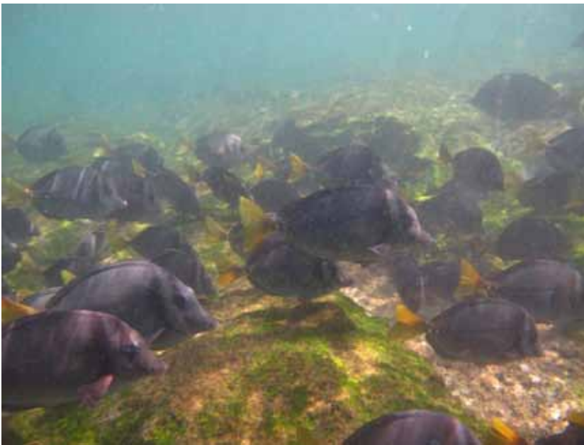
Razor Surgeonfish.

Den 21/9 Bartolomé noteredes 150 og den 23/9 100 Isla Champion.