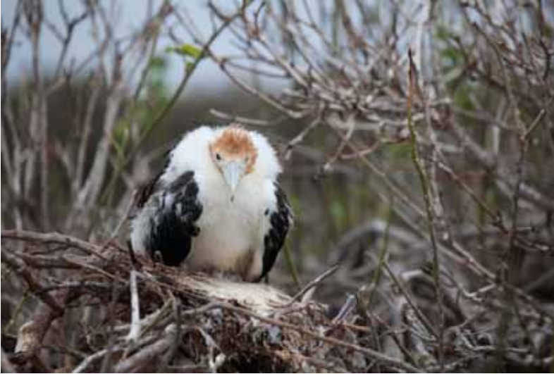
Den lille piratunge af Great Frigatebird – Genovesa.