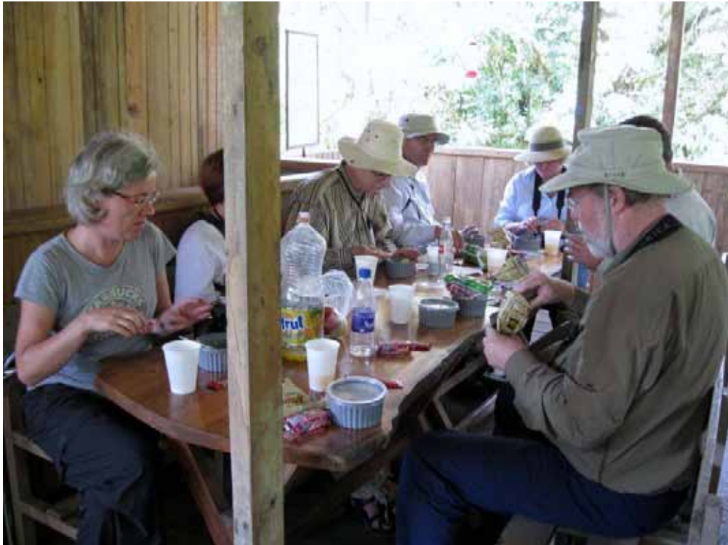
Det blev sen frokost. Der var simpelthen for mange fugle, da vi ankom til Mindo Loma.