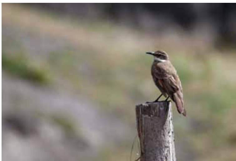
Stout-billed cinclodes.