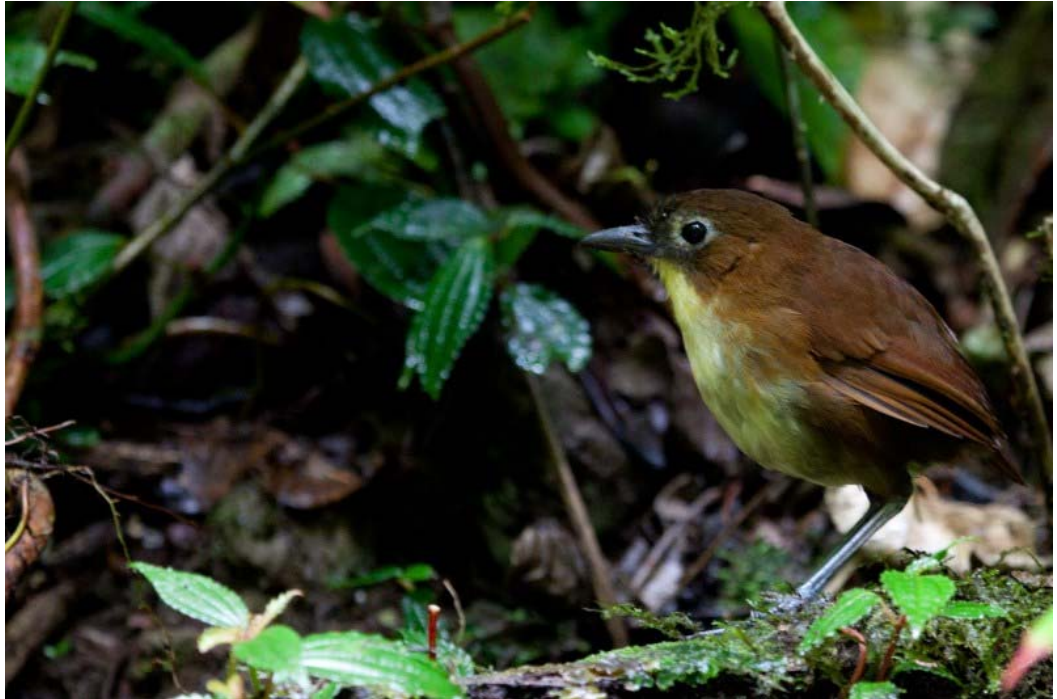
Yellow-breasted Antpitta.

Chocó endemic. Endnu en tillidsfuld Antpitta ved Refugio Paz de las Antpittas, hvor en fugl den 15/9 dukkede frem af buskene nede ved floden, når der blev viftet med larver.