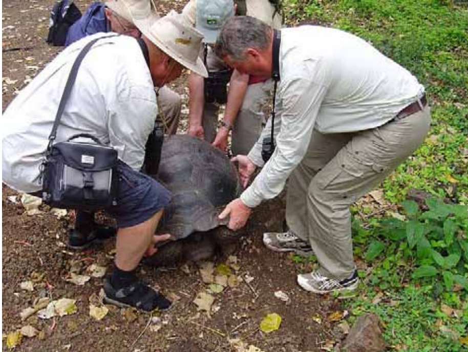
En af turens læger underviser i skildpaddeløft. Det er et trin før skildpaddekast. Santa Rosa.

Vi spiser frokost på en restaurant i højlandet. Et bohemeagtigt sted. Maden er god og veltillavet. Tærte, kylling og kage + velkomstdrik med en god portion rom. Mætte og veltilpasse ruller vi ned til Porto Ayora. Her besøges Darwin Research Station og Lonesome George, den eneste tilbagelevende Kæmpeskildpadde fra øen Pinta. Den er sat sammen med to hunner indsamlet fra øen Pinta, men som er – af hvalfangere - sat af på øen San Christobal. De har ihverttilfælde lignende DNA som Lonesome George. Men indtil nu er der ikke kommet noget ud af det. Lonesome George er nok blevet for gammel med sine 60-90 år. Under besøget på Darwin Centeret bliver vi konfronteret med teorien om udbredelsen af de forskellige arter af Kæmpeskildpadder på Galapagos. Teorien er at udbredelsen er sket i istiden, hvor øerne var landfaste, da isen havde bundet alt vandet.