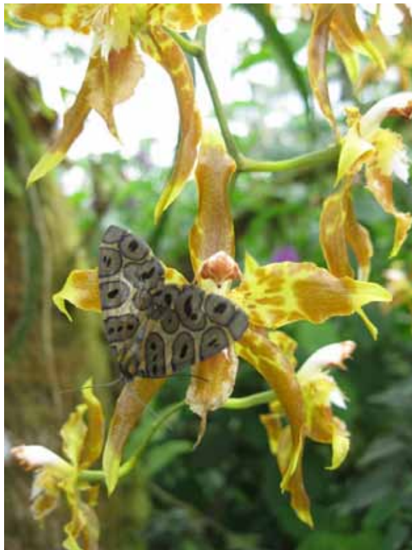
Sommerfugl og orkide – smukt.

Ved 14-tiden ankommer vi til Séptimo Paraiso Lodge, hvor vi skal tilbringe de næste 3 nætter. Vi når lige at indkvartere os, før vi står ude i haven og ser på flere Kolibrier. Op vupti – så har vi 5 nye Kolibriarter i bogen.