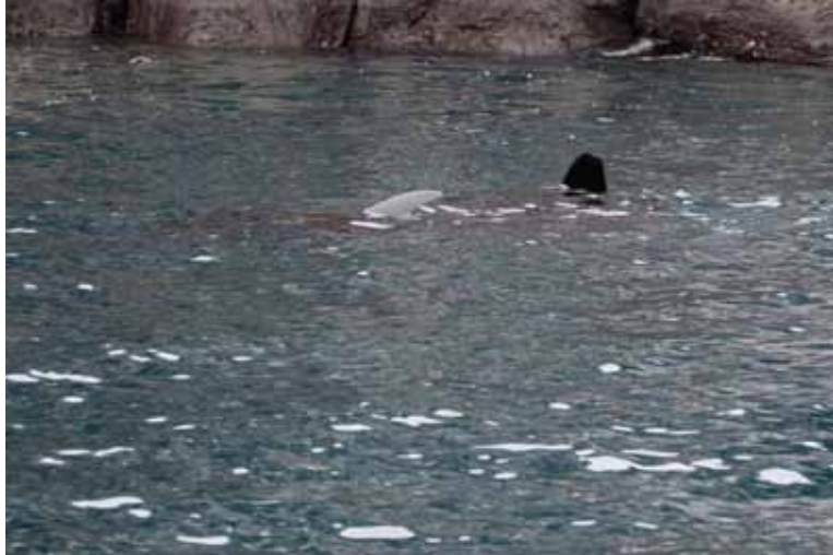
Manta Ray tæt på land. Genovesa.