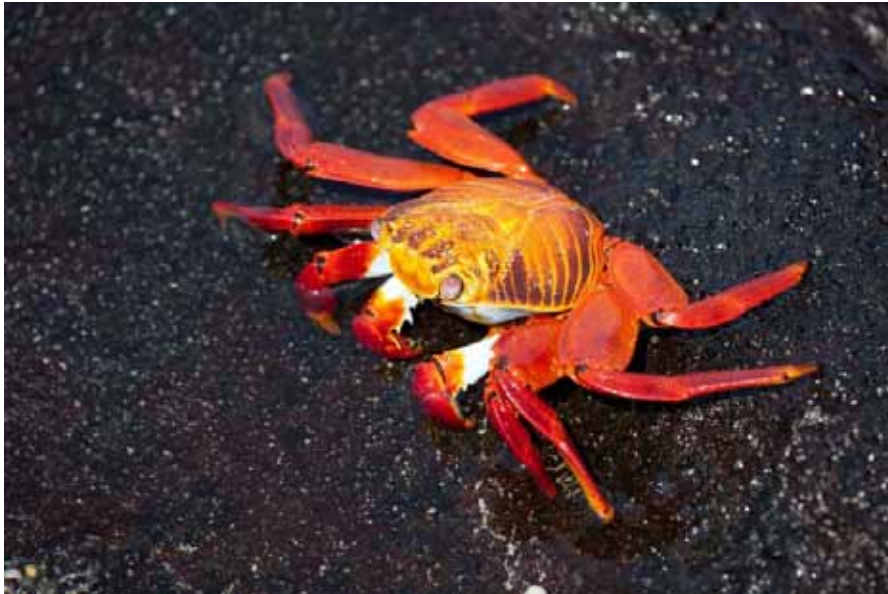
Sally Lightfoot Crab.

Så alle vegne på stranden/klipperne. 1650 eksemplarer er noteret fordelt på 6 dage.