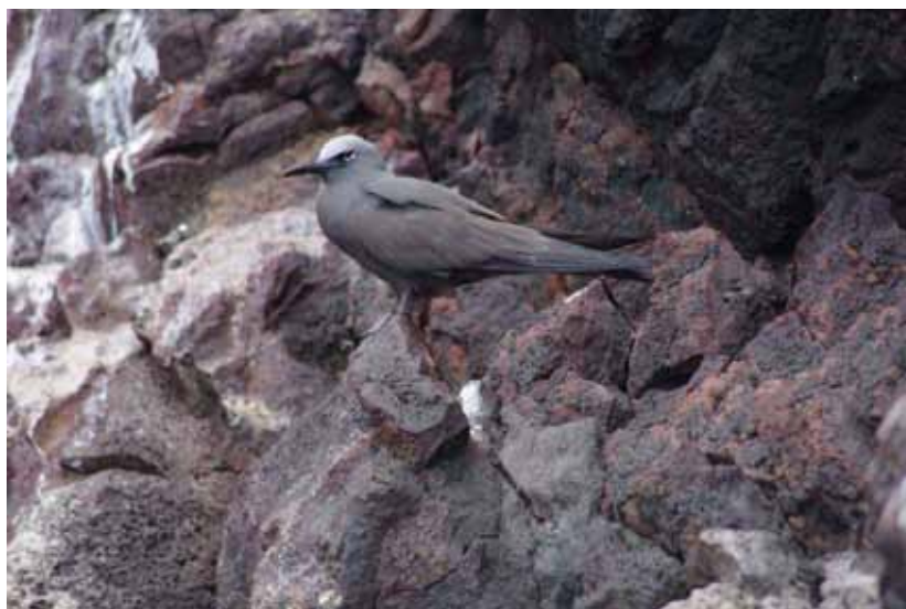
Brown Noddy.

Endemisk underart. Almindelig med iagttagelser alle dage på Galapágos. Totalt 273 fugle.