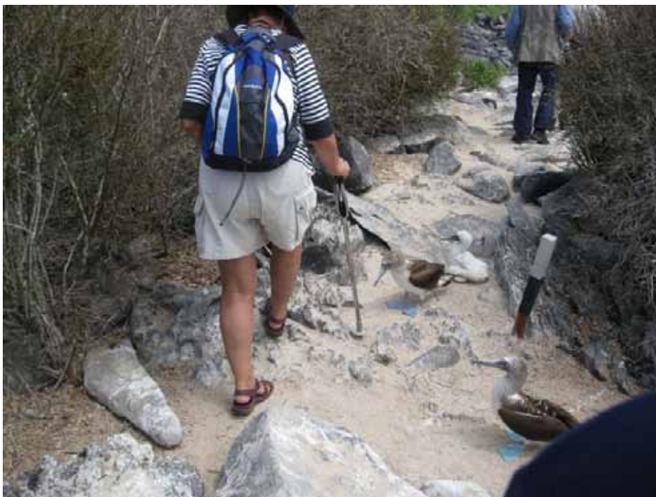
Nærkontakt med Blåfodet Sule.

Ved 11-tiden sejler vi en times tid til vores sidste landing på Punta Suarez, stedet hvor vi skal se Waved Albatross m.m. Dry landing efter en rundsejling ind bag en mole for at undgå brændingen, der her er er pæn. Søløveunger, herunder nogle, der er født til morgen, møder os. Efterbyrden ligger på stien til glæde for Mockingbirds og Firben. Hood er fyldt med Nazca Bobies, som yngler ved klippekanterne. Vi ser det berømte blowhole, hvor brændingen presses ind i et klippehul og presses højt op i luften, som en blåst fra en kæmpehval. Tropikfuglene yngler længere nede på klippeskrænten sammen med Svalehalemågerne. De Blåfodede Suler yngler længere inde på land, bl.a. på de stier vi tramper på. Et par havde deres store unge midt på stien og med en stor sten på den anden side, var det ikke til at undgå nærkontakt med parret, og de huggede uden varsel i vores fødder/ben. Og de har meget spidse næb, så fotograferne skal ikke bukke sig for langt ned uden beskyttelsesbriller!