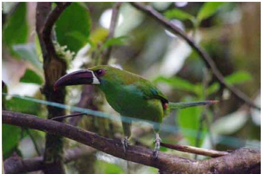
Crimson-rumped Toucanet.

I alt 9 noteringer fordelt på 5 dage. Flest 11/9 med 3 på vej til Bellavista Lodge.