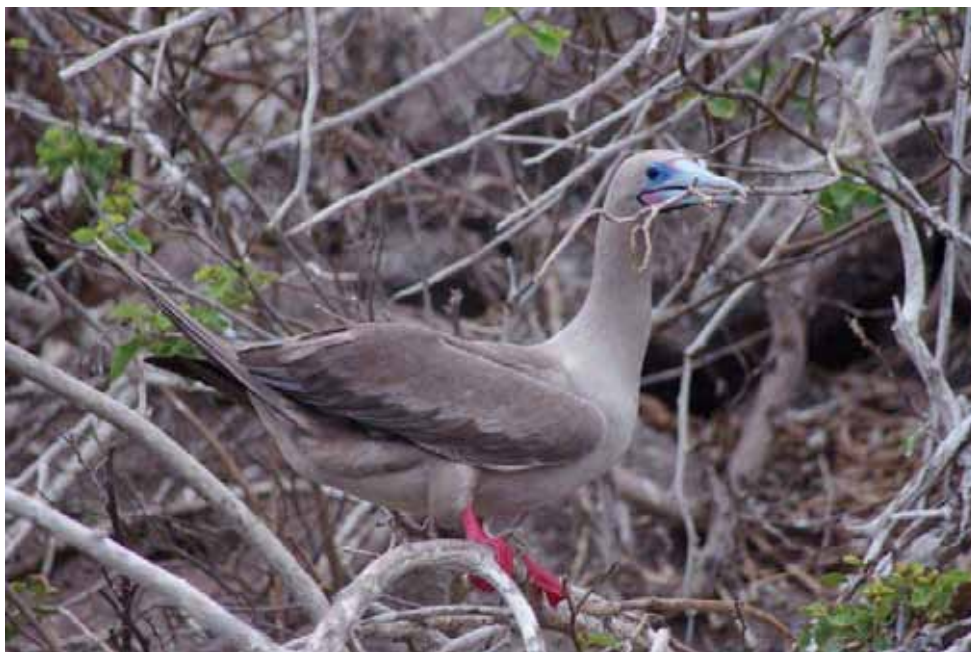
Red-footed Booby.

unger/ungfugle, der pludseligt ”dukkede op” i et mangrovetræ lige i hovedhøjde. Hovedparten af de 2000 noterede fugle var af den brune fase. Et mindrental var af den hvide fase < 10%.