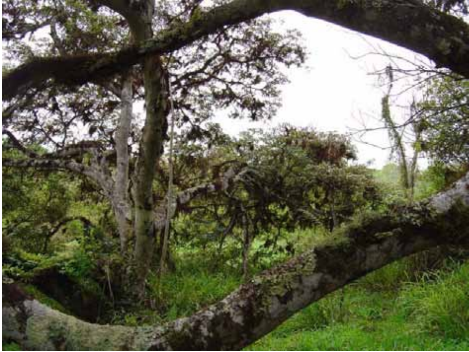
Santa Rosa Reservatet. Her skulle gerne have været vand, men desværre. Og på vejen tilbage syntes Silvia, vores guide, at vi skulle fare lidt vild.