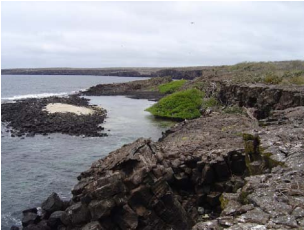
Genovesa – en er perlerne på Galapágos.