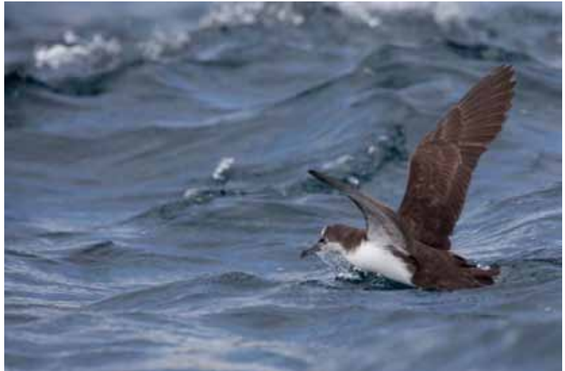
Galapagos Shearwater.