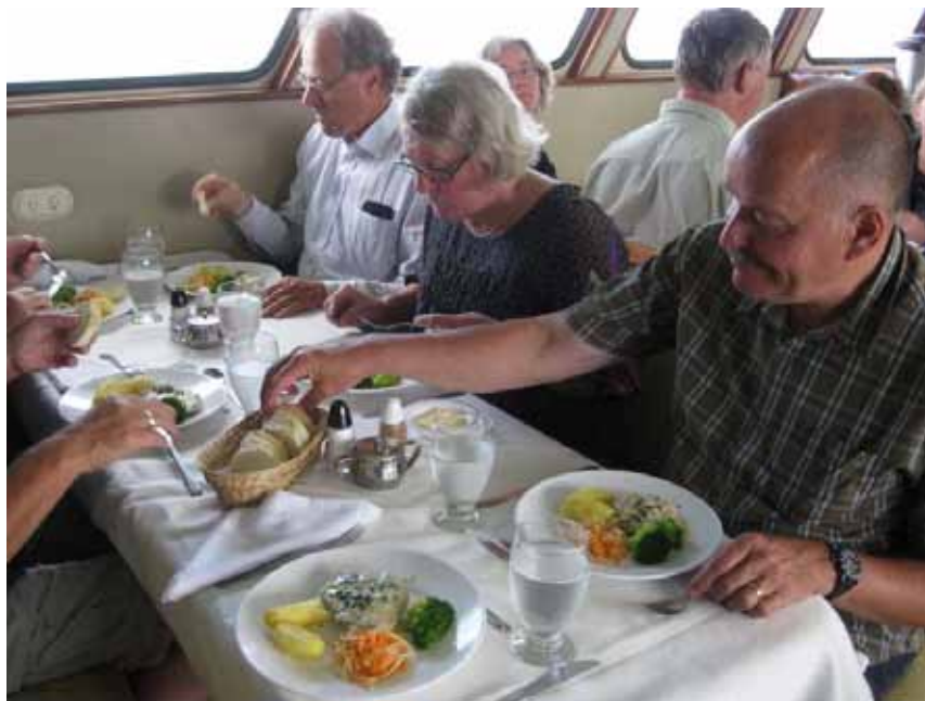
Det var utroligt hvad kokken kunne fremtrylle.

Post Office Bay besøges. Vi bliver dog opholdt af en Pingvin, som "talte" til os. Vores zodiac-driver kendte dens stemme, som han imiterede, og den svarede beredvilligt. Der var bunker af breve i postkassen. De venter på at nye besøgende tager deres brev med hjem og sender det til dem. Flere af os lægger selv et postkort med vores respektive adresser, og håber så at der kommer en turist forbi, og tager kortet med hjem til afsendelse.