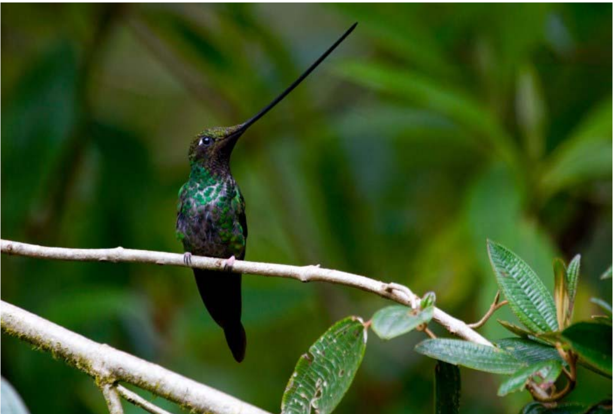
Sword-billed Hummingbird.