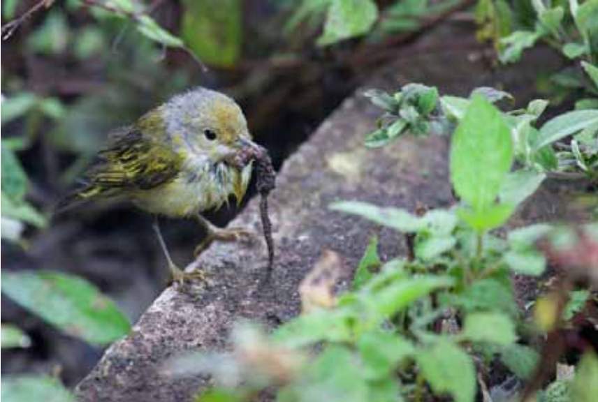
Denne våde Yellow Warbler kæmpede længe for at sluge sit mega-bytte. Los Gemelos, Santa Cruz.