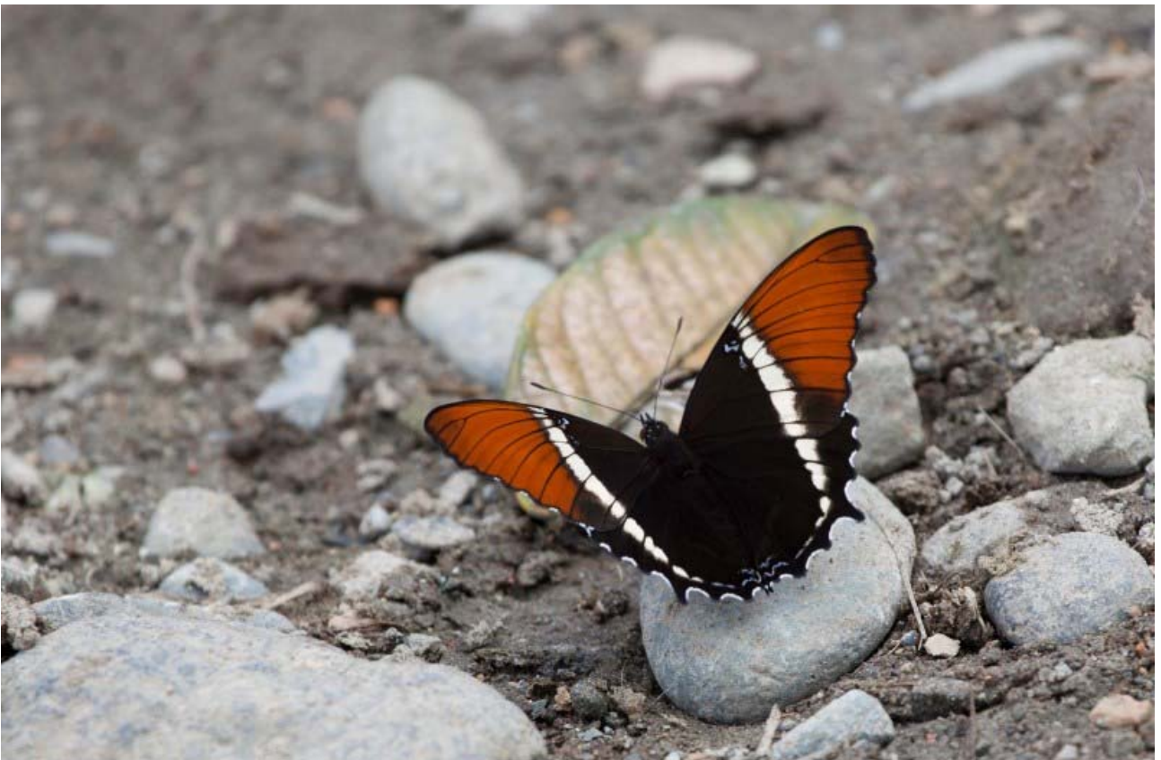
Vi så mange flotte sommerfugle.