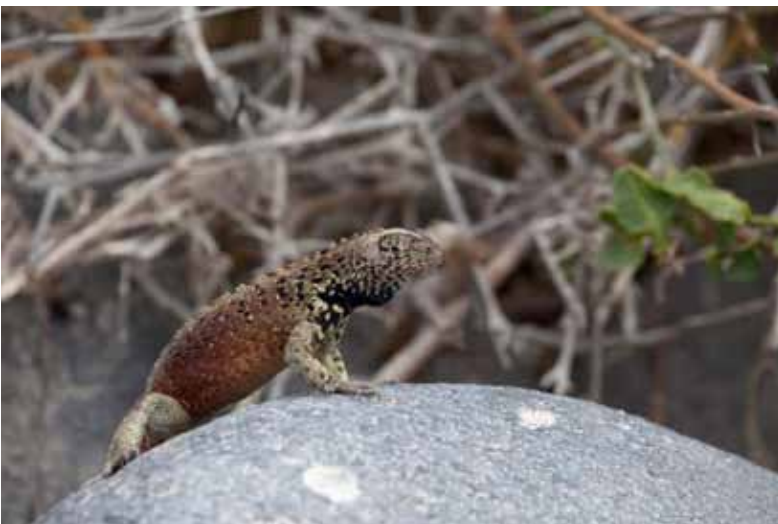
Galapagos Lava Lizard.

Der findes 7 underarter af dette firben. Vi så den 5 af dagene på Galapagos. I alt noteret 270.