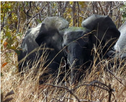
Elefant

Mammals and some reptiles seen on Danish Ornithological Society's Burkina Faso and Ghana tour February 2 nd -14 th 2013.