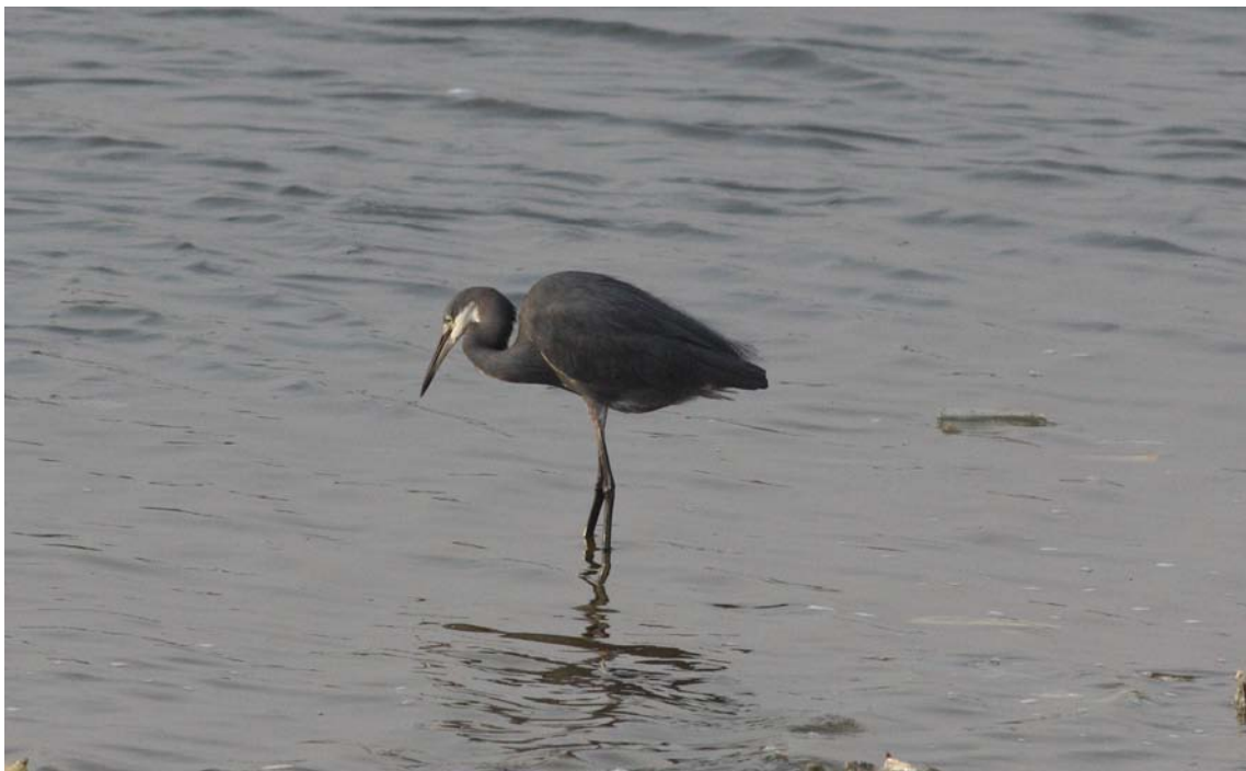
Western Reef Egret