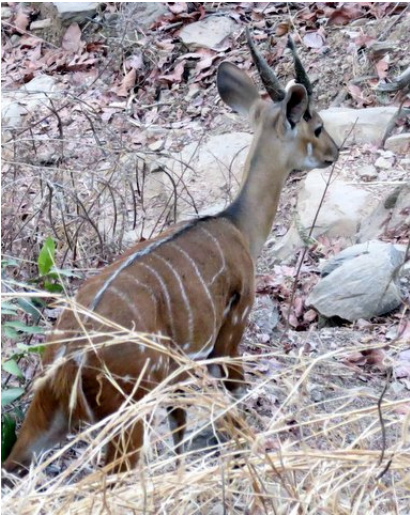
Bushbuck (Hans H. Andersen)

Kob ( Kobus kob ). Common Mole. Flock of approx. 80 seen Shai Hills