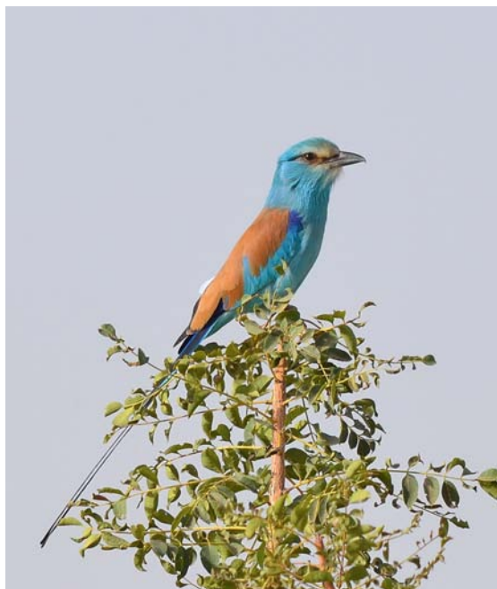
Abyssinian Roller (Alex R.)

Efter en tidlig morgenmad forlod vi vort hotel og kørte mod NØ. Fra bussen sås Grey-rumped Swallow og da vi fandt Piapiac standsede bussen, så fotografene kunne skyde løs. Langs vejen sås Abyssinian Roller , en koloni af White-billed Buffalo Weaver samt Yellow-billed Oxpecker på ryggen af køer.