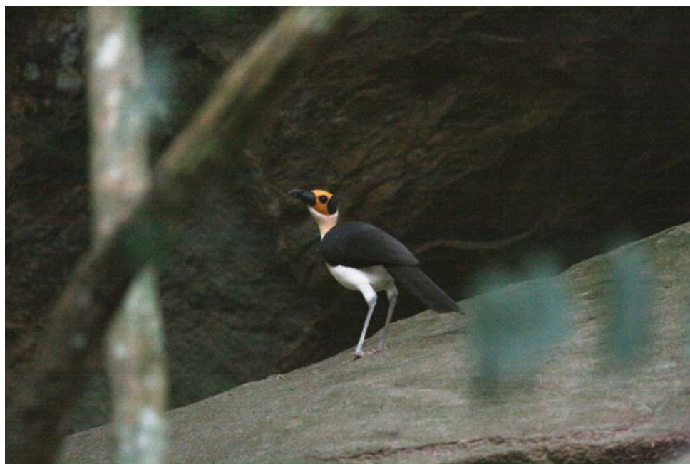
Picathartes ( Mads Elley)

Ved 11 tiden måtte vi desværre forlade Bobiri og køre mod Bonkuro.