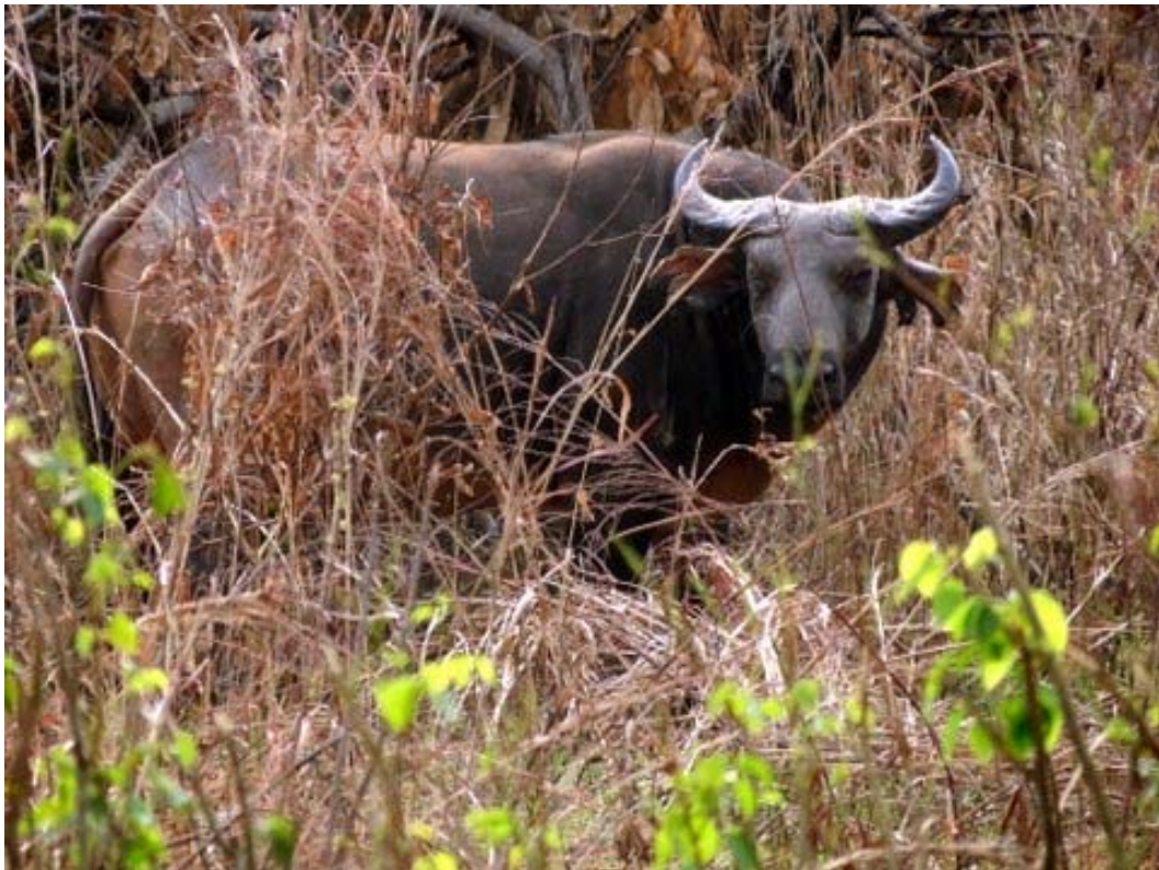
Lake Chad Buffalo (Hans H. Andersen)

Lake Chad buffalo ( Syncerus brachyceros ). 1 female, Mole. A split from Cape buffalo according to Handbook of the Mammals of the World, vol. 2.