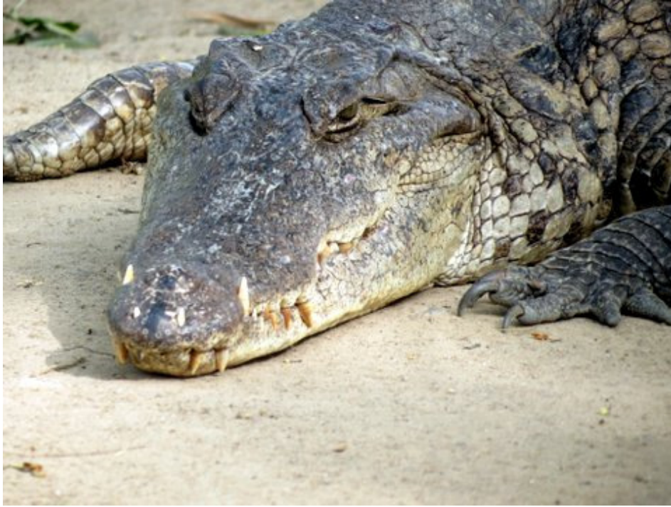
Nile Crocodile (Hans H. Andersen)

Monitor lizard sp. ( Varanus sp. ). A few here and there.