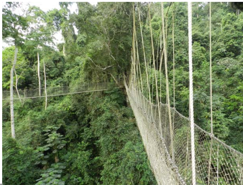
The canopy Walkway

Der er også mulighed for at fuglekikke på stier rundt i skoven, hvor man kan se de arter, der foretrækker at færdes nær skovbunden.