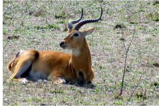
Kob (Hans H. Andersen)

Waterbuck ( Kobus ellipsiprymnus ). A few Mole.