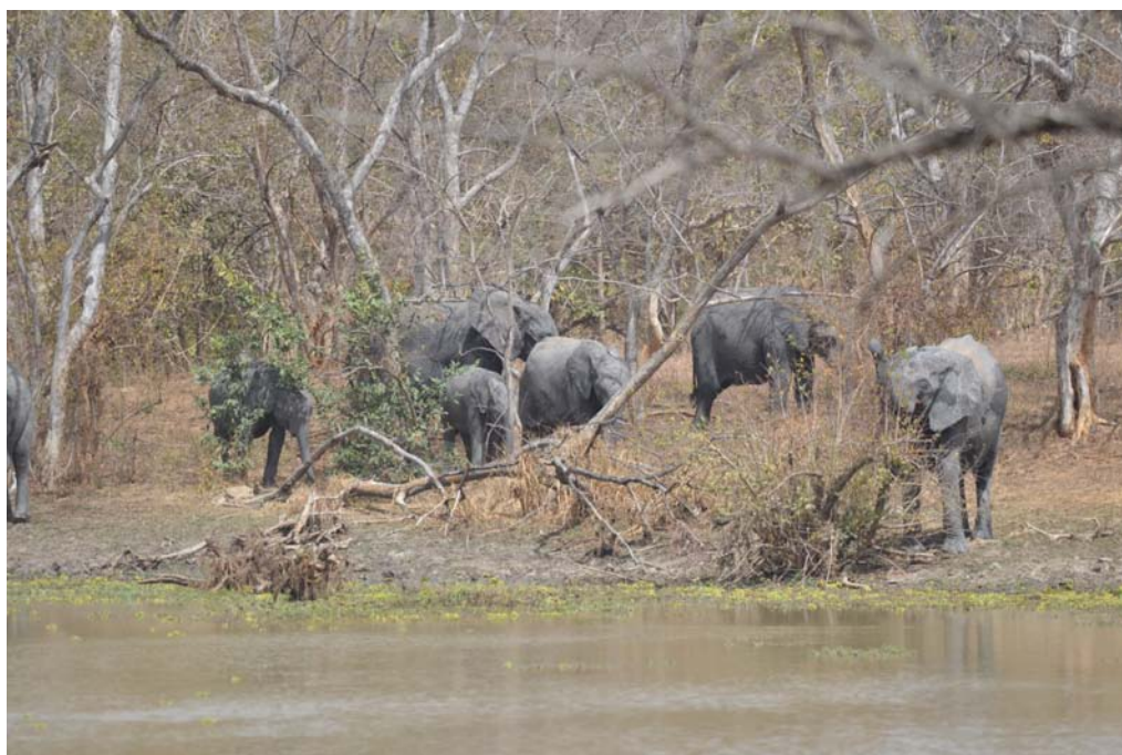
Nazinga's elefanter

Turen gennem parken til hotellet var fuld af stop. Ved et vandhul var der Red-billed og Red-headed Quelea, Red-cheeked Cordon-bleu, Hammerkop, Western Grey Plantain-eater, Olive Baboons og varaner.