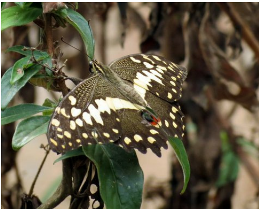
Butterfly (Hans H. Andersen)

Very annoying mosquitoes at the hotel, Ougadougo. Lots of even more annoying small flies in burnt areas. Many beautiful butterflies , Army ants sp. and beetles sp. inside the rain forest.