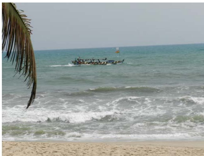
Gulf of Guinea (Alex R.)

Frokosten blev indtaget på Hotel Oase, lige vest for fortet i Cape Coast. Beliggende helt ud til stranden og Guinea bugten dannede det en perfekt ramme til grillede hummere, pizzaer, kolde drinks og havfugle.