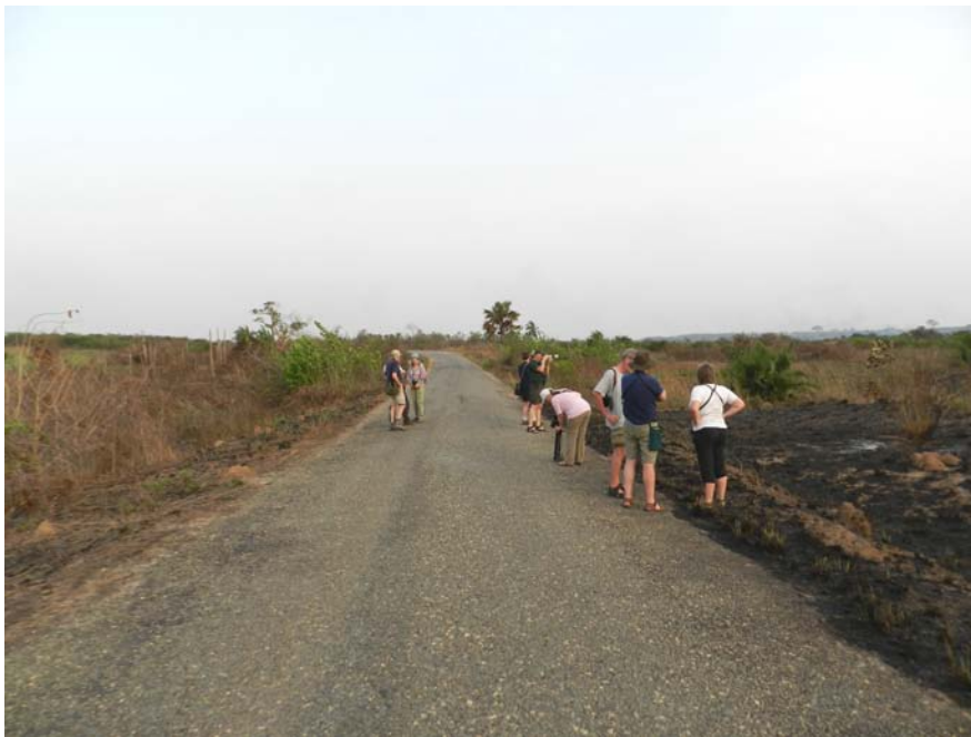
Coastal savanna (Alex R.)

Vi tog en slapper og en kop kaffe ved Hovedkvarterets lille restaurant, inden vi kørte tilbage til Hans Cottage Hotel og pakkede. Vi fik restauranten til at lave en frokostpakke til os og den spiste vi på vej østpå mod Atewa Range. På vejen stoppede vi ved Lilly Point, men desværre var søen ved at blive drænet, så væk er de Små Lappedykkere, Bladhønsene og alt det andet. Trist. Frokosten spiste vi ved Wenniba Plains. Desværre var det midt på dagen og fuglenes aktivitet var lav. Det lykkedes os dog at se Marsh Tchagra og Moustached Warbler .