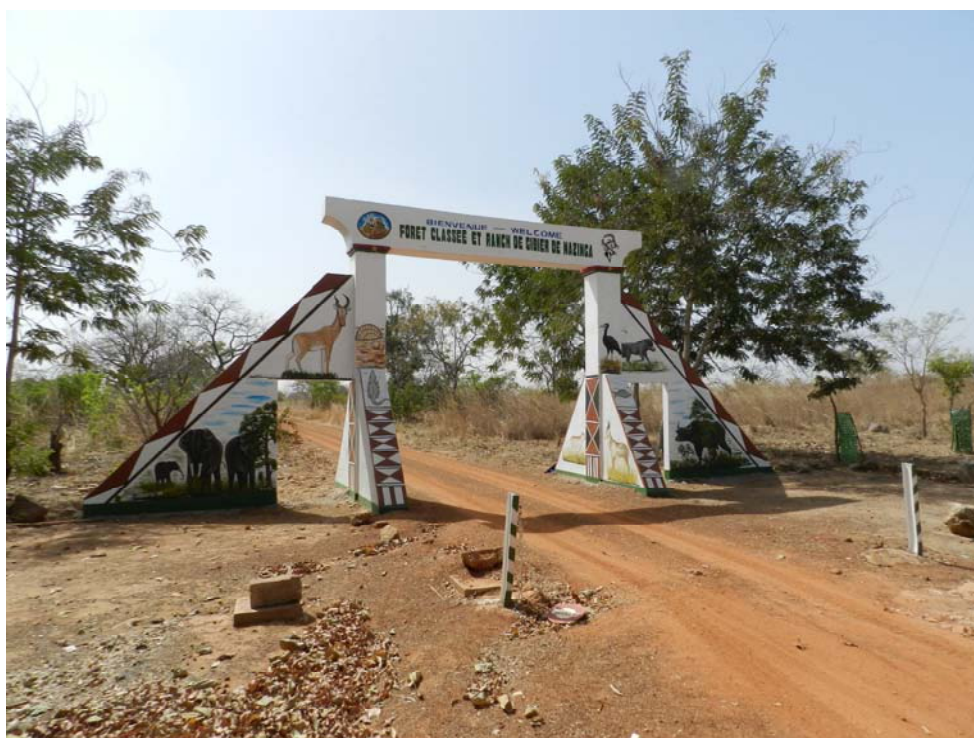
Entrance to Nazinga.

I Nazinga og Burkina Faso så vi adskillige arter, som vi ikke fik set i Ghana. Kan absolut anbefales.