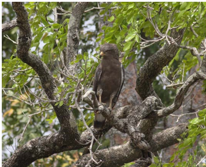
W. banded Snake Eagle