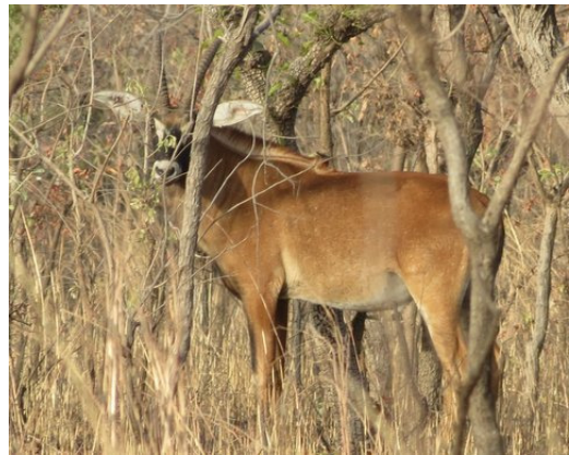
Roan Antelope