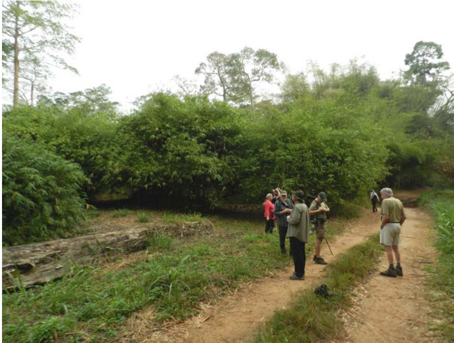
Bobiri Forest reserve

Bobiri er iøvrigt et sommerfuglereservat med op til 425 forskellige sommerfugle