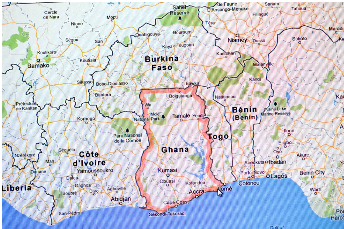
Kort: Udsnit af Vestafrika